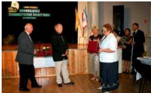
Gratulacje od wójta z okazji 25-lecia Górnśląskiego Stowarzyszenia Diabetyków w Mikołowie.