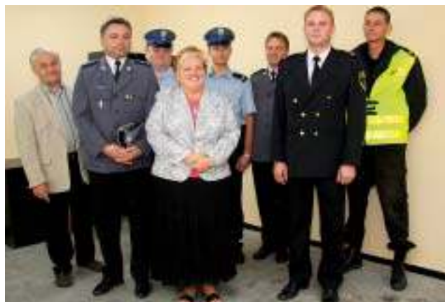
Otwarcie placówki Straży Miejskiej i Policji w Gostyni - czyt. str. 15.