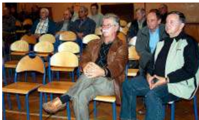
Spotkanie wójta i radnych z mieszkańcami - czyt. str. 10-11.