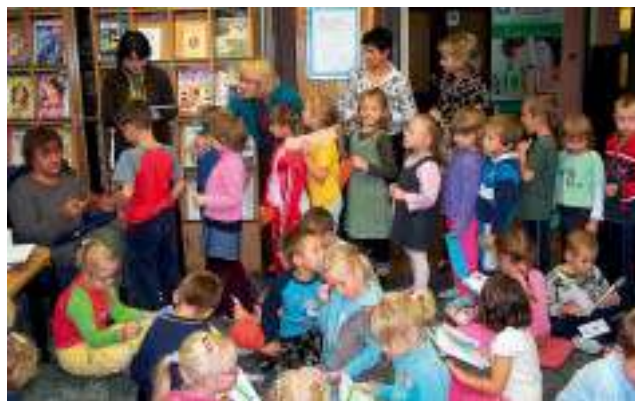
O kocich historiach - czyt. str. 8.