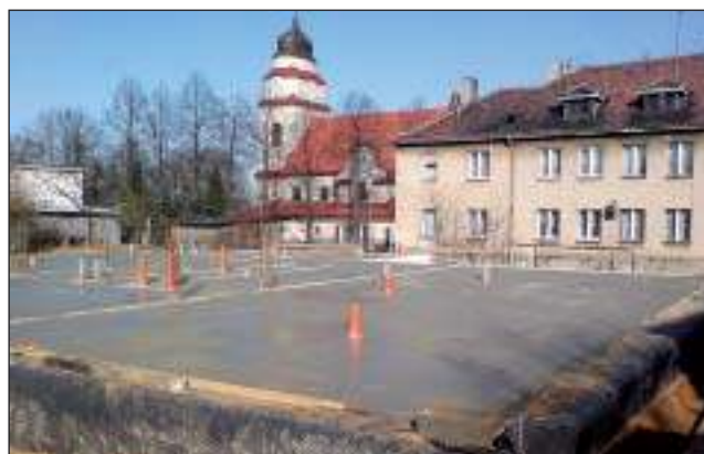
Trwa budowa nowej Przychodni Zdrowia w Wyrach – czyt. na str. 11.