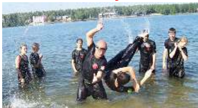
Członkowie Szkoły Sztuk i Sportów Walki „Wojownik” podczas tegorocznego obozu sportowego – Pogoria 2010 - czyt. str. 14.