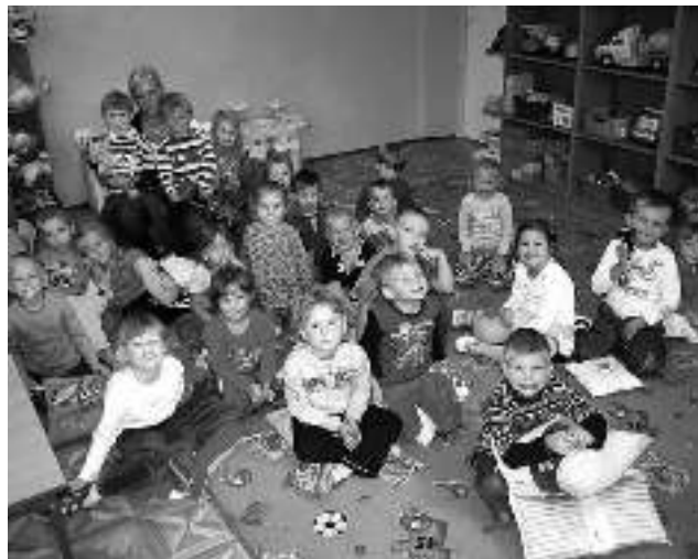
...i sala żółta w wyrskim przedszkolu.