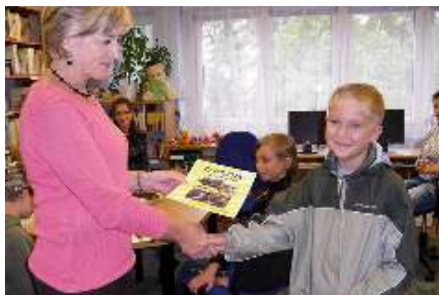
1 września w dwóch gminnych bibliotekach rozstrzygnięto konkurs „Mistrz Czytania” - czyt. str. 12.