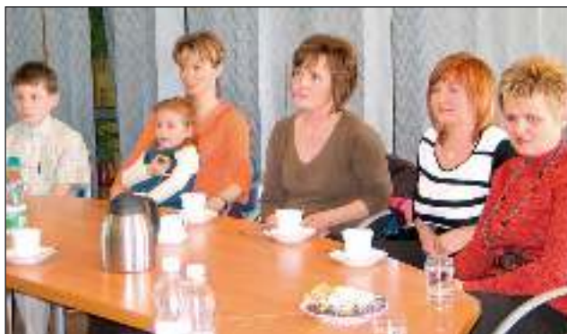
31 marca mamy towarzyszyły swoim pociechom podczas odbioru stypendiów sportowych - czyt. str. 4.