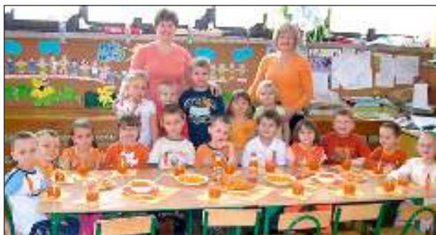
Dzieci z grupy „Kotki” w Gostyrńskim Przedszkolu obchodzili „Dzień Marchewki” - czyt. str. 10.