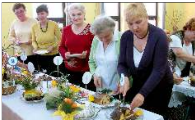
2 kwietnia Klub Kobiet Aktywnych zorganizował konkurs na najsmacz- niejsze i najbardziej świąteczne baby i mazurki wielkanocne - czyt. str. 14.