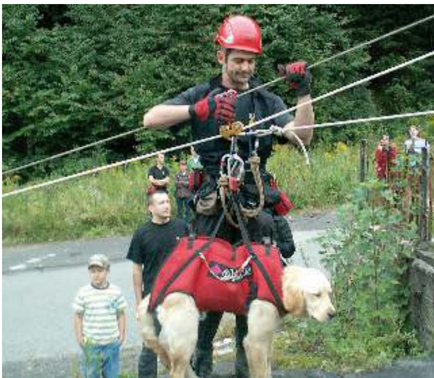
Podczas szkolenia psa.

- Ratowanie życia ludzkiego jest dla mnie najważniejsze. Robię to, o czym zawsze marzyłem. Nie oczekuję niczego w zamian. Ludzkie życie jest bezcenne, dlatego nigdy nie wyłączam telefonów. Ja i pies jesteśmy gotowi do podjęciach działań przez całą dobę – dodaje na zakończenie.