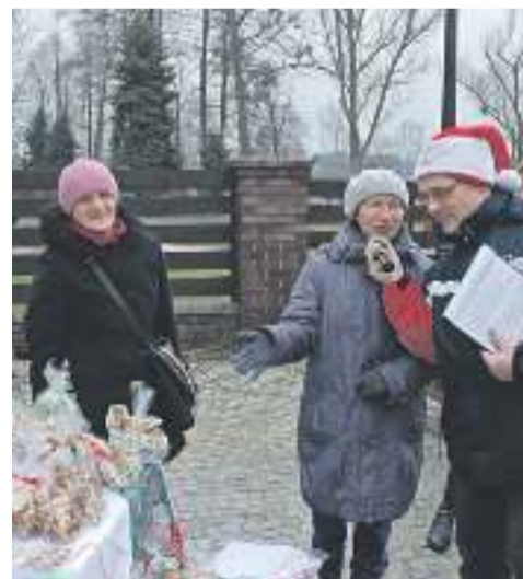
Swoje wyroby oferowała m.in. Stowarzyszenie "Siloe" z Mikołowa