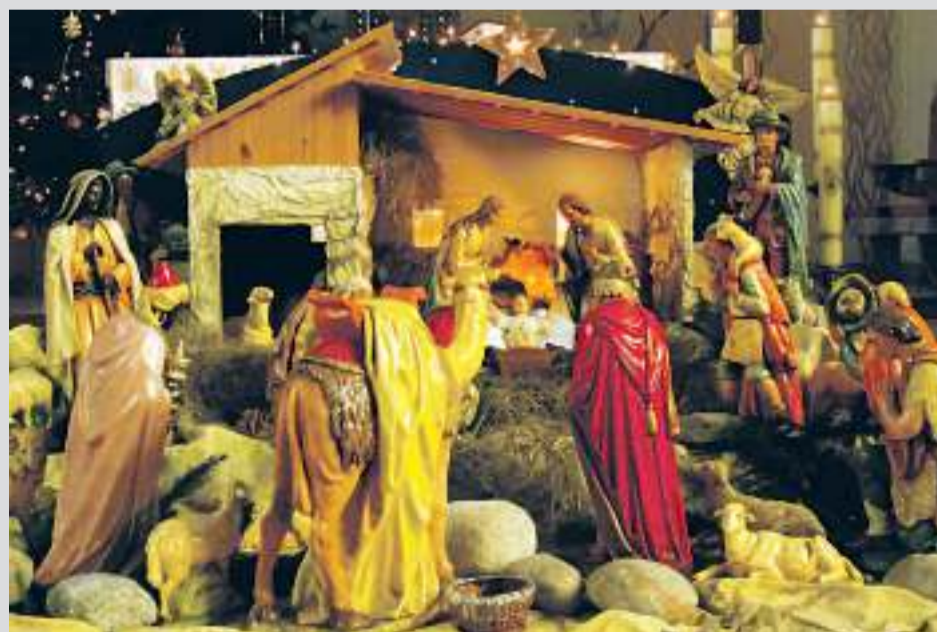
Parafia św. Apostołów Piotra i Pawła w Gostyni