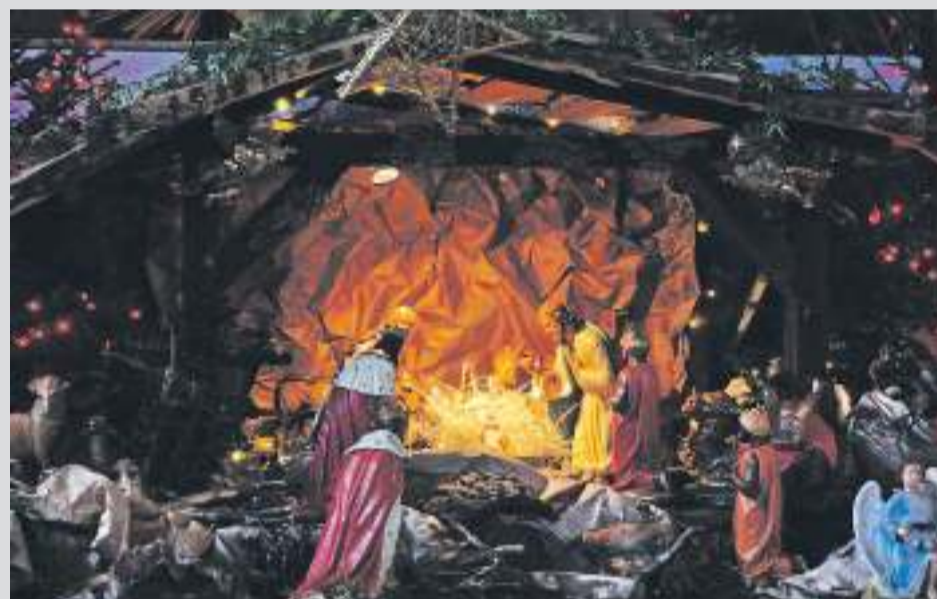
Parafia Podwyższenia Krzyża Św. w Gostyni