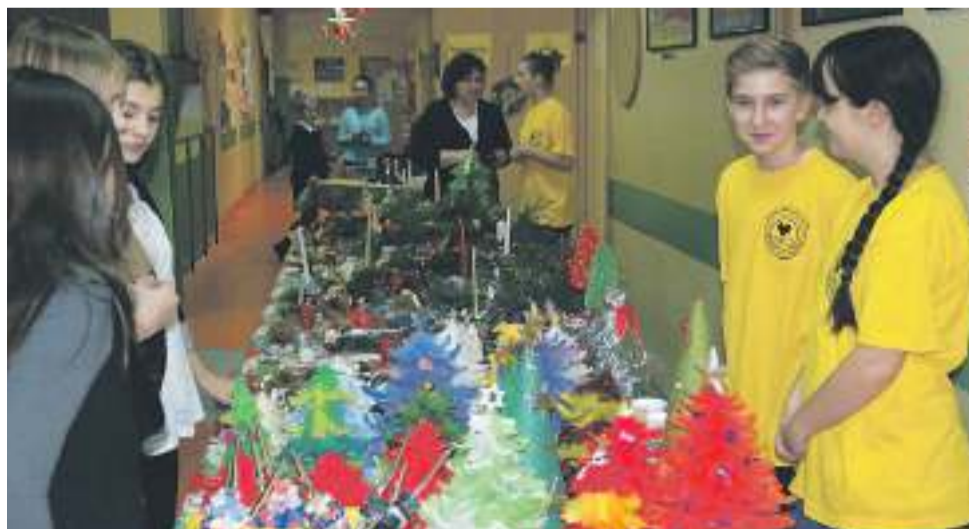
Wolontariusze ze Szkolnego Wolontariatu „Serce na dłoni”