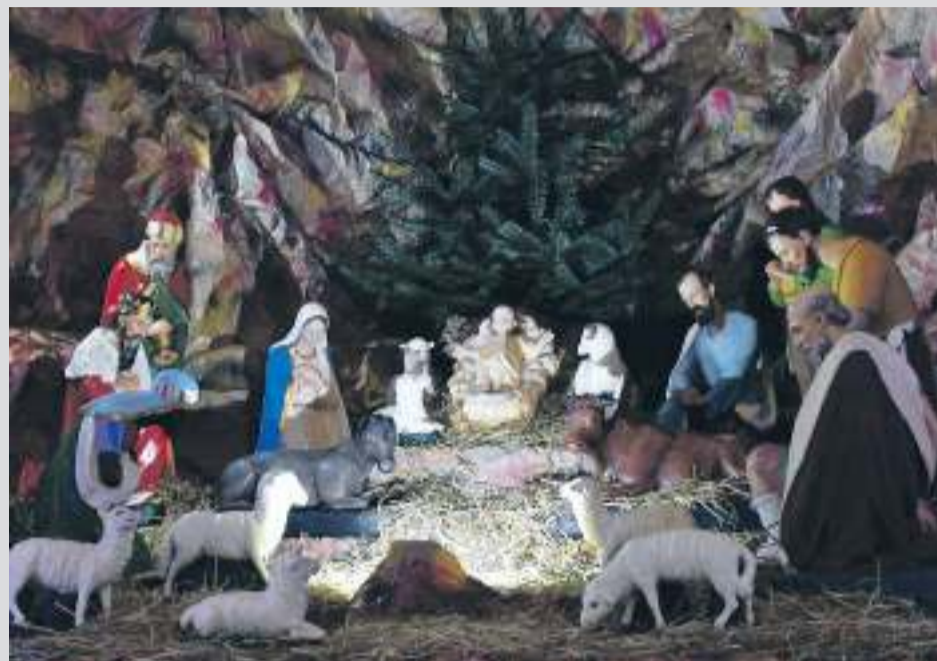
Parafia Najświętszego Serca Pana Jezusa w Wyrach