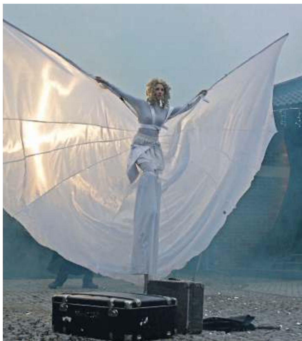
Występ grupy „Locomotor”