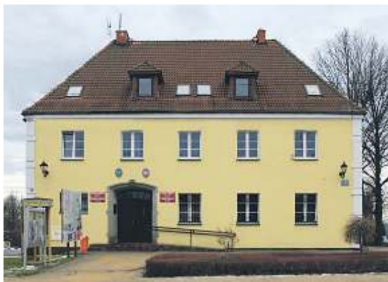
Urząd Gminy Wyrach ul. Dąbrowszczaków 133 43-175 Wyrach tel. (32) 325 68 00 fax. (32) 325 68 09 e-mail: urzad@wyrach.pl