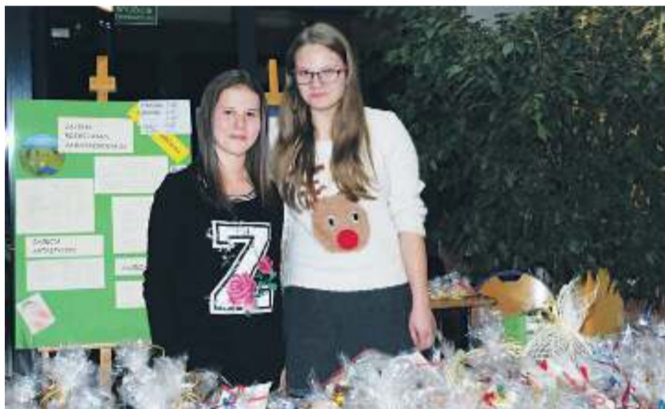
Przy stoiskach pomagały uczennice Gminazjum z Zespołu Szkół w Wyrach