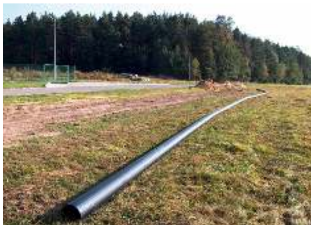
Kanalizacja Gostyń - 4 - w rejonie oczyszczalni ścieków

Gmina Wyry w maju 2010 r. wystąpiła z wnioskiem do Wojewódzkiego Funduszu Ochrony Środowiska i Gospodarki Wodnej w Katowicach o dofinansowanie zadania pn. „Budowa kanalizacji sanitarnej ciśnieniowej wzdłuż ul. Tyskiej i Pszczyńskiej od SW 24 do SW 11 oraz ul. Fityki w miejscowości Gostyń”. Planowana długość tego etapu kanalizacji wynosi ok. 6 km. Koszt całości zadania wynosi 3.135.000 zł, natomiast kwota wnioskowana to 2.000.000 zł (w formie przyznania pożyczki na preferencyjnych warunkach ze środków WFOŚ i GW). Planowane rozpoczęcie prac w październiku 2010 r. jest uwarunkowane otrzymaniem środków WFOŚ i GW w terminie.