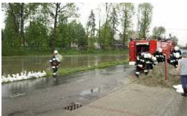
10 maja rzeka Gostynka wylała ze swojego koryta – czyt. str. 13.