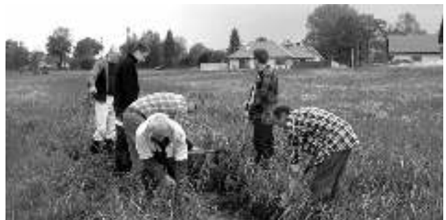
Na zdjęciach nieliczna grupa, która akurat miała swoją „zmianę”.