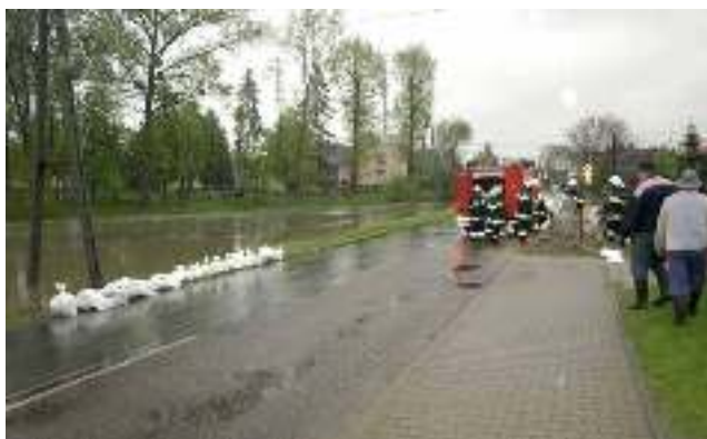
Strażacy z OSP Gostyń uszczelniają ul. Rybnicką w okolicy ośrodka zdrowia