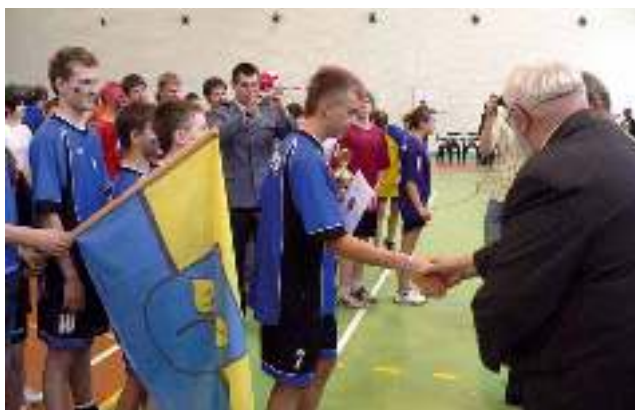
Uczniowie Gimnazjum z Gostyni zajęli III miejsce w programie „Potrafię kibicować – Euro 2012” – czyt. str. 15.