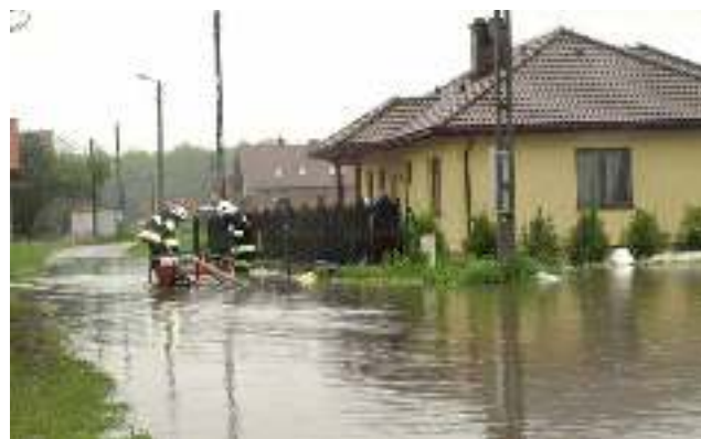
Strażacy z OSP Gostyń wypompowują wodę z ul. Motyla (bocznej).