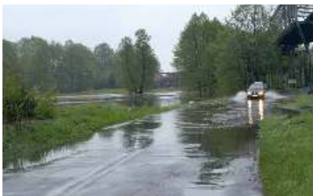
Ul. Rybnicka na wysokości stawu Barć (staw wylał i przelewał się na drugą stronę ulicy)