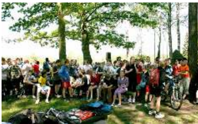
Uczestnicy i kibice VII Gminnego Biegu Przelajowego – czyt. str. 14.