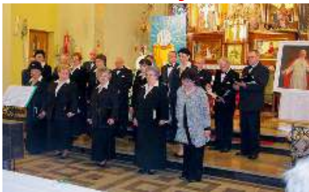
Chór Zorza wystąpił 16 maja w kościele p.w. Matki Bożej Królowej Różańca Świętego w Łaziskach Górnych podczas niesporów koncertowych „Totus Tuus”.