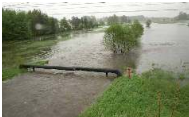
Widok na Gostynkę z mostu na ul. Pszczyńskiej.