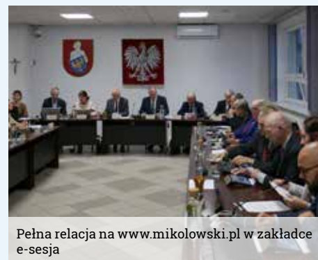
Pełna relacja na www.mikolowski.pl w zakładce e-sesja

Po dłuższej dyskusji, w której wskazywano zarówno na odmienne dane dotyczące liczby porodów jak i wysokości zadłużenia szpitala pojawiające się w przestrzeni publicznej, dalsze decyzje pozostawiono w gestii Zarządu Powiatu.