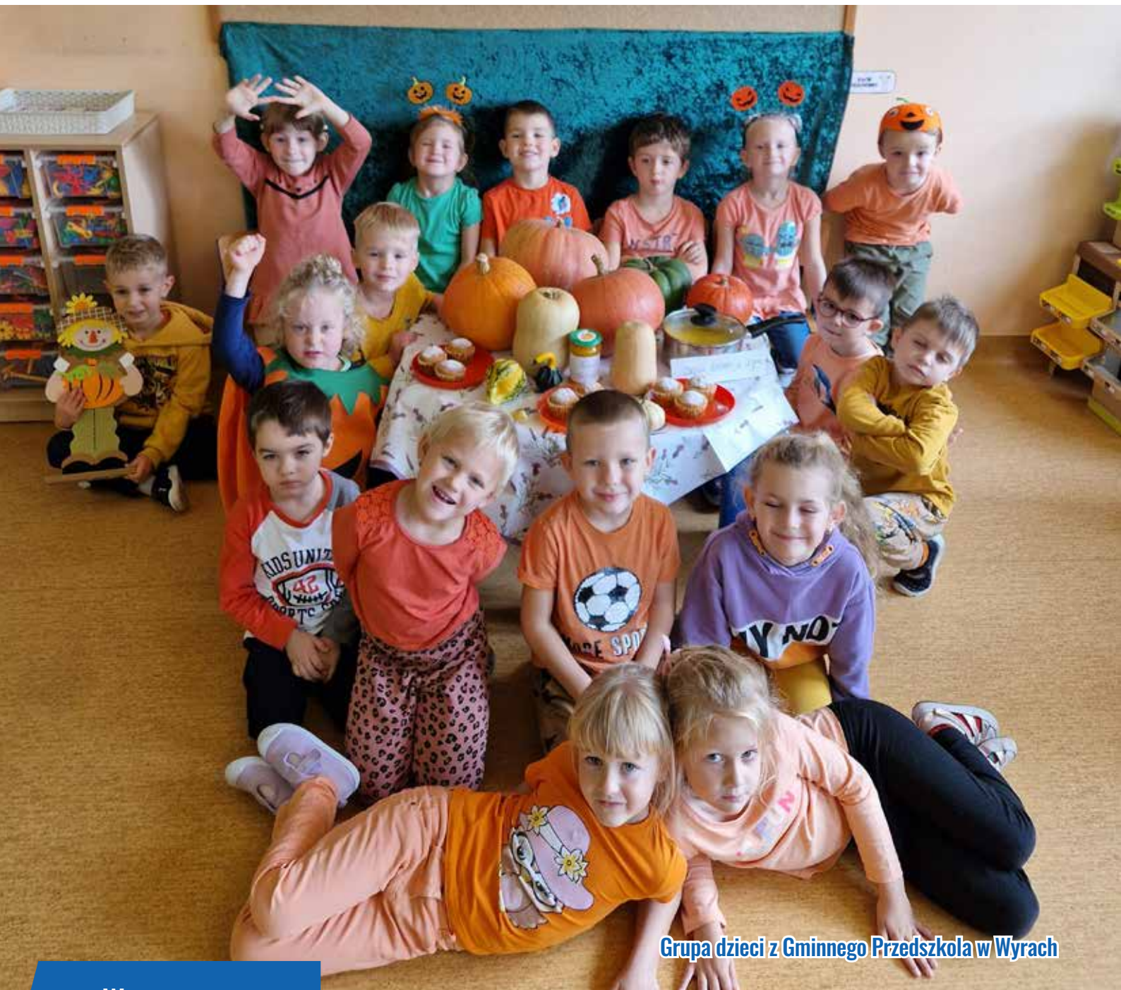
Grupa dzieci z Gminnego Przedszkola w Wyrach