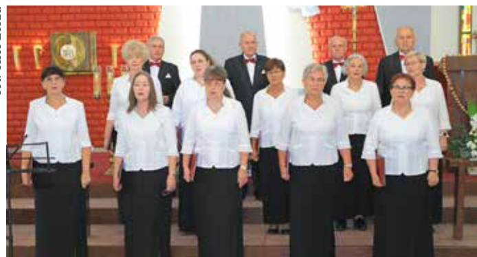
Chór Zorza podczas Koncertu Maryjnego chórów Okręgu Mikołowskiego Śląskiego Związku Chórów i Orkiestr