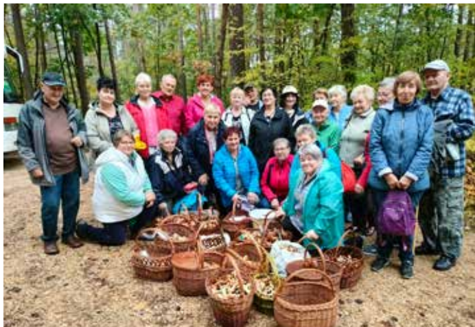
Pogoda w tym roku dopisała, co przełożyło się na wspaniałe zbiory