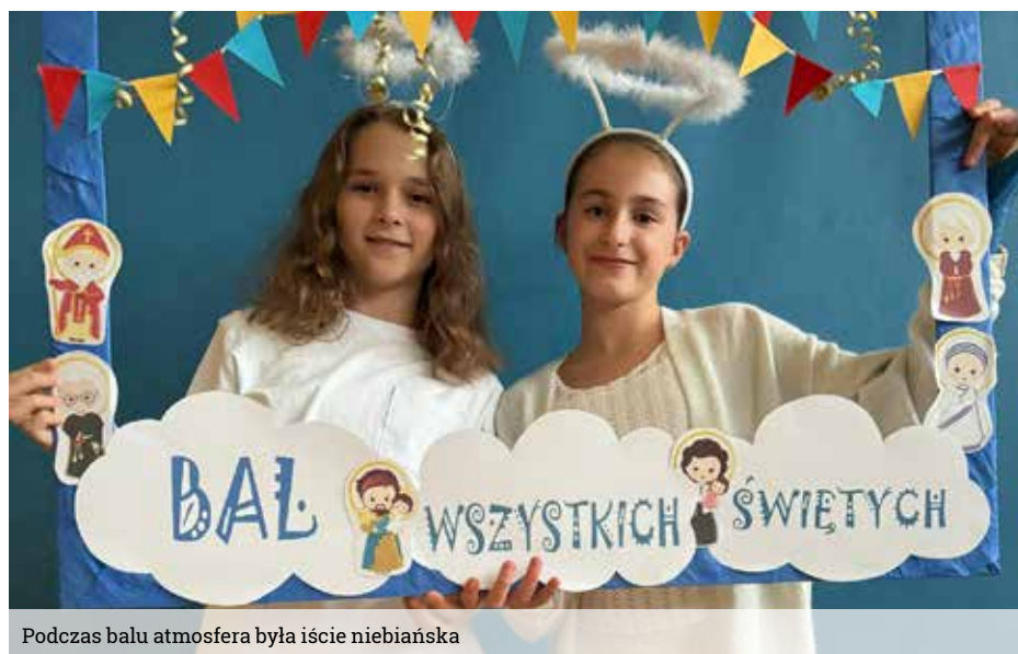
Podczas balu atmosfera była iście niebiańska