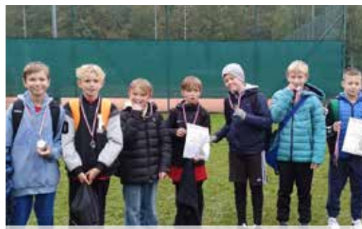
Mimo trudnych warunków pogodowych i rywalizacji w deszczu, zawodnikom nie brakowało zaangażowania i woli walki, a rywalizacja była zacięta,