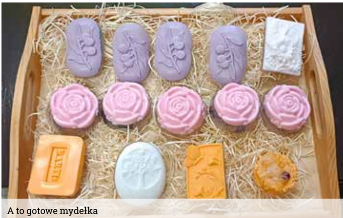
A to gotowe mydełka