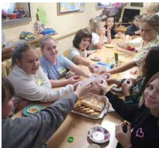
Podczas urodzin świetlicy wszystkie słodkości zniknęły w okamgnieniu