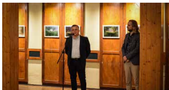
Fotografia krajobrazowa, przyrodnicza, architektury i czarno-biała jest podstawową formą wypowiedzi autora