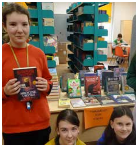
Szkolna biblioteka w Wyrach zrealizowała bardzo nietypowy pomysł na wystawę – „Straaaaasznie fajne książki”