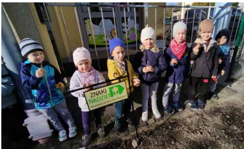
Przedsiębiorcy sadzą cebulki żonkili przy Gminnym Przedszkolu w Wyrach

Na początku roku szkolnego 2024/2025 została podsumowana akcja Znaki Nadziei 2023/2024, zainicjowana przez Hospicjum Św. Ojca Pio w Pszczynie. Wzięło w niej udział 27 placówek edukacyjnych. Po zapoznaniu się z dokumentacją przebiegu akcji w każdej placówce oraz biorąc pod uwagę zawarte w regulaminie kryteria oceny, komisja hospicjum św. Ojca w Pszczynie przyznała Gminnemu Przedszkolu w Gostyni Złoty Znak Nadziei. Było to możliwe dzięki zaangażowaniu całej przedszkolnej społeczności.