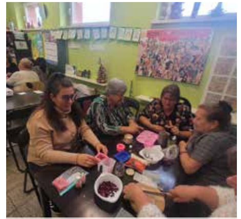
W ramach działań projektowych odbyły się między innymi warsztaty produkcji glicerynowych mydełek