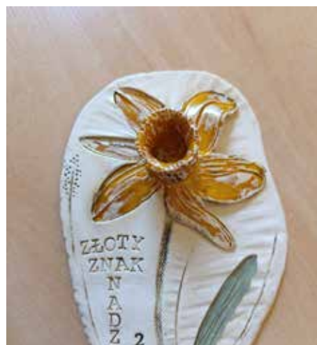
W tym roku, po raz kolejny przedszkole w Gostyni chce wesprzeć podopiecznych hospicjum i tym samym pokazać dzieciom jak ważne jest pomaganie