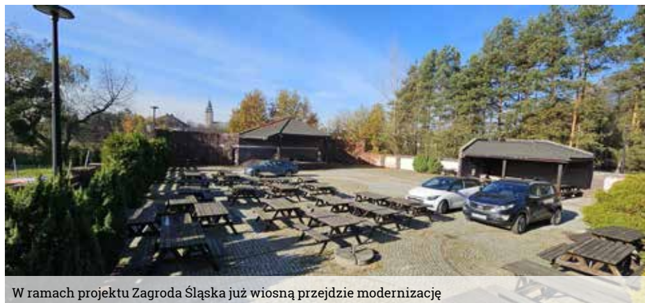
W ramach projektu Zagroda Śląska już wiosną przejdzie modernizację