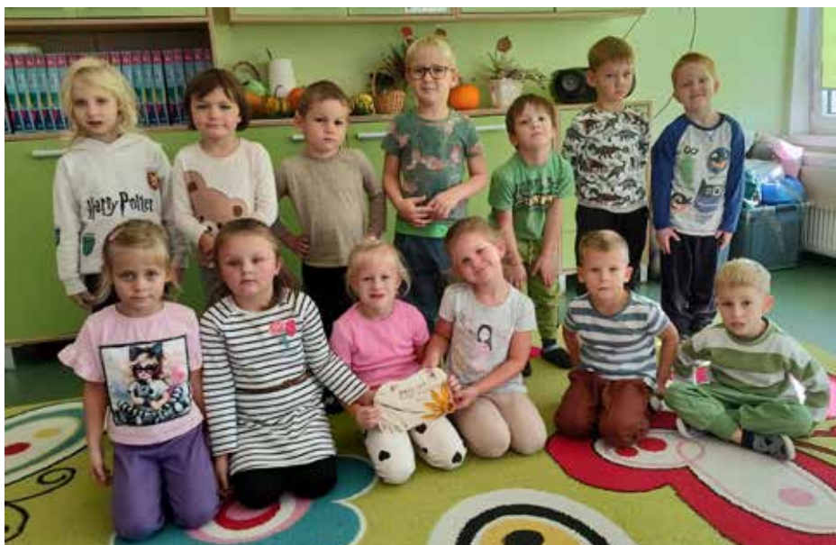
Brązowy Znak Nadziei 2024 Hospicjum Św. Ojca Pio w Pszczynie dla Gminnego Przedszkola w Wyrach