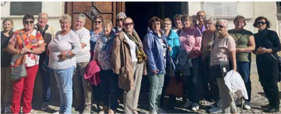
Tym razem seniorzy z Wyr wybrali się do zamku w Bielsku-Białej