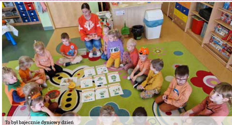
To był bajecznie dyniowy dzień