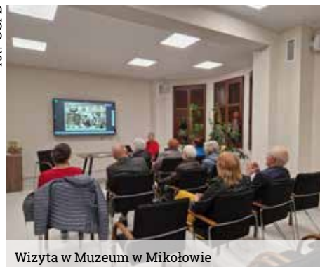
Wizyta w Muzeum w Mikołowie

przez kolegów. Bajka ta porusza ważny problem akceptacji i tolerancji w grupie rówieśniczej. Nie można nikogo oceniać patrząc tylko na to jak wygląda albo czy ma jakiś defekt. Trzeba zajrzeć głębiej i dowiedzieć się więcej o danej osobie. Bo każdy z nas posiada jakieś niezwykle zdolności i może ubogacić nimi drugą osobę. Historia Uli ma jednak pozytywne zakończenie. Stając się bohaterką szkoły, za sprawą znalezionej jaszczurki i kapelusza, jej problemy z rówieśnikami mijają. W drugiej części spotkania, świętowaliśmy Świątowy Dzień Uśmiechu, robiąc wesołe Ordery Uśmiechu.