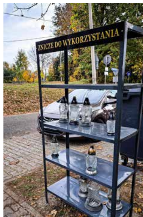
Półka na znicze do ponownego użycia znajduje się przy wyrskim cmentarzu komunalnym przy ul. Słonecznej