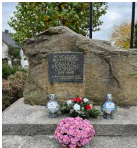
Obelisk upamiętniający poległych za wolność w Wyrach w latach 1919-1945