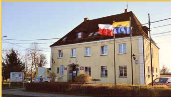
Urząd Gminy Wyrzy, ul. Główna 133, 43-175 Wyrzy Tel. (32) 325 68 00