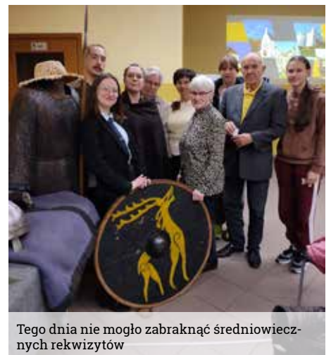
Tego dnia nie mogło zabraknąć średniowiecznych rekwizytów