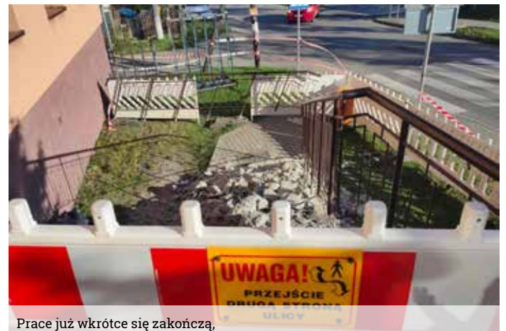
Prace już wkrótce się zakończą,