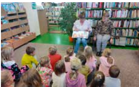
Spotkanie w ramach cyklu „Książka łączy pokolenia”

W połowie miesiąca odbyło się międzypokoleniowe spotkanie w ramach cyklu „Książka łączy pokolenia”. Dzieci z grupy Pszczółek wysłuchały bajki Agaty Widzowskiej „Babcia i Dziadek dają radę!”. Rymowana opowieść przedstawia relacje dziadków (również tych „przyszywanych”) z wnuczętami, poprzez wspólne spędzanie czasu, pielęgnowanie rodzinnych więzi oraz wspomnień. Na bazie poznanej historii rozmawialiśmy z przedszkolakami o ich dziadkach i pomysłach na wspólne spędzanie czasu. W drugiej części zajęć, nawiązując do Światowego Dnia Mycia Rąk mówiliśmy o tym, jak ważne jest mycie rąk i kiedy szczególnie powinniśmy to robić. Zrobiliśmy również pamiątkowy plakat z hasłem „Czyste ręce mam, bo o zdrowie dbam!”