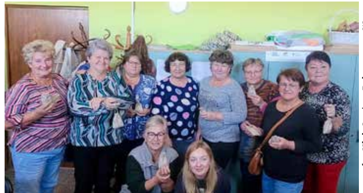
Seniorki prezentują własnoręcznie wykonane lniane woreczki – zawieszki zapachowe