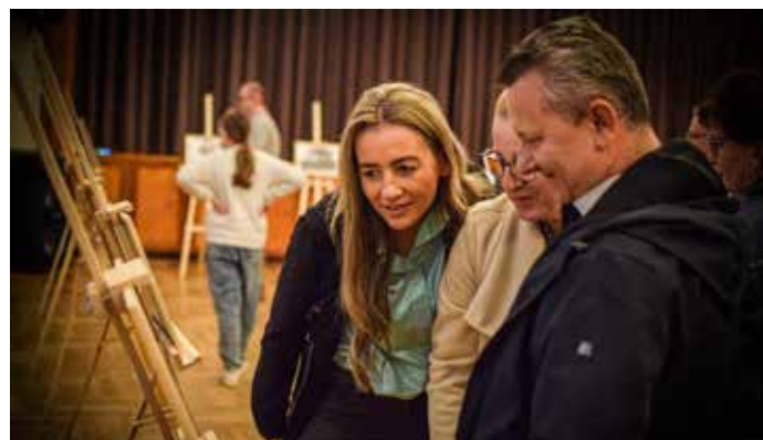
Otwarcie wystawy przyciągnęło wielu mieszkańców gminy Wyry, przyjaciół i najbliższych autora