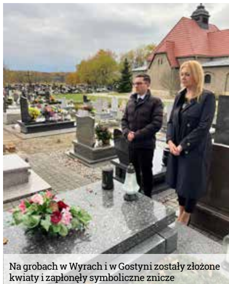
Na grobach w Wyrach i w Gostyni zostały złożone kwiaty i zapalony symboliczne znicze