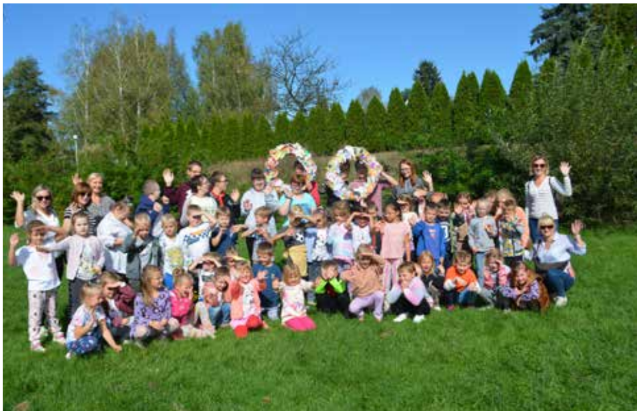
Przedszkolaki podczas wizyty w ośrodku bawiły się wspaniale i czuły się bardzo swobodnie