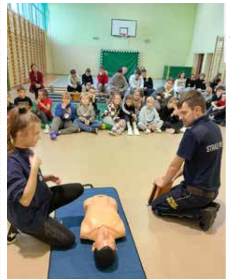
Warsztaty pierwszej pomocy przedmedycznej przeprowadzili strażnicy miejscy z Łazisk Górnych