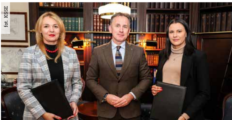
Współpraca z Katowicką Specjalną Strefą Ekonomiczną ma na celu poszerzenie możliwości inwestycyjnych w gminach regionu wspierając tym samym rozwój lokalnej przedsiębiorczości i gospodarki