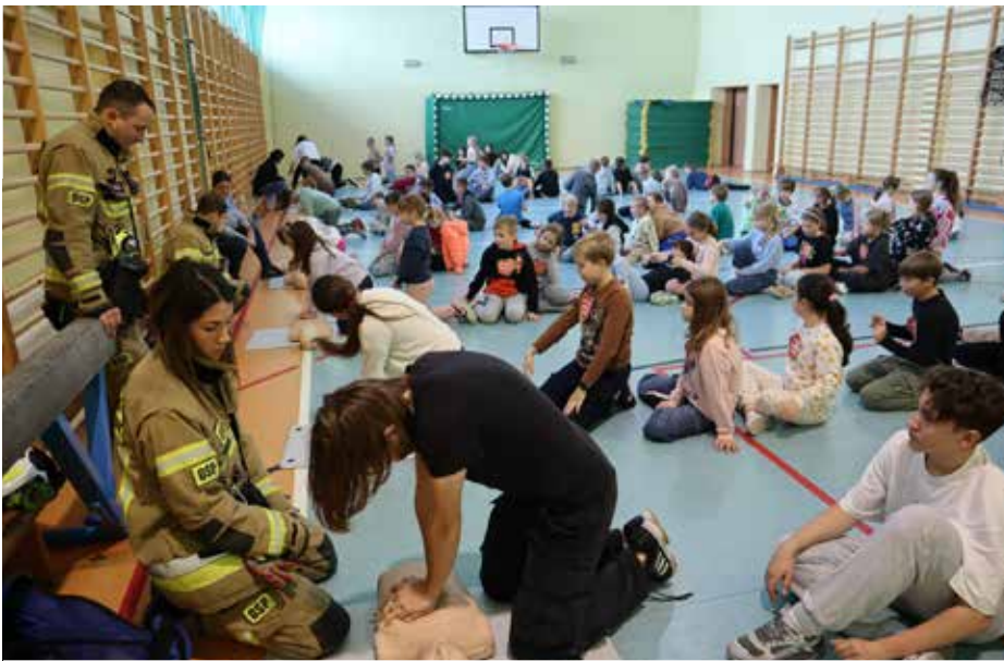
Uczniowie prowadzili akcję w rytmie utworu „Stayin' Alive” zespołu Bee Gees, którego tempo idealnie pokrywa się z tempem wykonywania masażu serca

Uczniowie Szkoły Podstawowej w Wyrach wzięli udział w Programie Edukacyjnym „Ratujemy i Uczymy Ratować”, organizowanym przez Fundację WOŚP. Dzięki niemu dzieci mają szansę nauczyć się pierwszej pomocy.