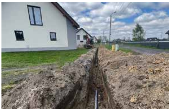
W ramach inwestycji wybudowano prawie 12 km sieci kanalizacyjnej i zabudowano 220 pompowni

W Gminie Wyry zakończono budowę kolejnego odcinka kanalizacji sanitarnej ciśnieniowej w Gostyni. W ramach inwestycji wybudowano prawie 12 km sieci kanalizacyjnej i zabudowano 220 pompowni w rejonie ul. Motyla, Drzymały, Dębowa, Kłosa, Obrońców Ziemi Śląskiej, Rybnickiej, Lipo-