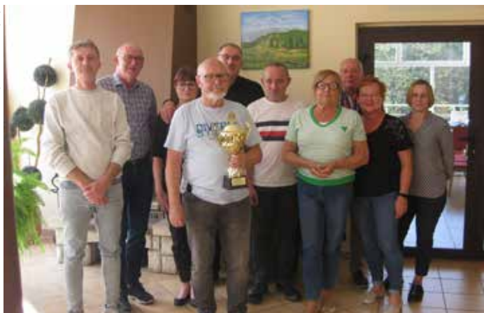
Zawodnicy wraz z wspierającymi żonami