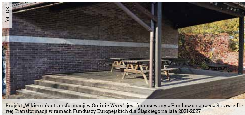
Projekt „W kierunku transformacji w Gminie Wyrzy” jest finansowany z Funduszu na rzecz Sprawiedliwej Transformacji w ramach Funduszy Europejskich dla Śląskiego na lata 2021-2027