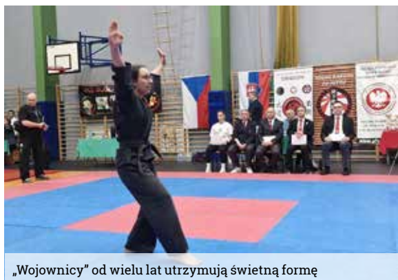
„Wojownicy” od wielu lat utrzymują świetną formę

Z początkiem października, reprezentacja Szkoły Sztuk i Sportów Walki Wojownik wzięła udział w IBF Open European Championship, które odbywały się w holenderskim Almere, niedaleko Amsterdamu. Oprócz Wojownika, który był jedynym klubem z Polski na tych zawodach, swoje reprezentacje wystawiły również Holandia, Niemcy, Belgia, Ukraina, Kazachstan i Uzbekistan. Rozgrywane konkurencje były rozłożone na dwa dni.