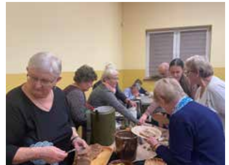
Wyjątkowym zakończeniem projektu była średniowieczna uczta