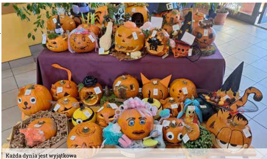
Każda dynia jest wyjątkowa

Z końcem października, w Szkole Podstawowej w Wyrach, obchodziliśmy Szkolny Tydzień z Dynią – czas pełen kolorów, smaku i jesiennego klimatu.