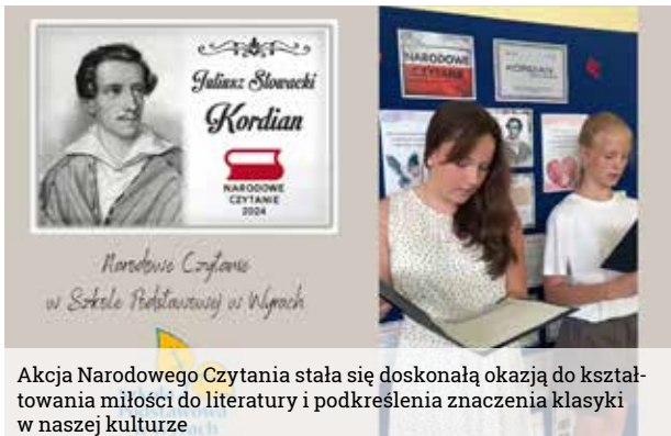
Akcja Narodowego Czytania stała się doskonałą okazją do kształtowania miłości do literatury i podkreślenia znaczenia klasyki w naszej kulturze