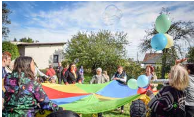
Podczas pikniku wszyscy bawili się znakomicie

Grupa nieformalna Otwarte Serca zaprosiła dzieci wraz z ich opiekunami na piknik integracyjny kończący realizację projektu „Rękawice Miłości”. Ta międzypokoleniowa zabawa i integracja odbyła się w ramach konkursu Śląskie