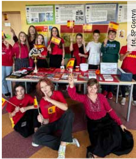
Jedno ze stoisk przedstawiających kraje Europy

muzyczne ukazujące piękno europejskich języków. Było dużo śmiechu i zabawy, ale przede wszystkim nauki. Uczniowie nie tylko udowodnili, że bardzo dobrze znają Europę i jej mieszkańców, ale również potrafili współpracować w grupie, rozwijając kreatywność i samodzielność. A oto wyniki konkursów.