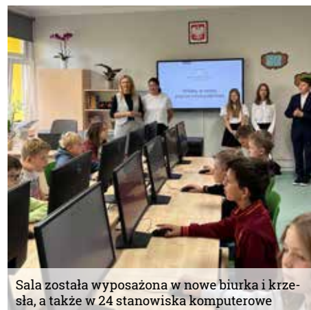
Sala została wyposażona w nowe biurka i krzesła, a także w 24 stanowiska komputerowe

tor Irenę Piszczek miałam niezwykłą okazję zobaczyć nowoczesną pracownię i sprawdzić, czy wszystko w niej działa. A jeśli uczniowie