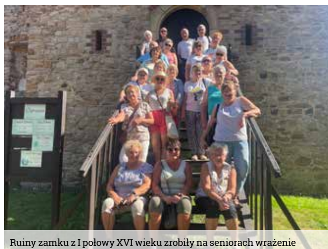
Ruiny zamku z I połowy XVI wieku zrobiły na seniorach wrażenie