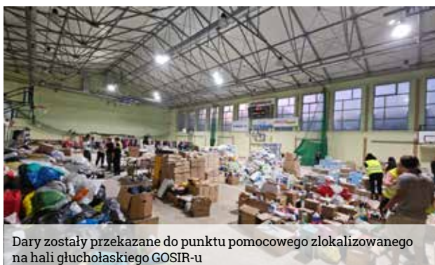
Dary zostały przekazane do punktu pomocowego zlokalizowanego na hali głuchołaskiego GOSIR-u