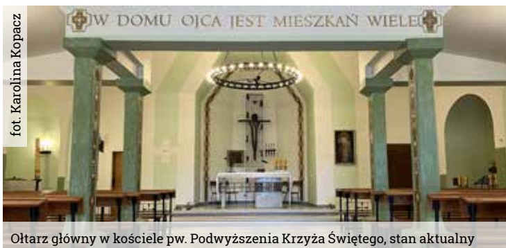
Ołtarz główny w kościele pw. Podwyższenia Krzyża Świętego, stan aktualny

budynku wykonano cokół w części niższej, dostosowując go do już istniejącego, znajdującego się wokół wyższej części obiektu. Wykonawcą prac była firma Bratex z Ćwiklic. Łączny koszt robót wyniósł 496 200 zł,