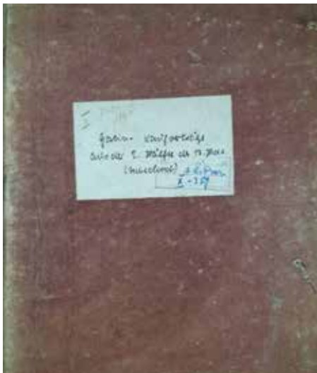
Oryginalna księga z XVII wieku znajduje się w archiwum w Katowicach