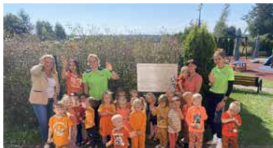
Sportową rozgrzewkę poprowadzili trenerzy klubu SKS Fortuna Wiry

Przedsiębiorcy z Gminnego Przedszkola w Wyrach, 20 września świętowały Ogólnopolski Dzień Przedszkolaka. Najmłodszy mieszkańcy naszej gminy, uczęszczający do starego przedszkola mieli zorganizowane Piżama Party. W tym dniu chętne dzieci mogły przyjść do przedszkola ubrane w piżamkę i zabrać ze sobą swoją ulubioną poduszkę.