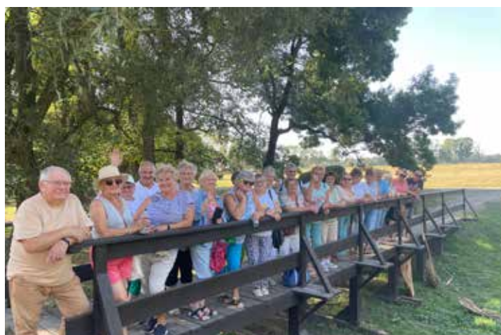
Seniorzy zjedli śniadanie w pięknych okolicznościach przyrodniczo-architektonicznych