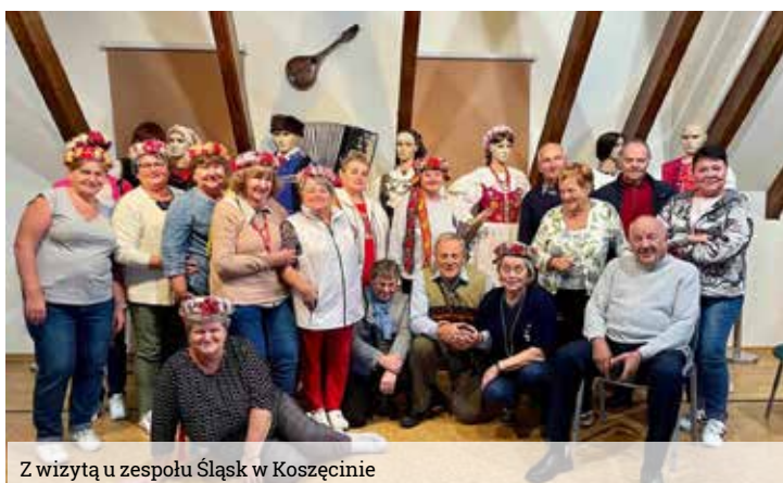
Z wizytą u zespołu Śląsk w Koszęcinie