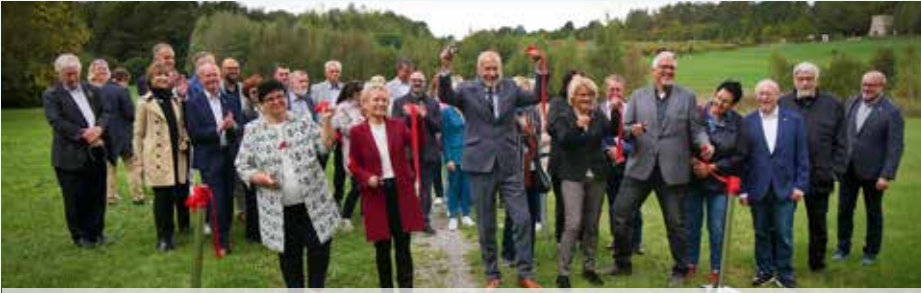
Symbolicznego przecięcia wstęgi dokonali przedstawiciele władz obu powiatów partnerskich