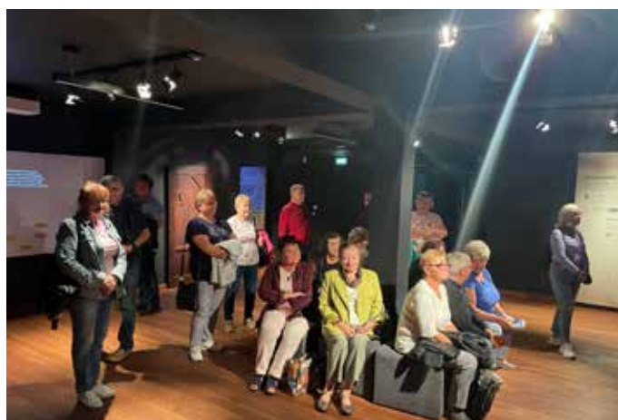
Wystawa „Górny Śląsk i Odra w średniowieczu”