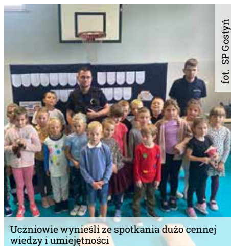
fol. SP Gostyni