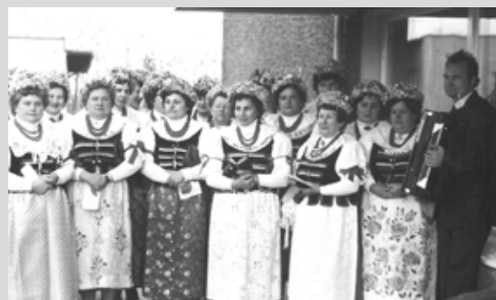
Wraz z zespołem Gostynianki w 1982 roku podczas uroczystości prymicyjnych