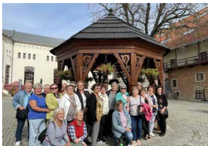
Zamek Piastowski w Raciborzu to najcenniejszy zabytek średniowieczny w województwie śląskim