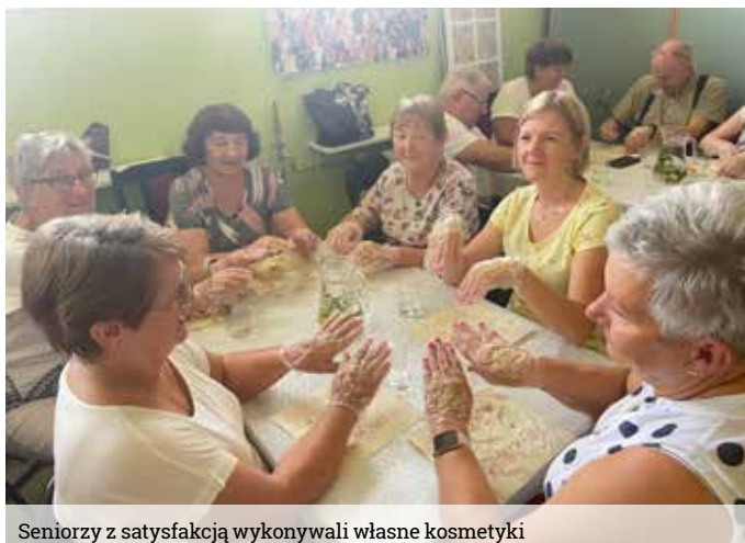
Seniorzy z satysfakcją wykonywali własne kosmetyki

Przebieganie do 2018 r. Narodowego Planu Rozwoju – Czynnik Rozwoju Społeczności Działających w ramach Regionalnego Programu Funduszy Inicjatyw Działających BONEFIO na lata 2017-2020