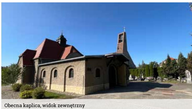
Obecna kaplica, widok zewnętrzny