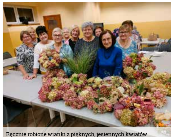
Ręcznie robione wianki z pięknych, jesiennych kwiatów