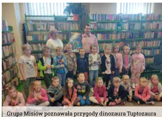
Grupa Misiów poznawała przygody dinozaura Tuptozaura