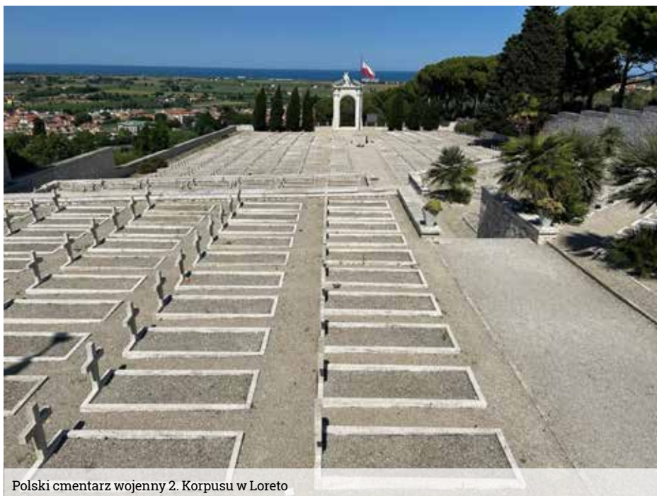
Polski cmentarz wojenny 2. Korpusu w Loreto

śnie tam ojciec ukrywał się przed Niemcami i partyzantami włoskimi. W 80 rocznicę tego dwumiesięcznego ukrywania się ojca w zabudowaniach młyna w Oliveto, nie mogło nas tam nie być.