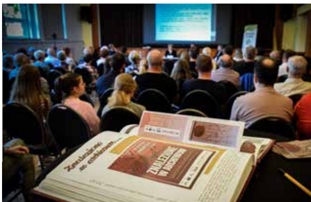
Spotkanie zgromadziło w domu kultury wielu pasjonatów lokalnej historii