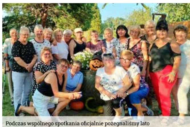
Podczas wspólnego spotkania oficjalnie pożegnaliśmy lato