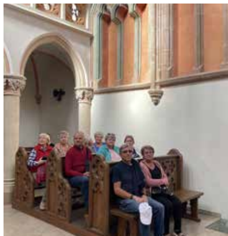
W kaplicy zamkowej