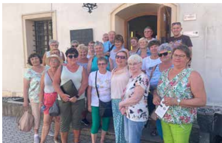
Pogoda zdecydowanie bardziej zbliżona była do pełni lata, niż do wczesnej jesieni