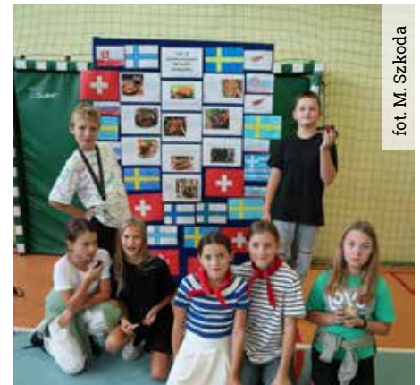
Europejski Dzień Języków to międzynarodowe święto, którego celem jest zachęcenie Europejczyków do nauki języków obcych oraz propagowanie zalet różnorodności językowej