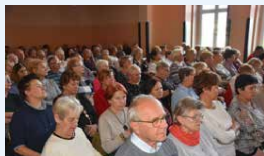
Inauguracja roku akademickiego odbyła się w auli I LO