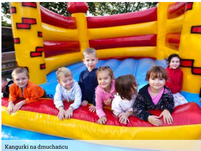
Kangurki na dmuchańcu