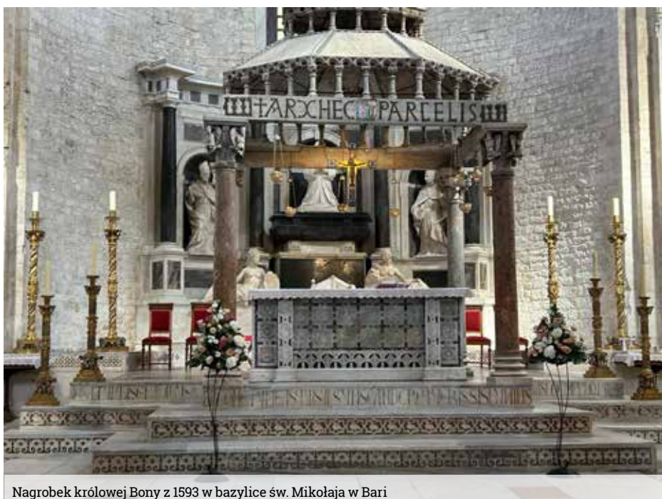
Nagrobek królowej Bony z 1593 w bazylice św. Mikołaja w Bari