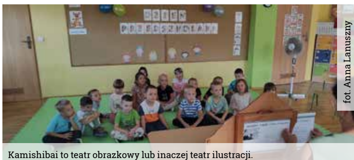
Kamishibai to teatr obrazkowy lub inaczej teatr ilustracji.

Teatryk pod tytułem „Trzy siostry” to bajka kamishibai o trzech niezwykłych siostrach, które pojawiły się w pewnej wiosce podczas srogiej zimy. W zamian za podarowaną bezinteresownie