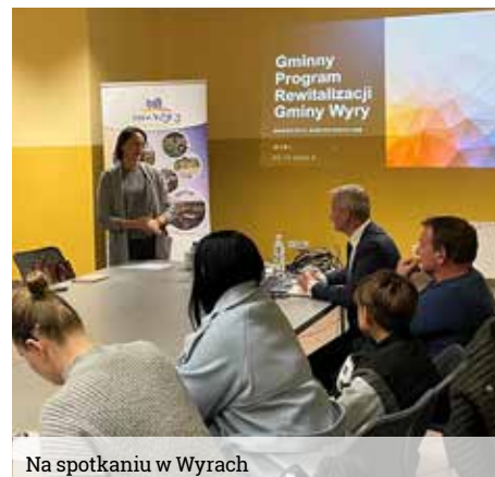
Na spotkaniu w Wyrach

Zgodnie z ustawą, rewitalizacja to proces zintegrowanych działań na rzecz społeczności lokalnej, przestrzeni i lokalnej gospodarki, skoncentrowanych terytorialnie, prowadzonych na podstawie gminnego programu rewitalizacji.