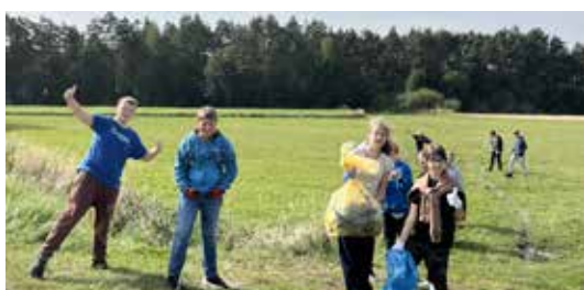
Celem tego niezwykłego wydarzenia jest nie tylko oczyszczenie naszej planety, ale także edukacja na temat ochrony środowiska.