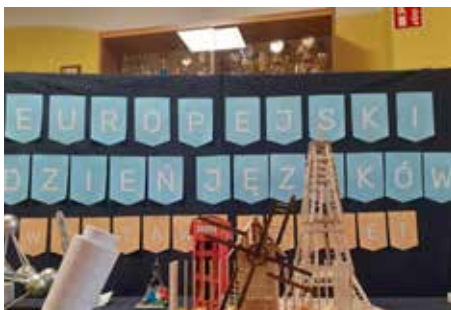
Projekty zrealizowane w ramach konkursu na makietę przedstawiającą zabytek lub atrakcję turystyczną europejskiego państwa

W tym roku uczniowie uczyli to „językowe święto” przystępując do dwóch konkursów dla klas IV-VIII, zorganizowanych przez nauczycieli języków obcych. Pierwszym z nich był konkurs na najładniejszą makietę przedstawiającą zabytek lub atrakcję turystyczną europejskiego państwa. Konkurs cieszył się dużym zainteresowaniem dzieci i młodzieży, a efekty pracy uczniów zostały przedstawione na wystawie towarzyszącej obchodom Europejskiego Dnia Języków. Drugi konkurs polegał na opracowaniu przez każdą z klas najciekawszego stanowiska, przedstawiającego wylosowany kraj Europy. Przygotowane stanowiska przerosły najśmielsze oczekiwania. Dzieci i młodzież w imponujący sposób pokazały historię, geografię, kulturę i tradycje poszczególnych państw. Na wielu stanowiskach pojawiły się także charakterystyczne dla danego kraju potrawy oraz utwory