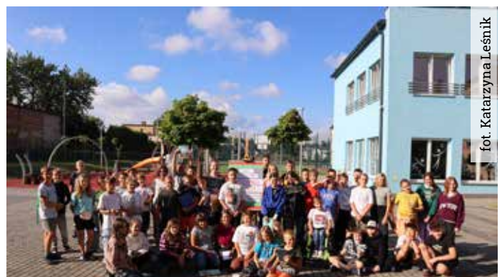
Wyrscy uczniowie we wrześniu wzięli udział w wyjątkowej grze edukacyjnej „Rozszyfruj historię”