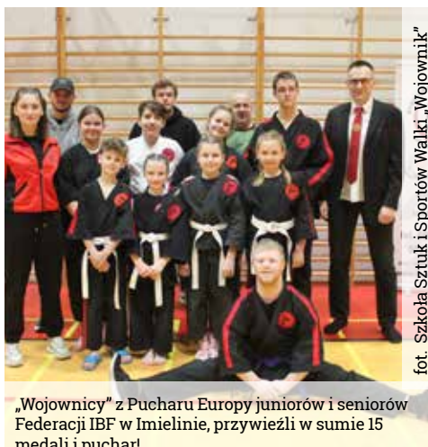
„Wojownicy” z Pucharu Europy juniorów i seniorów Federacji IBF w Imielinie, przywieźli w sumie 15 medali i puchar!