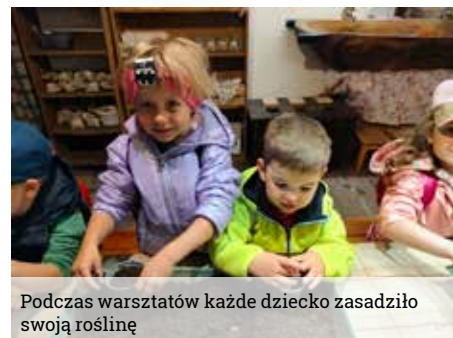
Podczas warsztatów każde dziecko zasadziło swoją roślinę