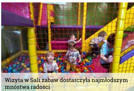
Wizyta w Sali zabaw dostarczyła najmłodszym mnóstwa radości

Wielkim przeżyciem dla przedszkolaków było przebywanie w sali szkolnej z lat 60 i 70-tych poprzedniego stulecia. Dzieci mogły usiąść w starych drewnianych ławkach