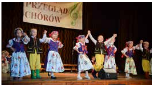
Dzieci z Gminnego Przedszkola w Gostyni