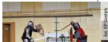
fol. SP Gostyni