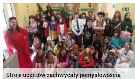
Stroje uczniów zachwycały pomysłowością