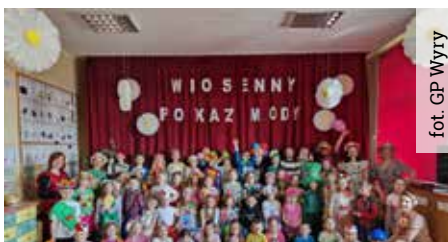
Wyrskie przedszkolaki, wiosnę powitały kolorowym pokazem mody