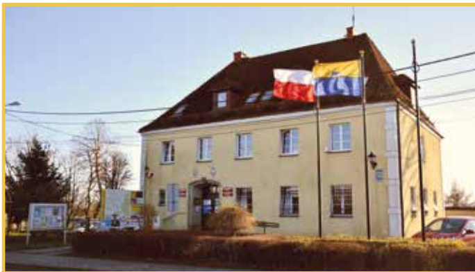
Urząd Gminy Wyrzy, ul. Główna 133, 43-175 Wyrzy Tel. (32) 325 68 00