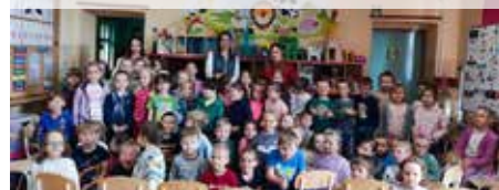
fol. GP Wyrzy

Akcja „WYRYwamy się do czytania”, już od ośmiu lat pomaga w rozwoju zainteresowań czytelniczych najmłodszych mieszkańców naszej gminy