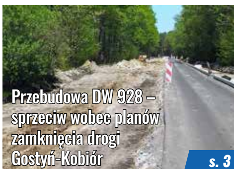
Przebudowa DW 928 – sprzeciw wobec planów zamknięcia drogi Gostyń-Kobiór