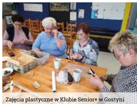
Zajęcia plastyczne w Klubie Senior+ w Gostyni

Twórczości Senioralnej. W naszym klubie trwają również prace związane z przygotowaniem scenografii do nowego teatryku, który będziemy chcieli wystawić w grudniu. Początkiem maja odwiedzają nas seniorzy z Wyr, liczymy, że uda nam się napisać wspólnie projekt.