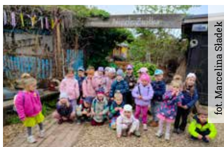
fot. Marcelina Śladek