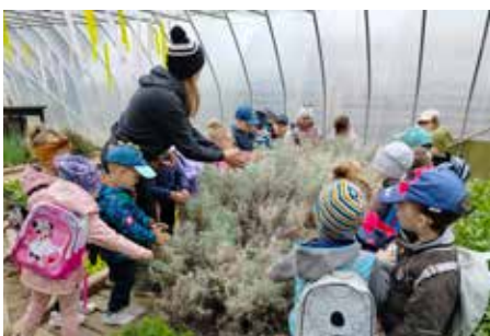
Przedszkolaki poznawały świat roślin wszystkimi zmysłami

niektórych roślin. Dowiedziały się wielu ciekawostek przyrodniczych. Na koniec każdy przedszkolak zasadził swoją roślinę, którą zabrał na pamiątkę warsztatów do domu. To była udana wycieczka.