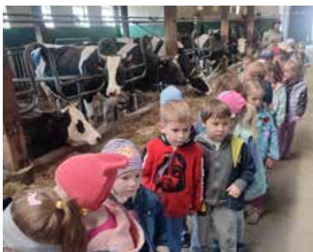
Celem wizyty w gospodarstwie było zapoznanie najmłodszych z ciężką pracą na roli, a przez to kształtowanie szacunku do zwierząt i otaczającej przyrody, z której można czerpać wiele korzyści

tym, że nie znajdujemy go tylko i wyłącznie w kartonie na sklepowych półkach) oraz skąd otrzymujemy jajka i również jak je przechowujemy. Ciekawe było także to, w jaki sposób jest rozdrabnianie i przechowywane ziarno, nim trafi do swojego miejsca docelowego.