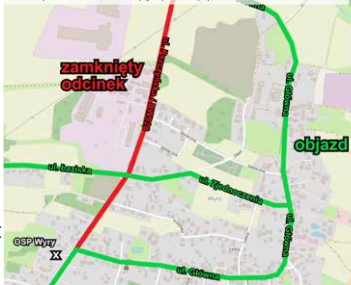
Mapa zamkniętego odcinka DW928 od skrzyżowania z ul. Na Wierzyisko do skrzyżowania z ul. Główną (przy OSP Wyry)