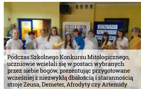
Podczas Szkolnego Konkursu Mitologicznego, uczniowie wcielali się w postaci wybranych przez siebie bogów, prezentując przygotowane wcześniej z niezwykłą dbałością i starannością stroje Zeusa, Demeter, Afrodyty czy Artemidy