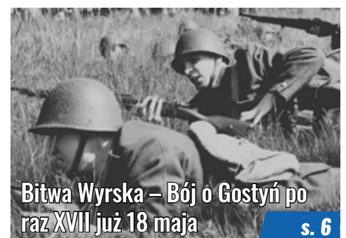
Bitwa Wyrska – Bój o Gostyń po raz XVII już 18 maja