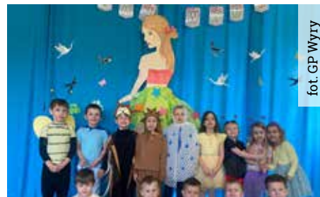
fol. GP Wyr