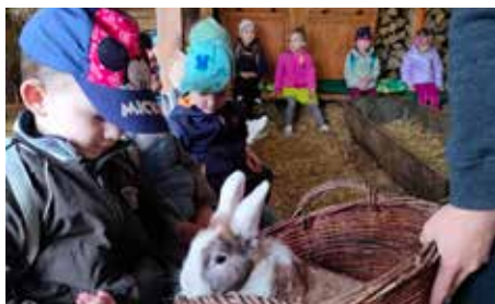
Dzieci mogły zobaczyć i pogłaskać zwierzęta gospodarskie

Wraz z nadejściem wiosny, 11 kwietnia, najmłodsze przedszkolaki z Gminnego Przedszkola w Wyrach udały się na wycieczkę do Mikołowa, by tam w Zagrodzie „Nieźle Ziółka” poznać świat roślin i zwierząt gospodarskich. W zagrodzie dzieci mogły nie tylko zobaczyć, ale i dotknąć, nakarmić konie, króliki czy kozy. Wywołało to mnóstwo radości, zachwytem nie było końca. Dzieci poznały wygląd, zapach oraz właściwości