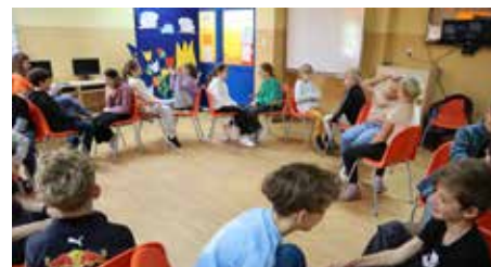
Podczas zajęć, dzieci ćwiczyły skuteczne strategie rozmowy