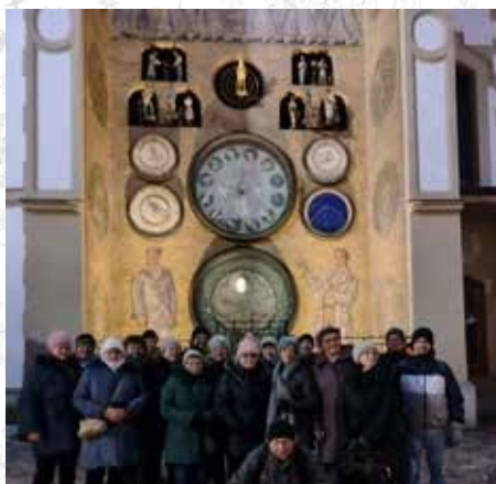
Jednym z zabytków Ołomuńca jest ratusz z zegarem astronomicznym, gdzie klubowiczki wykonały pamiątkowe zdjęcie...

Ołomuniec ma bogatą tradycję muzyczną i kościelną. Na obrzeżach miasta znajduje się morawska perła barokowej architektury i sztuki – sanktuarium Nawiedzenia Maryi Panny – Svaty Kopecek „Święta Górka”. Pobyt w tym miejscu był także w programie naszego wyjazdu. W mieście jest także Dolny i Górny Rynek, gdzie zorganizowany był wielki Jarmark Świąteczny, który był głównym celem naszego wyjazdu.