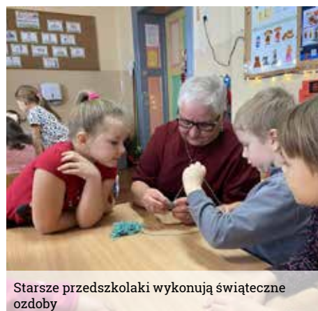
Starsze przedszkolaki wykonują świąteczne ozdoby

Panie dla każdej grupy przygotowały warsztaty, podczas których wspólnie ozdabialiśmy pierniczki. Zaś starsze przedszkolaki dodatkowo z pomocą Pań wykonały bożonarodzeniowe ozdoby i kartki świąteczne. Na zakończenie spotkania dzieci zostały obdarowane pięknymi zawieszkami na choinkę, a przedszkolaki w podziękowaniu złożyły życzenia i zaprezentowały kolędy oraz świąteczne piosenki. Dziękujemy paniom za wizytę i mile spędzony przedświąteczny czas.