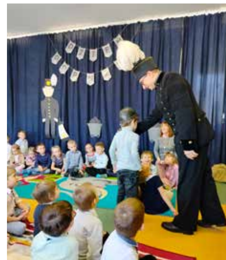
Dzieci mogły zobaczyć mundur galowy górnika i przymierzyć czako czy dawny hełm górniczy