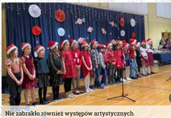
Nie zabrakło również występów artystycznych