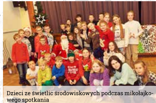
Dzieci ze świetlic środowiskowych podczas mikołajkowego spotkania