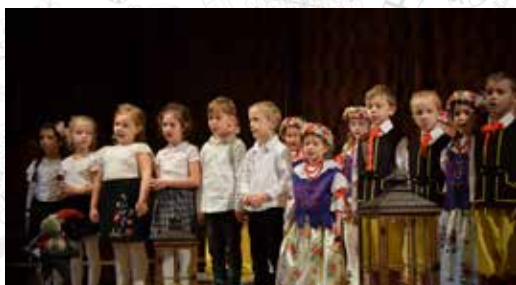
Spotkanie uświetniły występy dzieci z Gminnego Przedszkola w Gostyni