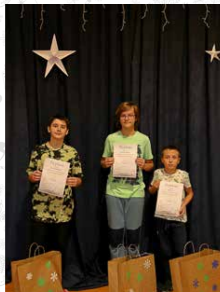
fol. SP Gostyni