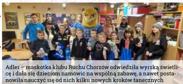
Adler – maskotka klubu Ruchu Chorzów odwiedziła wyrską świetlicę i dała się dzieciom namówić na wspólną zabawę, a nawet postanowiła nauczyć się od nich kilku nowych kroków tanecznych