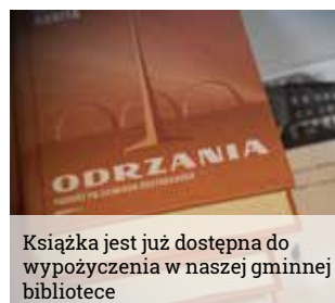
Książka jest już dostępna do wypożyczenia w naszej gminnej bibliotece

miach Odzyskanych”. Autor tym razem zabiera w podróż po ziemiach przyłączonych po wojnie do Polski i opowiada o nich z perspektywy ich mieszkańców.