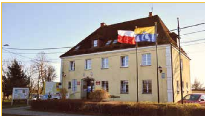
Urząd Gminy Wyrzy, ul. Główna 133, 43-175 Wyrzy Tel. (32) 325 68 00, Fax. (32) 325 68 09