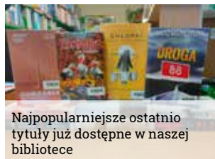
Najpopularniejsze ostatnio tytuły już dostępne w naszej bibliotece