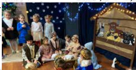
Przedświąteczny czas był szczególnie magiczny zarówno dla dzieci, jak i pracowników wyrskiego przedszkola