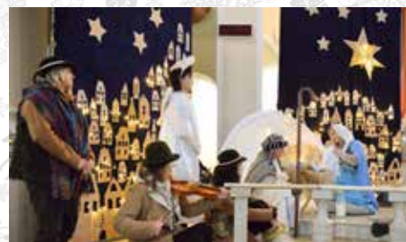
Wyjątkowe świąteczne przedstawienie zostało przygotowane przez pracowników OREW-u

Jak co rok w przedświątecznym czasie, 19 grudnia, Ośrodek Rehabilitacyjno-Edukacyjno-Wychowawczy w Wyrach zaprosił na jasełka i wspólne kolędowanie. W kościele pw. NSPJ w Wyrach zgromadzili się wychowawcy, rodzice, wychowankowie Ośrodka, mieszkańcy gminy i nie tylko, którzy chcieli uczestniczyć w tym niezwykłym przedstawieniu, razem kolędować i cieszyć się z nadchodzących Świąt.