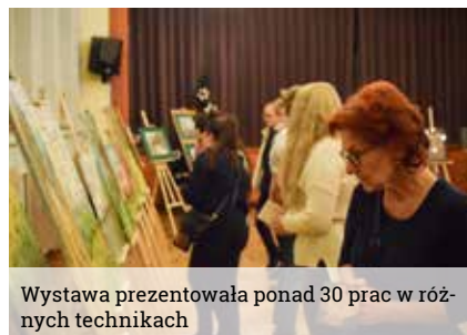
Wystawa prezentowała ponad 30 prac w różnych technikach

Wystawa w domu kultury prezentowała ponad 30 prac utrwalonych na płótnach w różnych technikach. Dzieła przedstawiające różnorodną tematykę, łączyła jednak wspólna rzecz – przenikanie się tego co materialne, z tym co duchowe i metafizyczne.