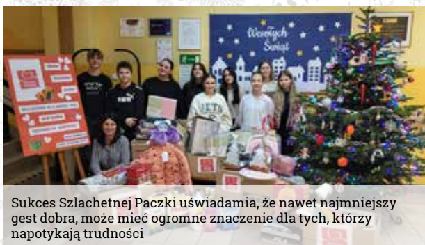
Sukces Szlachetnej Paczki uświadamia, że nawet najmniejszy gest dobra, może mieć ogromne znaczenie dla tych, którzy napotykają trudności