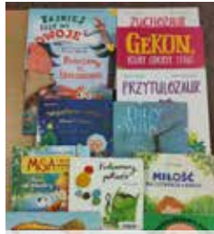
Nowe pozycje książkowe dla najmłodszych czytelników