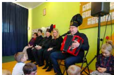
Pamiętajmy, że PIT musimy rozliczyć do 2 maja!

w górniczej czapce, do czego wykorzystywany jest węgiel oraz jaka patronka czuwa nad górnikami podczas ich codziennych