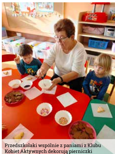
Przedszkolaki wspólnie z paniami z Klubu Kobiet Aktywnych dekorują pierniczki