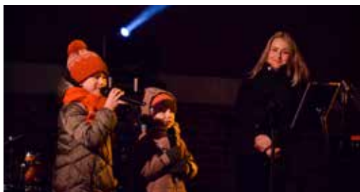
Zespołowi na scenie towarzyszyły uczestniczki zajęć muzycznych w domu kultury