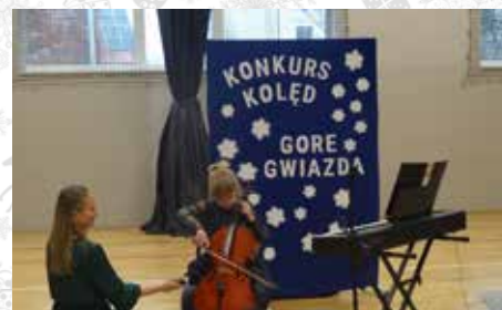
Laureatki konkursu będzie można usłyszeć ponownie podczas Koncertu Noworocznego, który odbędzie się 18 stycznia w Szkole Podstawowej w Wyrach