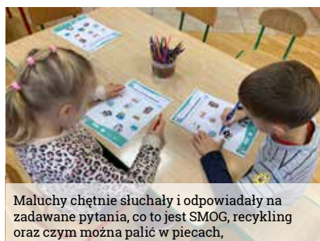
Maluchy chętnie słuchały i odpowiadały na zadawane pytania, co to jest SMOG, recykling oraz czym można palić w piecach,

szucht. Na koniec nie zabrakło życzeń z okazji Barbórki i wspólnego śpiewania śląskich piosenek biesiadnych przy dźwiękach akordeonu. Serdecznie dziękujemy wszystkim Gościom za poświęcony nam czas. Szczęść Boże!