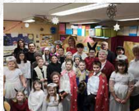
Tradycyjne spotkanie świąteczne, podczas którego dzieci zaprezentowały wyjątkowe jasełka

Natomiast kilka dni później, 8 grudnia, cała świetlica udała się na spotkanie z jak najbardziej „czerwonym” już Mikołajem do Domu Kultury w Gostyni. Okazało się, że Mikołaj nie był sam. Na dzieci czekało tam więcej niespodzianek. Panie z klubu Senior + w Wyrach przygotowały poczęstunek, własnoręcznie upiekły mnóstwo pierniczek i przyrządziły lukry, którymi pierniczki zostały udekorowane. Seniorzy z Gostyni przygotowali dla dzieci przepiękne i pouczające przedstawienie, które dzieci obejrzały z zapałem i zainteresowaniem. Oczywiście na koniec Mikołaj obdarował wszystkie dzieci prezentami.