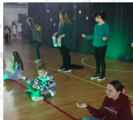
Przedstawienie było prawdziwym świadectwem kreatywności i zaangażowania młodych artystów

W ten świąteczny czas, uczniowie klasy II, III i V wyrskiej szkoły podstawowej zaprezentowali niezapomniane jasełka, które oczarowały publiczność. W ich wykonaniu tradycyjne kolędy zyskały nowe życie, a historia narodzin Jezusa została przedstawiona w sposób zarówno edukacyjny, jak i pełen ciepła. Kolędy, śpiewane z sercem i pasją, niosły ze sobą ducha Bożego Narodzenia, rozgrzewając serca wszystkich uczniów i nauczycieli. Dzieci wcieliły się w role biblijne, przedstawiając sceny związane z narodzinami Jezusa. Uczniowie z ogromnym zaangażowaniem i autentycznością oddali atmosferę tamtych wydarzeń. Ich interpretacja historii była prosta, ale pełna głębokiego przesłania. Na zakończenie tych występów, pod przewodnictwem księdza proboszcza, cała szkoła zaśpiewała kolędy.