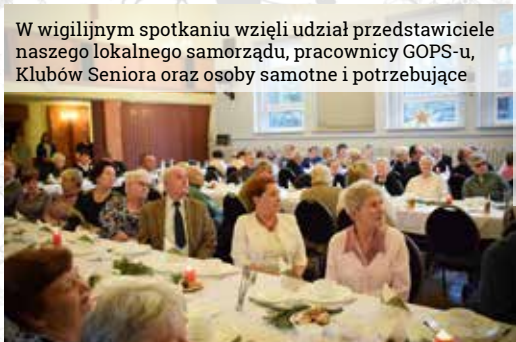
W wigilijnym spotkaniu wzięli udział przedstawiciele naszego lokalnego samorządu, pracownicy GOPS-u, Klubów Seniora oraz osoby samotne i potrzebujące