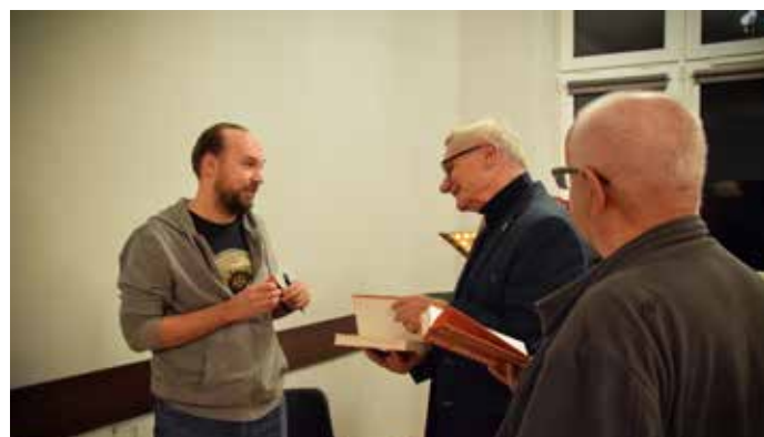
Autor chętnie wymieniał się uwagami z czytelnikami i podpisywał książki