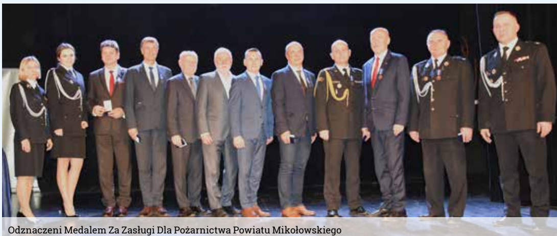
Odznaczeni Medalem Za Zasługi Dla Pożarnictwa Powiatu Mikołowskiego