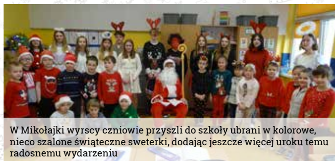
W Mikołajki wyrscy uczniowie przyszli do szkoły ubrani w kolorowe, nieco szalone świąteczne sweterki, dodając jeszcze więcej uroku temu radosnemu wydarzeniu