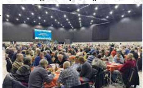
Metropolitalna Wigilia dla Samotnych odbyła się we wsparciu m.in. Gminy Wyr,

Podobnie jak w ubiegłym roku Gmina Wyr włączyła się do organizowanej przez fundację Wolne Miejsce Metropolitalnej Wigilii dla Samotnych. Wydarzenie odbyło się w dzień Wigilii Świąt Bożego Narodzenia