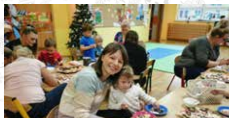
Wspólne ozdabianie pierniczków to doskonała okazja na spędzenie przedświątecznego czasu razem oraz uwrażliwianie najmłodszych dzieci na pomoc innym