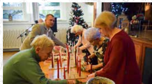
Każdy uczestnik spotkania mógł wykonać własny świąteczny stroik