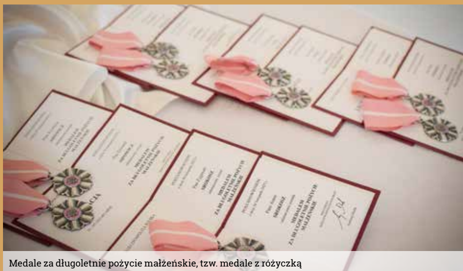
Medale za długoletnie pożycie małżeńskie, tzw. medale z różyczką