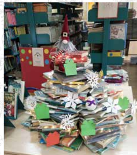
Choinka z książek w wyrskiej szkolnej bibliotece