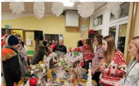
Podczas kiermaszu można było zakupić wykonane przez rodziców oraz uczniów ozdoby choinkowe i stroiki świąteczne wyglądem przypominające prawdziwe dzieła sztuki

Podczas imprezy goście mieli okazję zakupić wykonane przez rodziców oraz uczniów ozdoby choinkowe i stroiki świąteczne wyglądem przypominające prawdziwe dzieła sztuki. O ogromnym zainteresowaniem cieszyło się również stanowisko z ozdobami wykonanymi przez grono pedagogiczne oraz pozostałych pracowników szkoły. Na stoiskach nie mogło także zabraknąć przepysznych ciast i pierniczek upieczonych przez rodziców. Dla miłośników słodkich specjałów przygotowano również kawia-