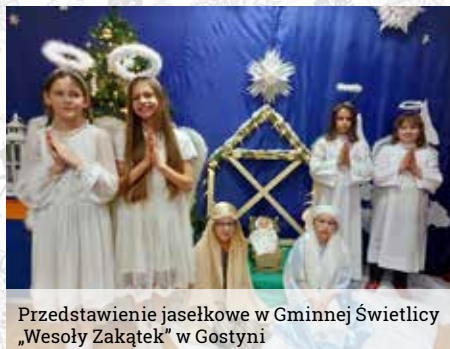
Przedstawienie jasełkowe w Gminnej Świetlicy „Wesoły Zakątek” w Gostyni

Przez ostatnich kilka miesięcy dzieci w Gminnej Świetlicy „Wesoły Zakątek” w Gostyni miały okazję uczestniczyć w zajęciach dodatkowych zorganizowanych w naszej placówce. Wychowankowie mogli zwiększyć krąg swoich zainteresowań, miło spędzić czas, rozwijać zdolności, umiejętności i talenty, a wszystko to dzięki arteterapii z elementami socjoterapii, zajęciom profilaktycznym oraz dogoterapii, które zostały sfinansowane z budżetu województwa śląskiego.