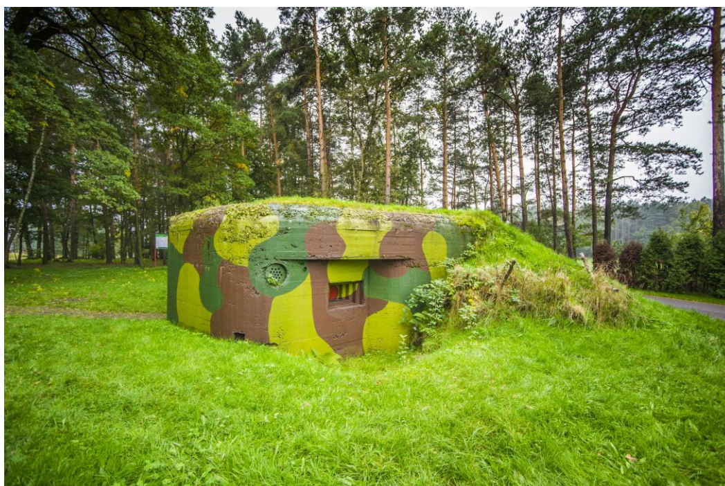
Schron bojowy „Sowiniec”

Na terenie miejscowości Gostyń znajdują się również budowle fortyfikacyjne z 1939 r. Są to 2 schrony: przy ul. Tęczowej (tzw. „Sowiniec”) oraz w rejonie Starej Piły. Na terenie kompleksu leśnego można znaleźć fragmenty nieukończonych budowli (fundamenty).