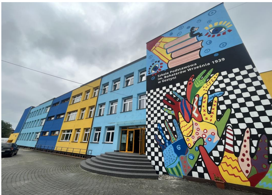
Budynek Szkoły Podstawowej w Gostyni