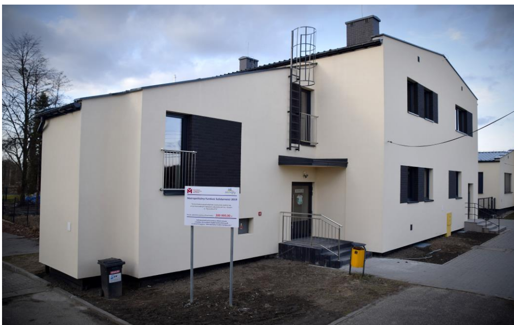
Siedziba świetlicy środowiskowej w Gostyni

Opiekunowie w świetlicy dbają by dzieci miały dobrze zorganizowany czas wolny. Dzieci korzystają z udostępnionych dla nich różnego rodzaju gier, zabaw, oglądają filmy, bajki. Często wychodzą także na spacerzy bądź uczestniczą w zorganizowanych wycieczkach. Kiedy trzeba odrobić pracę domową także mogą skorzystać z pomocy w nauce, opiekunowie również starają się rozwijać zainteresowania wśród młodzieży, poprzez organizację różnych zajęć tematycznych.