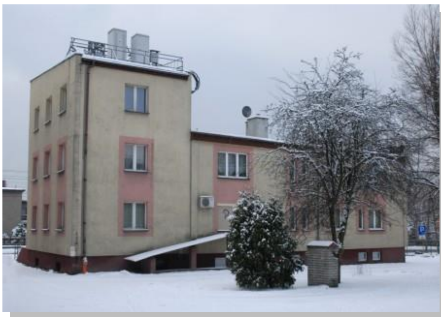
Budynek ośrodka zdrowia

Uchwałą nr XVIII/124/2000 Rada Gminy Wiry postanowiła wybrać formę organizacyjną prowadzenia Podstawowej Opieki Zdrowotnej na terenie Gminy Wiry od 1 stycznia 2001 roku, w postaci indywidualnych lub grupowych praktyk lekarskich jako niepubliczny Zakład Opieki Zdrowotnej, zapewniających mieszkańcom podstawową opiekę zdrowotną zarówno w miejscowości Wiry jak i Gostyń.