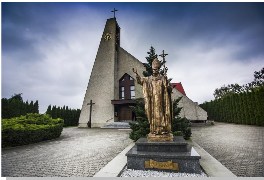
Kościół p.w. Podwyższenia Krzyża Świętego

Obok cmentarza parafialnego przy ul. Rybnickiej znajduje się kaplica cmentarna (wcześniej kościół p.w. Podwyższenia Krzyża Świętego), wybudowana w 1922 r. Na cmentarzu jest również zbiorowy grób polskich żołnierzy poległych we wrześniu 1939 r. oraz mogiła zbiorowa żołnierzy niemieckich zabitych w tym samym czasie. Obok cmentarza znajduje się nowy Kościół p.w. Podwyższenia Krzyża Świętego konsekrowany w 1997 r.