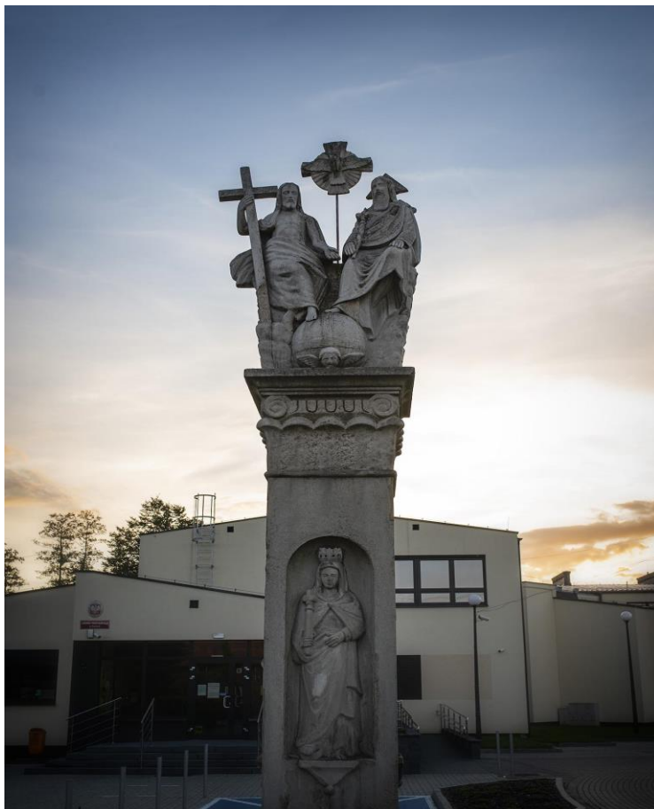
Figura Trójcy Świętej przy ul. Pszczyńskiej

Przy ul. Rybnickiej znajduje się Kościół p.w. Świętych Apostołów Piotra i Pawła wybudowany w latach 1935 – 1939.