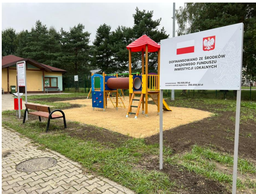
Plac zabaw przy kompleksie rekreacyjno – sportowym za Szkołą Podstawową