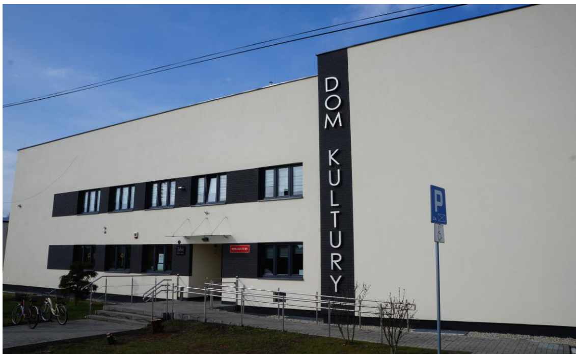
Budynek Domu Kultury w Gostyni

W Domu Kultury organizowane są również liczne zajęcia mające wpływ na rozwój kulturalny i styl życia mieszkańców, tj. m.in.: gimnastyka, wyjazdy i wycieczki, spotkania seniorów, spotkania działaczy i administratorów kultury oraz imprezy i zabawy okolicznościowe. Ponadto Dom Kultury posiada pod wynajem sale na szkolenia, wesela i imprezy okolicznościowe.