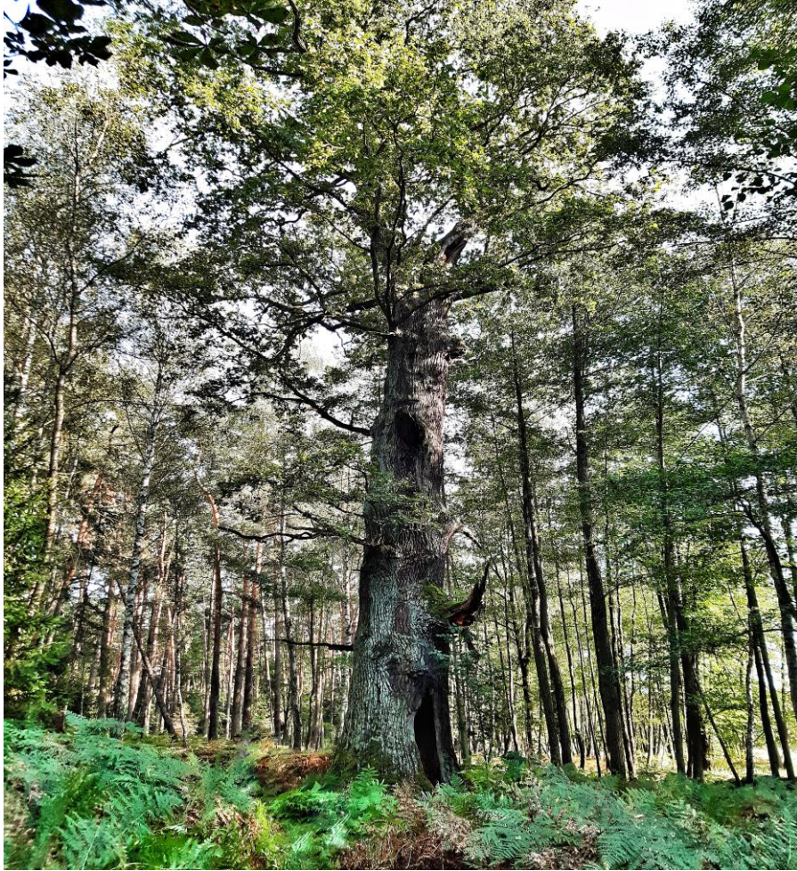
Dąb szypułkowy – pomnik przyrody