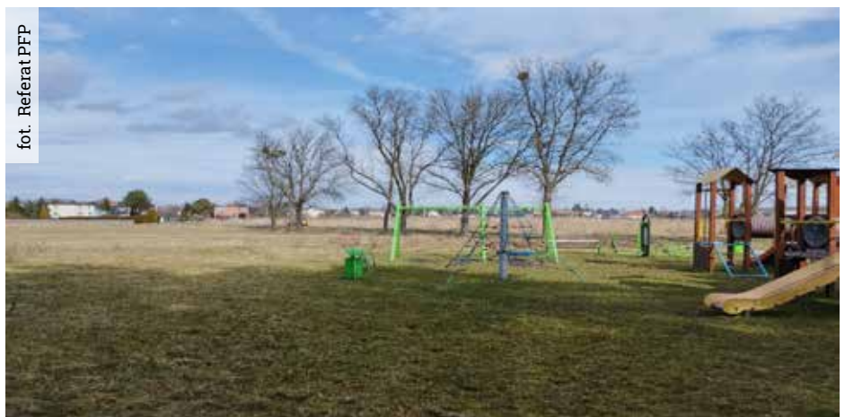
Planowana lokalizacja boiska