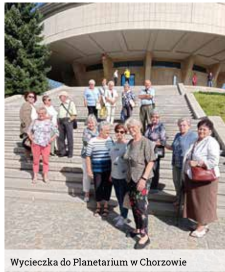
Wycieczka do Planetarium w Chorzowie