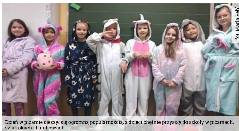
Dzień w piżamie cieszył się ogromną popularnością, a dzieci chętnie przyszły do szkoły w piżamach, szlafrokach i bamboszach