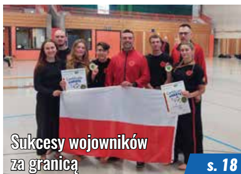
Sukcesy wojowników za granicą