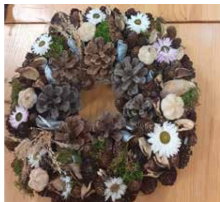
Wianek z szyszek