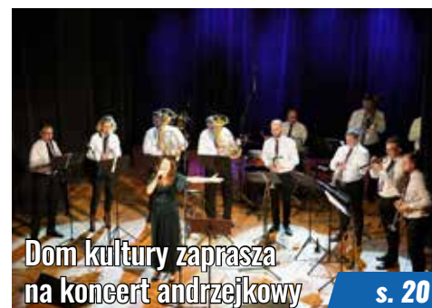
Dom kultury zaprasza na koncert andrzejkowy