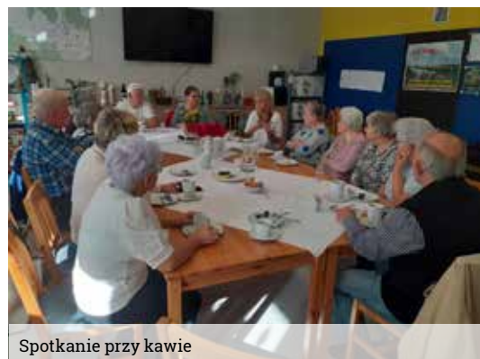
Spotkanie przy kawie

Gminny Ośrodek Pomocy Społecznej w Wyrach zaprosił klubowiczów do wspólnej organizacji wizyty św. Mikołajka, który przyniesie prezenty wszystkim grzecznym dzieciom i Wigilii Świąt Bożego Narodzenia, która organizowana jest z myślą o osobach starszych i osamotnionych. Przed nami dużo pracy, ale zapału, chęci i sił nam nie brakuje!