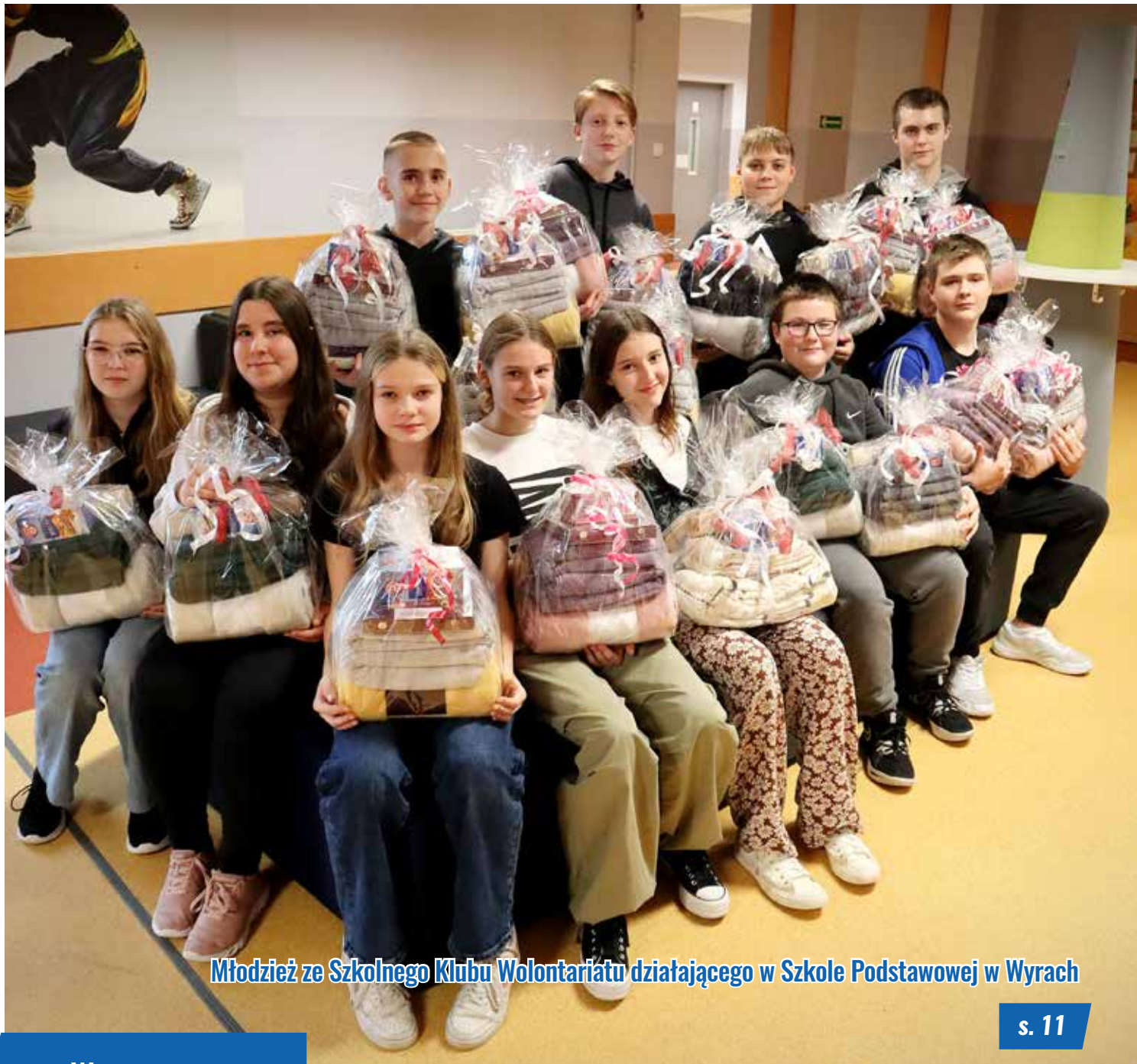
Młodzież ze Szkolnego Klubu Wolontariatu działającego w Szkole Podstawowej w Wyrach