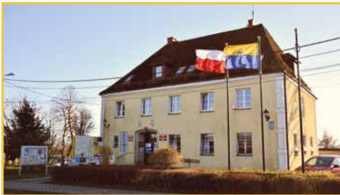
Urząd Gminy Wyrzy, ul. Główna 133, 43-175 Wyrzy Tel. (32) 325 68 00, Fax. (32) 325 68 09