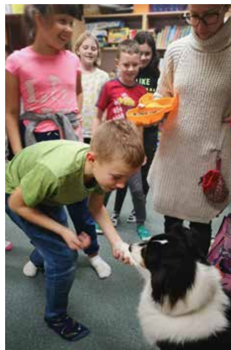
Zajęcia z dogoterapii z elementami socjoterapii z psem Faridą