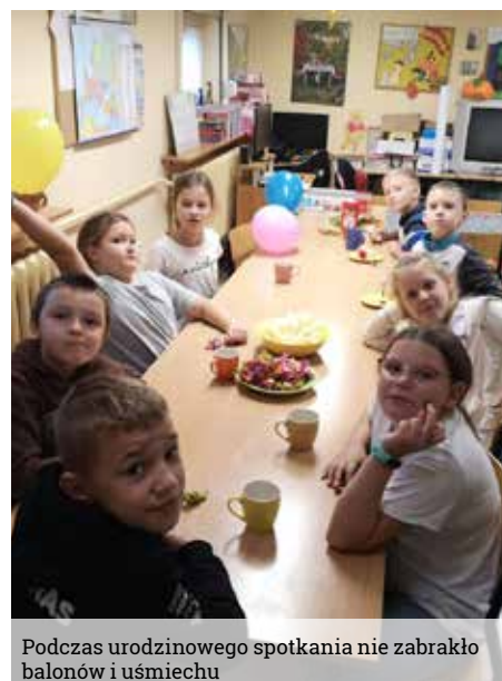
Podczas urodzinowego spotkania nie zabrakło balonów i uśmiechu