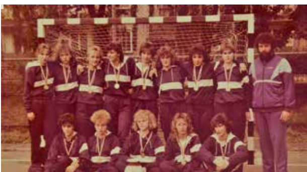
Mistrzostwo Polski Juniorek, zawodniczki ZKS FASAMA Tychy, Ostróda, 1988 rok