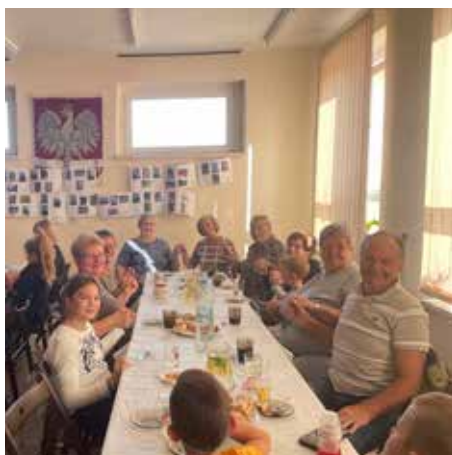
Bardzo ważną w projekcie była integracja międzypokoleniowa