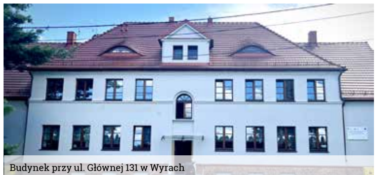
Budynek przy ul. Głównej 131 w Wyrach