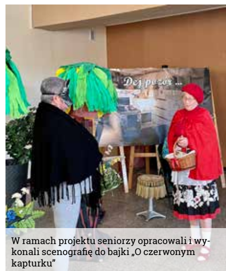
W ramach projektu seniorzy opracowali i wykonali scenografię do bajki „O czerwonym kapturku”

Działanie sfinansowano w ramach konkursu Śląskie Lokalnie ze środków Narodowego Instytutu Wolności - Centrum Rozwoju Społeczeństwa Obywatelskiego w ramach rządowego Programu NOWEFIO na lata 2021-2030.