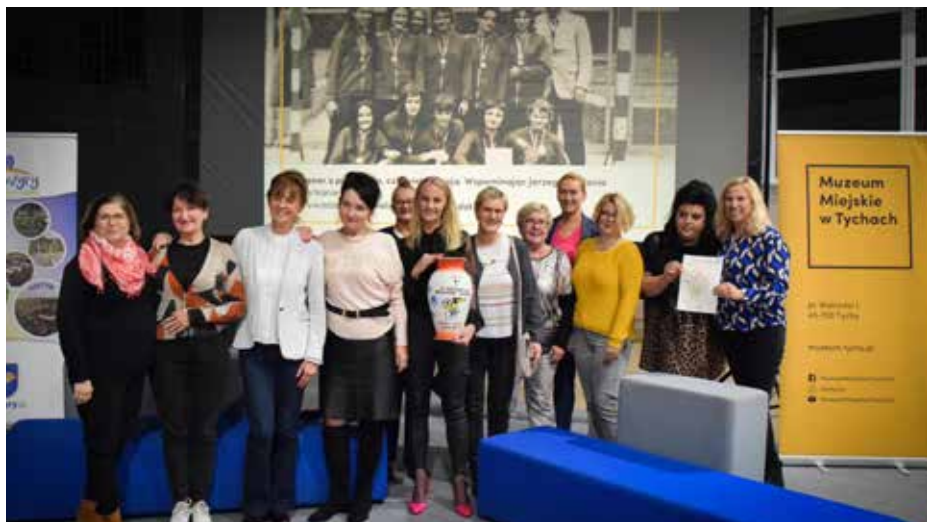
W spotkaniu wzięły udział dawne zawodniczki Jerzego Ciałonia

Jednocześnie Jerzy Ciałoń trenował też lekkoatletów w klubie GKS Tychy. Sukcesy trenerskie zaczął odnosić w obu dyscyplinach. Po kilku latach