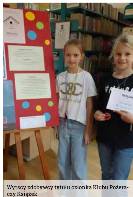
Wyrscy zdobywcy tytułu członka Klubu Pożeraczy Książek