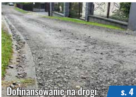
Dofinansowanie na drogi