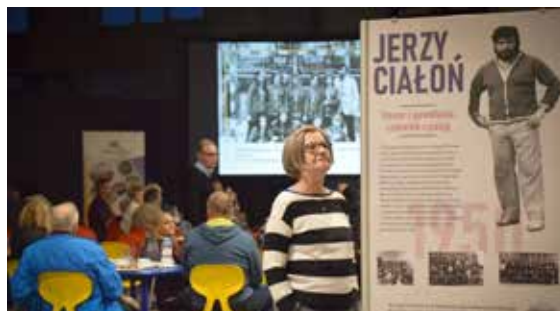
Urząd Gminy przygotował o trenerze Ciałoniem pamiątkową wystawę