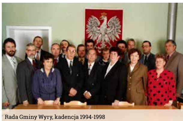
Rada Gminy Wyrzy, kadencja 1994-1998