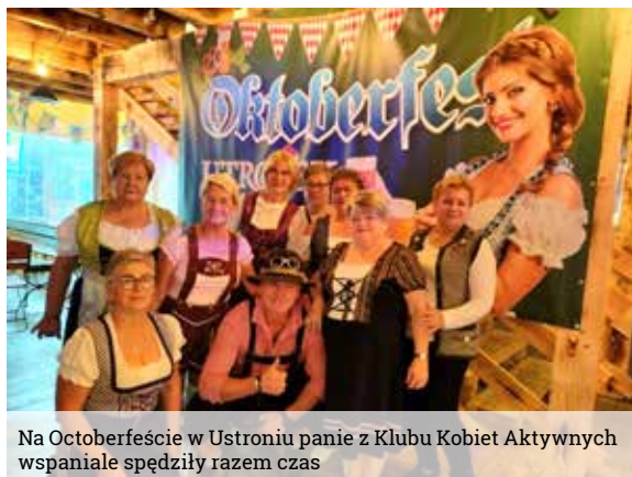
Na Oktoberfeście w Ustroniu panie z Klubu Kobiet Aktywnych wspólnie spędziły razem czas

W październiku na jesiennym stole w Klubie Kobiet Aktywnych serwujemy smaczne i zdrowe „dania z przydomowego ogródka”. Wzorem lat poprzednich w naszym Klubie zorganizowane zostały warsztaty kulinarne „Z dynią w roli głównej”. Panie przygotowały między innymi: pyszną zupę z dyni, kompot z bani, kilka różnych ciast i ciasteczek, deserki, placuszki i kluseczki oraz inne smakołyki. Klubowiczki wymieniły przepi-