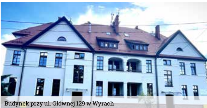
Budynek przy ul. Głównej 129 w Wyrach