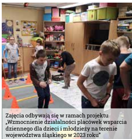
Zajęcia odbywają się w ramach projektu „Wzmocnienie działalności placówek wsparcia dziennego dla dzieci i młodzieży na terenie województwa śląskiego w 2023 roku”