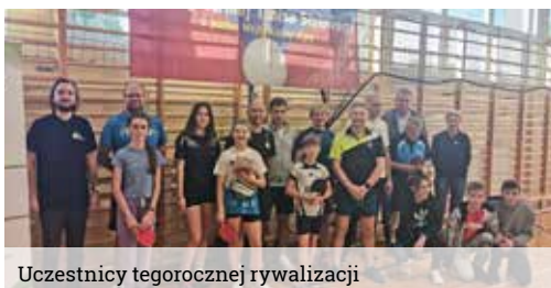
Uczestnicy tegorocznej rywalizacji

Tegoroczna, dziewiąta już edycja Turnieju Tenisa Stołowego o Puchar Wójta Gminy Wiry dostarczyła wielu emocji. Rywalizacja, odbywająca się tradycyjnie w Szkole