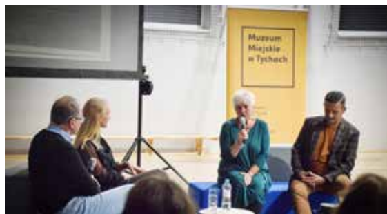
Trenera wspominali także członkowie rodziny, jego uczniowie oraz dawni współpracownicy z Wyr i Tychów