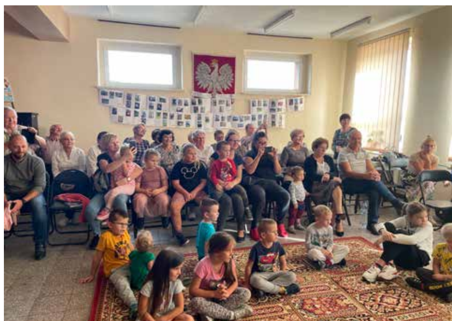
Klub Seniora odwiedziły także przedszkolaki