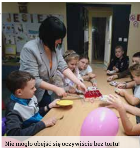
Nie mogło obejść się oczywiście bez tortu!