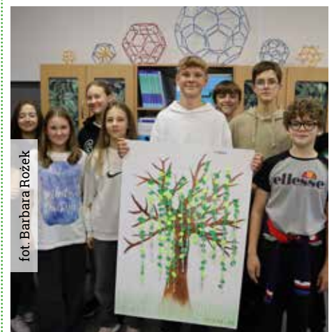
Uczniowie klasy 8b – autorzy zwycięskiego plakatu