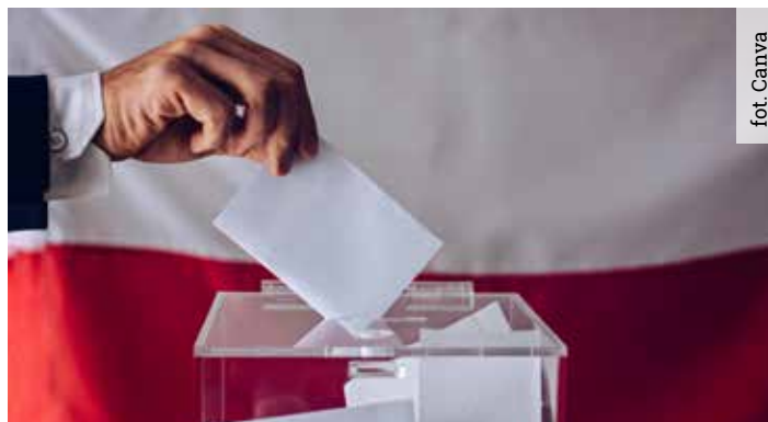
Frekwencja w naszej gminie była rekordowa. Zarówno w wyborach do Sejmu, jak i Senatu, wzięło udział ponad 80% uprawnionych do oddania głosu

W 2019 roku Prawo i Sprawiedliwość w naszym okręgu zdobyło pięć poselskich mandatów. W tegorocznych wyborach zwy-