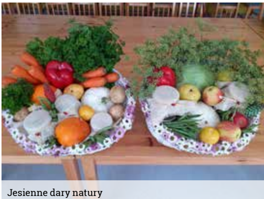
Jesienne dary natury

Spotkanie z dyrekcją i wychowawcami z gostyńskiego przedszkola zaowocowała tym, że od października tego roku raz w miesiącu, będziemy spotykać się z najmłodszymi na zajęciach integracyjnych. Za nami, pierwsze warsztaty, które odbyły się w siedzibie naszego klubu, w trakcie których wspólnie kisiliśmy kapustę. Dzieci wraz z seniorkami siekały marchewkę dodając ją do miski z kapustą i solą. Z woreczkami na nogach przedszkolaki ochoczo zabrały się do jej deptania, a następnie umieszczania w słoiczkach. Efekty ich pracy będzie można niebawem skosztować. Przed nami w li-