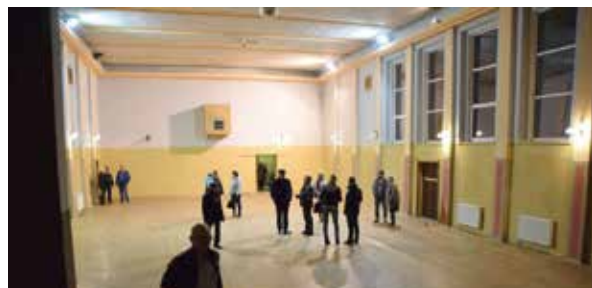
Mieszkańcy gminy mieli możliwość zobaczenia obecnego stanu wnętrza byłego domu kultury w listopadzie 2019 roku podczas spotkania konsultacyjnego związanego z procedurą sporządzania planów zagospodarowania przestrzennego