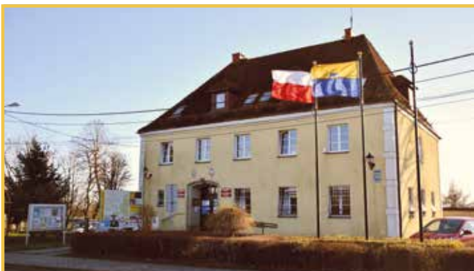
Urząd Gminy Wyry, ul. Główna 133, 43-175 Wyry Tel. (32) 325 68 00, Fax. (32) 325 68 09