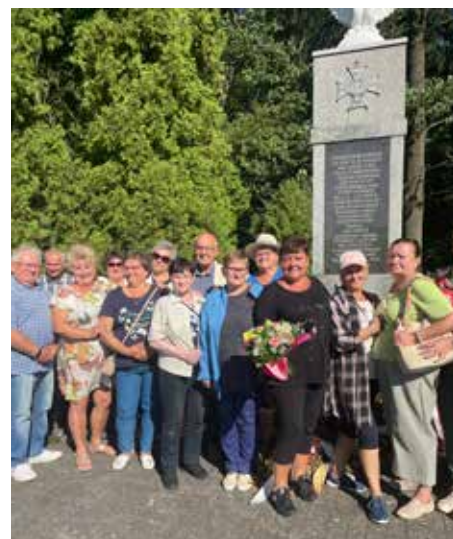
Seniorzy złożyli kwiaty pod Pomnikiem Bohaterów Września 1939 w Gostyni