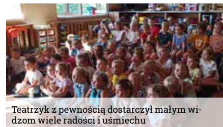
Teatrzyk z pewnością dostarczył małym widzom wiele radości i uśmiechu