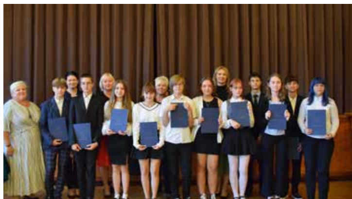
Szkoła Podstawowa w Gostyni – uczniowie klas IV-VI