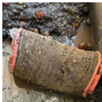
Filtr powietrza z samochodu ciężarowego