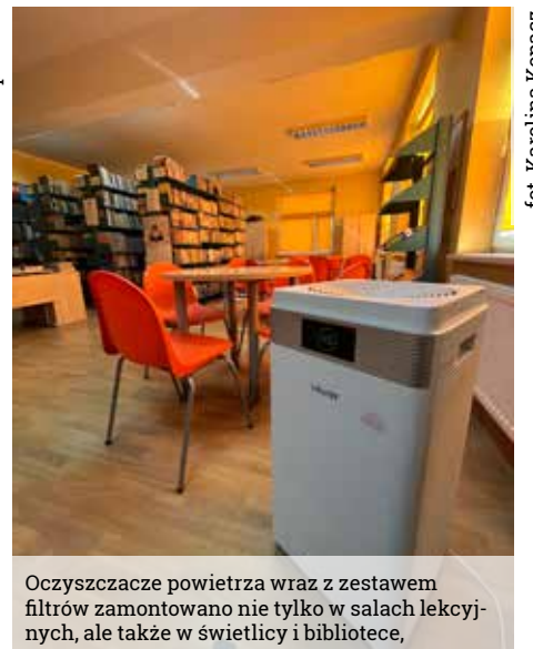
Oczyszczacze powietrza wraz z zestawem filtrów zamontowano nie tylko w salach lekcyjnych, ale także w świetlicy i bibliotece,