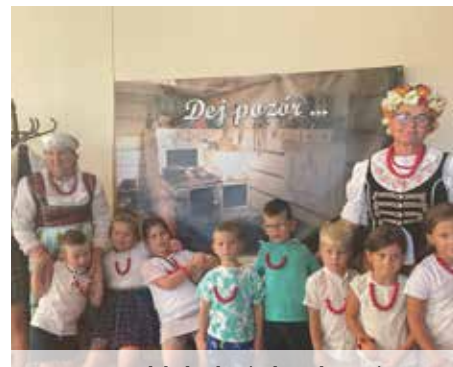
Na warsztatach była okazja do wykonania prawdziwych śląskich czerwonych korali