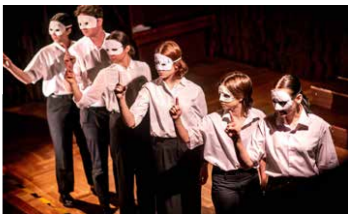
Młodzież dla młodzieży wystawiła spektakl „Cesarz