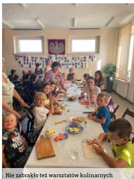
Nie zabrakło też warsztatów kulinarnych