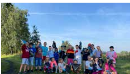
Akcja Sprzątanie Świata jest żywą lekcją ekologii, na zdjęciu uczniowie Szkoły Podstawowej w Gostyni

to wspólna lekcja poszanowania środowiska. Jej celem jest promowanie nie śmiecenia, edukacja odpadowa oraz inicjowanie działań, dzięki którym zmniejszy się nasz negatywny wpływ na środowisko.