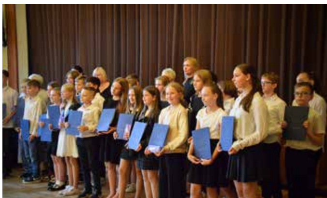
Szkoła Podstawowa w Gostyni – uczniowie klas IV-VI