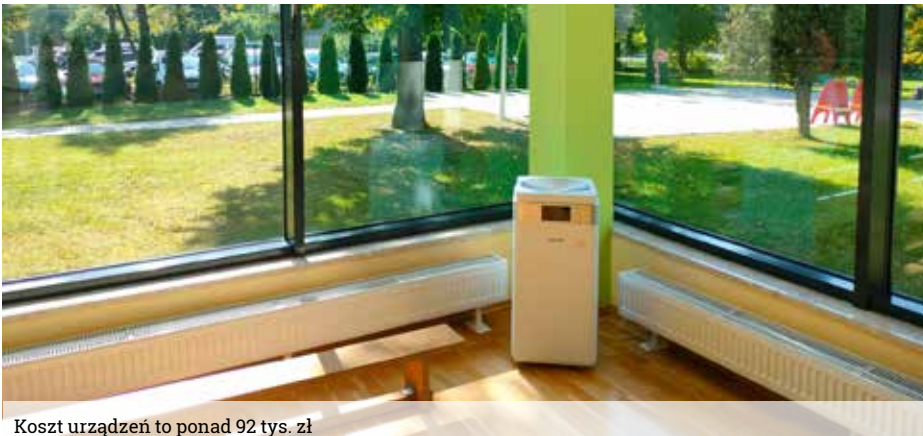
Koszt urządzeń to ponad 92 tys. zł

Łącznie 40 oczyszczaczy powietrza za ponad 92 tys. zł trafiło we wrześniu do placówek edukacyjnych w Gminie Wyrach. Cel jest jeden – poprawa powietrza w miejscach, w których na co dzień przebywają nasi najmłodszy mieszkańcy.