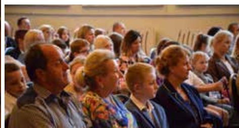
W uroczystości wzięli udział uczniowie wraz z całymi rodzinami