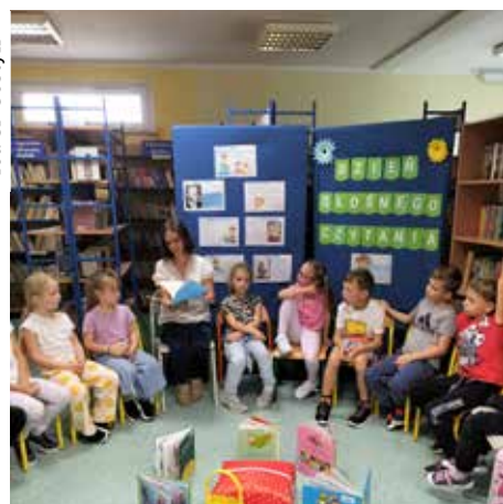
Aby pokazać najmłodszym uczniom piękno literatury, biblioteka szkolna przygotowała wiele atrakcji, z których można było korzystać nie przez jeden dzień, ale przez tydzień