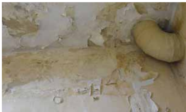
Obiekt obecnie znajduje się w bardzo złym stanie technicznym