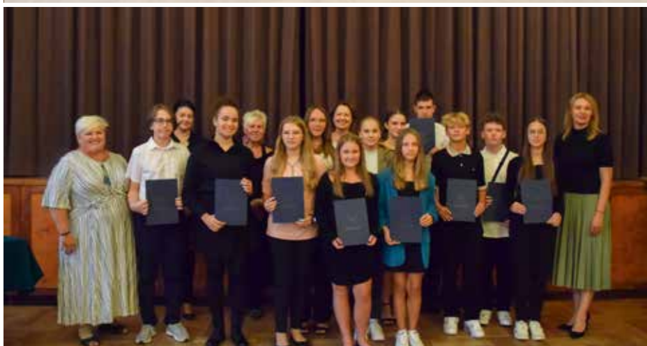
Szkoła Podstawowa w Wyrach – uczniowie klas VII-VIII