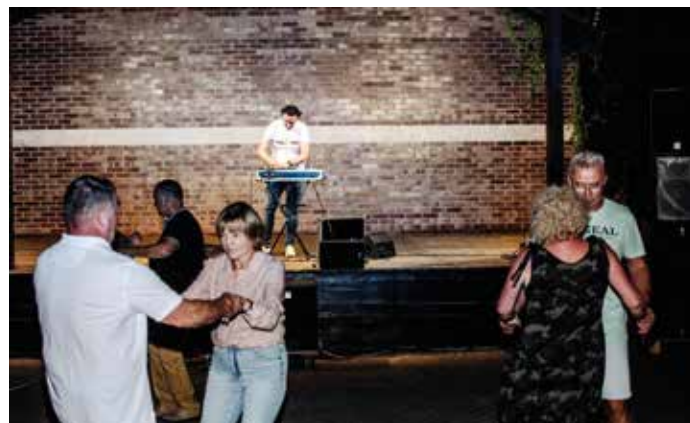
Tańcami pożegnaliśmy tegoroczne lato

Nie zabrakło prawdziwych słodkości przygotowanych przez Klub Kobiet Aktywnych z Wyr oraz lodów „od Tofika”. Po kawie i słodkościach można było zjeść coś konkretnego, serwowanego przez Bar u Soboty. Dzięki uprzejmości przedszkola w Gostyni dzieciaki mogły wyszaleć się na dmuchańcu, a potem pomalować buzie i brać udział w konkursach prowadzonych przez animatorów z „Ale firma”. O sferę muzyczną zadbali: zespół Jorgusie, MatGregor oraz DJ Marssell, który poprowadził zabawę taneczną.