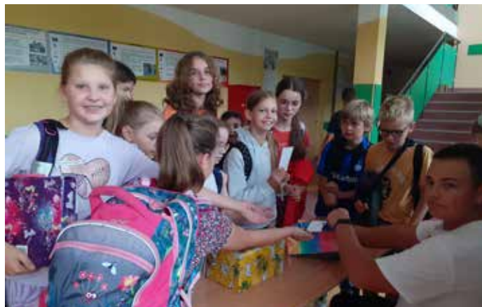
W Gostyni młodzież wzięła udział w Queście Językowym