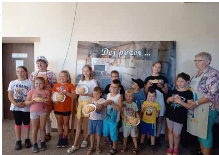
Głównym założeniem projektu „Dej pozór” była integracja międzypokoleniowa

które szczególnie oczekują dzieci, bo będzie „O czerwonym kapturku po śląsku”. Działanie sfinansowano w ramach konkursu Śląskie Lokalnie ze środków Narodowego Instytutu Wolności - Centrum Rozwoju Społeczeństwa Obywatelskiego w ramach rządowego Programu NOWEFIO na lata 2021-2030.