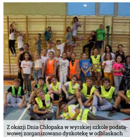
Z okazji Dnia Chłopaka w wyrskiej szkole podstawowej zorganizowano dyskotekę w odbłaskach