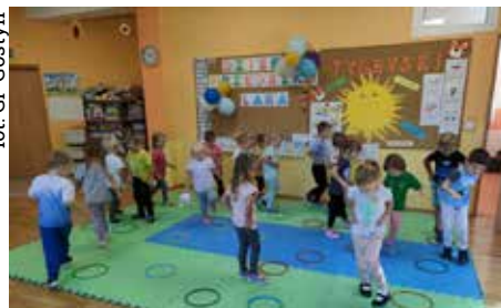
W przedszkolu w Gostyni dla dzieci przygotowano wiele atrakcji, w tym dmuchańce, gry i zabawy

Również w Gminnym Przedszkolu w Gostyni 20 września był szczególny i wesoły. Wszystkie grupy przedszkolne mogły bawić się na dmuchanych elementach: zjeżdżalni i zamku. Dzieci brały udział w zabawach, konkursach i tańcach organizowanych w grupach i ogrodzie przedszkolnym. Najmłodsze przedszkolaki sprawdzały swoją odwagę, dzielność i sprawność fizyczną podczas konkursów sprawnościowych przygotowanych przez panie nauczycielki – były tory przeszkód