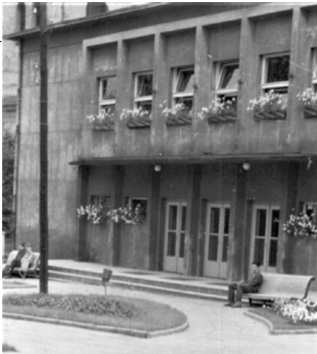
Dom Kultury w Wyrach w latach 90