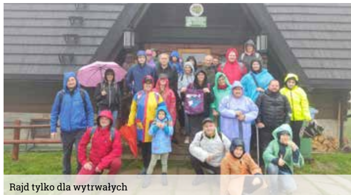
Rajd tylko dla wytrwałych