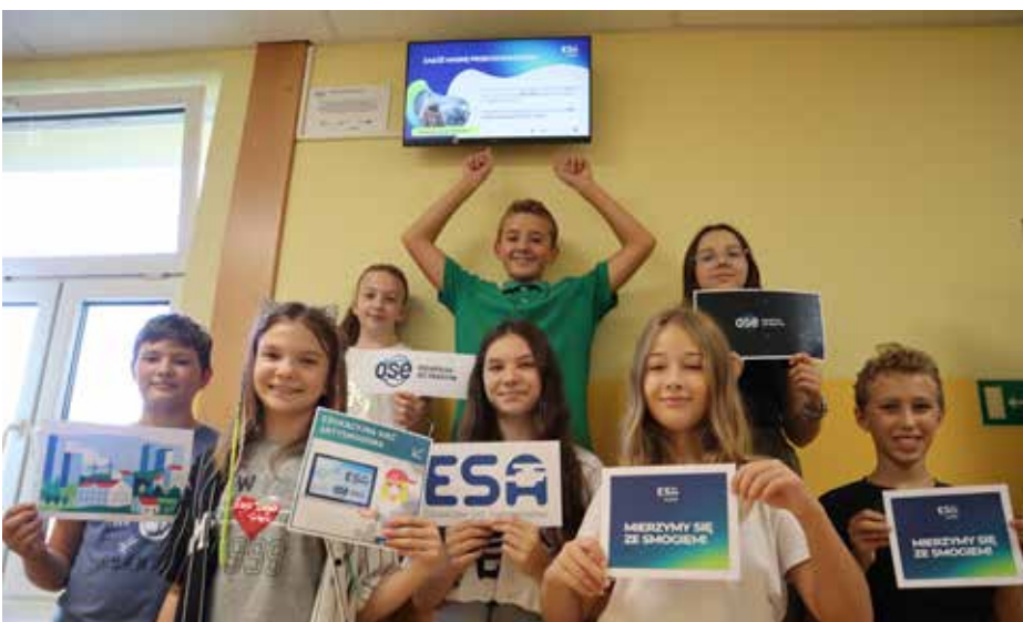
W wyrskiej szkole podstawowej pojawił się nowoczesny ekran edukacyjny, który szkoła pozyskała dzięki wygranej w Konkursie „Mierzmy się ze smogiem”

We wrześniu, na ścianie jednego z korytarzy Szkoły Podstawowej w Wyrach, pojawił się element przykuwający uwagę każdego, kto przechodzi obok. Mowa o nowoczesnym ekranie edukacyjnym, który udało się pozyskać dzięki wygranej w Konkursie „Mierzmy się ze smogiem”. Jednocześnie dołączyliśmy do projektu ESA – Edukacyjna Sieć Antysmogowa, który ma na celu zwiększenie świadomości uczniów, ich rodziców, jak również nauczycieli w zakresie szeroko rozumianej ekologii, przede wszystkim w zakresie problematyki jakości powietrza jako wspólnego dobra o szczególnym znaczeniu. Dzięki współpracy z Państwowym Instytutem Badawczym „Naukowa i Akademicka Sieć Komputerowa” otrzymaliśmy dostęp do materiałów edukacyjnych dotyczących problematyki smogu oraz zmian klimatu, do wykorzystania w prowadzeniu dalszych działań edukacyjno-informacyjnych w zakresie ekologii.