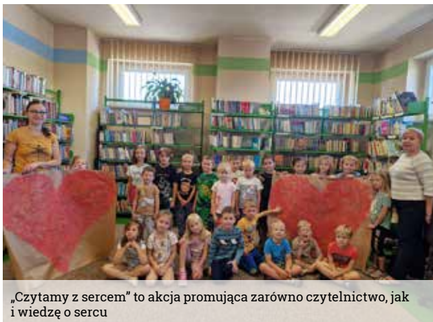
„Czytamy z sercem” to akcja promująca zarówno czytelnictwo, jak i wiedzę o sercu

Po raz drugi nasza biblioteka wzięła udział w akcji promującej czytelnictwo oraz wiedzę o sercu „Czytamy z sercem”. Każdy czytelnik odwiedzając bibliotekę w Wyrach lub bibliotekę w Gostyni w dniach 29 września – 5 października, otrzymał „literacką receptę”. Dodatkowo zorganizowaliśmy warsztaty literacko-plastyczne dla najmłodszych. 29 września bibliotekę w Wyrach odwiedziły przedszkolne grupy: Żabki, Rybki i Jeżyki. Dzieci wysłuchały bajki o sercu, poznały budowę serca i receptę na to, aby było zdrowe. Nie zabrakło zabaw ruchowych, piosenek i kolorowanek. Na przygotowanych arkuszach z namalowanym sercem, każdy przedszkolak dołożył „cegiełkę - serduszek” – odmalowaną rączkę ze swoim imieniem.