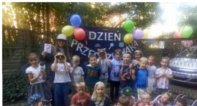
Od rana na dzieci czekało mnóstwo niespodzianek, które zorganizowały panie z wszystkich grup tak aby atmosfera była magiczna, radosna i kolorowa

Również w Gminnym Przedszkolu w Gostyni 20 września był szczególny i wesoły. Wszystkie grupy przedszkolne mogły bawić się na dmuchanych elementach: zjeżdżalni i zamku. Dzieci brały udział w zabawach, konkursach i tańcach organizowanych w grupach i ogrodzie przedszkolnym. Najmłodsze przedszkolaki sprawdzały swoją odwagę, dzielność i sprawność fizyczną podczas konkursów sprawnościowych przygotowanych przez panie nauczycielki – były tory przeszkód