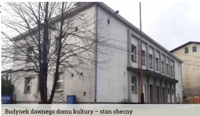
Budynek dawnego domu kultury – stan obecny

gruntownego remontu, a właściwie całkowitej przebudowy obiektu jest widoczna gołym okiem, to koszt tej potencjalnej inwestycji oscyływałby w granicach kilkunastu, jak nie kilkudziesięciu milionów złotych. Dodatkowo – jak to często zdarza się przy remontach starych budynków – byłby obciążony ryzykiem wystąpienia kolejnych ukrytych wad niezbędnych do usunięcia, co pociągałoby konieczności znalezienia dodatkowych środków finansowych.