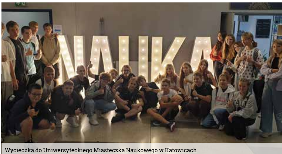
Wycieczka do Uniwersyteckiego Miasteczka Naukowego w Katowicach