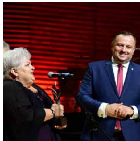
To wyjątkowe wyróżnienie dla całej Gminy Wyry