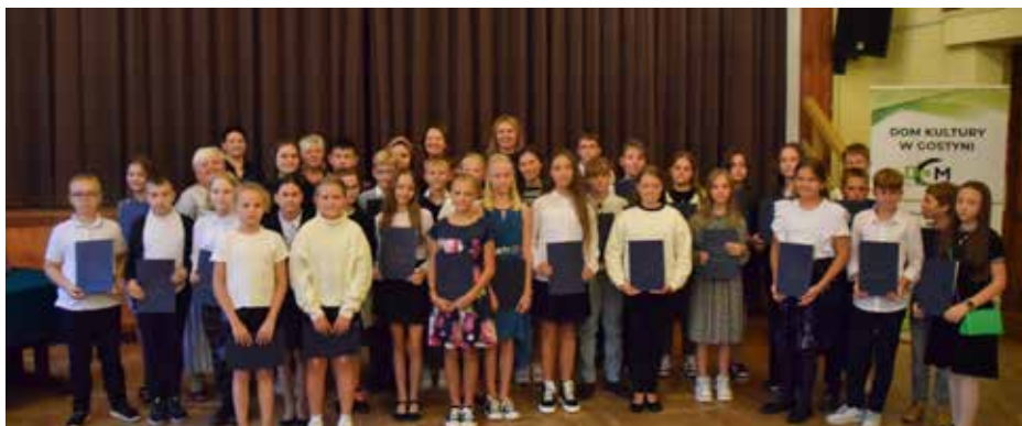
Szkoła Podstawowa w Wyrach – uczniowie klas IV-VI