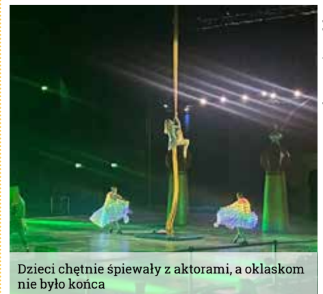
Dzieci chętnie śpiewały z aktorami, a oklaskom nie było końca