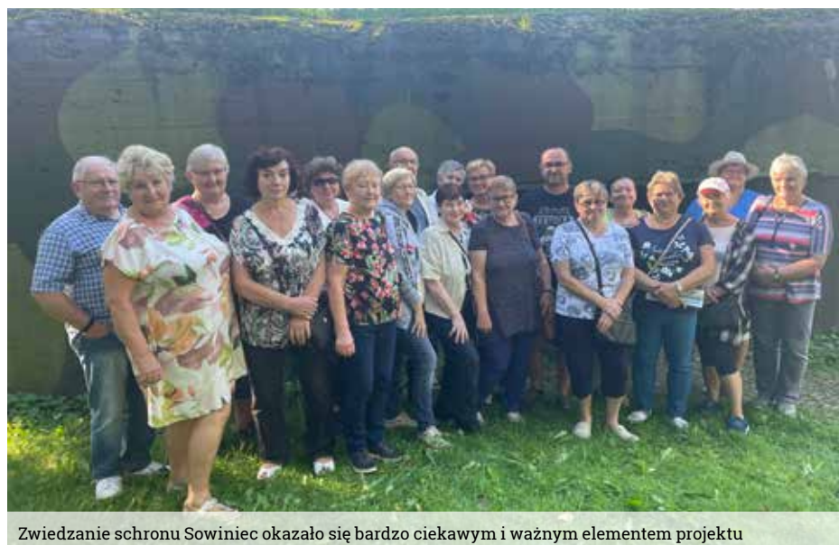
Zwiedzanie schronu Sowiniec okazało się bardzo ciekawym i ważnym elementem projektu