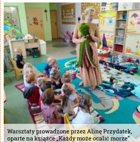
Warsztaty prowadzone przez Alinę Przydatek, oparte na książce „Każdy może ocalić morze”