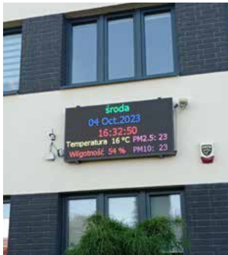
Ekran będą służył nie tylko do wyświetlania stanu powietrza w gminie, ale także do publikowania ważnych ogłoszeń i informacji

Oczyszczacze powietrza wyposażone zostały w dwustronny system filtracji pozwalający na oczyszczanie pomieszczeń o powierzchni do 200 m 2 . Urządzenie posiada funkcję filtrowania sierści, jonizacji, usuwania bakterii i wirusów, formaldehydu, kurzu, roztoczy, pyłków, alergenów, smogu, zapachów oraz zarodników pleśni.