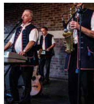
Zespół Jorgusie bawił publiczność przez 3 godziny