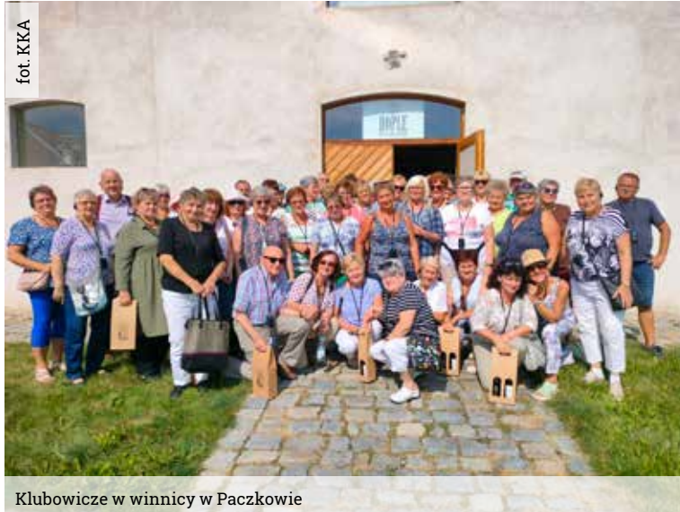
Klubowicze w winnicy w Paczkowie

trowa stodoła została zaadoptowana na Metamuzeum Motoryzacji.auta w muzeum to naprawdę „stare samochody z duszą...” wzbudzające zachwyty. Metamuzeum ma