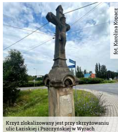
Krzyż zlokalizowany jest przy skrzyżowaniu ulic Łaziskiej i Pszczyńskiej w Wyrach