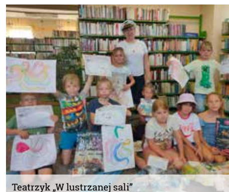
Teatrzyk „W lustrzanej sali”

stek z życia Anu i Nami, ale największą frajdę sprawiło dotykanie i głaskanie nowych przyjaciół.