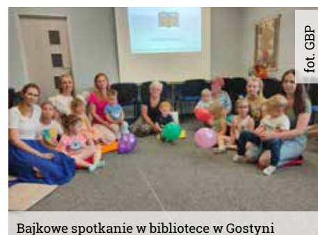
Bajkowe spotkanie w bibliotece w Gostyni