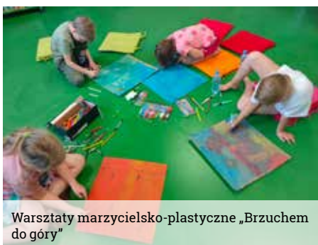
Warsztaty marzycielsko-plastyczne „Brzuchem do góry”