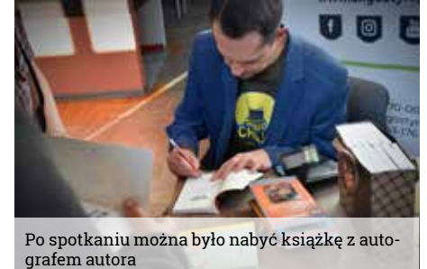
Po spotkaniu można było nabyć książkę z autografem autora