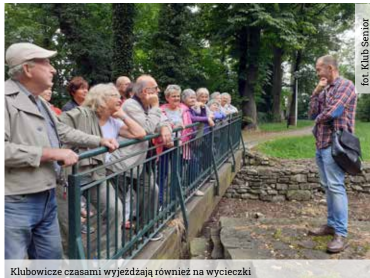
fort. Klub Senior