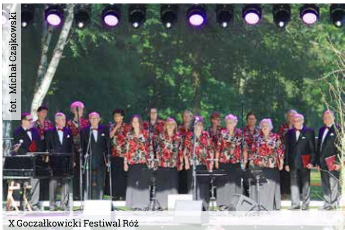
X Goczalkowicki Festiwal Róż