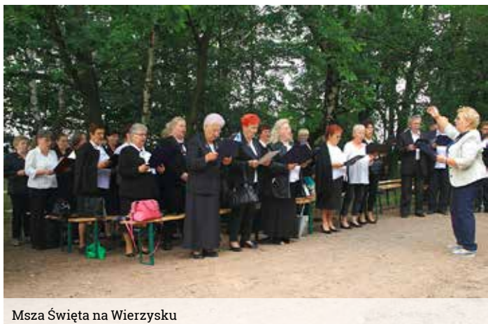
Msza Święta na Wierzysku