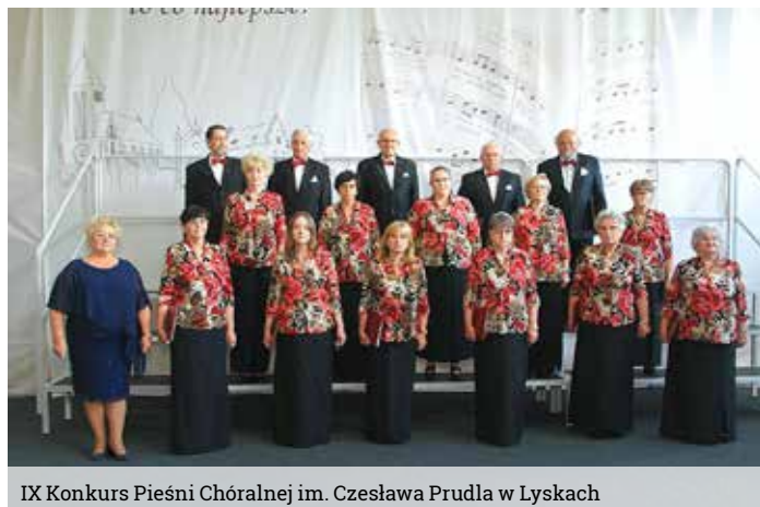
IX Konkurs Pieśni Chóralnej im. Czesława Prudla w Lyskach