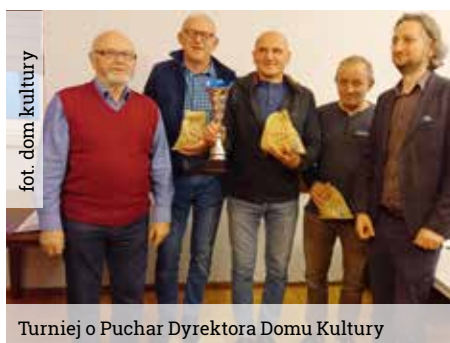
fol. dom kultury

I Turniej o XXXV Mistrza Gminy Wyry w skacie odbędzie się 26 września o godz. 17.00 w domu kultury. A już za rok w Katowicach odbędą się Mistrzostwa Świata w skacie.