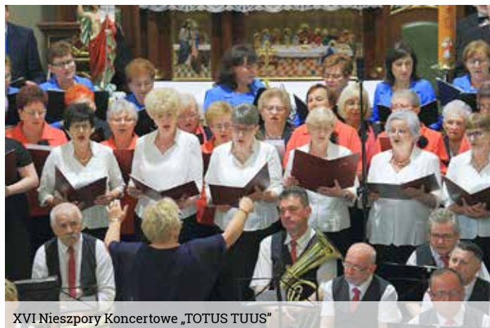
XVI Nieszpory Koncertowe „TOTUS TUUS”