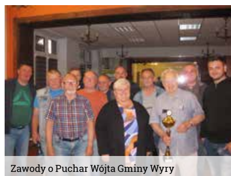
fol. Sekcja Skata Wyry