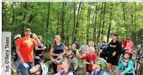
fol. O'Rety Team

W trakcie rajdu dla uczestników przygotowano wiele atrakcji