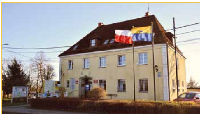
Urząd Gminy Wyry, ul. Główna 133, 43-175 Wyry Tel. (32) 325 68 00, Fax. (32) 325 68 09