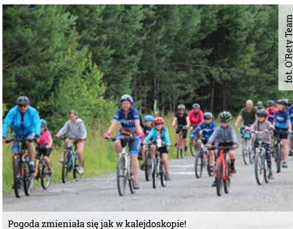
fol. O'Rety Team

Pogoda zmieniała się jak w kalejdoskopie!