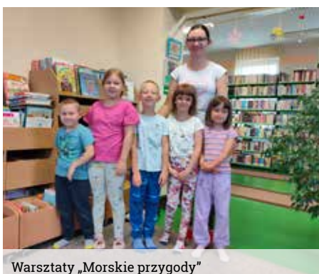
Warsztaty „Morskie przygody”

Na ostatnim wakacyjnym spotkaniu byliśmy widzami Teatrzyku Kamishibai „W lustrzanej sali”. To opowieść o tym, jak my widzimy świat i jak świat widzi nas. Bajka pokazuje historię psów Burka i Borysa, podczas ich wizyty w zamku, gdzie tajemnicza sala z lustrami okazuje się dwoma różnymi światami dla naszych bohaterów. W ramach przerwownika wykorzystaliśmy zabawę ruchową „Lustra”, a w drugiej części malowaliśmy lustrzane odbicia.