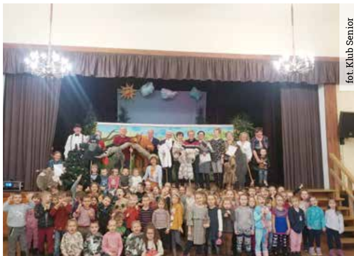
fort. Klub Senior

która przygotowała prezentację „Akcja Żonkile”, gminną ekodoradczynią, a także z przedstawicielami policji. W tym roku w siedzibie klubu seniorzy gościli m.in.: pracowników Urzędu Skarbowego z Mikołowa, policjantów z Komendy Powiatowej w Mikołowie, członków Stowarzyszenia Diabetyków z Mikołowa, seniorów