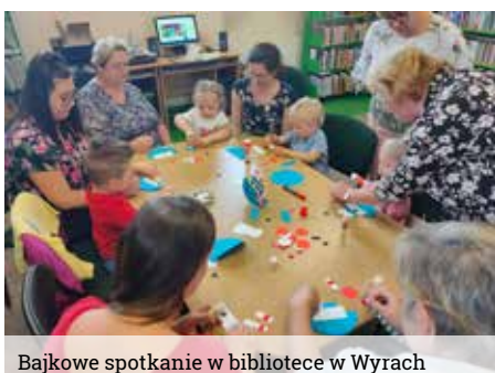
Bajkowe spotkanie w bibliotece w Wyrach