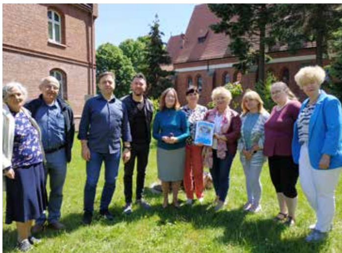
Warsztaty Muzyki Liturgicznej w Kobiórze