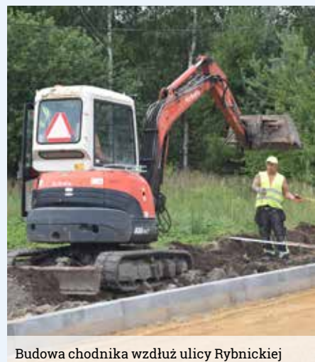
Budowa chodnika wzdłuż ulicy Rybnickiej

Droga na czas robót nie została wyłączona z ruchu, kierowcy poruszają się wahadłowo jednym pasem. Nie jest to łatwe zadanie, bowiem jest to jedna z ruchliwszych arterii w gminie.