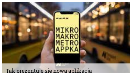
Tak prezentuje się nowa aplikacja

Dzięki aplikacji założenie konta w systemie Transport GZM zajmuje nie więcej niż 3 minuty. Wizyta w Punkcie Obsługi Pasażera (POP), ani oczekiwanie na kartę, tak jak to było w przypadku Śląskiej Karty Usług