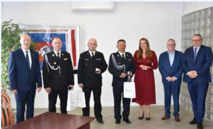
Władze powiatu i przedstawiciele sejmiku wojewódzkiego oraz odznaczeni

18 radnych, dwóch radnych wstrzymało się od głosu. Sprawozdanie finansowe Powiatu Mikołowskiego wraz ze sprawozdaniem z wykonania budżetu za rok 2022 uzyskało akceptację wszystkich obecnych. Podobnym wynikiem zakończyło się głosowanie nad udzieleniem Zarządowi Powiatu absolutorium. Pełna relacja na www.mikolowski.pl w zakładce „e-sesja”.