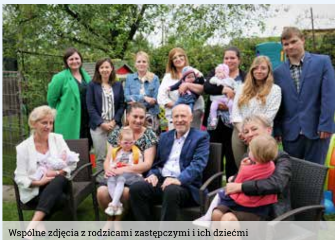
Wspólne zdjęcia z rodzicami zastępczymi i ich dziećmi

wicielkami Powiatowego Centrum Pomocy Rodzinie w Mikołowie.