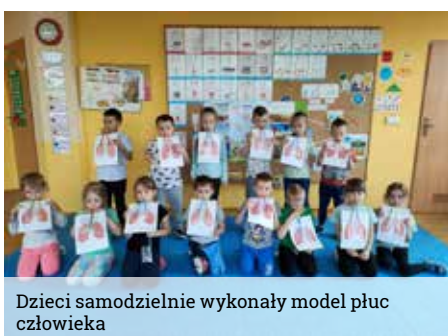
Dzieci samodzielnie wykonały model płuc człowieka