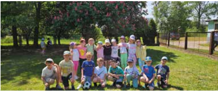
Pierwszoklasiści w Ogrodzie Botanicznym w Mikołowie

8 maja klasy czwarte i klasa szósta uczestniczyły w ciekawej lekcji w kinie, podczas której poznali mechanizm socjologicznego aspektu wywierania wpływu na odbiorcę poprzez reklamę. A potem oglądali film „Chłopiec z chmur”.