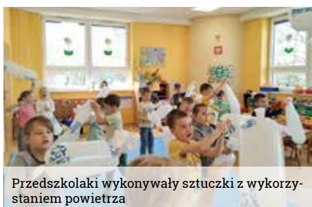
Przedszkolaki wykonywały sztuczki z wykorzystaniem powietrza

Jesienią dzieci uczestniczyły w zajęciach o wynalazkach takich jak koło, zegar, kołowrót, czy kula. Zimą przedszkolacy zajęci byli przeprowadzaniem eksperymentów kuchennych: z użyciem drożdży, różnego rodzaju mąk, sody oczyszczonej czy innych produktów spożywczych. Świetną zabawą okazało się nadmuchiwanie balonów za pomocą wody, cukru i drożdży lub sody i octu. Wielu wrażeń starszakom przyniosła zabawa