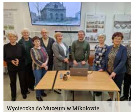
Wycieczka do Muzeum w Mikołowie