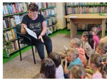
Zajęcia z cyklu Książka łączy pokolenia czyli głośne czytanie seniorów przedszkolakom