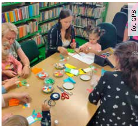
Bajkowe spotkanie w wyrskiej bibliotece