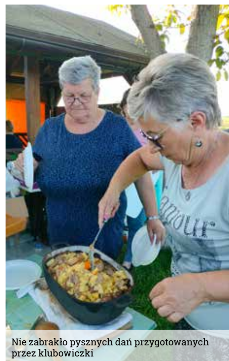
Nie zabrakło pysznych dań przygotowanych przez klubowiczki