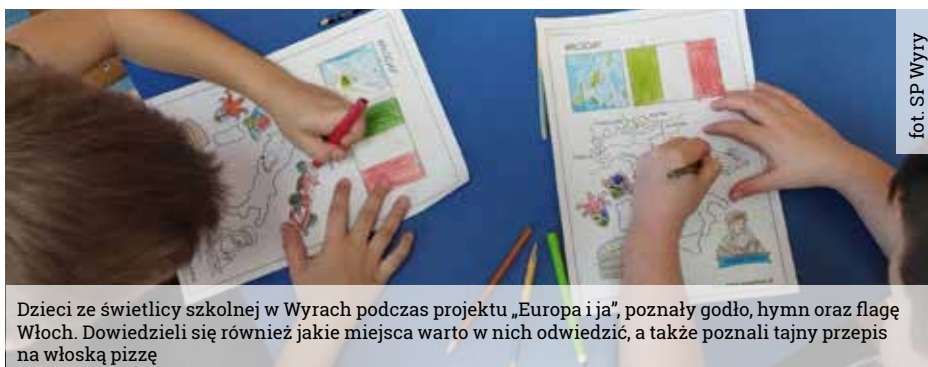
Dzieci ze świetlicy szkolnej w Wyrach podczas projektu „Europa i ja”, poznali godło, hymn oraz flagę Włoch. Dowiedzieli się również jakie miejsca warto w nich odwiedzić, a także poznali tajny przepis na włoską pizzę