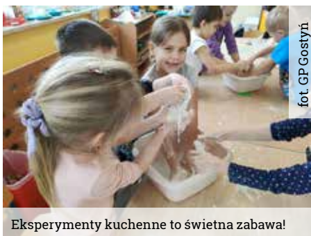
Eksperymenty kuchenne to świetna zabawa!

cieczą nienewtonowską. Kolejne wiosenne już eksperymenty przybliżyły przedszkolaków do wiedzy o powietrzu. Dzieci poznały co to jest opór powietrza, zapoznały się z działaniem spadochronu, latawca czy wiatraka. Miały okazję przeprowadzać eksperymenty i „sztuczki” z powietrzem przy użyciu różnych przedmiotów – balonów, woreczków, słomek, kartek papieru czy torby Bernoullie-