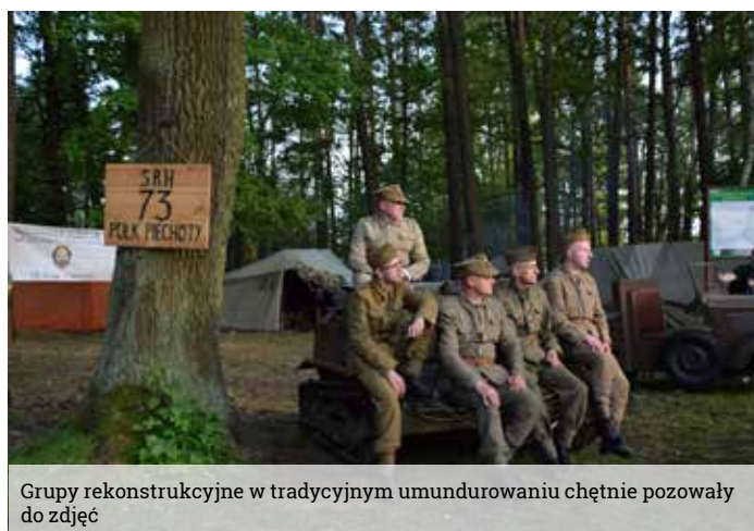
Grupy rekonstrukcyjne w tradycyjnym umundurowaniu chętnie pozowały do zdjęć