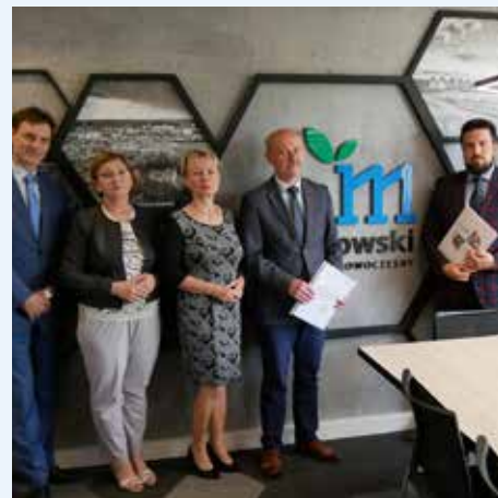
Podpisanie umowy poręczeniowej odbyło się w starostwie

Nie jest tajemnicą, że sytuacja szpitali, szczególnie powiatowych jest trudna w całym kraju. Pomimo trudności z bieżącym funkcjonowaniem, w tym roku wartość kontraktu placówki z NFZ wzrosła o 15 procent. Wśród planów spółki znajduje się także rozbudowa pracowni endoskopowej oraz uruchomienie dziennej pracowni chemioterapii.