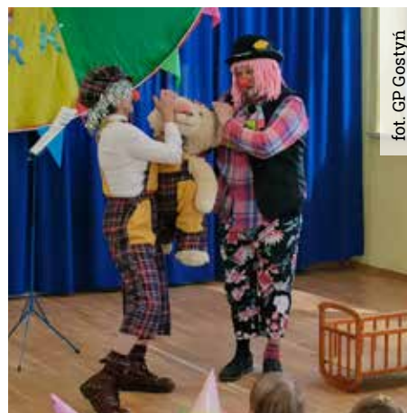
fol. GP Gostyni

W gostyńskim przedszkolu dobrą zabawę zapewнили klauni