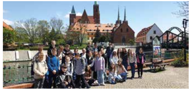
Siódmoklasiści we Wrocławiu