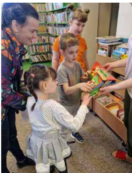
Wizyta wychowanków Ośrodka Rehabilitacyjno-Edukacyjno-Wychowawczego w Wyrach