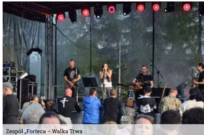
Zespół „Forteca – Walka Trwa