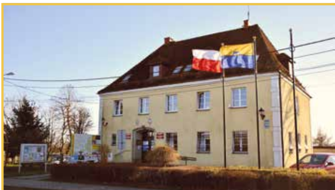
Urząd Gminy Wyry, ul. Główna 133, 43-175 Wyry Tel. (32) 325 68 00, Fax. (32) 325 68 09