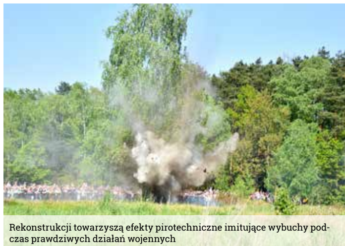
Rekonstrukcji towarzyszą efekty pirotechniczne imitujące wybuchy podczas prawdziwych działań wojennych