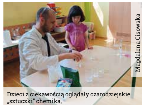
Dzieci z ciekawością oglądały czarodziejskie „sztuczki” chemika,