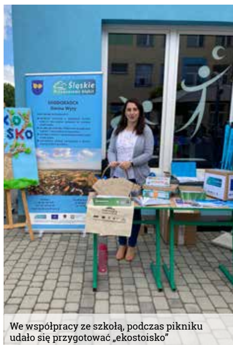
We współpracy ze szkołą, podczas pikniku udało się przygotować „ekostoisiko”

3 czerwca odbyło się spotkanie Ekodoradcy z uczniami Szkoły Podstawowej w Wyrach. We współpracy ze szkołą udało się przygotować wspaniałe „ekostoisiko”, za co serdecznie dziękujemy.