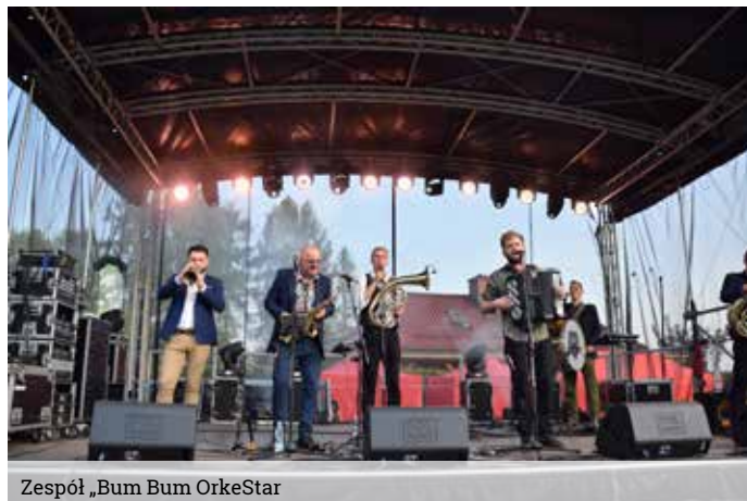
Zespół „Bum Bum OrkeStar