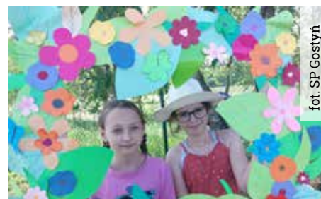
fol. SP Gostyni

Na pikniku w Gostyni wszyscy bardzo chętnie robili sobie pamiątkowe zdjęcia w fotobudce