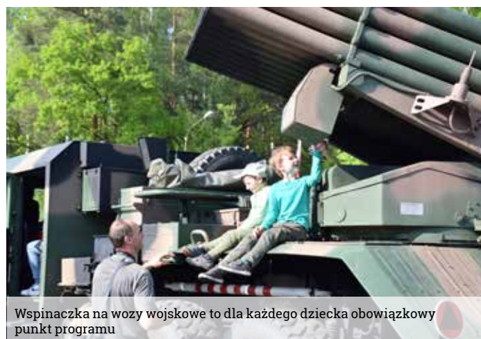
Wspinaczka na wozy wojskowe to dla każdego dziecka obowiązkowy punkt programu