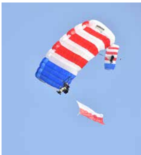
Skoki spadochronowe w wykonaniu sekcji aeroklubu Bielsko Biala

Muzealna Grupa Historyczna im II / 18pp z Sochaczewa, Grupa Rekonstrukcji Historycznej „Grzmot” 1. Morskiego Pułku Strzelców ze Słupska, Grupa Rekonstrukcji Historycznej 3 Pułk Strzelców Podhalańskich, Stowarzyszenie Historyczne FELD-GRAU, Grupa Rekonstrukcji Historycznej Helle Berg, Stowarzyszenie Rekonstrukcji Historycznej Die Kampfgruppe Hoffmeyer, Stowarzyszenie Rekonstrukcji Historycznej AA 7, Grupa Rekonstrukcji Historycznej 24