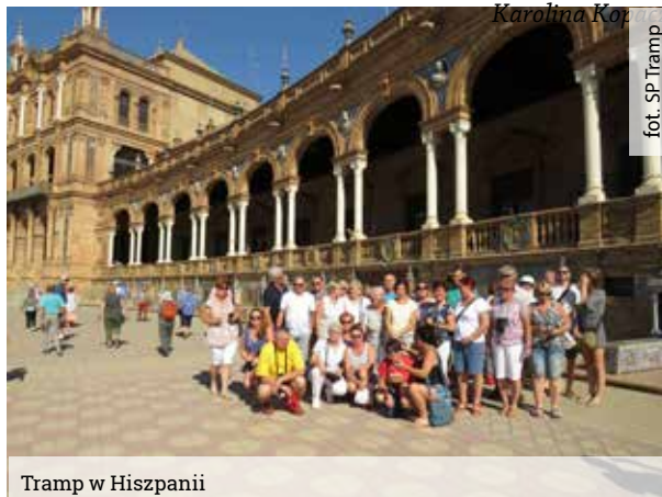
Tramp w Hiszpanii

Członkowie Stowarzyszenia Podróżników Tramp, 12 maja spotkali się na spotkaniu podsumowującym 10 lat ich działalności. Była to wyjątkowa okazja wspominając wyjazdy te dalekie i te nieco bliższe i pomarzyć o kolejnych pięknych podróżach.