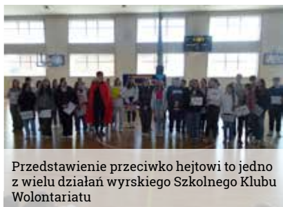
Przedstawienie przeciwko hejtowi to jedno z wielu działań wyrskiego Szkolnego Klubu Wolontariatu