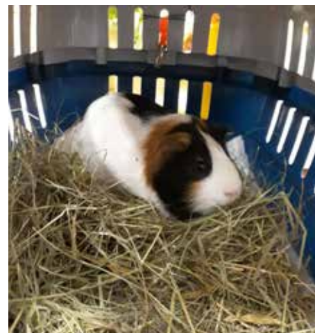
Wyrska szkoła zorganizowała wystawę zwierząt, na której uczniowie mogli zobaczyć pupili swoich kolegów ze szkolnej ławki