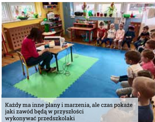
Każdy ma inne plany i marzenia, ale czas pokaże jaki zawód będą w przyszłości wykonywać przedszkolaki