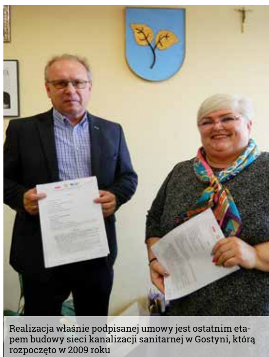
Realizacja właśnie podpisanej umowy jest ostatnim etapem budowy sieci kanalizacji sanitarnej w Gostyni, którą rozpoczęto w 2009 roku