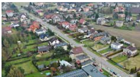
Etap II przebudowy drogi jest współfinansowany z Rządowego Funduszu Polski Ład: Programu Inwestycji Strategicznych. W kwietniu, Bank Gospodarstwa Krajowego udzielił Województwu Śląskiemu promesy na kwotę 65 mln zł

Wkrótce ruszy jedna z najbardziej i najdłuższej wyczekiwanych przez mieszkańców Gminy Wyr inwestycji. 13 kwietnia w Urzędzie Marszałkowskim Województwa Śląskiego podpisana została umowa na przebudowę drogi wojewódzkiej nr 928 na odcinku od DK 44 w Mikołowie, do skrzyżowania z DK 1 w Kobiórze. Przebudowa, która będzie realizowana w trzech etapach, potrwa do wiosny 2026 roku. Inwestycję za ponad 245 mln zł zrealizuje spółka Budimex.