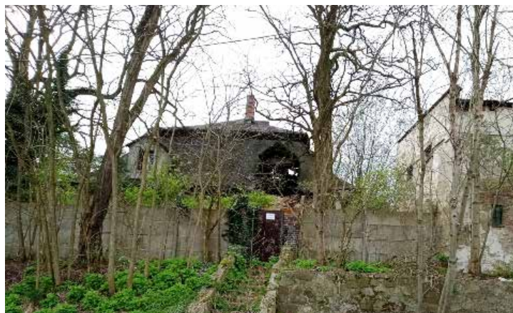
Ruiny schodów prowadzących do dworu