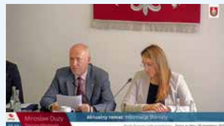
Kwietniowa sesja Rady Powiatu

Radni jednogłośnie podjęli uchwałę o podwyższeniu kapitału zakładowego spółki Centrum Zdrowia o kwotę 1,5 mln zł oraz objęciu wszystkich 15 000 nowo utworzonych udziałów w spółce przez powiat mikołowski.