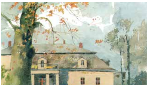
Akwarela autorstwa Sonii i Ireneusza Botorów przedstawiająca zabudowania dawnego dworu