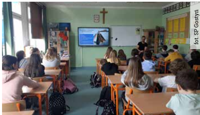
Zajęcia profilaktyczne zwracające uwagę na problem uzależnień wśród młodzieży regularnie odbywają się w gostyńskiej szkole