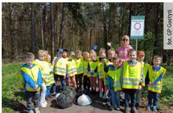
fol. GP Gostyni