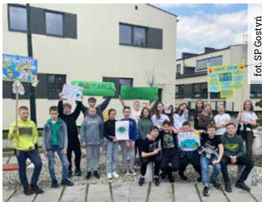
fol. SP Gostyni