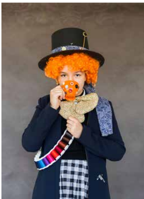
Poznajecie tę postać literacką? Tak, to Szalony Kapelusznik z Alicji w Krainie Czarów!

Tegoroczne święto książki, w Szkole Podstawowej w Wyrach obchodziliśmy przez kilka dni. Obchody rozpoczęliśmy od wycieczki klasy VIIa do najstarszej drukarni na Śląsku – „Tolek” w Mikołowie – podczas której uczniowie mogli poznać historię drukarni, zapoznać się z etapami powstawania książki i materiałów promocyjnych oraz poznać tajniki pracy w drukarni. W dniach od 24-26 kwietnia odbyła się Biblioteczna Gra QR „Czy znasz książki dla dzieci i młodzieży?” skierowana do klas IV-VI i VII-VIII, dla których przygotowano zostały osobne zestawy pytań. W tym czasie, uczniowie klas IV-VI przychodzili do biblioteki i szu-