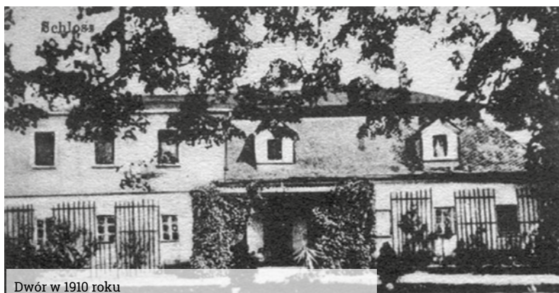
Dwór w 1910 roku

Zabudowania dawnego folwarku figurują w gminnej ewidencji zabytków. Stanowi ona ważny instrument ochrony dziedzictwa kulturowego oraz narzędzie prowadzenia bieżącej dokumentacji zabytków znajdujących się na terenie Wyr i Gostyni.