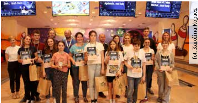
Mistrzostwa w Bowlingu odbyły się po raz pierwszy w historii Gminy Wyry, a ich gospodarzem był łazicki MOSiR