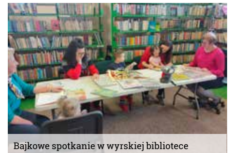
Bajkowe spotkanie w wyrskiej bibliotece