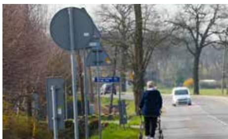
Mieszkańcy Wyr, Gostyni, Mikołowa i Kobióra będą musieli liczyć się ze sporymi utrudnieniami. Z racji pełnionej funkcji dojazdowej do posesji, droga nie może zostać całkowicie zamknięta