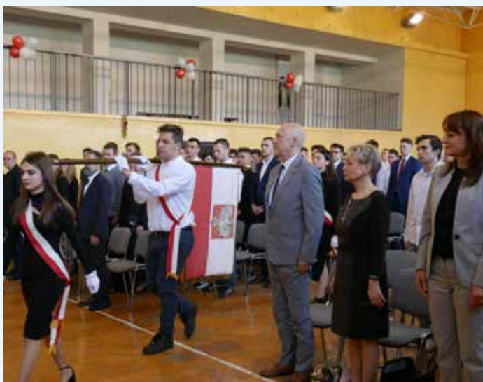
Akademia pożegnania absolwentów w Zespole Szkół Technicznych w Mikołowie