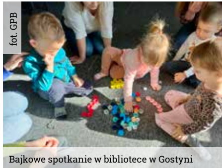
Bajkowe spotkanie w bibliotece w Gostyni

„Splątani”, będącego pierwszym tomem cyklu o tym samym tytule. Rozpoczynając „upiornie splątane tourne” pisarz zawitał do biblioteki w Wyrach wraz ze swoją najnowszą powieścią „Upiorni” – drugim tomem kończącym cykl „Splątani”. Akcja obu powieści toczy się na Śląsku, w miejscach autorowi bliskich i znanych. Gorąco zachęcamy do przeczytania powieści, a wszystkich, którzy chcieliby się spotkać z autorem „na żywo” zapraszamy na spotkanie 24 maja o godz. 17.00 do biblioteki w Gostyni.