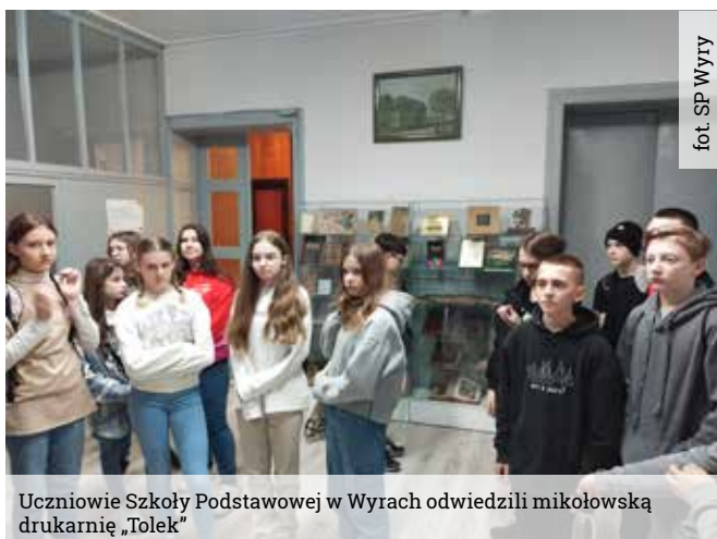
fol. SP Wyrach