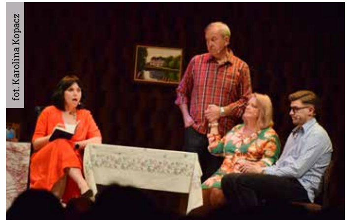
Bohaterowie komedii „Chop od mojej baby” bawili gostyńską publiczność do łez!