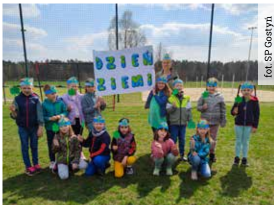
fol. SP Gostyni