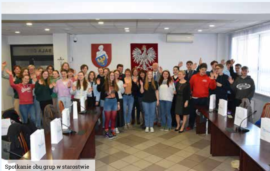
Spotkanie obu grup w starostwie

Grupa uczniów z miasta Bad Segeberg z kraju związkowego Szlezwik-Holsztyn przebywała na wymianie w powiecie mikołowskim goszcząc w I LO im. Karola Miarki w Mikołowie. Współpraca pomiędzy naszą szkołą a podobną placówką z Bad Segeberg, trwa ponad 20 lat. W tym roku 15 uczniów z Niemiec wraz z dwoma opiekunami gościła u nas od 25 kwietnia do 1 maja. Podczas pobytu goście mieszkali w domach swoich polskich rówieśników, uczestniczyli w lekcjach w Miarce, zwiedzili Kraków, Muzeum Śląskie w Katowicach, kopalnię Guido oraz były niemiecki obóz zagłady KL Auschwitz-Birkenau.