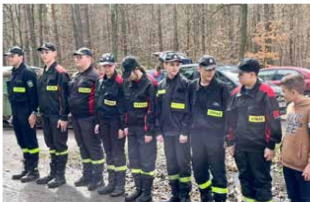
Jak co roku, na akcję stawili się młodzi druhowie ochotniczych straży pożarnych obu naszych miejscowości