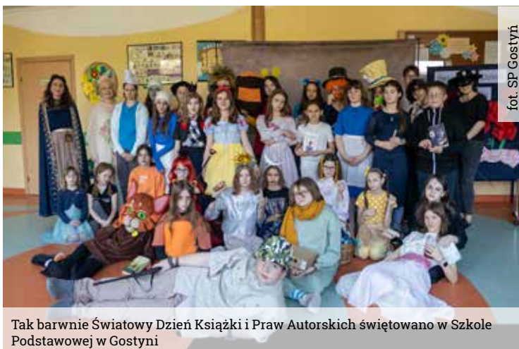
fol. SP Gostyni