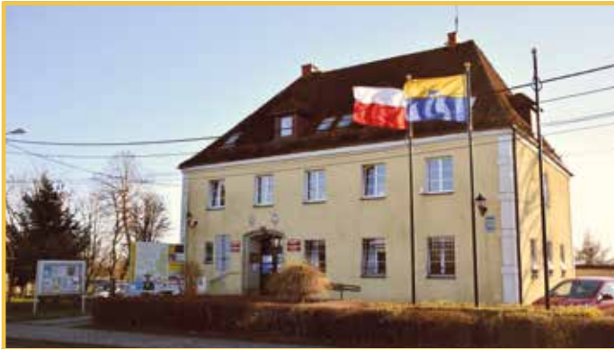
Urząd Gminy Wyrzy, ul. Główna 133, 43-175 Wyrzy Tel. (32) 325 68 00, Fax. (32) 325 68 09