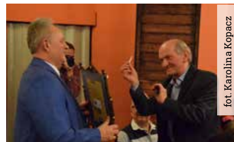
Podczas spotkania, przygotowano niespodzianki dla jego uczestników