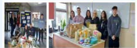
Plakat informujący o prowadzonej w szkołach zbiórce

spół Szkół Ponadpodstawowych w Orontowicach, 21 kwietnia – II LO im. Rotmistrza W. Pileckiego.