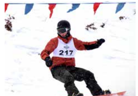
Drugi raz zawody obejmowały również kategorię snowboardu