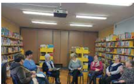
Wspólne czytanie poezji z uczestnikami Klubu Senior+ z Gostyni