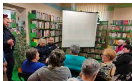
Spotkanie z policją w ramach Dnia Bezpiecznego Internetu