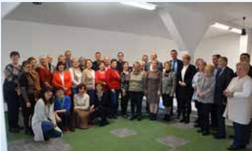
Wspólne zdjęcie uczestników posiedzenia

Omówiono także temat ankiet przygotowanych dla organizacji senioralnych, dystrybucji kart seniora oraz planowanego na maj Festiwalu Aktywności Senioralnej. Kolejne spotkanie Forum Seniorów Powiatu Mikołowskiego zaplanowano na 8 marca.