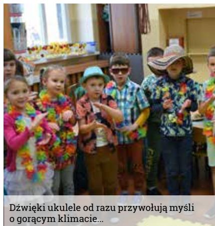
Dźwięki ukulele od razu przywołują myśli o gorącym klimacie...