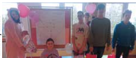
Świętowanie walentynki jest jednym z radośniejszych dni w roku