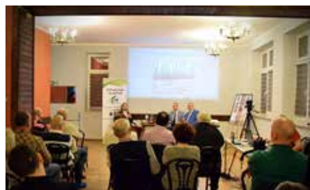
Prelekcja przyciągnęła wielu mieszkańców Gminy Wyry