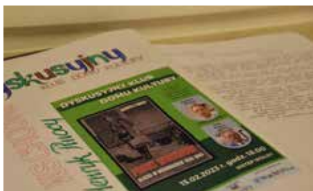
Było to pierwsze spotkanie Dyskusyjnego Klubu Domu Kultury w nowym roku