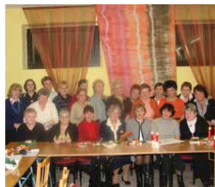
Spotkanie z poezją, rok 2009