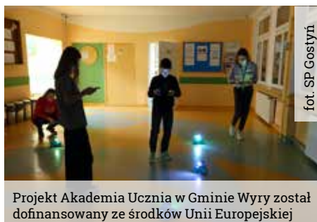
Projekt Akademia Ucznia w Gminie Wiry został dofinansowany ze środków Unii Europejskiej

Na początku zajęć każdy uczestnik przygotował dla siebie zdrową sałatkę owocową, zważył wybrane produkty, przeliczył odpowiednie jednostki, a także obliczył ilość kalorii. Kolejnym