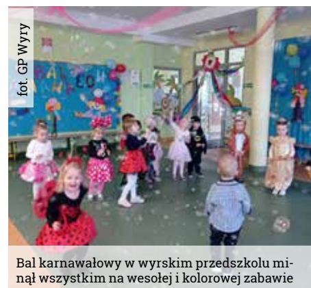
Bal karnawałowy w wyrskim przedszkolu miął wszystkim na wesołej i kolorowej zabawie

W obu budynkach Gminnego Przedszkola w Wyrach – 31 stycznia i 1 lutego – został zorganizowany Bal Karnawałowy, w którym uczestniczyły wszystkie grupy przedszkolaków. Szatnia specjalnie na tę okoliczność została zamieniona w salę balową, przyozdobiona w kolorowe balony, barwne wstęgi i serpentyny. Całość dopełniały wykonane hand-made z kolorowego kartonu postacie klaunów spoglądające na zabawę dzieci.