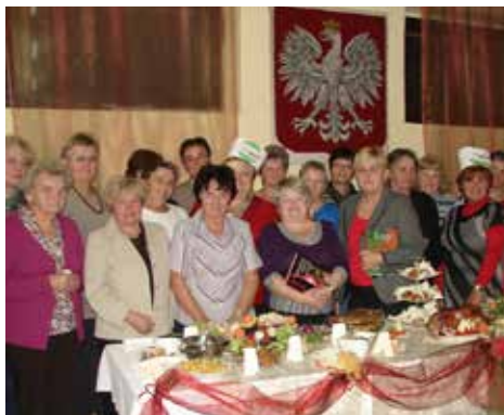
Ziemniaczane imprese, rok 2011