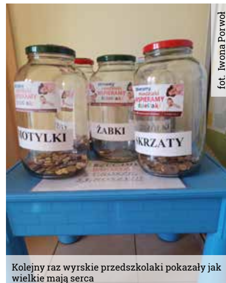
fol. Iwona Porwoł