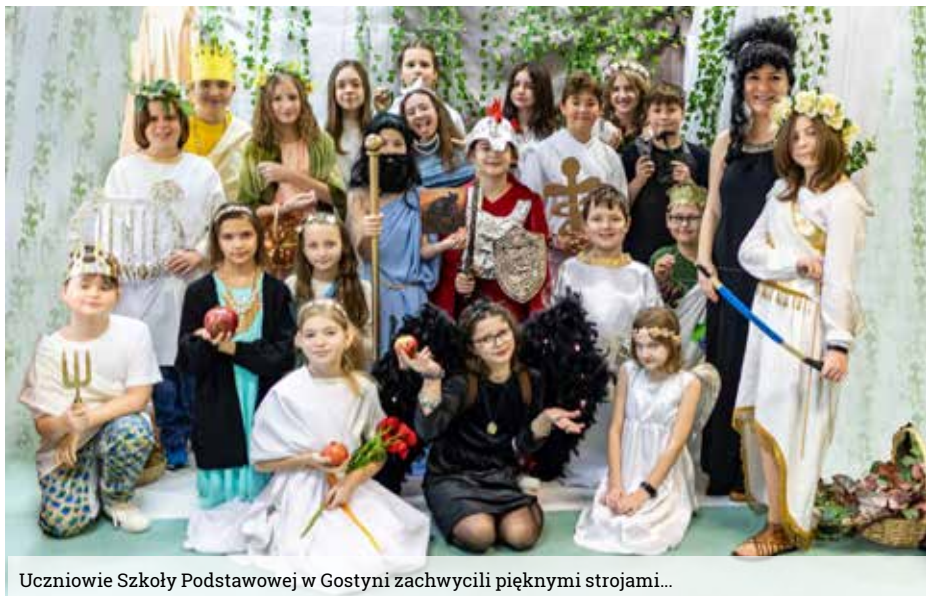
Uczniowie Szkoły Podstawowej w Gostyni zachwycili pięknymi strojami...