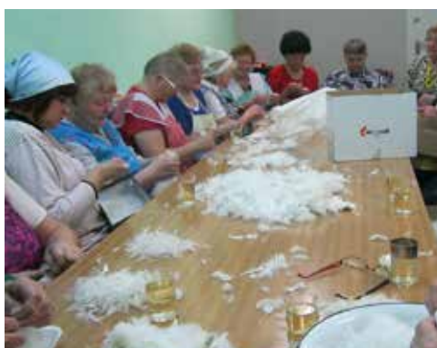
Wyszukubki w Klubie, rok 2014