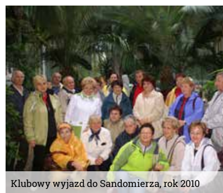
Klubowy wyjazd do Sandomierza, rok 2010