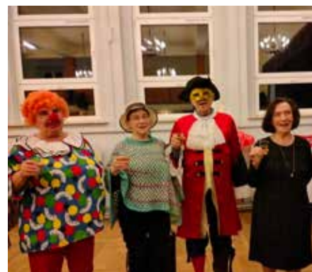
Przebrania tegorocznej jubileuszowej zabawy