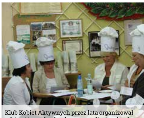
Klub Kobiet Aktywnych przez lata organizował także różnorodne konkursy, na zdjęciu – konkurs sałatkowy