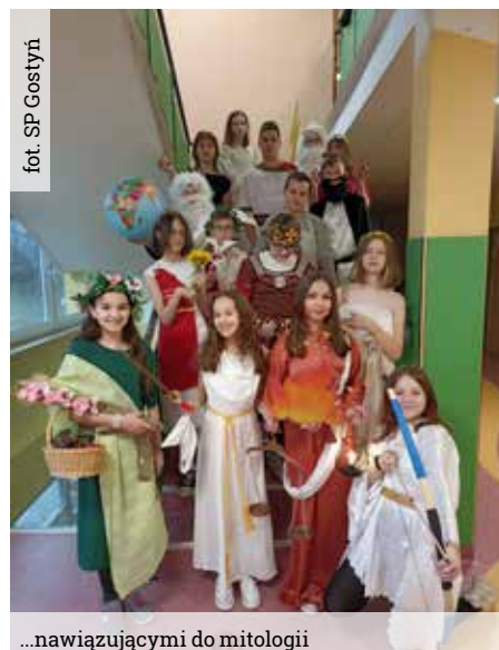
fol. SP Gostyni