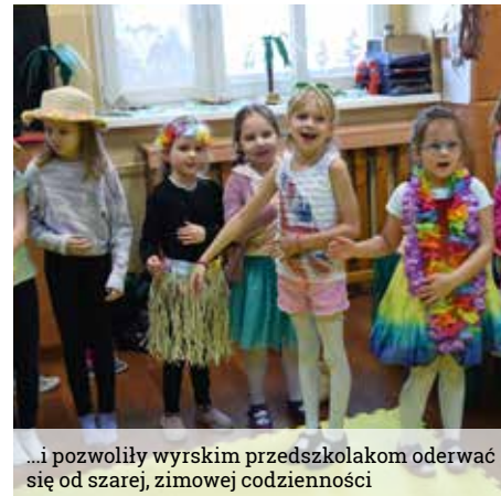
...i pozwoliły wyrskim przedszkolakom oderwać się od szarej, zimowej codzienności