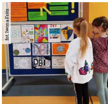
Podczas Dnia Bezpiecznego Internetu w Szkole Podstawowej w Wyrach, uczniowie, nauczyciele i rodzice mogli poszerzyć swoją wiedzę na temat bezpieczeństwa w sieci,