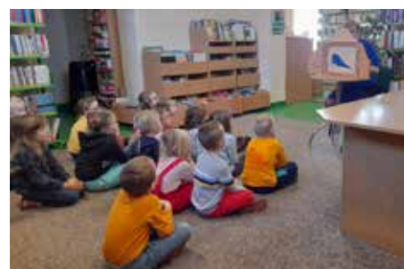
Bajkowe spotkanie z w bibliotece

Podczas lutowych „Bajkowych Spotkań”, poznawaliśmy różne znaczenia słowa zebra, świętowaliśmy na słodko Dzień Ciasta Marchewkowego, przygotowywaliśmy się do święta zakochanych, obchodziliśmy Dzień