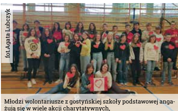
Młodzi wolontariusze z gostyńskiej szkoły podstawowej angażują się w wiele akcji charytatywnych.

którzy z różnych przyczyn znaleźli się w gorzej sytuacji życiowej, dlatego udział w akcji Szlachetna Paczka jest już szkolną tradycją. Czasem pomaganie miało słodki wymiar, jak podczas „Mikołajkowej zbiórki słodczy”, czy w trakcie akcji charytatywnej dla fundacji „Pomóż i Ty”, kiedy to wolontariusze sprzedawali upieczone przez siebie muffiny, odnosząc w ten sposób podwójny sukces. Udało się wspomóc leczenie chorej dziewczynki oraz wygrać nagrodę w konkursie charytatywnym, organizowanym przez tę fundację.