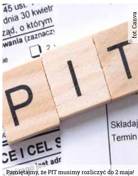
Pamiętajmy, że PIT musimy rozliczyć do 2 maja!

Szczegółową listę jednostek i stowarzyszeń działających na terenie Gminy Wyry można znaleźć na www.wyry.pl .