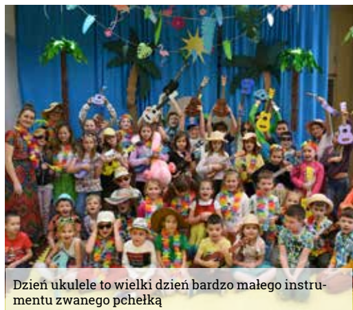
Dzień ukulele to wielki dzień bardzo małego instrumentu zwanego pchełką

Z tymi właśnie to wypami, Amerykańskimi stanami, Ukulele się kojarzy. By tam pobyc, każdy marzy. My w ten dzień cudny w przedszkolu, Pełen ciepła i kolorów, Czuliśmy się znakomicie. Zachwyceni takim życiem! Zachwyceni także graniem I wspólnym muzykowaniem. Z klasą trzecią z SP3 Śpiewaliśmy także my! Pod palmami, w blasku słońca Zabaw czas dobiegł wnet końca. I tak jak na powitanie,