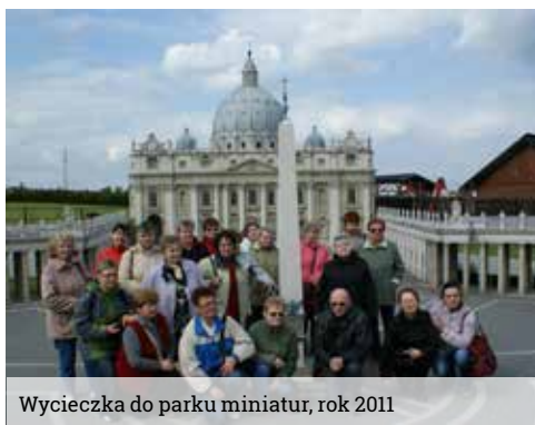
Wycieczka do parku miniatur, rok 2011