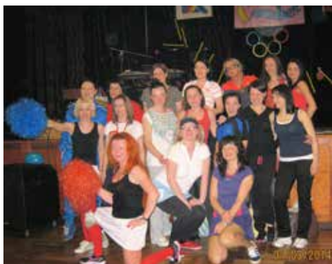
Babski Comber, rok 2014