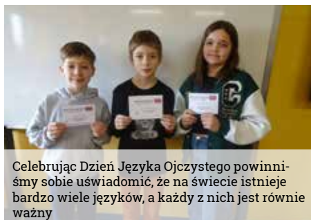
Celebrując Dzień Języka Ojczystego powinniśmy sobie uświadomić, że na świecie istnieje bardzo wiele języków, a każdy z nich jest równie ważny

Warto wspomnieć, że idea celebrowania tego wydarzenia narodziła się w 1999 roku jako upamiętnienie tragicznych wydarzeń w Dhace, kiedy zginęło pięcioro młodych ludzi domagających się uznania języka bengalskiego jako urzędowego. W bibliotece szkolnej uczniowie mogli wziąć udział w trzech konkurencjach: porządkowaniu związków frazeologicznych, tłumaczeniu trudnych słów oraz próbie artykulacyjnej „łamańca językowego”. Wszystkie konkursy cieszyły się wielkim zainteresowaniem uczniów.