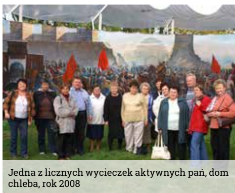
Jedna z licznych wycieczek aktywnych pań, dom chleba, rok 2008