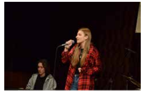
Zespół „Crash” to prawdziwa chluba domu kultury