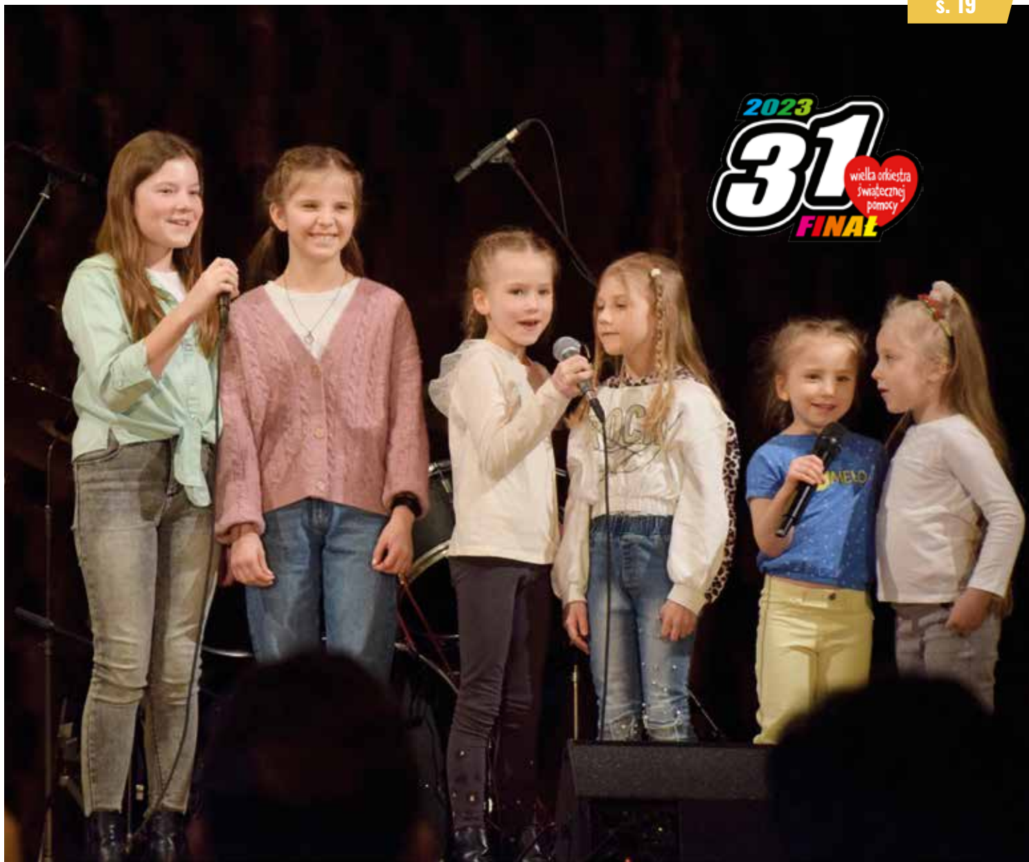
UCZESTNICZKI ZAJĘĆ WOKALNYCH W DOMU KULTURY W GOSTYNI