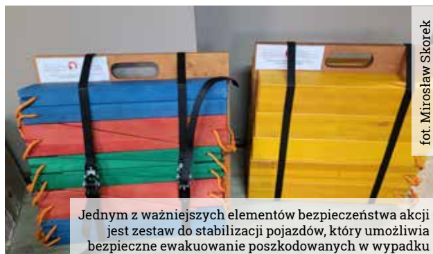
fol. Mirosław Skórek