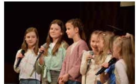
Były występy wokalne...