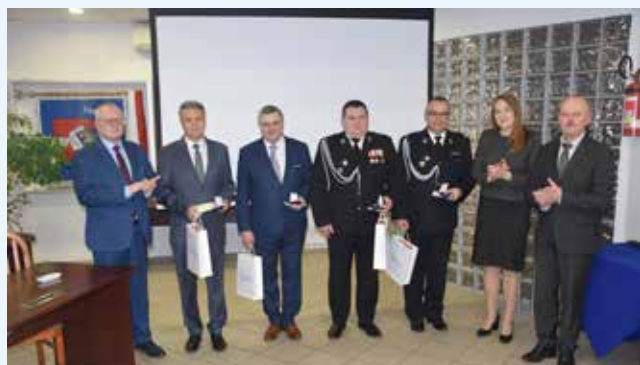
Ceremonia wręczenia srebrnych odznak za Zasługi dla Województwa Śląskiego