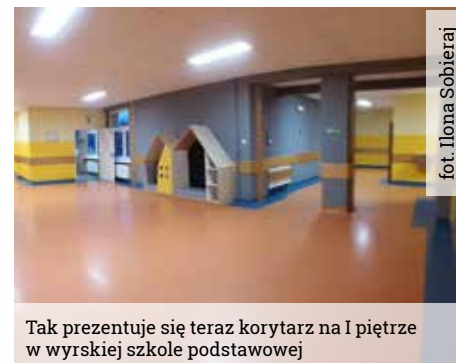
Tak prezentuje się teraz korytarz na I piętrze w wyrskiej szkole podstawowej