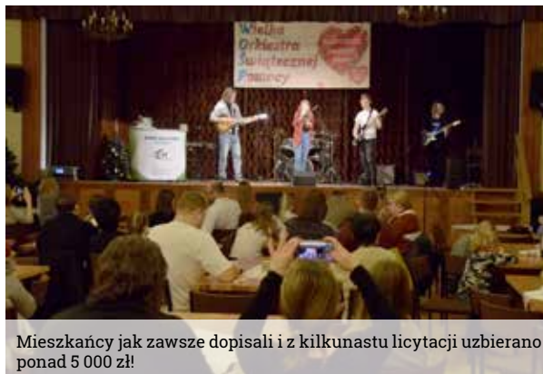
Mieszkańcy jak zawsze dopisali i z kilkunastu licytacji uzbierano ponad 5 000 zł!