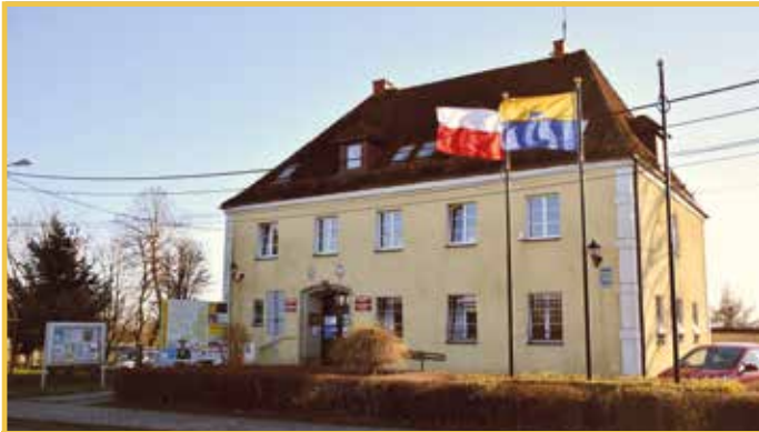
Urząd Gminy Wyrach, ul. Główna 133, 43-175 Wyrach Tel. (32) 325 68 00, Fax. (32) 325 68 09