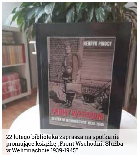
22 lutego biblioteka zaprasza na spotkanie promujące książkę „Front Wschodni. Służba w Wehrmachcie 1939-1945”