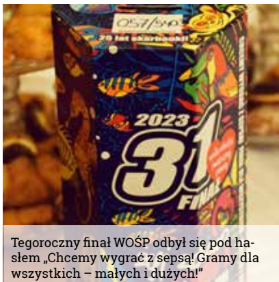
Tegoroczny finał WOŚP odbył się pod hasłem „Chcemy wygrać z sepsą! Gramy dla wszystkich – małych i dużych!”