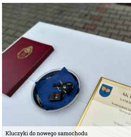
Kluczyki do nowego samochodu