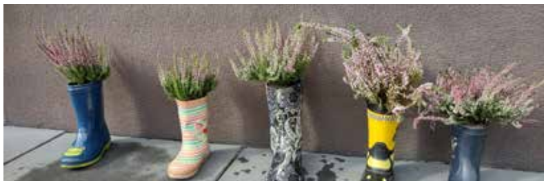
Nie masz w domu doniczki? Żaden problem! Przedszkolaki udowodniły, że wystarczą Ci stare kalosze!

Zaczął się piękny, jesienny wrzesień. Do naszych przedszkolnych sal zawitały kolorowe akcenty przypominające o nadchodzącej porze roku. Piękne wielobarwne liście, kosze z kasztanami i żołędziami, dynie, orzechy i wiele innych darów Pani Jesieni zdobi nasze grupowe kącki w salach. Przed przedszkolem również zawitała jesień. Kangurki z Gminnego Przedszkola w Gostyni już drugi rok biorą udział w projekcie „Z darami natury świat nie jest ponury”. Błotne zabawy, kartonowe samochody i malowanie patykami znalezionymi na spacerze pozostanie w pamięci dzieci na długo. W tym roku rozpoczęliśmy przygodę z ogólnopolskim projektem edukacyjnym