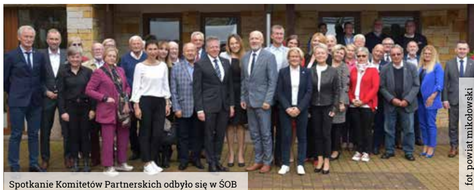
Spotkanie Komitetów Partnerskich odbyło się w SOB