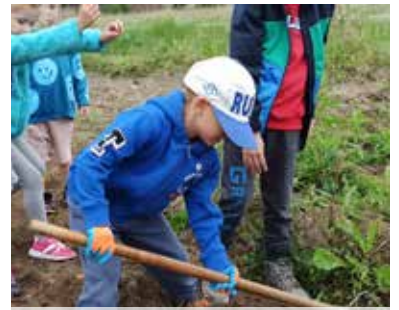
Wykopki okazały się dla dzieci niesamowitą atrakcją!