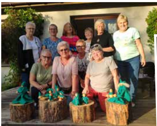
Panie z Klubu Kobiet Aktywnych prezentują własnoręcznie wykonane, ziemniaczane figurki

malowanej wsi. Malowidła, które były we wsi dosłownie wszędzie, zrobiły na nas wielkie wrażenie. Było to po prostu piękne. Dalej udaliśmy