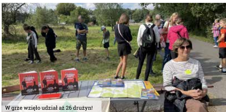
W grze wzięło udział aż 26 drużyn!