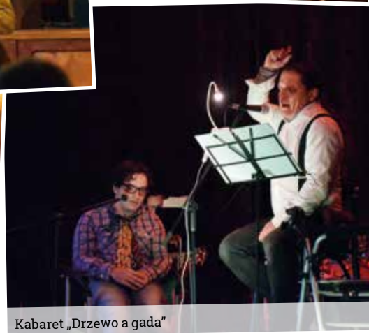
Kabaret „Drzewo a gada”