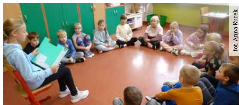
Celem Dnia Głośnego Czytania jest propagowanie czytelnictwa wśród dzieci