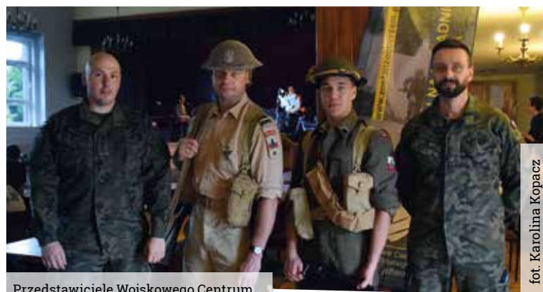
Przedstawiciele Wojskowego Centrum Rekrutacji z Tychów oraz Studenckiego Koła Naukowego Historyków Uniwersytetu Śląskiego

Zazwyczaj festyny odbywają się w Zagrodzie Śląskiej, ale ze względu na bardzo niepewną pogodę, publiczność została zaproszona do domu