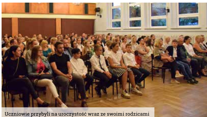
Uczniowie przybyli na uroczystość wraz ze swoimi rodzicami