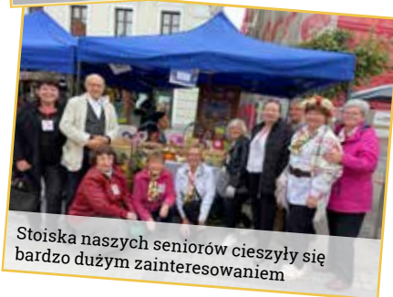
Stoiska naszych seniorów cieszyły się bardzo dużym zainteresowaniem