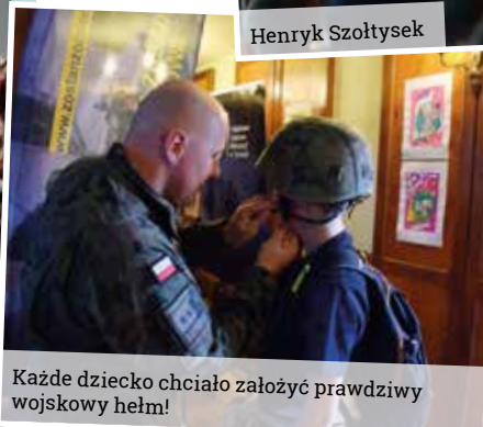
Każde dziecko chciało założyć prawdziwy wojskowy hełm!