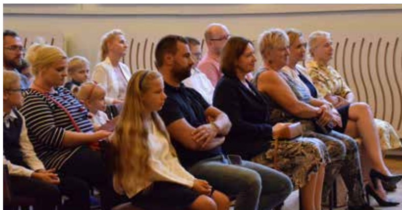
W wydarzeniu wzięli udział również dyrektorzy gminnych placówek oświatowych, przewodnicząca komisji edukacji, a także sekretarz gminy