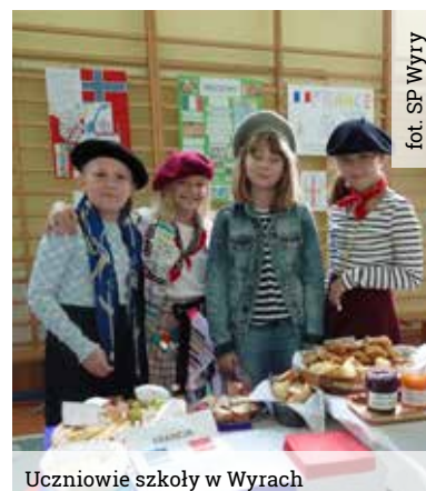
Uczniowie szkoły w Wyrach

Podczas przerw, przy wesołej muzyce w różnych językach, miała miejsce degustacja dań europejskich przygotowanych przez uczniów. Wydarzenie to cieszyło się ogromną popularnością. Stoiska z potrawami były oblegane przez uczniów, a poczęstunek był przepyszny. Wszyscy uczniowie byli żywo zaangażowani w to emocjonujące wydarzenie, wielu założyło w tym dniu specjalne ubra-