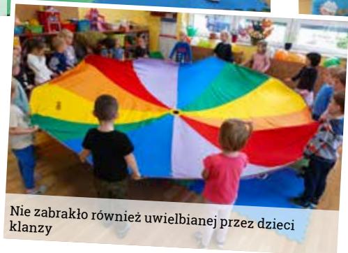
Nie zabrakło również uwielbianej przez dzieci klanzy

Również w Gminnym Przedszkolu w Wyrach w tym dniu na przedszkolaków czekało wiele atrakcji. Już od samego rana budynek przedszkola witał balonami i serpentynami. Główną atrakcją dnia był seans filmowy z biletami wstępu i popcornem do schrupania, co sprawiło, że przedszkolaki poczuli się jak w prawdziwym kinie. Kolejną atrakcją była fotobudka z rekwizytami do zdjęć, gdzie każdy przedszkolak mógł poczuć się wyjątkowo.