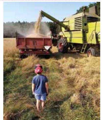
III miejsce – Krystian Dziubany