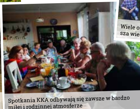
Spotkania KKA odbywają się zawsze w bardzo miłej i rodzinnej atmosferze

się do Tarnowa, gdzie historię miasta opowiedział przewodnik, pokazując miejsca, które w mieście należy obejrzeć.