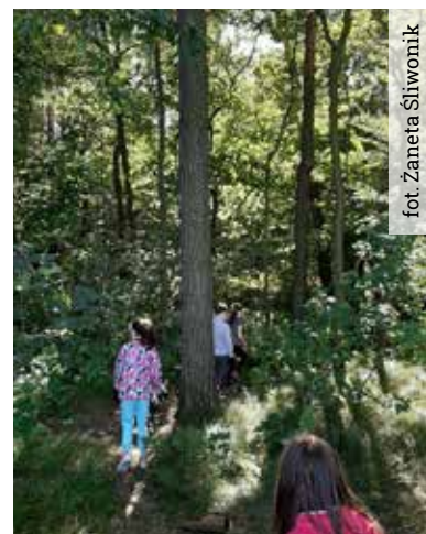
fol. Żaneta Śliwonik