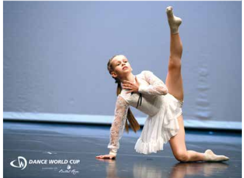
Gostynianka podczas występu konkursowego na międzynarodowych zawodach tanecznych Dance World Cup 2022 w Hiszpanii