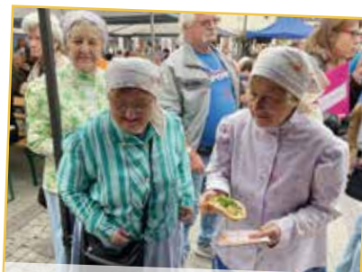
Seniorzy z Gminy Wyr przygotowali pyszny poczęstunek...