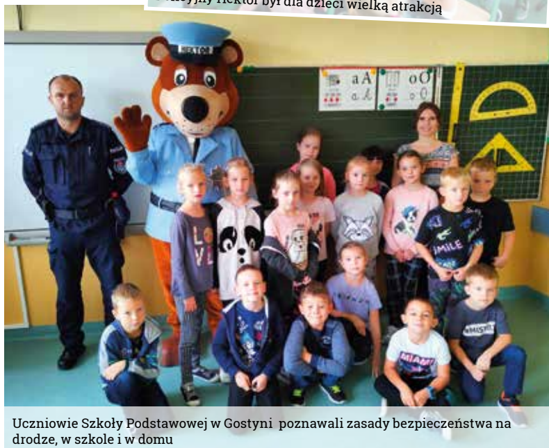
Uczniowie Szkoły Podstawowej w Gostyni poznawali zasady bezpieczeństwa na drodze, w szkole i w domu