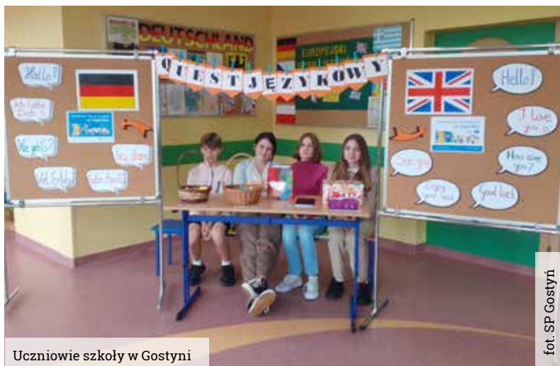
Uczniowie szkoły w Gostyni