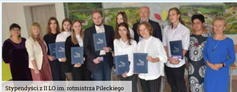
Stypendyści z II LO im. rotmistrza Pileckiego

Pierwszą, w której je wręczono, był Zespół Szkół nr 2 Specjalnych – odebrało je dwoje uczniów. W II LO im. rotmistrza Witolda Pileckiego było to 12 osób, zaś w I LO im. Karola Miarki – 76. Dzień wcześniej Nagrody wręczali starosta Mirosław Duży wraz z towarzyszącymi mu