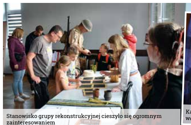
Stanowisko grupy rekonstrukcyjnej cieszyło się ogromnym zainteresowaniem