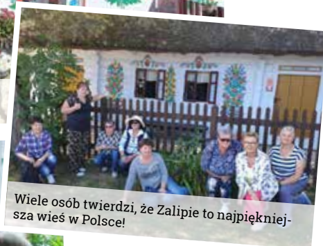
Wiele osób twierdzi, że Zalipie to najpiękniejsza wieś w Polsce!