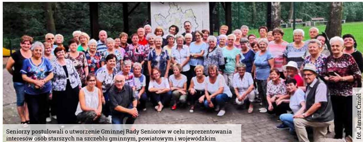
Seniorzy postulowali o utworzenie Gminnej Rady Seniorów w celu reprezentowania interesów osób starszych na szczeblu gminnym, powiatowym i wojewódzkim