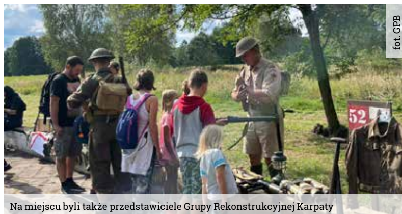
Na miejscu byli także przedstawiciele Grupy Rekonstrukcyjnej Karpaty