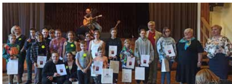
Podsumowanie zmagania i ogłoszenie 10 najlepszych drużyn odbyło się w domu kultury podczas festynu z okazji pożegnania wakacji

O godz. 18.00 w domu kultury, podczas trwającego gminnego festy-