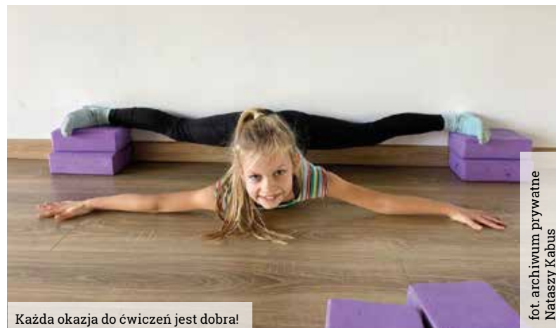
Każda okazja do ćwiczeń jest dobra!