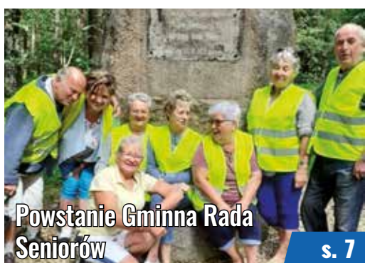
Powstanie Gminna Rada Seniorów