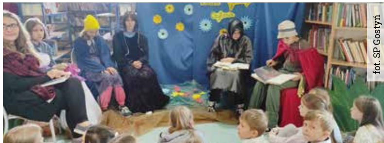
W szkole w Gostyni, starsze dzieci czytały swoim młodszym koleżankom i kolegom