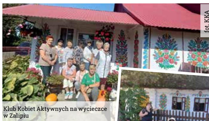
Klub Kobiet Aktywnych na wycieczce w Zalipiu