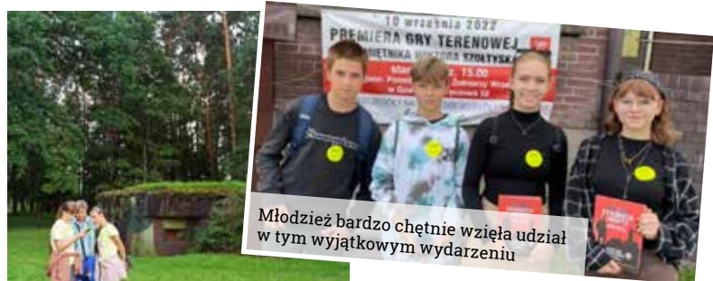
Młodzież bardzo chętnie wzięła udział w tym wyjątkowym wydarzeniu