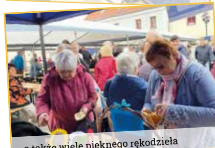
...a także wiele pięknego rękodzieła