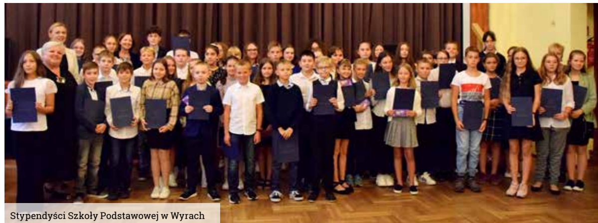
Stypendyści Szkoły Podstawowej w Wyrach