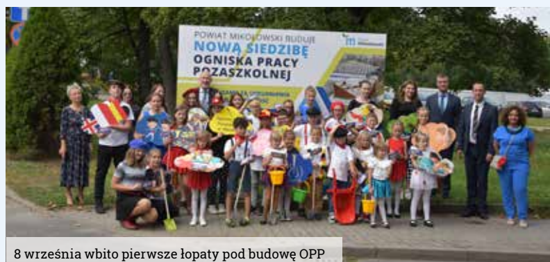
8 września wbito pierwsze łopaty pod budowę OPP

Jeśli chcecie Państwo otrzymywać powiadomienia o możliwych utrudnieniach w związku z budową, które mogą dotyczyć zarówno pieszych jak i kierowców, prosimy o przesłanie wiadomości e-mail na adres media@mikolow.starostwo.gov.pl.