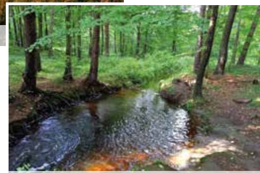
III miejsce – Bernadetta Dziubany

media społecznościowe. Warto podkreślić, że niektórzy robili to po raz pierwszy. Gratulujemy!