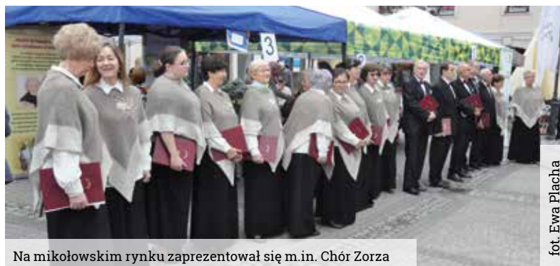
Na mikołowskim rynku zaprezentował się m.in. Chór Zorza