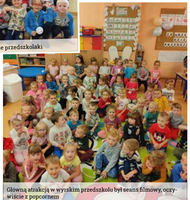
Główną atrakcją w wyrskim przedszkolu był seans filmowy, oczywiście z popcornem