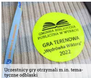
Uczestnicy gry otrzymali m.in. tematyczne odblaski