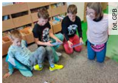
Na zajęciach dzieci poznają podstawy programowania, wykorzystując do tego roboty, klocki i gry interaktywne

necie w 2030 roku. Pomagając mu, uczestnicy zdobywali punkty i przechodzili do kolejnych etapów podróży. W ten sposób poprzez zabawę poznali