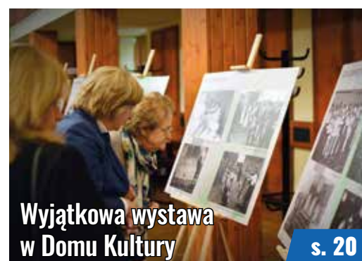
Wyjątkowa wystawa w Domu Kultury