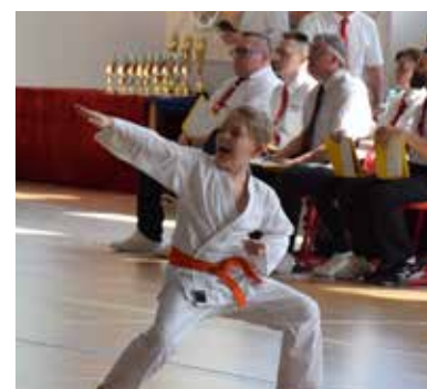
Organizatorem zawodów było Stowarzyszenie Sztuk i Sportów Walki „Wojownik” przy wsparciu Gminy Wiry