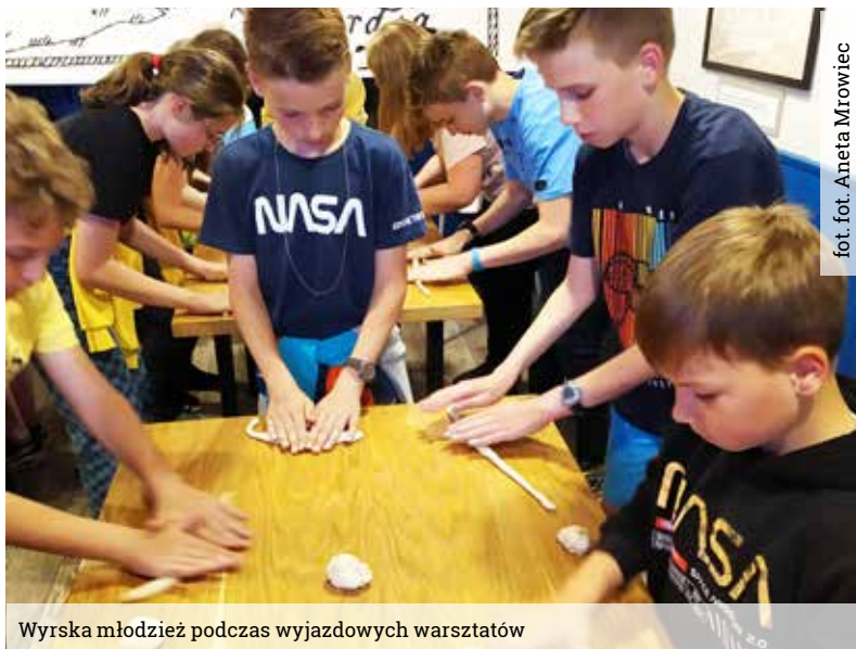
fot. Aneta Mrowiec