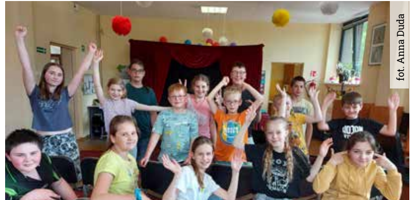
fot. Anna Duda