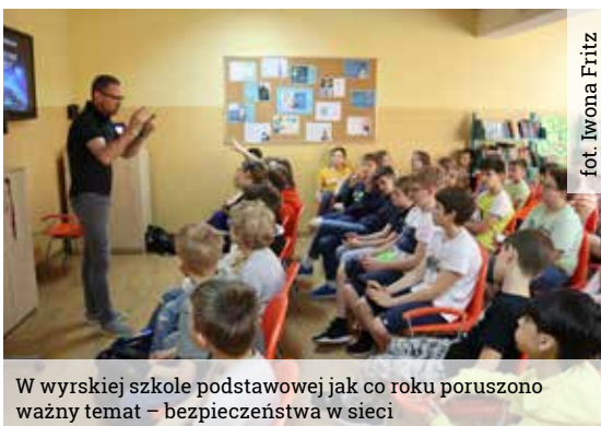
W wyrskiej szkole podstawowej jak co roku poruszono ważny temat – bezpieczeństwa w sieci