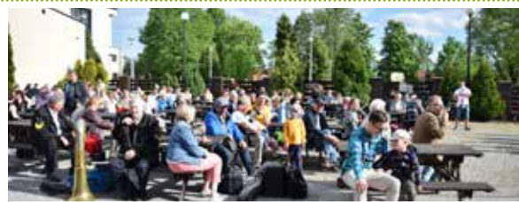
Zagroda Śląska w Gostyni wypełniła się po brzegi