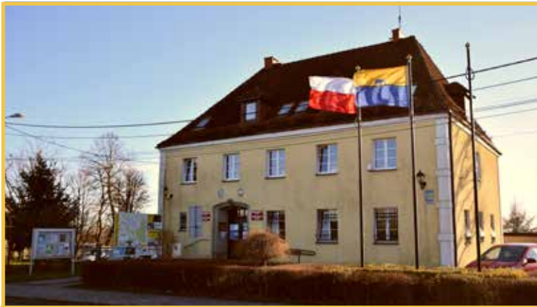
Urząd Gminy Wyry, ul. Główna 133, 43-175 Wyry Tel. (32) 325 68 00, Fax. (32) 325 68 09