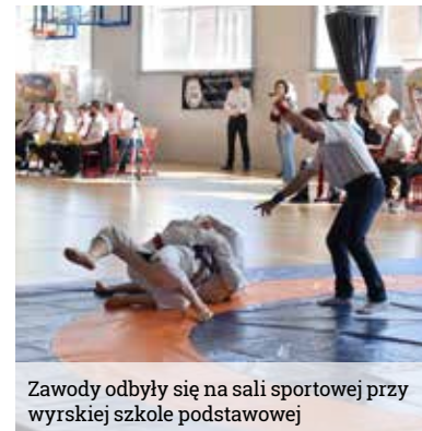
Zawody odbyły się na sali sportowej przy wyrskiej szkole podstawowej