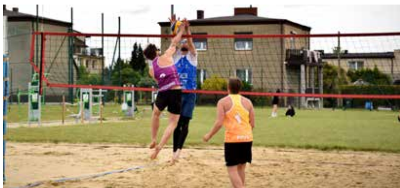
Zawody tradycyjnie odbyły się na boisku za Szkołą Podstawową w Gostyni