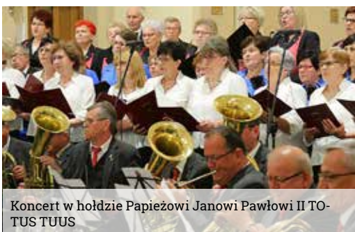
Koncert w hołdzie Papieżowi Janowi Pawłowi II TOTUS TUUS

29 maja odbył się jubileuszowy XV Koncert w hołdzie Papieżowi św. Janowi Pawłowi II „TOTUS TUUS”. Koncert miał miejsce w kościele MB Królowej Różańca Świe-