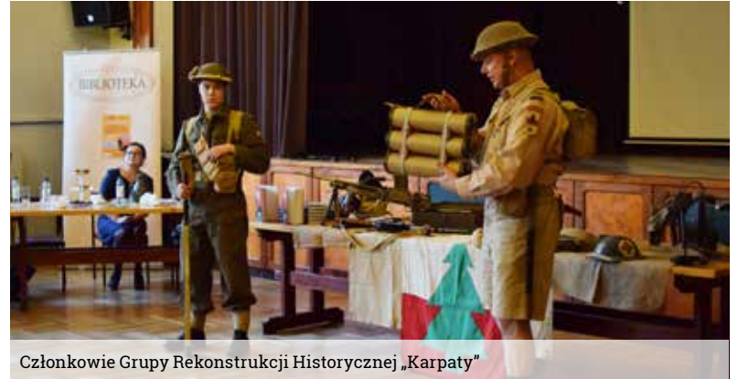
Członkowie Grupy Rekonstrukcji Historycznej „Karpatski”