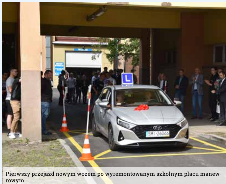
Pierwszy przejazd nowym wozem po wyremontowanym szkolnym placu manewrowym

Zakup samochodów do nauki jazdy został zrealizowany w ramach projektu „Efektywne Funkcjonalne Szkoły II – Program Rozwoju Szkół Zawodowych i Technicznych Powiatu Mikołowskiego”, współfinansowanego przez Unię Europejską ze środków Europejskiego Funduszu Społecznego w ramach Regionalnego Programu Operacyjnego Województwa Śląskiego na lata 2014 – 2020.