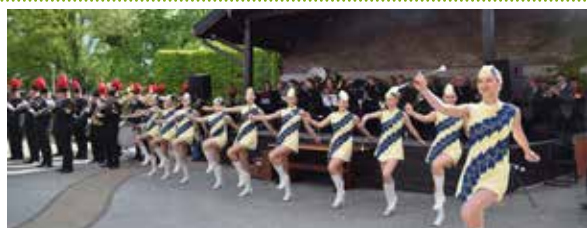
Podczas Festiwalu wystąpiły: Mażoretki Akcent oraz...