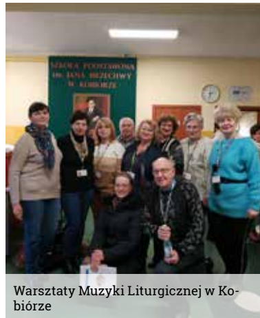
Warsztaty Muzyki Liturgicznej w Kobiórze

tego w Łaziskach Górnych. Organizatorem był chór Echo, a wystąpiły – poza Echem – również chóry Zorza i Jutrzenka ze Szczekowic oraz Orkiestra Dęta Tauron Wytwarzanie.