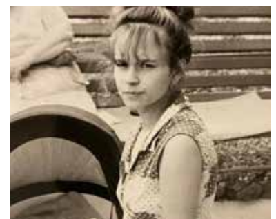
Wyróżnione zdjęcie mamy przesłane przez Monikę Harupę