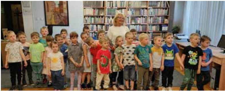
Akcja głośnego czytania przedszkolakom

Stowarzyszenie Bibliotekarzy Polskich, co rok w dniach 8-15 maja, organizuje Tydzień Bibliotek – program promocji czytelnictwa i bibliotek. Ma on na celu podkreślenie roli czytania i bibliotek w poprawie jakości życia,