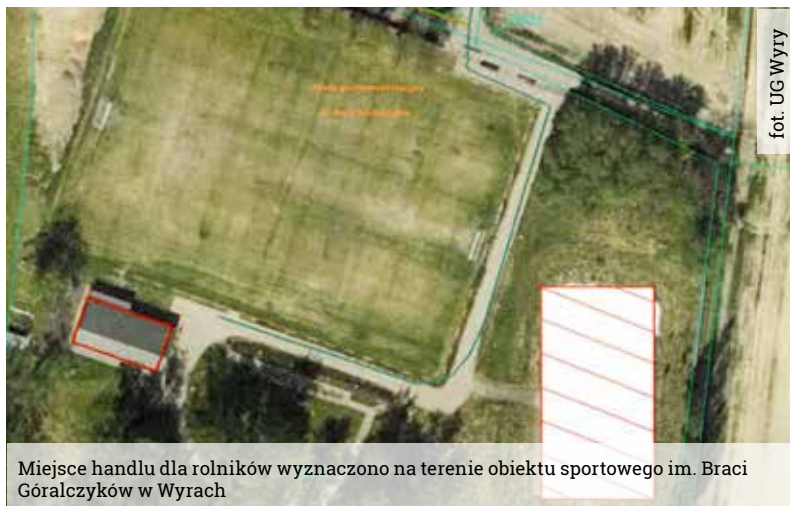
Miejsce handlu dla rolników wyznaczono na terenie obiektu sportowego im. Braci Góralczyków w Wyrzy

27 kwietnia odbyła się kolejna sesja Rady Gminy Wyrzy. Obrady zorganizowano w formie stacjonarnej. Głównym punktem posiedzenia było rozpatrzenie projektu uchwały w sprawie uchwalenia miejscowego planu zagospodarowania przestrzennego Wyrzy. Plan został przyjęty 14 głosami „za” i 1 głosem „wstrzymującym się”.