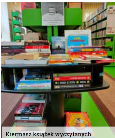
Kiermasz książek wyczytanych

Stowarzyszenie Bibliotekarzy Polskich, co rok w dniach 8-15 maja, organizuje Tydzień Bibliotek – program promocji czytelnictwa i bibliotek. Ma on na celu podkreślenie roli czytania i bibliotek w poprawie jakości życia,