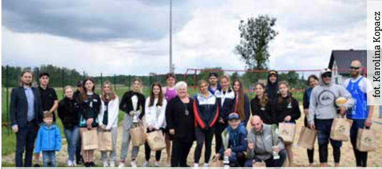
Uczestnikami siatkarskiej rywalizacji są nie tylko mieszkańcy Wyr i Gostyni, w tym roku w turnieju wzięli udział zawodnicy także spoza naszego województwa,

Na boisku do siatkówki plażowej w Gostyni, 28 maja, odbyły się kolejne Amatorskie Rozgrywki Siatkówki Plażowej o Puchar Wójta Gminy Wyrę. Uczestnikami siatkarskiej rywalizacji są nie tylko mieszkańcy Wyr i Gostyni, w tym roku w turnieju wzięli udział zawodnicy także spoza naszego województwa,