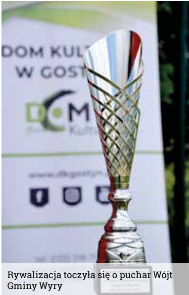
Rywalizacja toczyła się o puchar Wójta Gminy Wyrę

Do rywalizacji w tym roku przystąpiło w sumie 10 drużyn w dwóch kategoriach wiekowych z różnych stron naszego województwa i nie tylko!