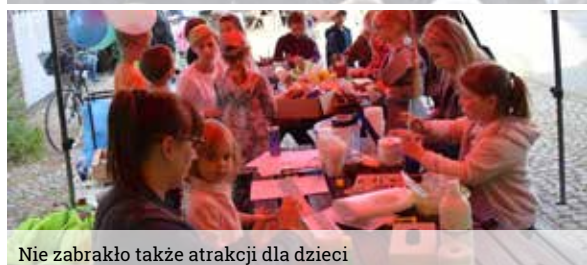
Nie zabrakło także atrakcji dla dzieci