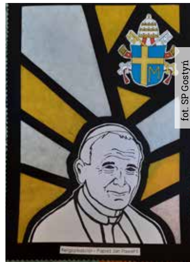
fol. SP Gostyn