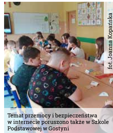
Temat przemocy i bezpieczeństwa w internecie poruszono także w Szkole Podstawowej w Gostyni