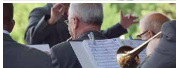
W tym roku orkiestry zagrały po raz piąty