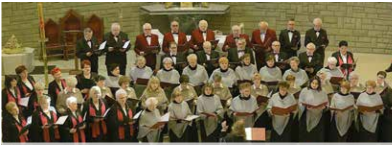
Koncert Pieśni Wielkopostnych

repertuaru naszego chóru o pieśni skomponowane przez kompozytora. Szeroko propagujemy pieśń