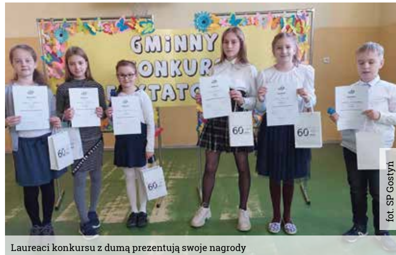
Laureaci konkursu z dumą prezentują swoje nagrody