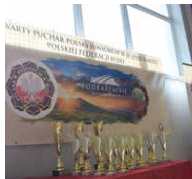
Puchary i medale czekały na zawodników