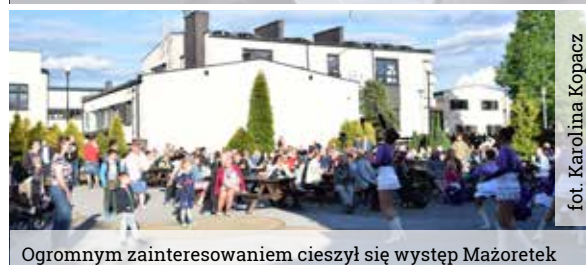
Ogromnym zainteresowaniem cieszył się występ Mażoretek