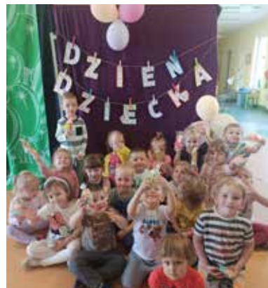
Uśmiech cały dzień nie schodził z dziecięcych twarzy!

W tym roku Dzień Dziecka w przedszkolu w Wyrach zaczęliśmy świętować wyjątkowo wcześniej, ponieważ już 30 maja. Świąteczną zabawę w obu