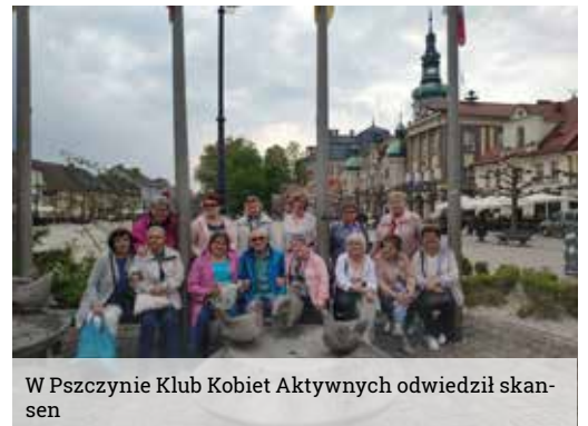
W Pszczynie Klub Kobiet Aktywnych odwiedził skansen

Warsztaty bardzo ciekawie prowadziła pracownica tamtejszego Skansenu, która pokazała dużo ziół i opowiedziała o ich działaniu. Przygotowana była także degustacja naparów. Następnym punktem wycieczki było zwiedzanie Skansenu z przewodnikiem, po czym uczestniczki udały się na kawę i lody do znanych każdemu kawiarenek w mieście.