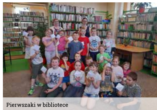
Pierwszaki w bibliotece

Wraz z Tygodniem Bibliotek rozpoczęliśmy kiermasz książek wyczytanych, w ramach którego można nabyć książki od symbolicznej złotówki. Cały dochód uzyskany z kiermaszu zostanie przeznaczony na zakup nowości książkowych dla bibliotek. Zapraszamy do włączenia się w akcję.