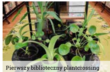
Pierwszy biblioteczny plantcrossing

Gminne biblioteki również włączyły się w te obchody i dużo się działo. Przez cały tydzień trwała akcja plantcrossingu, czyli bibliotecznej wymiany roślin. Pasjonaci, miłośnicy roślin i nie tylko, przychodząc do biblioteki mogli