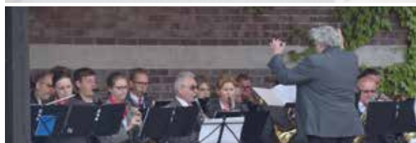
...Orkiestra Elektrowni Łaziska Tauron Wytwarzanie, Orkiestra Dęta KWK Halemba oraz Kapela Bolkova z KWK Bolesław Śmiały