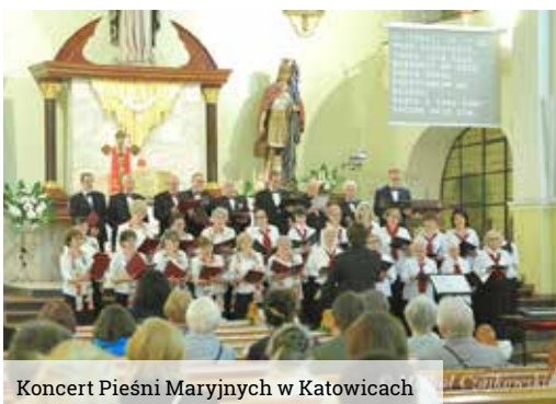
Koncert Pieśni Maryjnych w Katowicach

14 maja Zorza zaprezentowała się w repertuarze pieśni maryjnych. Koncert odbył się w koście-