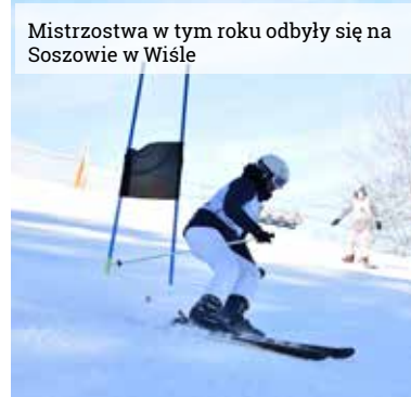
Mistrzostwa w tym roku odbyły się na Soszowie w Wiśle