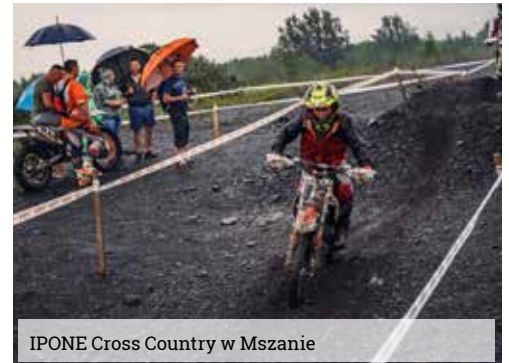
IPONE Cross Country w Mszanie