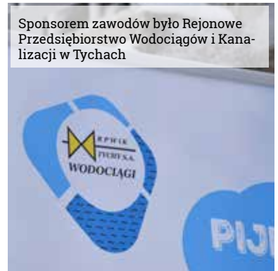
Sponsorem zawodów było Rejonowe Przedsiębiorstwo Wodociągów i Kanalizacji w Tychach