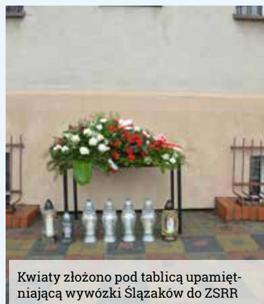
Kwiaty złożono pod tablicą upamiętniającą wywózki Ślązaków do ZSRR

Jak co rok ostatnia niedziela stycznia w województwie śląskim obchodzona jest jako Dzień Pamięci Tragedii Górnośląskiej 1945 roku. W powiecie mikołowskim rocznicowe uroczystości odbywają w Łaziskach Górnych, gdzie na ścianie Urzędu Miejskiego znajduje się tablica upamiętniająca wywózki Ślązaków w głąb ZSRR. Samorządowcy minutą ciszy uczcili pamięć ofiar.