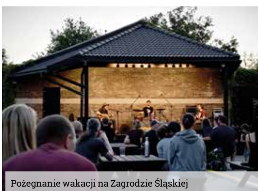
Pożegnanie wakacji na Zagrodzie Śląskiej