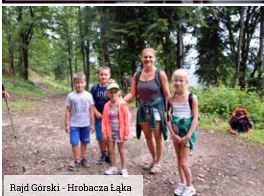
Rajd Górski - Hrobacza Łąka