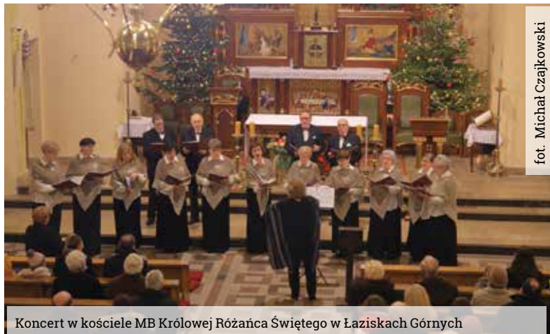
Koncert w kościele MB Królowej Różańca Świętego w Łaziskach Górnych