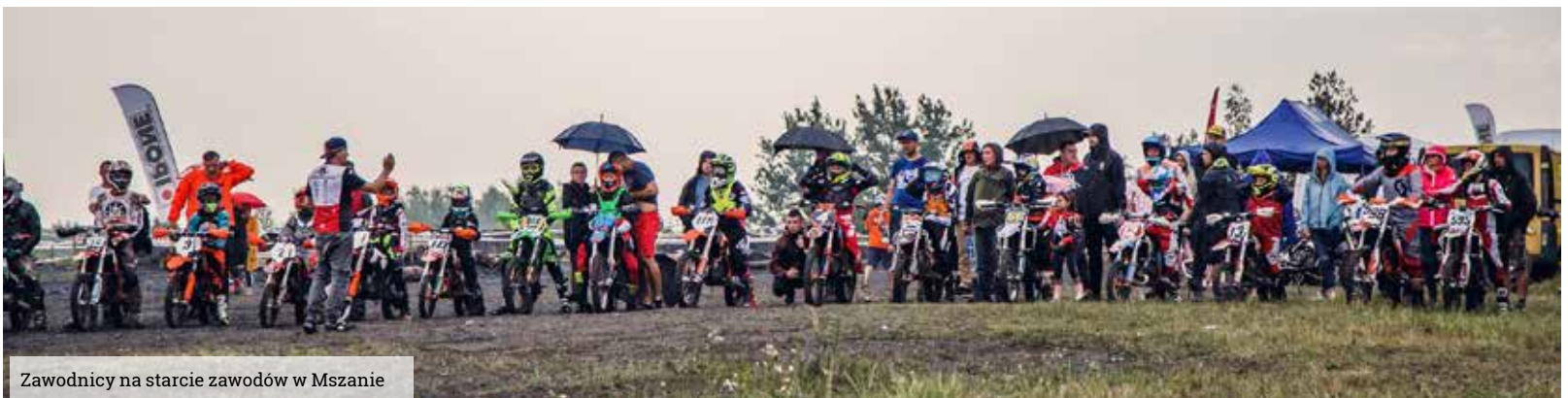
Zawodnicy na starcie zawodów w Mszanie