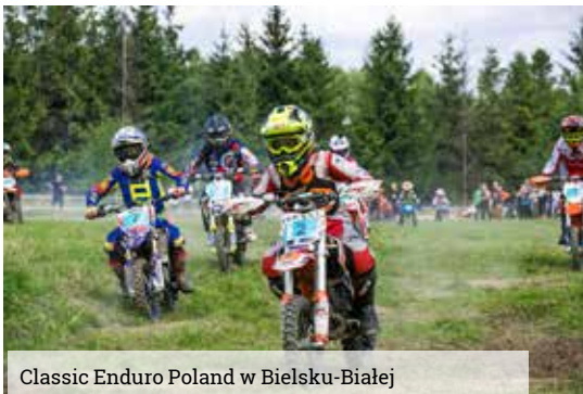
Classic Enduro Poland w Bielsku-Białej