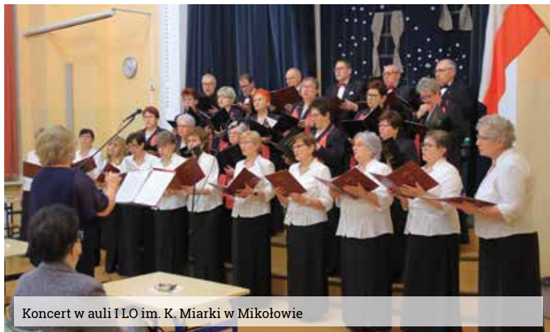
Koncert w auli I LO im. K. Miarki w Mikołowie

Styczeń to jedyny miesiąc w roku, w którym z rozmachem organizowane są koncerty kolęd. Czy to weekend czy dzień powszedni, w kościołach i instytucjach kultury rozbrzmiewają dźwięki pieśni bożonarodzeniowych. Chór „Zorza” również miał przyjemność zaprezentować się w kolędowym repertuarze w ostatnim czasie.