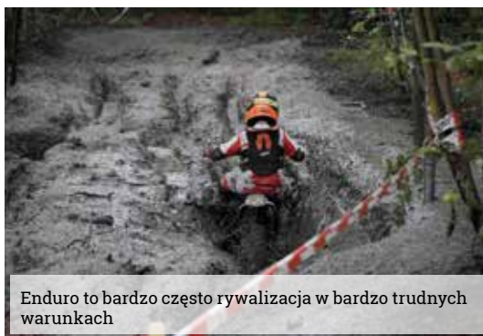
Enduro to bardzo często rywalizacja w bardzo trudnych warunkach