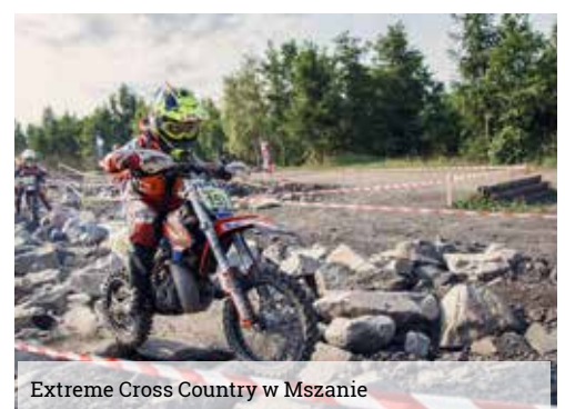
Extreme Cross Country w Mszanie