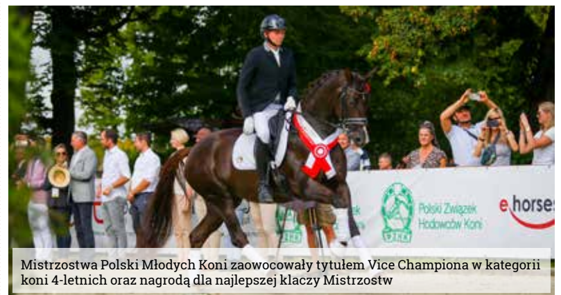
Mistrzostwa Polski Młodych Koni zaowocowały tytułem Vice Championa w kategorii koni 4-letnich oraz nagrodą dla najlepszej klaczy Mistrzostw

ale nie było możliwości przejęcia jej na własność. Po pewnym czasie sytuacja się odwróciła i wtedy długo się nie zastanawialiśmy. Żadne z nas nie jest