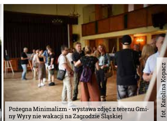
Pożegnania Minimalizmu - wystawa zdjęć z terenu Gminy Wyrzy nie wakacji na Zagrodzie Śląskiej