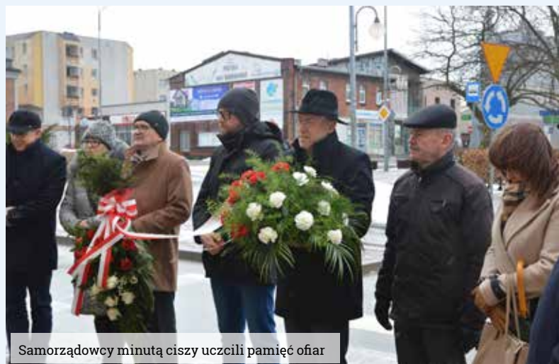
Samorządowcy minutą ciszy uczcili pamięć ofiar