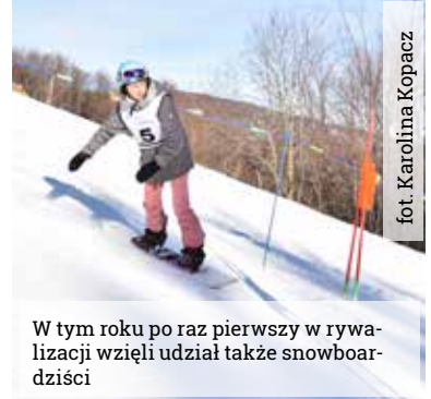
W tym roku po raz pierwszy w rywalizacji wzięli udział także snowboardziści