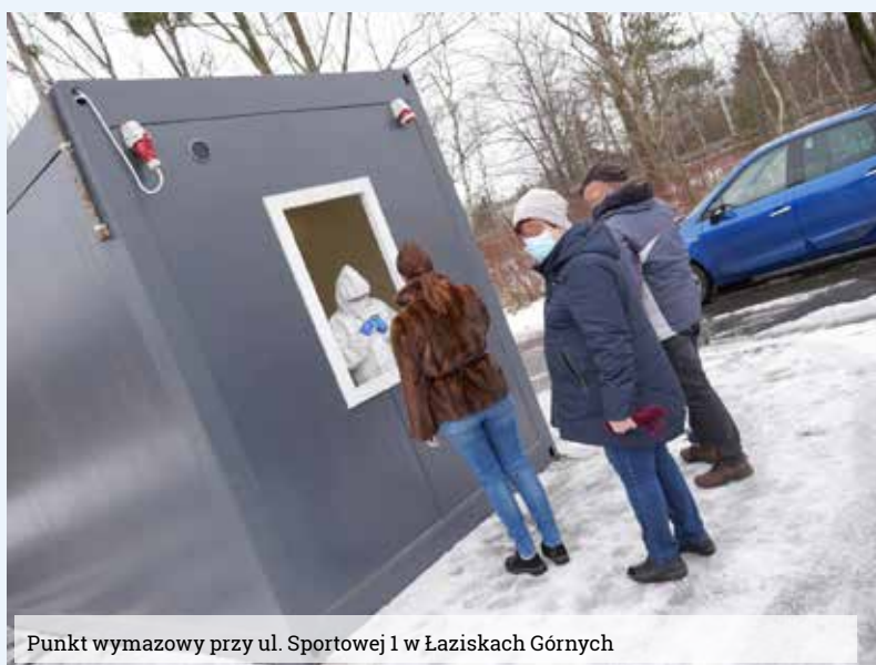
Punkt wymazowy przy ul. Sportowej 1 w Łaziskach Górnych

– przy ul. Ogrodowej 50 (hala MO-SiR-u) pracujący w poniedziałki od 9.00 do 13.00 oraz w środy, piątki i soboty w godzinach 9.00-14.00 (są terminy dla dorosłych i wszystkich