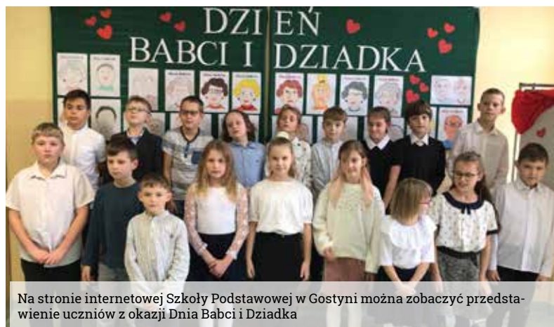
Na stronie internetowej Szkoły Podstawowej w Gostyni można zobaczyć przedstawienie uczniów z okazji Dnia Babci i Dziadka

Dzień Babci oraz Dzień Dziadka to wyjątkowe wydarzenie, w którym każdy wnuczek docenia i obdarowuje swoich najbliższych.