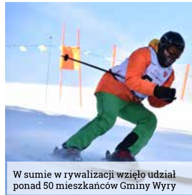
W sumie w rywalizacji wzięło udział ponad 50 mieszkańców Gminy Wyr