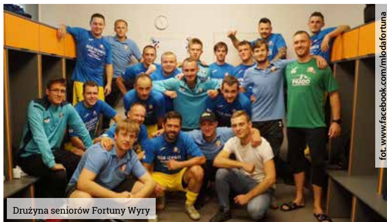
Drużyna seniorów Fortuny Wyr

Trwa seria zwycięstw seniorskiej drużyny Fortuny Wyr. Od sierpniowego rozpoczęcia sezonu, wyrzanie wygrali wszystkie 10 spotkań w swojej klasie B Podokręgu Tychy.