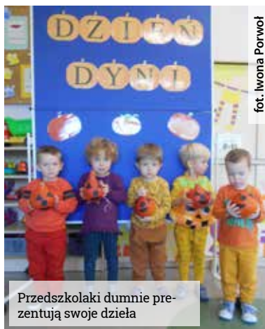
Przedшкоlaczy dumnie prezentują swoje dzieła