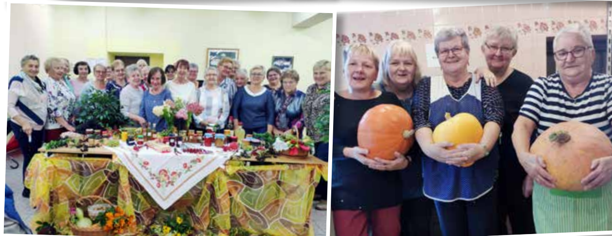
W Wyrach zorganizowane zostało spotkanie, podczas którego Panie miały okazję wzajemnie skosztować swoich warzywnych i owocowych przetworów oczywiście z plonów pochodzących z własnych ogródków