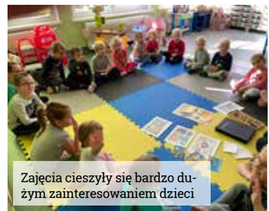
Zajęcia cieszyły się bardzo dużym zainteresowaniem dzieci