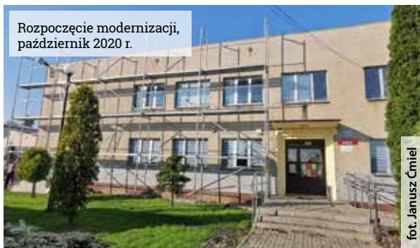
Rozpoczęcie modernizacji, październik 2020 r.