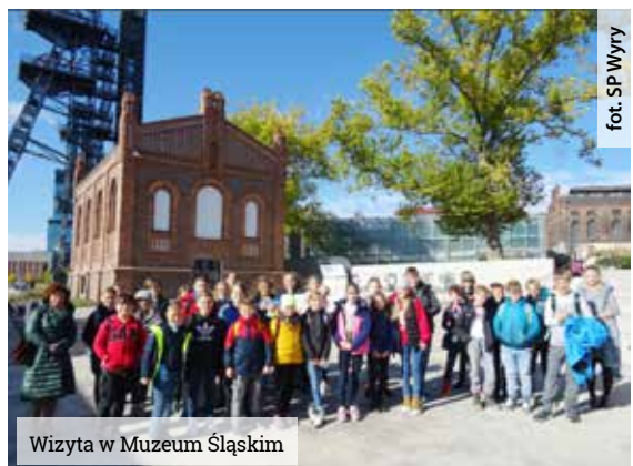
Wizyta w Muzeum Śląskim