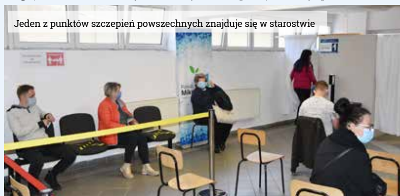
Jeden z punktów szczepień powszechnych znajduje się w starostwie

Szczepienia przeciw COVID-19 na terenie powiatu mikołowskiego odbywają się w Punktach Szczepień Powszechnych zlokalizowanych: w Starostwie Powiatowym w Mikołowie przy ul. Żwirki i Wigury 4a (wejście C), który czynny jest we wtorki i soboty od 9 do 13, a w czwartki od 14 do 18 oraz w Łaziskach Górnych – Hala MOSiR przy ul. Ogrodowej 50, która pracuje w środy i piątki od 9 do 13.