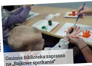
Gminna Biblioteka zaprasza na „Bajkowe spotkania”