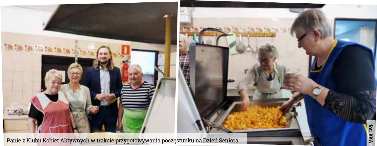
Panie z Klubu Kobiet Aktywnych w trakcie przygotowywania poczęstunku na Dzień Seniora