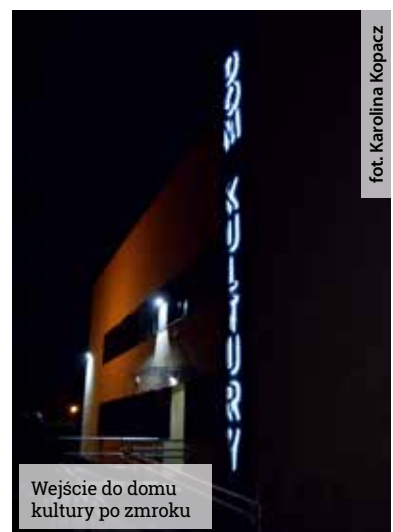
Wejście do domu kultury po zmroku