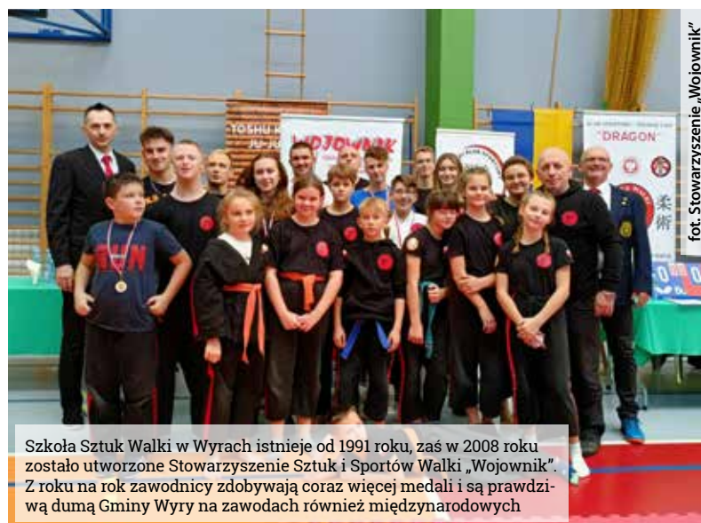
Szkoła Sztuk Walki w Wyrach istnieje od 1991 roku, zaś w 2008 roku zostało utworzone Stowarzyszenie Sztuk i Sportów Walki „Wojownik”. Z roku na rok zawodnicy zdobywają coraz więcej medali i są prawdziwą dumą Gminy Wyr na zawodach również międzynarodowych