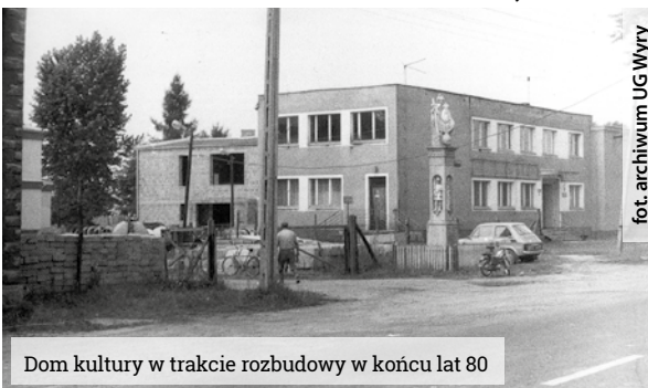
Dom kultury w trakcie rozbudowy w końcu lat 80