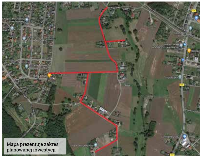
Mapa prezentuje zakres planowanej inwestycji

Pozyskane dofinansowanie pozwoli na przebudowę całej ul. Zawodzie