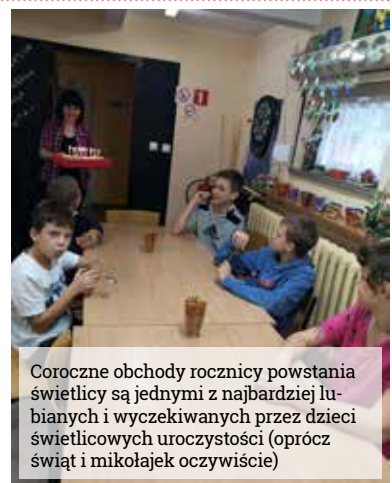
Coroczne obchody rocznicy powstania świetlicy są jednymi z najbardziej lubianych i wyczekiwanych przez dzieci świetlicowych uroczystości (oprócz świąt i mikołajek oczywiście)

zabawy. W tym roku świętowanie trwało nawet wyjątkowo dwa dni, po to, żeby każde dziecko mogło w nim uczestniczyć bez względu na plan zajęć. Ten dzień to okazja, żeby wspominać dawne wspólne świetlicowe przygody, obejrzeć zdjęcia i kronikę. To taki sentymentalny powrót do przeszłości.