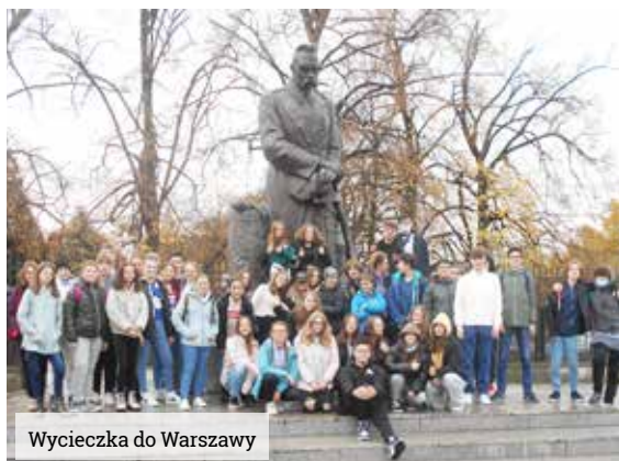
Wycieczka do Warszawy

Klasy V odwiedziły Smoczą Jamę w Krakowie oraz uczestniczyły w zajęciach edukacyjnych w Wioskach Świata – Parku Edukacji Globalnej,