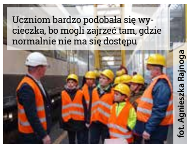
Uczniom bardzo podobała się wycieczka, bo mogli zajrzeć tam, gdzie normalnie nie ma się dostępu