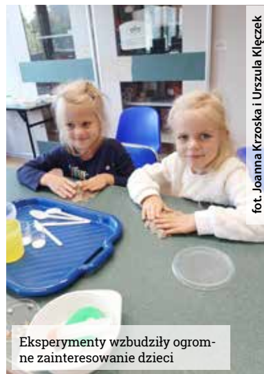
Eksperymenty wzbudziły ogromne zainteresowanie dzieci