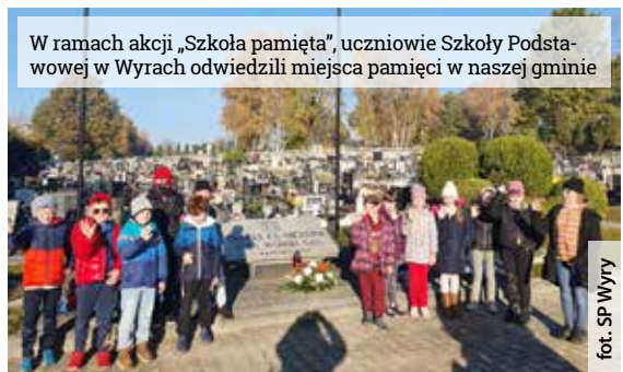
W ramach akcji „Szkoła pamięta”, uczniowie Szkoły Podstawowej w Wyrach odwiedzili miejsca pamięci w naszej gminie