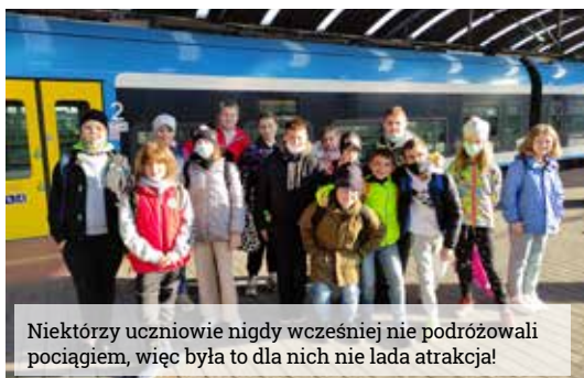
Niektórzy uczniowie nigdy wcześniej nie podróżowali pociągiem, więc była to dla nich nie lada atrakcja!