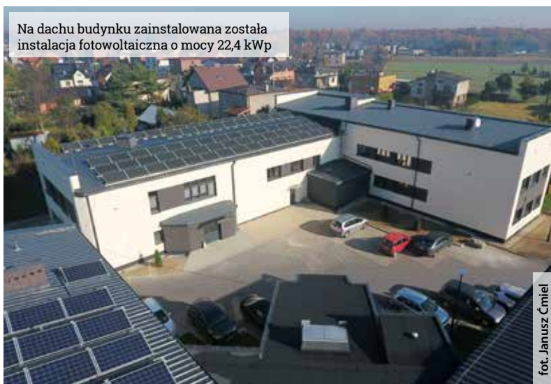
Na dachu budynku zainstalowana została instalacja fotowoltaiczna o mocy 22,4 kWp