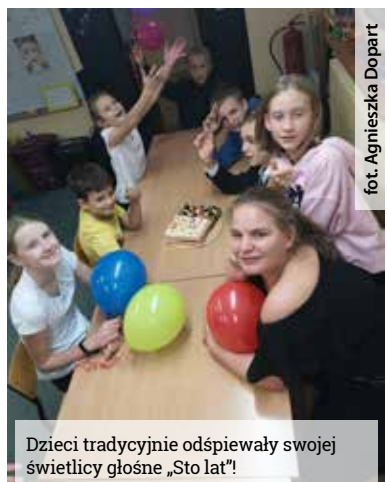
Dzieci tradycyjnie odśpiewały swojej świetlicy głośne „Sto lat”!

Gminna świetlica w Wyrach, 12 października, obchodziła 12. urodziny. Jak co rok nie zabrakło tortu, świeczek, balonów, słodkości oraz oczywiście dobrej