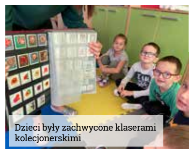
Dzieci były zachwycone klaserami kolekcjonerskimi