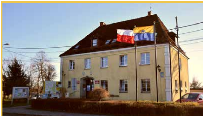
Urząd Gminy Wyry, ul. Główna 133, 43-175 Wyry Tel. (32) 325 68 00, Fax. (32) 325 68 09