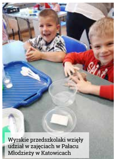
Wyrskie przedszkolaki wzięły udział w zajęciach w Pałacu Młodzieży w Katowicach