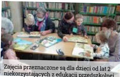
Zajęcia przeznaczone są dla dzieci od lat 2 niekorzystających z edukacji przedszkolnej.

W październiku ruszył kolejny cykl zajęć dla dzieci „Bajkowe spotkania”. Na