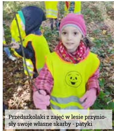
Przedszkolaki z zajęć w lesie przyniosły swoje własne skarby - patyki

Błotko w sali, malowanie patykiem, lornetki z papierowych rolek i wiele, wiele innych wspaniałych pomysłów czeka na dzieci z grupy Biedronki z Gminnego Przedszkola w Gostyni. W tym roku szkolnym rozpoczęliśmy przygodę z Ogólnopolskim Projektem Edukacyjnym pt.: „Z darami natury świat nie jest ponury”.