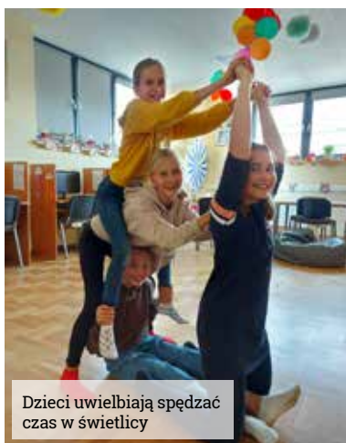
Dzieci uwielbiają spędzać czas w świetlicy