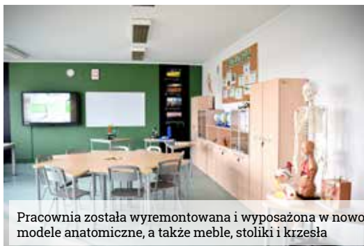
Pracownia została wyremontowana i wyposażona w nowoczesny sprzęt multimedialny (monitor dotykowy i laptop), pomoce służące do badania zjawisk przyrodniczych, mikroskopy, modele anatomiczne, a także meble, stoliki i krzesła