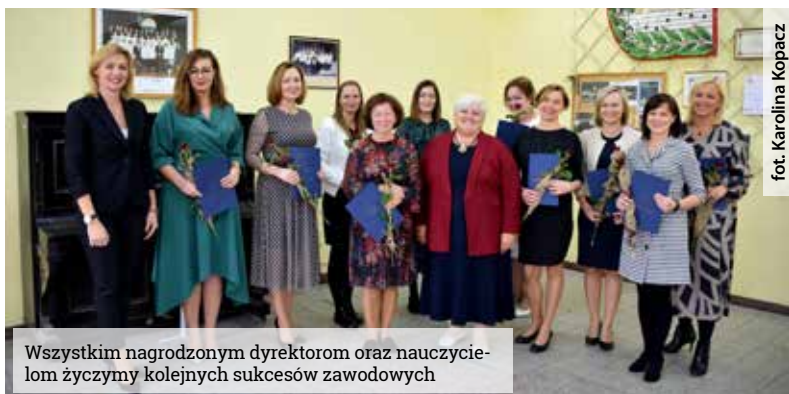
Wszystkim nagrodzonym dyrektorom oraz nauczycielom życzymy kolejnych sukcesów zawodowych