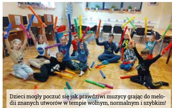
Dzieci mogły poczuć się jak prawdziwi muzycy grający do melodii znanych utworów w tempie wolnym, normalnym i szybkim!

Na wspólnych tańcach i zabawach dzieci spędziły również czas podczas dnia straszków. Dzieci w tym dniu mo-