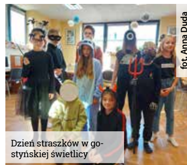
Dzień straszków w gostyńskiej świetlicy