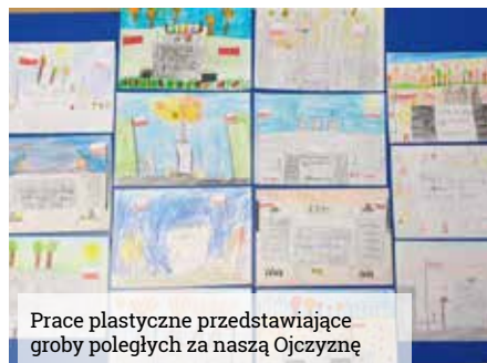
Prace plastyczne przedstawiające groby poległych za naszą Ojczyznę

W ostatnim tygodniu października, Szkoła Podstawowa w Wyrach uczestniczyła w akcji Ministerstwa Edukacji i Nauki „Szkoła pamięta”. W ramach tego przedsięwzięcia uczniowie i nauczyciele odwiedzili miejsca pamięci związane z ważnymi wydarzeniami historycznymi minionych lat. Uczniowie klasy II wyko-