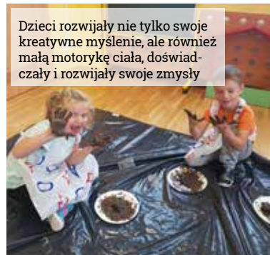
Dzieci rozwijały nie tylko swoje kreatywne myślenie, ale również małą motorykę ciała, doświadczały i rozwijały swoje zmysły

Chcemy kształtować u dzieci postawę proekologiczną rozwijając również przy tym wyobraźnię i kreatywne myślenie. Podczas dobrej zabawy uczymy się, że przyroda która nas otacza jest niesamowita i wystarczy użyć trochę wyobraźni żeby móc się świetnie bawić tym co mamy „pod ręką”. Pewnego dnia wybraliśmy się