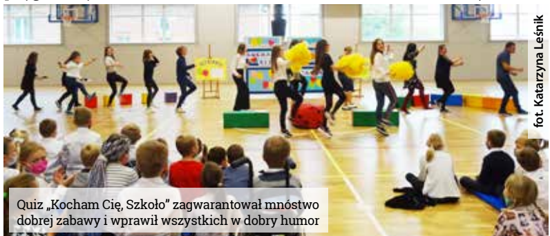
Quiz „Kocham Cię, Szkoło” zagwarantował mnóstwo dobrej zabawy i wprawił wszystkich w dobry humor