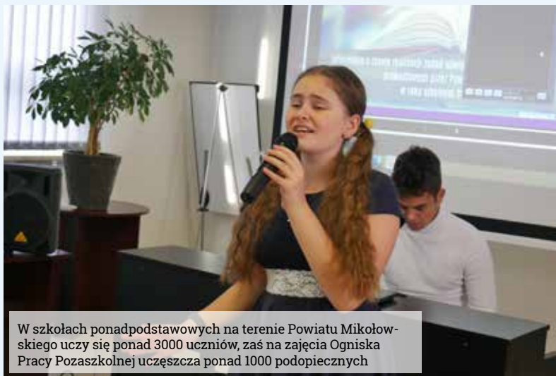
W szkołach ponadpodstawowych na terenie Powiatu Mikołowskiego uczy się ponad 3000 uczniów, zaś na zajęcia Ogniska Pracy Pozaszkolnej uczęszcza ponad 1000 podopiecznych