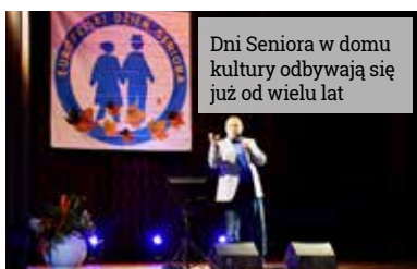
Dni Seniora w domu kultury odbywają się już od wielu lat