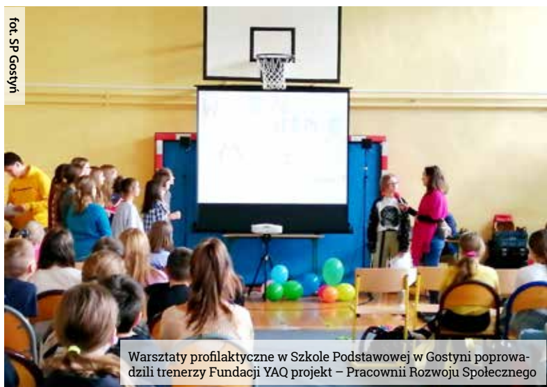
fol. SP Gostyni