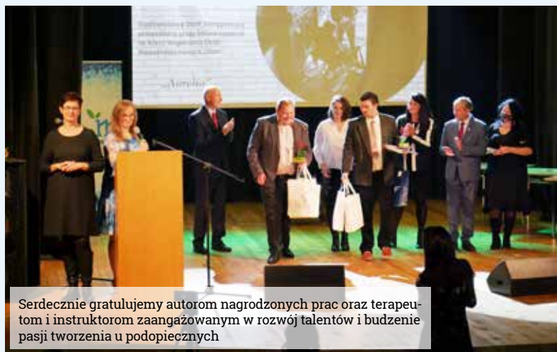
Serdecznie gratulujemy autorom nagrodzonych prac oraz terapeutom i instruktorom zaangażowanym w rozwój talentów i budzenie pasji tworzenia u podopiecznych