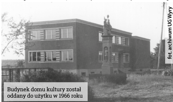
Budynek domu kultury został oddany do użytku w 1966 roku