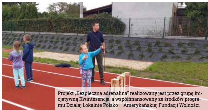
Projekt „Bezpieczna adrenalina” realizowany jest przez grupę inicjatywną Kwintesencja, a współfinansowany ze środków programu Działaj Lokalnie Polsko – Amerykańskiej Fundacji Wolności

W godzinach popołudniowych z kolei wszystkie obiekty sportowe przy wyrskiej szkole podstawowej zostały udostępnione mieszkańcom. Już na samym początku uwagę zwróciła ekspozycja plansz prezentujących sukcesy drużyny hokejowej Fortuny Wyry. W nowej sali gimnastycznej zaprezentowało się sto-