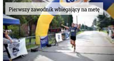
Pierwszy zawodnik wbiegający na metę