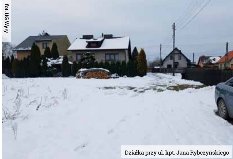
Działka przy ul. kpt. Jana Rybczyńskiego

Referat Geodezji i Gospodarki Nieruchomościami