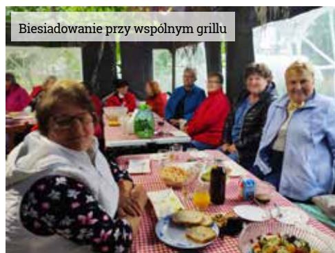
Biesiadowanie przy wspólnym grillu