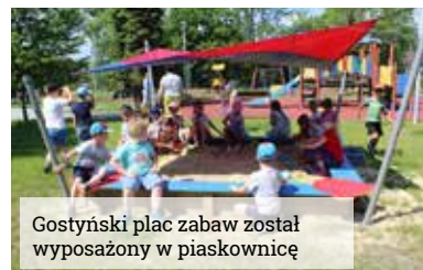
Gostyński plac zabaw został wyposażony w piaskownicę

W przedszkolu w Wyrach zaplanowano zajęcia z logorytmiki, bajkoterapię, zajęcia ruchowe oraz terapię logopedyczną z rozwijaniem umiejętności manualnych. Wkrótce zakupione zostaną również pomoce dydaktyczne, a plac zabaw zostanie