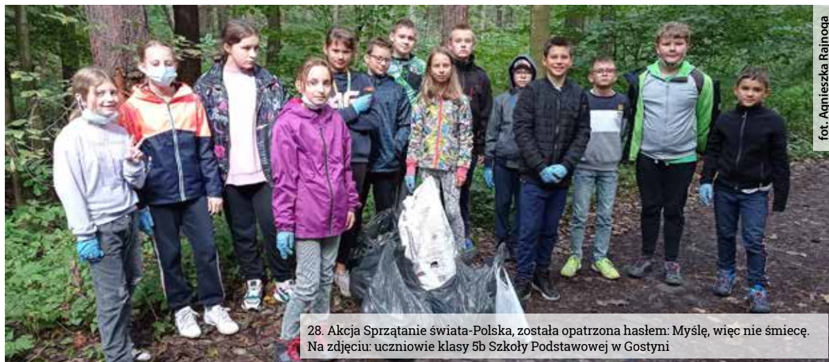
28. Akcja Sprzątanie świata-Polska, została opatrzona hasłem: Myszę, więc nie śmieję. Na zdjęciu: uczniowie klasy 5b Szkoły Podstawowej w Gostyni