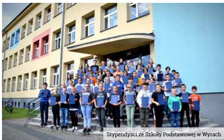
Stypendyści ze Szkoły Podstawowej w Wyrzy