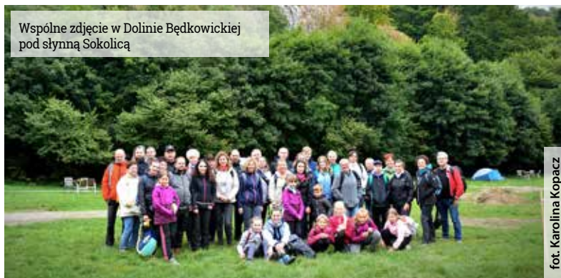
Wspólne zdjęcie w Dolinie Będkowskiej pod słynną Sokolicą