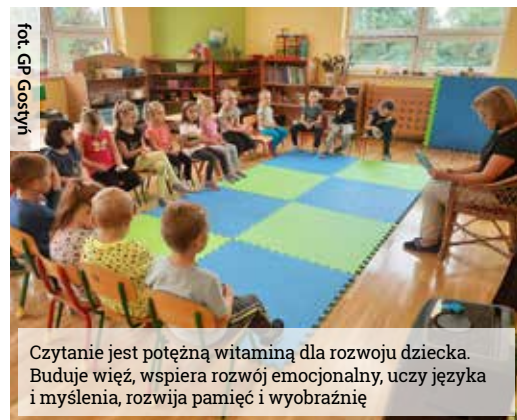
Czytanie jest potężną witaminą dla rozwoju dziecka. Buduje więź, wspiera rozwój emocjonalny, uczy języka i myślenia, rozwija pamięć i wyobraźnię