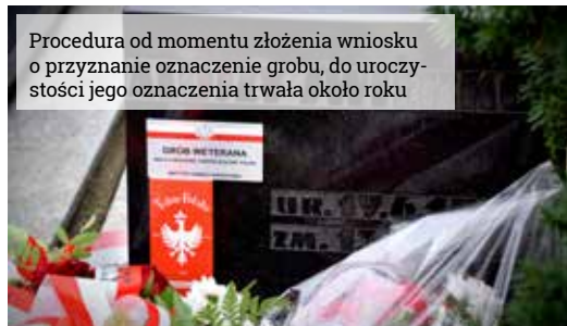
Procedura od momentu złożenia wniosku o przyznanie oznaczenie grobu, do uroczystości jego oznaczenia trwała około roku