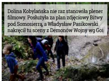
Dolina Kobyłańska nie raz stanowiła plener filmowy. Posłużyła za plan zdjęciowy Bitwy pod Somosierrą, a Władysław Pasikowski nakręcił tu sceny z Demonów Wojny wg Goi

Dom Kultury w Gostyni, 18 września, zorganizował kolejny już Rajd Jurajski. W tym roku jego trasa wiodła najpiękniejszymi dolinami Jury Krakowsko-Częstochowskiej – Kobyłańską i Będkowską, będącymi mekką wspinaczy skałkowych.