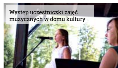
Występ uczestniczki zajęć muzycznych w domu kultury