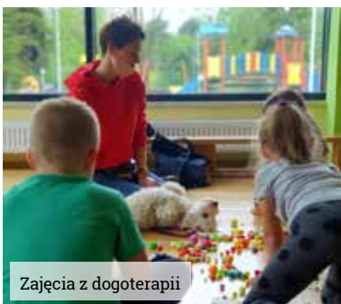
Zajęcia z dogoterapii

Gminne przedszkola w Wyrach i Gostyni realizują projekt unijny „Wsparcie na starcie edukacji w gminie Wyry”.