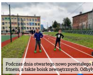
Podczas dnia otwartego nowo powstałego kompleksu obiektów sportowych przy Szkole Podstawowej w Wyrach, wszyscy chętni mieli możliwość zobaczenia hali, siłowni oraz salki fitness, a także boisk zewnętrznych. Odbyły się również pokazy klubów i sekcji sportowych na co dzień funkcjonujących w Wyrach i Gostyni