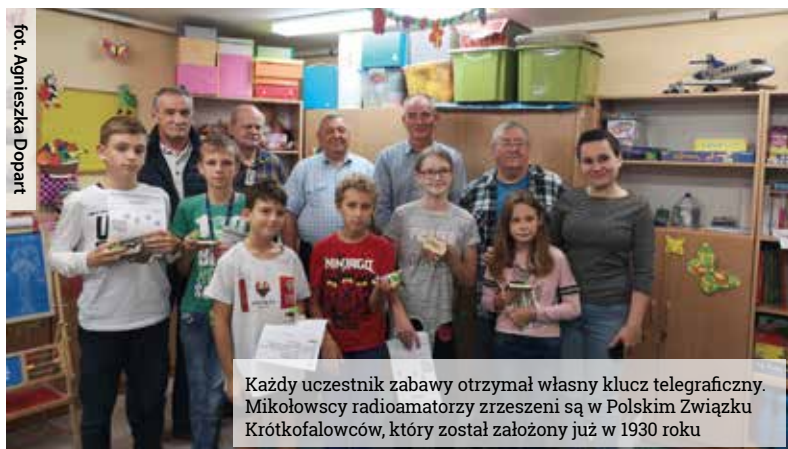
Każdy uczestnik zabawy otrzymał własny klucz telegraficzny. Mikołowscy radioamatorzy zrzeszeni są w Polskim Związku Krótkofalowców, który został założony już w 1930 roku