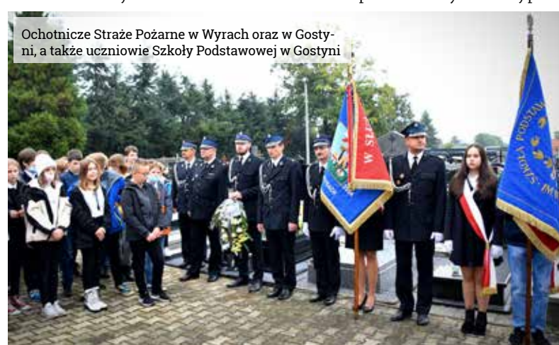
Ochotnicze Straże Pożarne w Wyrach oraz w Gostyni, a także uczniowie Szkoły Podstawowej w Gostyni

nizacja odegrała decydującą rolę w walce o polską przynależność Górnego Śląska. Podporządkowana była wspomnianej już Naczelnej Radzie Ludowej w Poznaniu. Ochotnicy z Gostyni weszli w skład VIII kompanii POW wystawionej przez