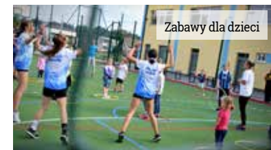
Zabawy dla dzieci