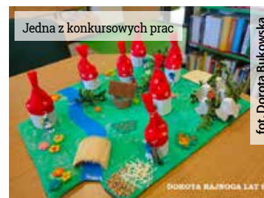
fol. Dorota Bukowska