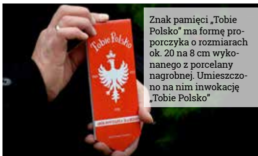
Znak pamięci „Tobie Polsko” ma formę proporczyka o rozmiarach ok. 20 na 8 cm wykonanego z porcelany nagrobnej. Umieszczono na nim inwokację „Tobie Polsko”