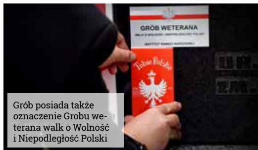
Grób posiada także oznaczenie Grobu weterana walk o Wolność i Niepodległość Polski

Oddziały polskie bardzo szybko zajęły niemal cały po-