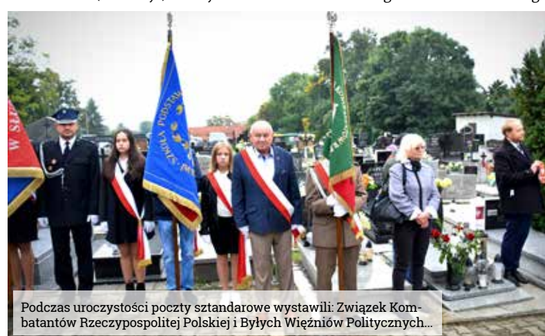
Podczas uroczystości poczty sztandarowe wystawili: Związek Kombatanów Rzeczypospolitej Polskiej i Byłych Więźniów Politycznych...