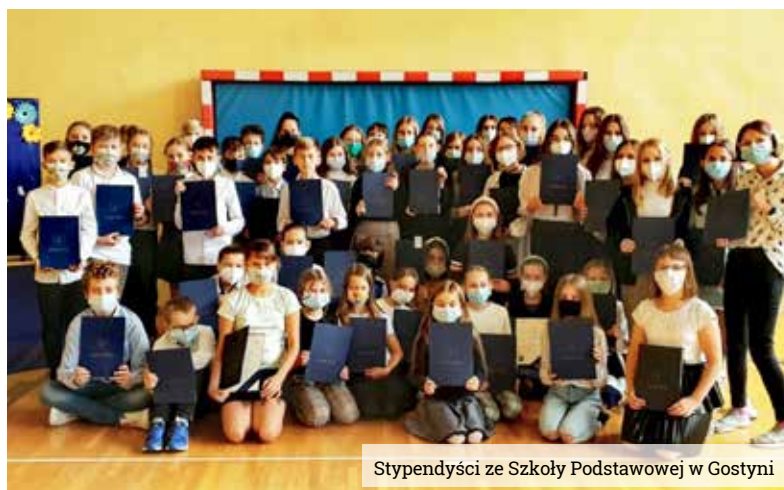
Stypendyści ze Szkoły Podstawowej w Gostyni