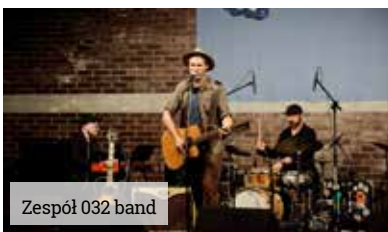
Zespół O32 band