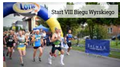
Start VIII Biegu Wyrskiego