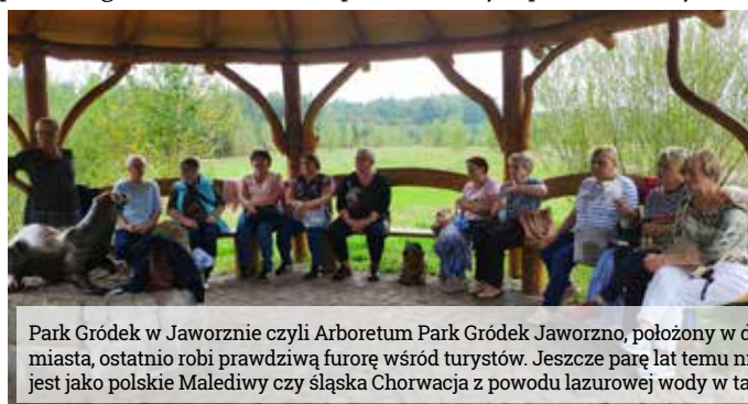
Park Gródek w Jaworznie czyli Arboretum Park Gródek Jaworzno, położony w dawnym kamieniołomie, na północ od centrum miasta, ostatnio robi prawdziwą furorę wśród turystów. Jeszcze parę lat temu nikt o tym miejscu nie słyszał, a dziś odkrył się jako polskie Malediwy czy śląska Chorwacja z powodu lazurowej wody w tamtejszym zbiorniku