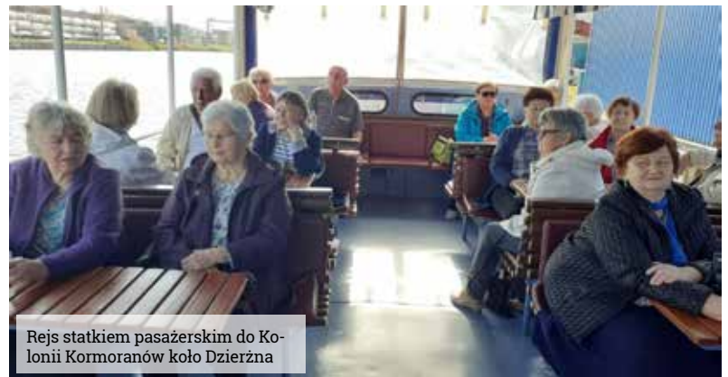
Rejs statkiem pasażerskim do Kolonii Kormoranów koło Dzierżna