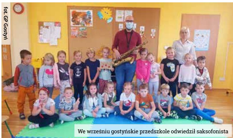
We wrześniu gostyńskie przedszkole odwiedził saksofonista

W tym roku dzieci z grupy Biedronki z Gminnego Przedszkola w Gostyni będą poznawały świat muzyki podczas cyklu zajęć „Biedronki z muzycznej łąki”.