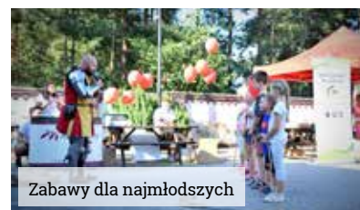
Zabawy dla najmłodszych