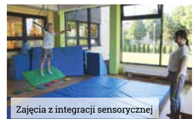
Zajęcia z integracji sensorycznej

Referat Pozyskiwania Funduszy i Rozwoju Gminy