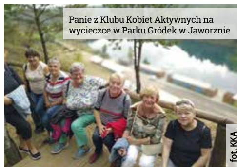
Panie z Klubu Kobiet Aktywnych na wycieczce w Parku Gródek w Jaworznie