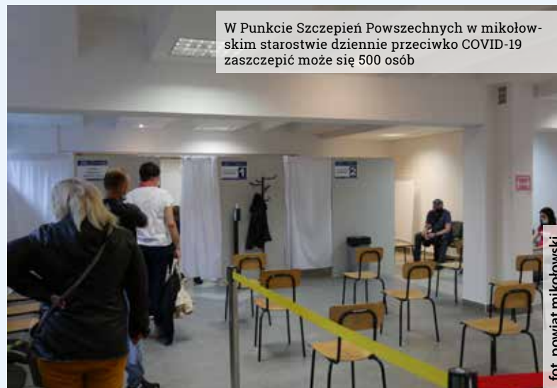
W Punkcie Szczepień Powszechnych w mikołowskim starostwie dziennie przeciwko COVID-19 zaszczepić może się 500 osób

miejsce do 15 minutowego oczekiwania poszczepiennego, niezbędny sprzęt do transportu i przechowywania szczepionek, środki i sprzęt medyczny zgodne z wytycznymi NFZ.