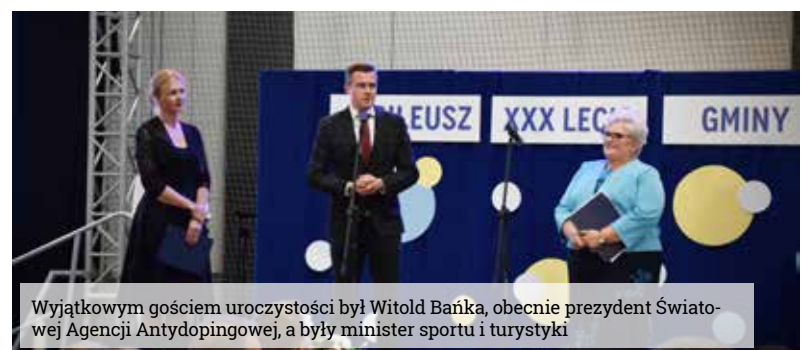
Wyjątkowym gościem uroczystości był Witold Bańka, obecnie prezydent Światowej Agencji Antydopingowej, a były minister sportu i turystyki