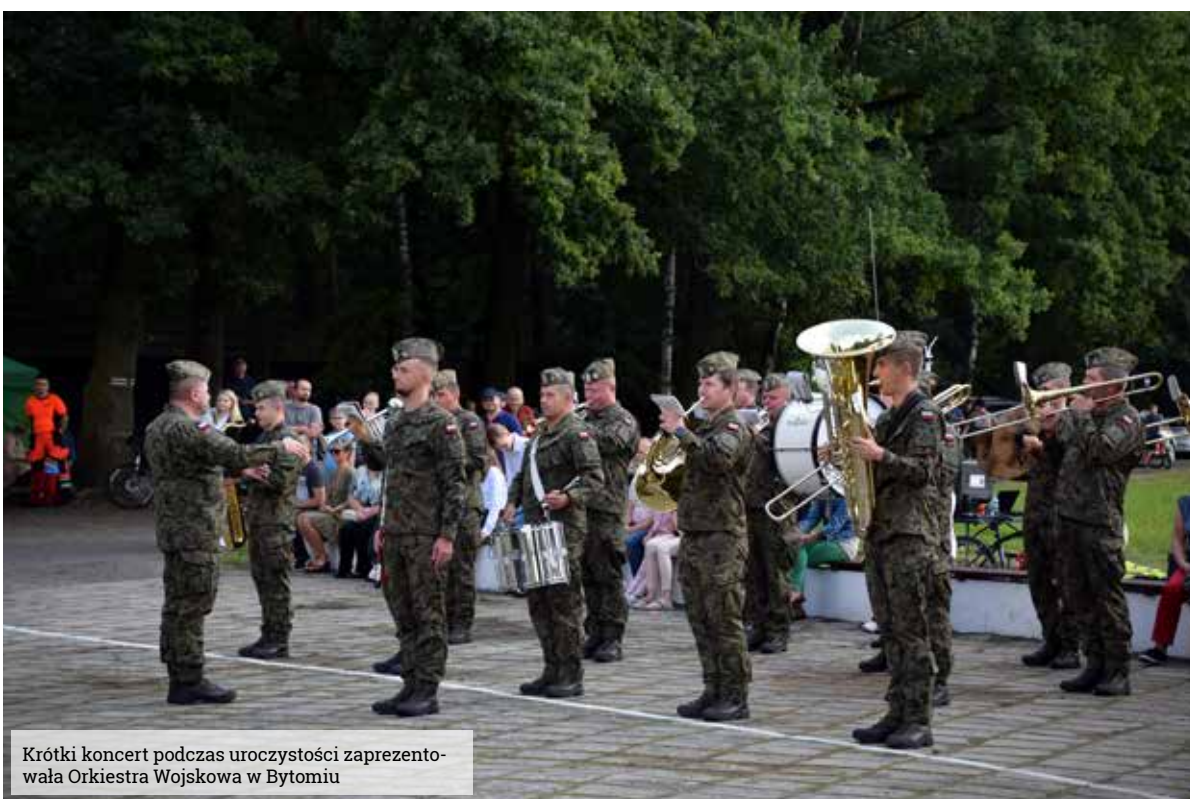
Krótki koncert podczas uroczystości zaprezentowała Orkiestra Wojskowa w Bytomiu