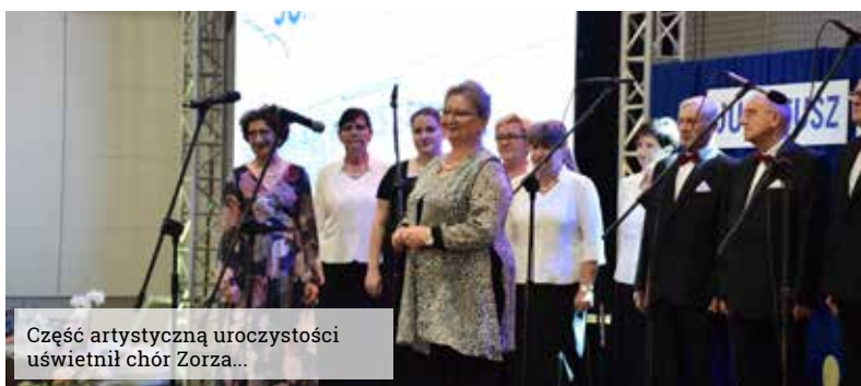
Część artystyczną uroczystości uświetnił chór Zorza...