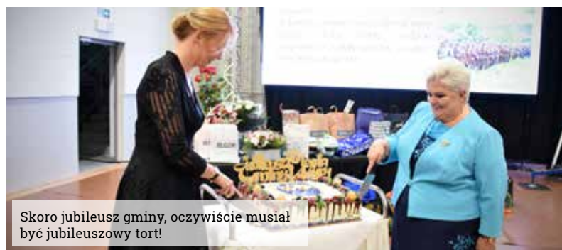
Skoro jubileusz gminy, oczywiście musiał być jubileuszowy tort!