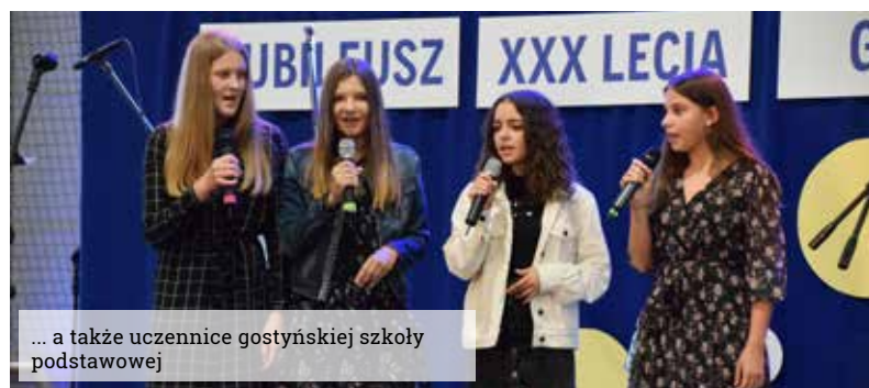
... a także uczennice gostyńskiej szkoły podstawowej