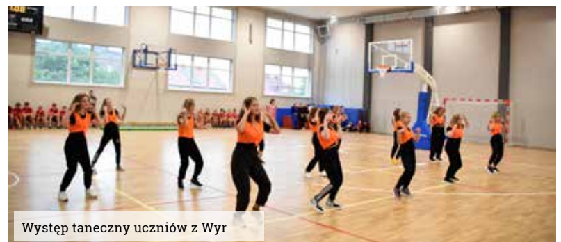
Występ taneczny uczniów z Wyr