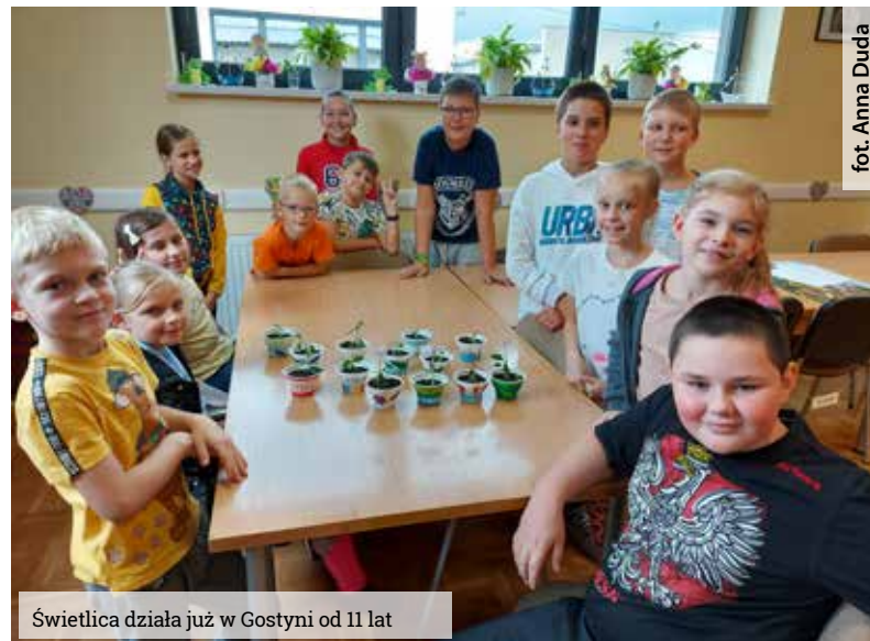
Świetlica działa już w Gostyni od 11 lat