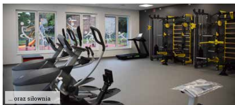
... oraz siłownia