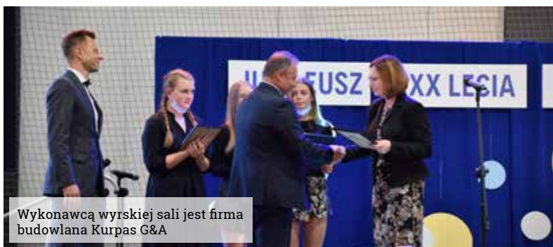
Wykonawcą wyrskiej sali jest firma budowlana Kurpas G&A