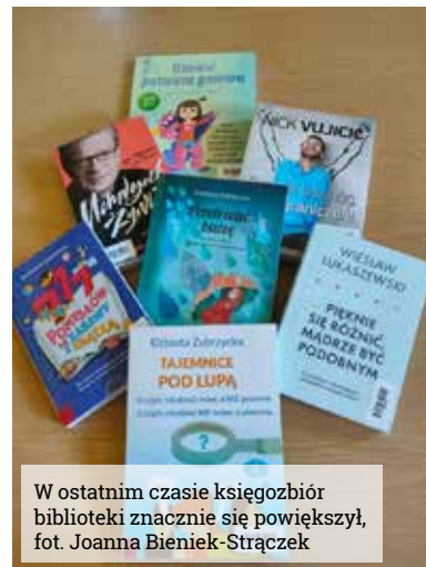
W ostatnim czasie księgozbiór biblioteki znacznie się powiększył