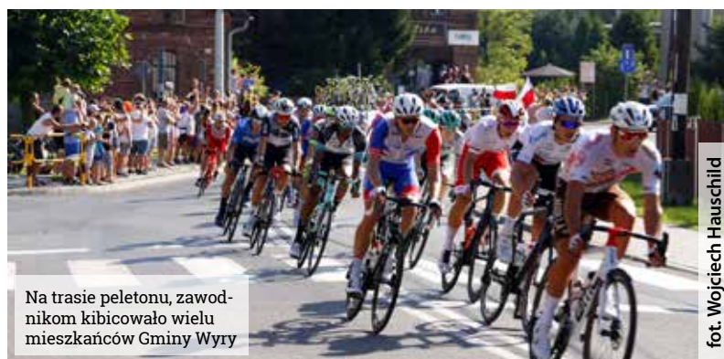
Na trasie peletonu, zawodnikom kibicowało wielu mieszkańców Gminy Wyrę