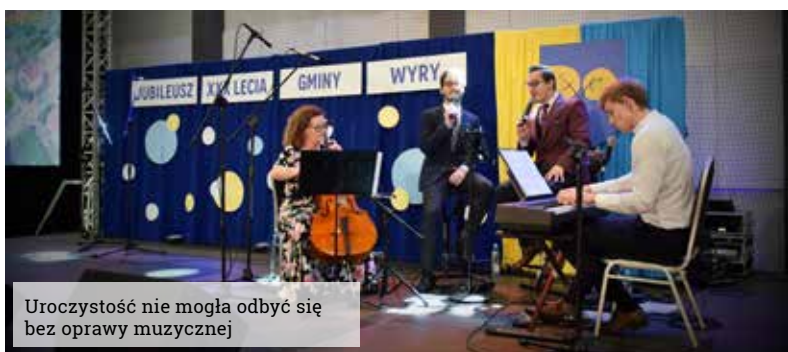
Uroczystość nie mogła odbyć się bez oprawy muzycznej