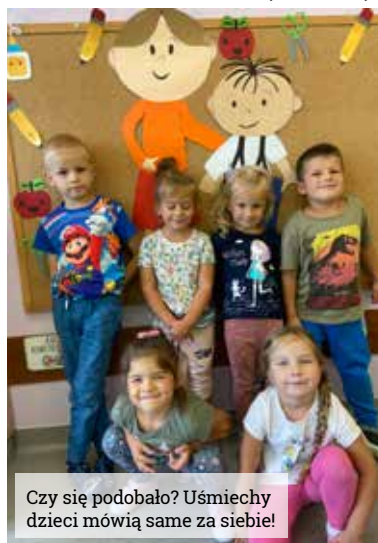
Czy się podobało? Uśmiechy dzieci mówią same za siebie!