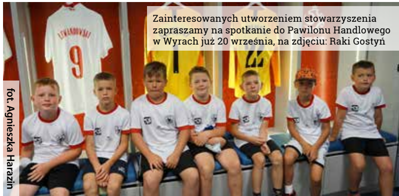
Zainteresowanych utworzeniem stowarzyszenia zapraszamy na spotkanie do Pawilonu Handlowego w Wyrach już 20 września, na zdjęciu: Raki Gostyń