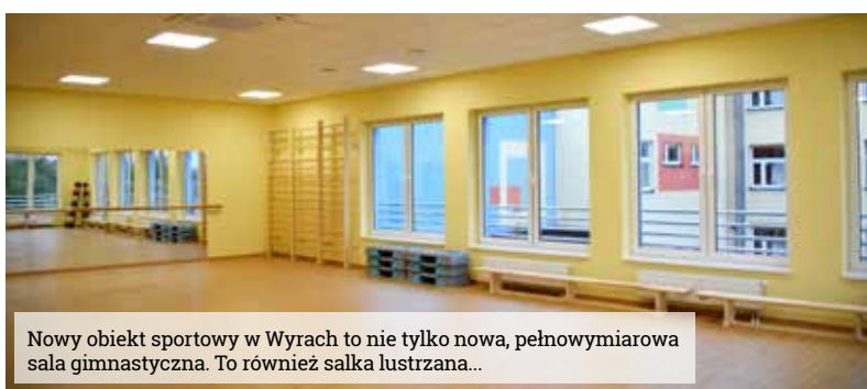
Nowy obiekt sportowy w Wyrach to nie tylko nowa, pełnowymiarowa sala gimnastyczna. To również salka lustrzana...