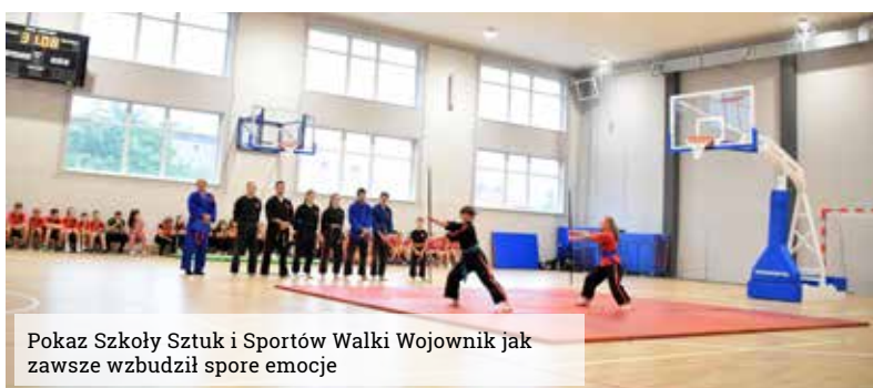
Pokaz Szkoły Sztuk i Sportów Walki Wojownik jak zawsze wzbudził spore emocje