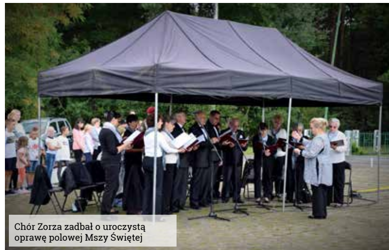
Chór Zorza zadbał o uroczystą oprawę polowej Mszy Świętej