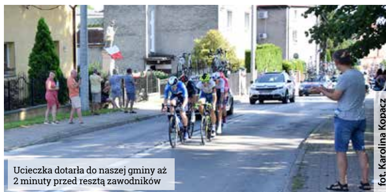
Ucieczka dotarła do naszej gminy aż 2 minuty przed resztą zawodników