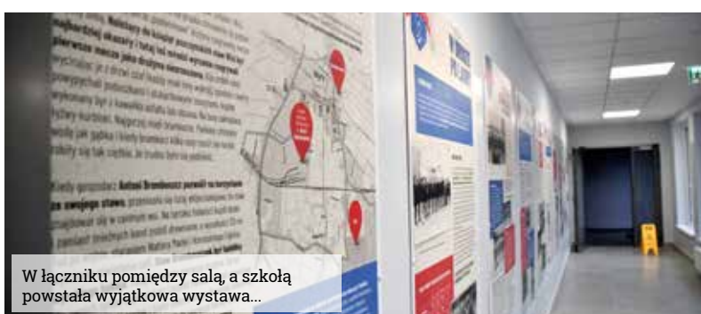
W łączniku pomiędzy salą, a szkołą powstała wyjątkowa wystawa...