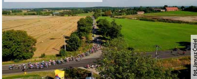
Peleton Tour de Pologne z perspektywy lotu ptaka wyglądał imponująco