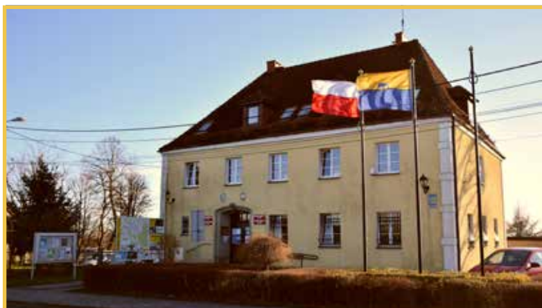
Urząd Gminy Wyry, ul. Główna 133, 43-175 Wyry Tel. (32) 325 68 00, Fax. (32) 325 68 09