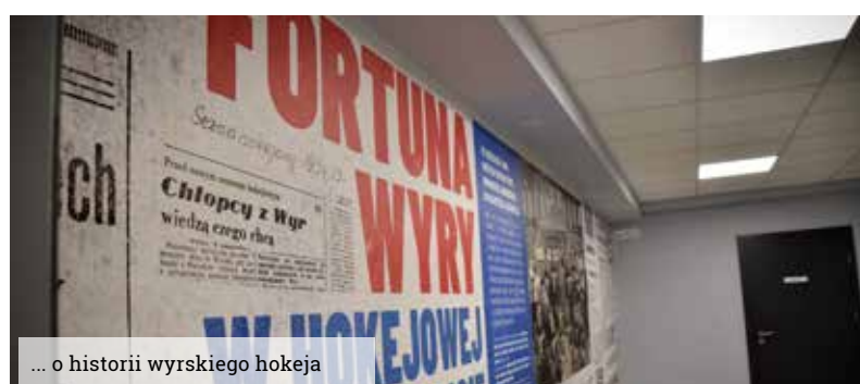
... o historii wyrskiego hokeja