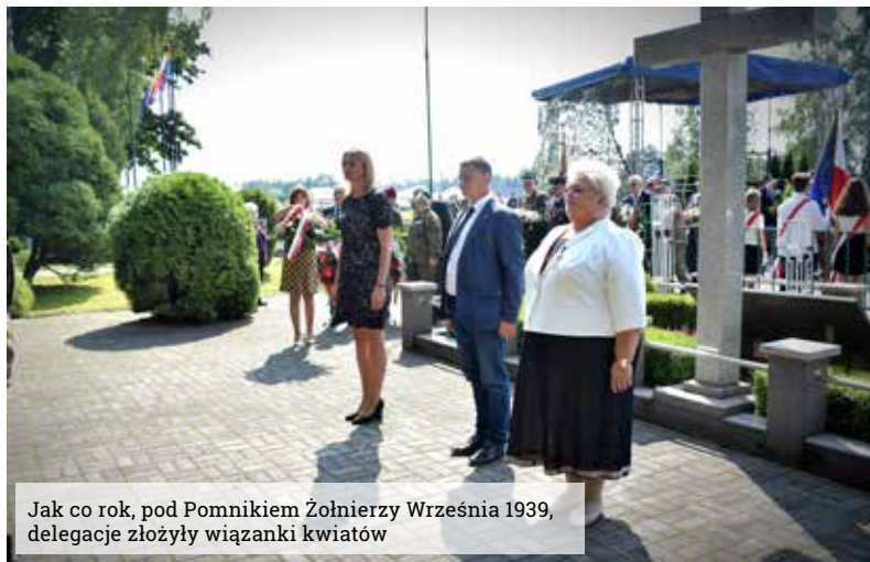
Jak co rok, pod Pomnikiem Żołnierzy Września 1939, delegacje złożyły wiązanki kwiatów