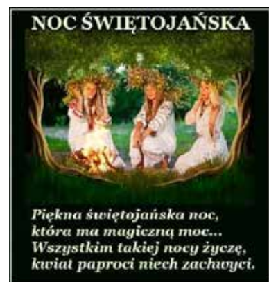
Piękna świętojańska noc, która ma magiczną moc... Wszystkim takiej nocy życzę, kwiat paproci niech zachwyci.

Od kilku już lat grupa członkiń udaje się w czerwcu na wypoczynek nad morze. Docelowo tym razem była to miejscowość Dźwirzyno. W czasie tego pobytu zorganizowano wycieczkę objazdową po Kołobrzegu, nie zapomniano również o starym słowiańskim obrzędzie Nocy Świętojańskiej. Uplecione z kwiatów i ziół wianki zostały pущzone do rzeki, skąd popły-