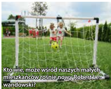
Kto wie, może wśród naszych małych mieszkańców rośnie nowy Robert Lewandowski?

Tego samego dnia rozpoczęło się też wielkie kibicowanie Delfinków z wyrskiego przedszkola, które w ten sposób chciały wesprzeć naszych piłkarzy. Przedszkolacy nie zawiedli – ubrani w biało-czerwone stroje w sali stworzyli coś na wzór „strefy kibica”, mając nadzieję, że to pomoże naszym piłkarzom wygrać wszystkie mecze. Od samego rana powtarzali „Polska Gola” i odpowia-