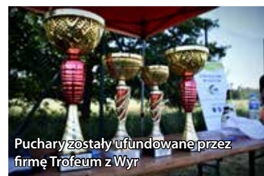
Puchary zostały ufundowane przez firmę Trofeum z Wiry

Tuż obok, na szkolnym boisku w Gostyni odbywał się Gminny Skating. Konieczny był kask,