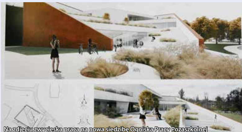
Na zdjęciu zwyciężka praca na nową siedzibę Ogniska Pracy Pozaszkolnej