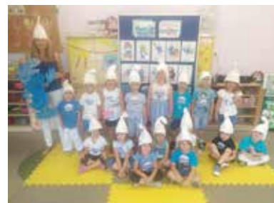
Wszystko tego dnia było takie smerfostyczne!