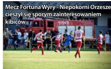
Mecz Fortuna Wiry - Niepokorni Orzesze cieszył się sporym zainteresowaniem kibiców