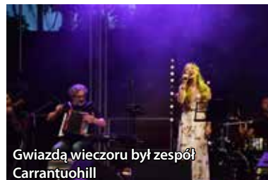
Gwiazdą wieczoru był zespół Carrantuohill