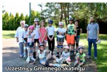
Uczestnicy Gminnego Skatingu