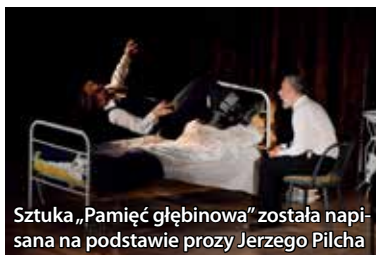
Sztuka „Pamięć głębinowa” została napisana na podstawie prozy Jerzego Pilcha