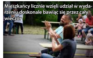
Mieszkańcy licznie wzięli udział w wydarzeniu doskonale bawiąc się przez cały wieczór