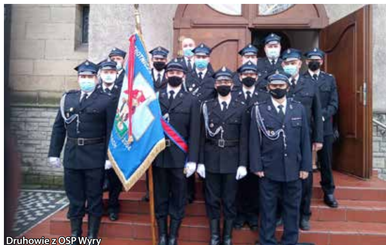
Druhowie z OSP Wyr

Szanowni mieszkańcy, akcja „Złom” na pewno nie odniosła-