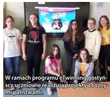
W ramach programu eTwinning gostyńscy uczniowie realizują projekty z różnymi państwami.

W ramach współpracy zagranicznej Szkoła Podstawowa w Gostyni uczestniczy w programie eTwinning, realizując projekty z różnymi państwami. W drugim półroczu 2020/2021 roku uczniowie z Polski oraz ich rówieśnicy z Holandii (Carolus Clusius Collage) wykonali prezentacje w języku niemieckim na temat: „Fernlernen – Vorteile und Nachteile”, „Ideale Schule” i „Deutsche Nachrichtensendung”, następnie uczniowie wymienili się prezentacjami, które