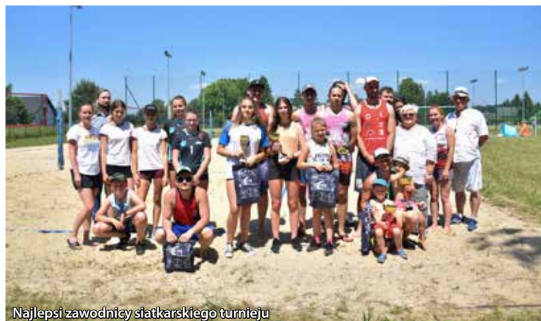
Najlepsi zawodnicy siatkarskiego turnieju