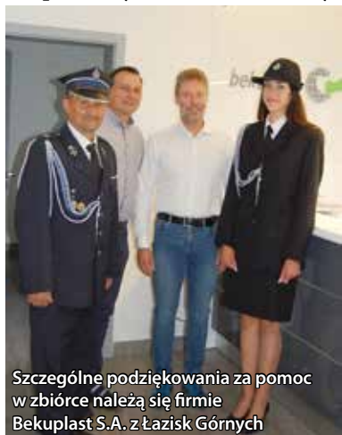
Szczególne podziękowania za pomoc w zbiórce należą się firmie Bekuplast S.A. z Łazisk Górnych

Dzięki funduszom uzyskanym ze sprzedaży złomu oraz z otrzy-