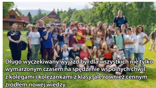
Długo wyczekiwany wyjazd był dla wszystkich nie tylko wymarzonym czasem na spędzenie wspólnych chwil z kolegami i koleżankami z klasy, ale również cennym źródłem nowej wiedzy.

skrzyni skarbów, gdzie znajdowały się nagrody dla wszystkich wytrwałych uczestników. Uczniowie pod okiem instruktorów doskonale rozwiązywali zagadki, a na koniec