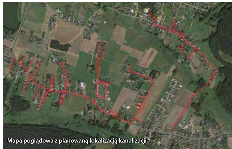
Mapa poglądowa z planowaną lokalizacją kanalizacji

Zadanie 1 – „Rozbudowa budynku Szkoły Podstawowej w Go-