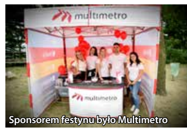
Sponsorem festynu było Multimetro