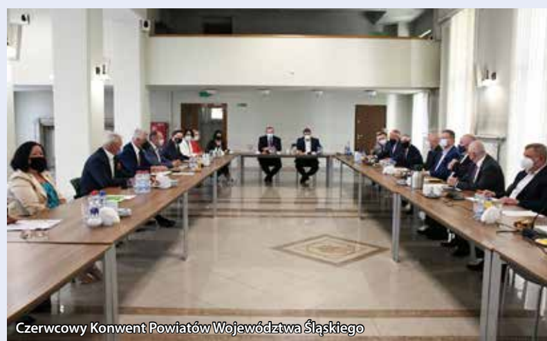
Czerwcowy Konwent Powiatów Województwa Śląskiego

Podczas spotkania omawiano sprawy związane z Funduszami Europejskimi dla Województwa Śląskiego na lata 2021-2027, oraz te dotyczące zielonej transformacji regionu. Starostów w największym stopniu interesowały możliwości pozyskania wsparcia unijnego na rozbudowę infrastruktury drogowej i zakup nowoczesnego sprzętu medycznego dla szpitali powiatowych.