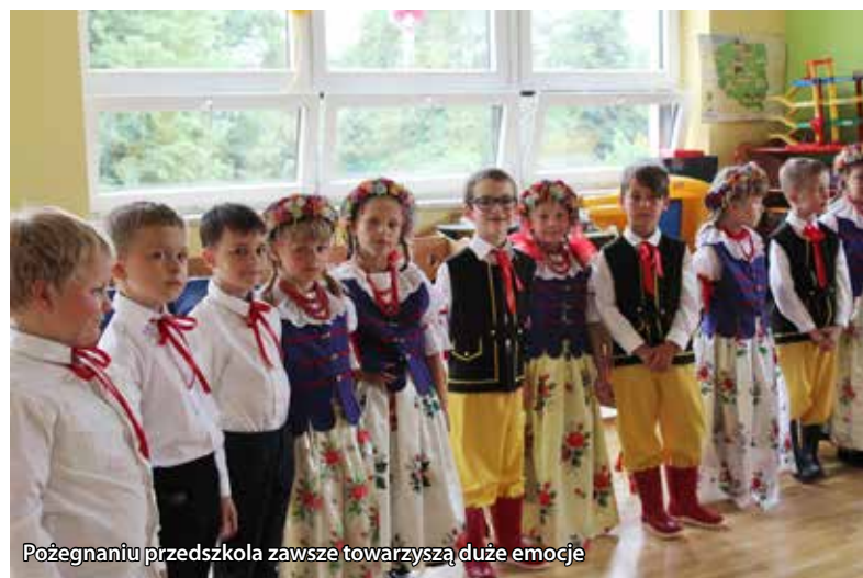
Pożegnaniu przedszkola zawsze towarzyszą duże emocje

W tych dniach żegnaliśmy dzieci, które w większości były z nami od samego początku i rozpoczynały przygodę w naszym przedszkolu jako 3-latki. Przez wiele miesięcy śledziliśmy ich postępy, widzieliśmy jak rosły i rozwijały się. Ze wzruszeniem w oku podziwialiśmy jak prezentują swoje umiejętności podczas ostatniego swojego