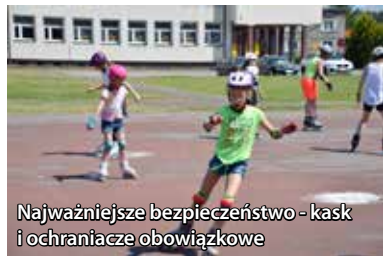
Najważniejsze bezpieczeństwo - kask i ochraniacze obowiązkowe