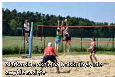
Siatkarskie akcje na boisku były niezwykle zacięte