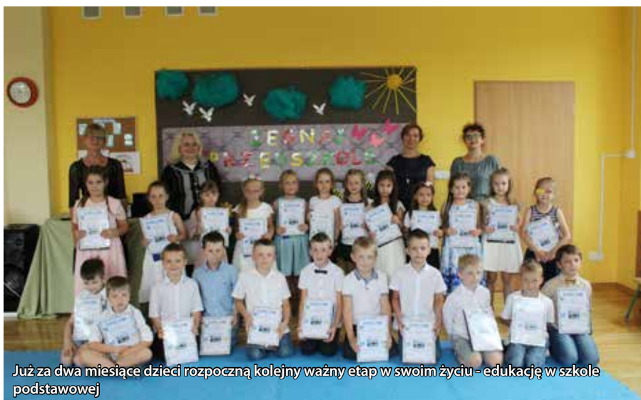
Już za dwa miesiące dzieci rozpoczną kolejny ważny etap w swoim życiu - edukację w szkole podstawowej