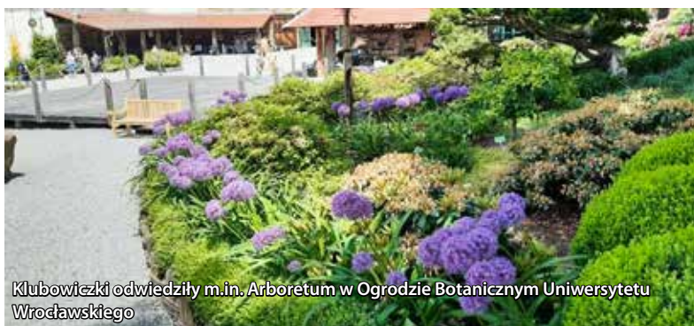
Klubowiczki odwiedziły m.in. Arboretum w Ogrodzie Botanicznym Uniwersytetu Wrocławskiego