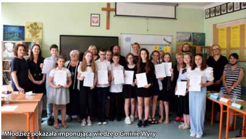
Młodzież pokazała imponującą wiedzę o Gminie Wiry