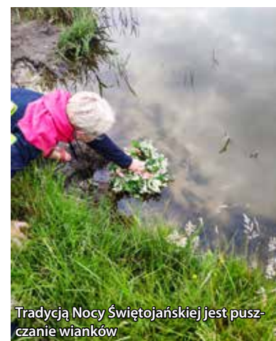
Tradycją Nocy Świętojańskiej jest pущanie wianków