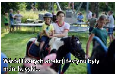
Wśród licznych atrakcji festynu były m.in. kuczki...