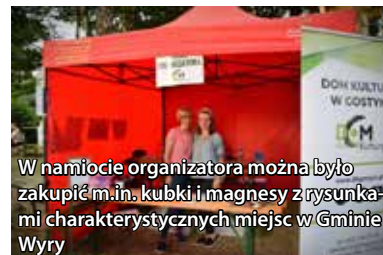
W namiocie organizatora można było zakupić m.in. kubki i magnesy z rysunkami charakterystycznych miejsc w Gminie Wiry

w swoich tekstach teksty Roberta Burnsa w śląskiej godce. Artysta wraz z zespołem, swoim ciepłym bluesowym brzmieniem wpawili wszystkich w bardzo dobry nastrój. Gwiazdą tego wieczoru był jednak zespół Carrantuohill, najbardziej znany i jednocześnie jeden z najstarszych zespołów wykonujących muzykę celtycką w Polsce. Na zakończenie wieczoru, zabawę taneczną do późnych godzin nocnych prowadził DJ Marssell. Przez cały dzień, dzieci mogły bawić się na dmuchanych zjeżdżalniach, poskakać na eurobungee, czy pojeździć na kucykach.