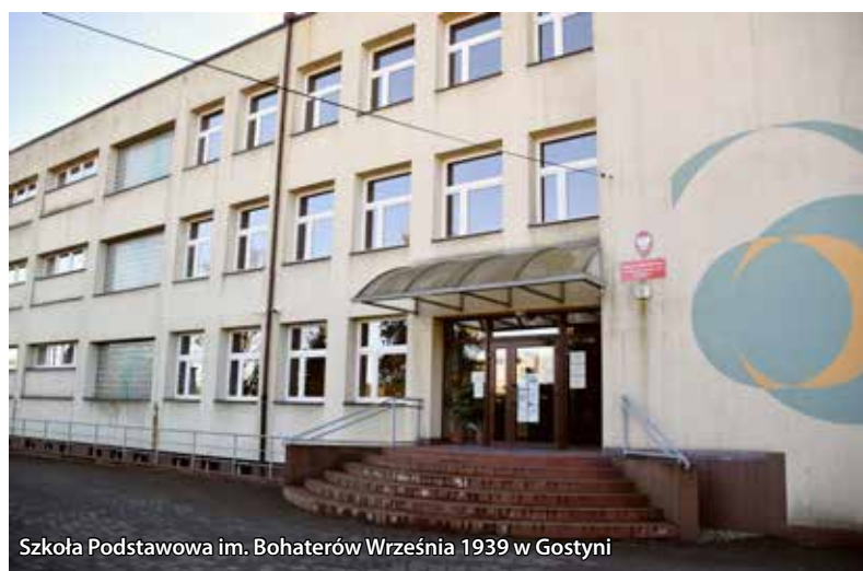
Szkoła Podstawowa im. Bohaterów Września 1939 w Gostyni

Pełna dokumentacja przetargowa dostępna jest w Biuletynie Informacji Publicznej Urzędu Gminy Wyry.