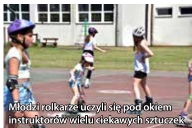
Młodzi rolkarze uczyli się pod okiem instruktorów wielu ciekawych sztuczek