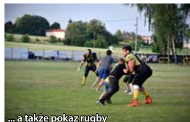
... a także pokaz rugby