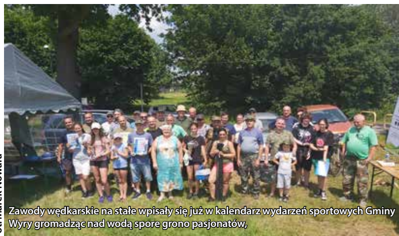
Zawody wędkarskie na stałe wpisały się już w kalendarz wydarzeń sportowych Gminy Wiry gromadząc nad wodą spore grono pasjonatów,