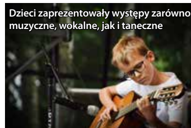
Dzieci zaprezentowały występy zarówno muzyczne, wokalne, jak i taneczne