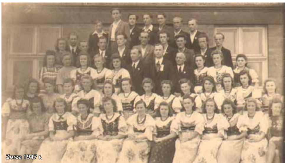
Zorza 1947 r.