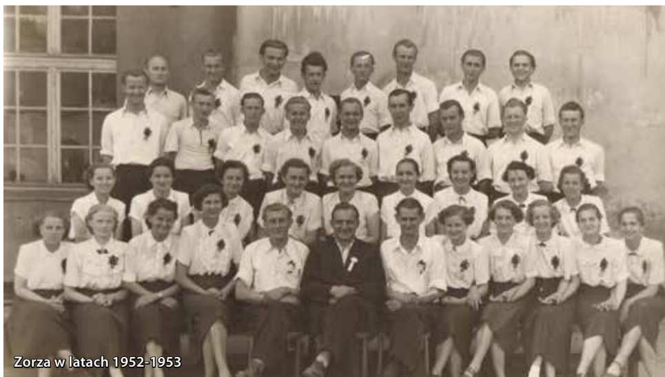
Zorza w latach 1952-1953