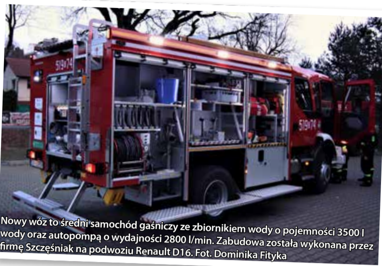
Nowy wóz to średni samochód gaśniczy ze zbiornikiem wody o pojemności 3500 l wody oraz autopompą o wydajności 2800 l/min. Zabudowa została wykonana przez firmę Szczęśniak na podwoziu Renault D16.