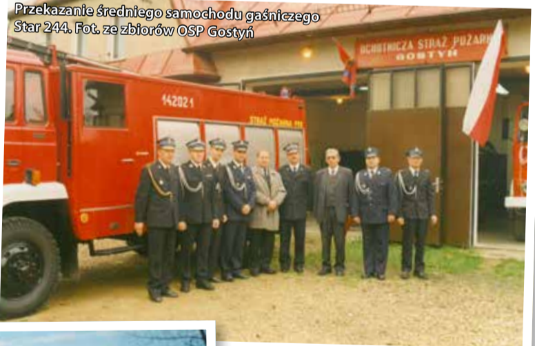
Przekazanie średniego samochodu gaśniczego Star 244.

zapaleniem lub nawet stopieniem się opon. Wóz ma też linię szybkiego natarcia i działko wodno-piankowe, dzięki czemu przy mniejszych pożarach, np. zapaleniu się jakiegoś kontenera ze śmieciami, nie