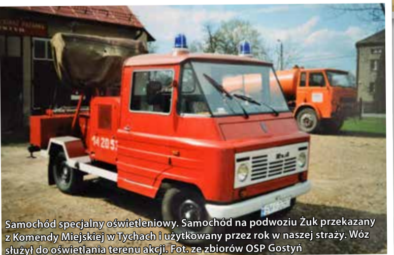
Samochód specjalny oświetleniowy. Samochód na podwoziu Żuk przekazany z Komendy Miejskiej w Tychach i użytkowany przez rok w naszej straży. Wóz służył do oświetlania terenu akcji.

ogromną radość. Niektórzy czasem naprawdę mnie zaskakiwali!