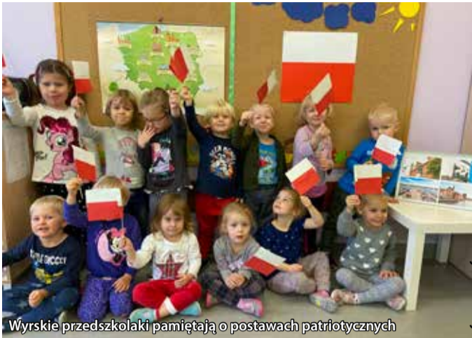
Wyrskie przedszkolaki pamiętają o postawach patriotycznych