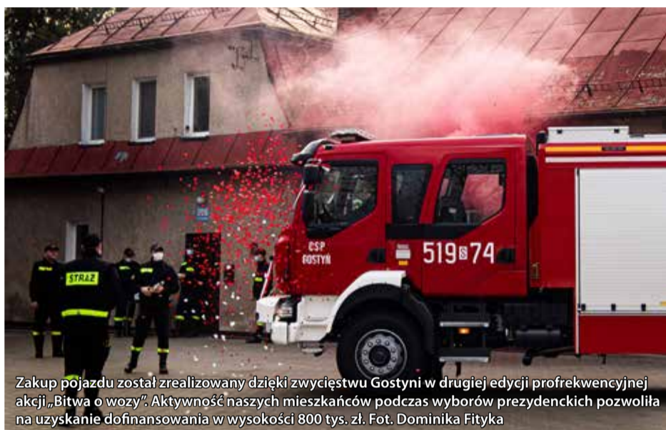
Zakup pojazdu został zrealizowany dzięki zwycięstwu Gostyni w drugiej edycji profrekwencyjnej akcji „Bitwa o wozy”. Aktywność naszych mieszkańców podczas wyborów prezydenckich pozwoliła na uzyskanie dofinansowania w wysokości 800 tys. zł.

P. Rzepka: W każdą sobotę przed pandemią o godz. 10 odbywały się zbiórki. W tej chwili niestety nie spotykamy się, ale mamy nadzieję, że wiosną wszystko wróci do normalności. Naszych nowych członków przede wszystkim pozyskujemy z młodzieżowej drużyny pożarniczej, która działa przy naszej jednostce. Młodzi przychodzą „falami” – z 10 nowych zostaje 2, 3. Zdarza się też, że osoby dorosłe przychodzą, pytają się o możliwość dołączenia do nas no i już kilka osób pełnoletnich się zapisało, zdało kursy i jeżdżą do akcji. Jest też zainteresowanie wśród nowych mieszkańców, przez to poznają nasze środowisko lokalne.