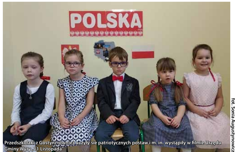
Przedszkolaki z Gostyni również uczyły się patriotycznych postaw i m. in. wystąpiły w filmie Urzędu Gminy Wyry „11 Listopada”