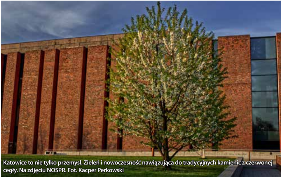
Katowice to nie tylko przemysł. Zielen i nowoczesność nawiązująca do tradycyjnych kamienic z czerwonej cegły. Na zdjęciu NOSPR.

...dla mnie to mnóstwo wspomnień. Miasto, mimo swojej bliskości względem Tychów, zawsze było odległą krainą (za siedmioma drogami, siedzioma mostami czy jakoś tak). Pierwszym wspomnieniem związanym z Katowicami był wyjazd do Urzędu Wojewódzkiego po paszport. 4-letni ja, duży autobus i jazda nim – całe 40 minut. Mimo obecności mamy i starszej siostry to wydarzenie zostanie ze mną już do samej śmierci. Na zawsze w moich oczach utrwaliła się winda jeżdżąca w koło bez zatrzymywania się i odbiór dziwnej purpurowej książeczki (dopiero potem dowiedziałem się, że to okno na świat.)