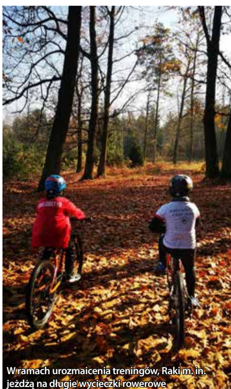
W ramach urozmaicenia treningów, Raki m. in. jeżdżą na długie wycieczki rowerowe