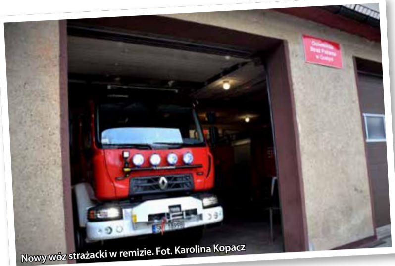
Nowy wóz strażacki w remizie.