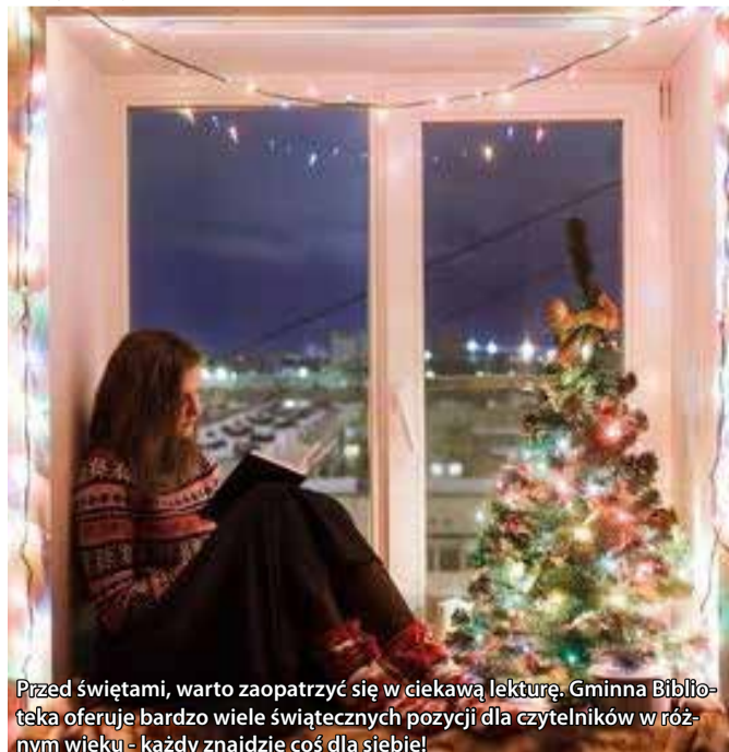
Przed świętami, warto zaopatrzyć się w ciekawą lekturę. Gminna Biblioteka oferuje bardzo wiele świątecznych pozycji dla czytelników w różnym wieku - każdy znajdzie coś dla siebie!

Zespół Gminnej Biblioteki Publicznej w Wyrach