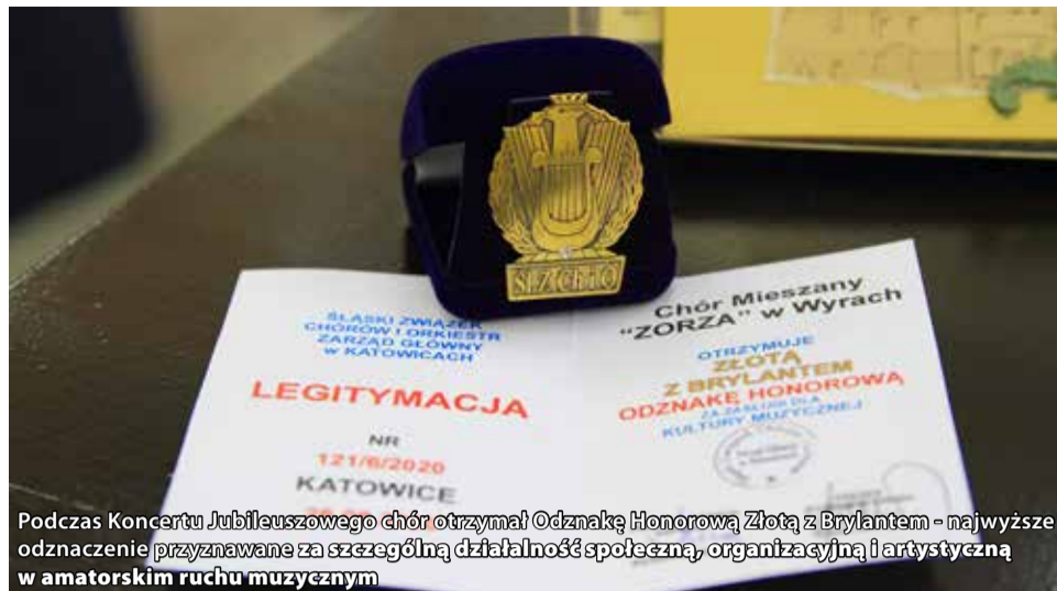
Podczas Koncertu Jubileuszowego chór otrzymał Odznakę Honorową Złotą z Brylantem - najwyższe odznaczenie przyznawane za szczególną działalność społeczną, organizacyjną i artystyczną w amatorskim ruchu muzycznym