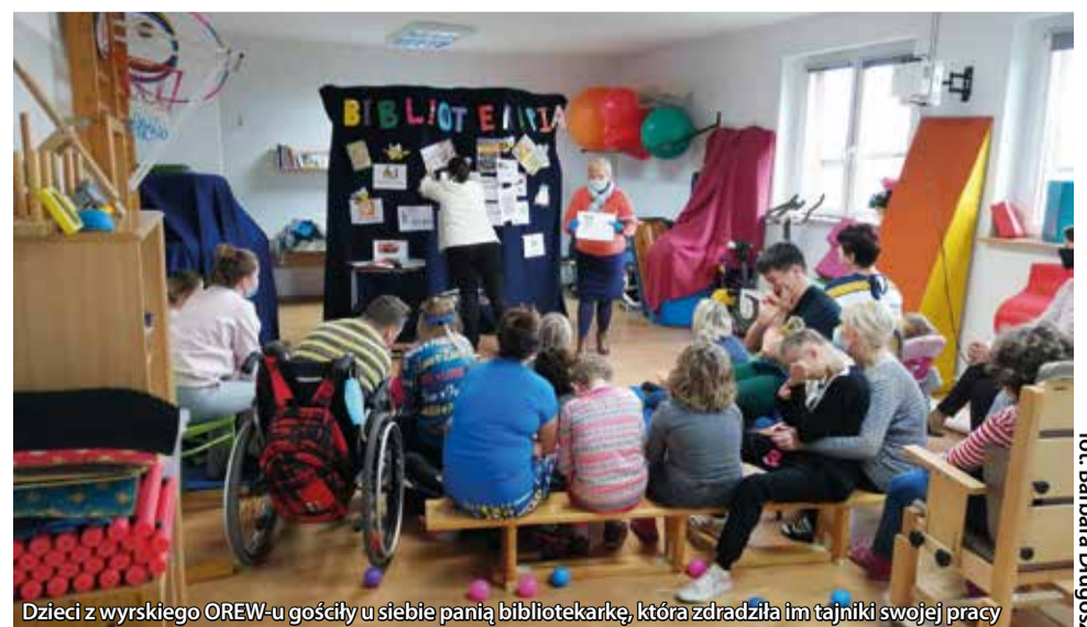
Dzieci z wyrskiego OREW-u gościły u siebie panią bibliotekarkę, która zdradziła im tajniki swojej pracy