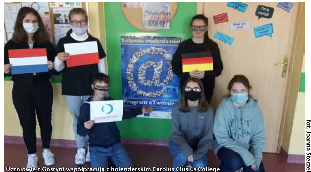
Uczniowie z Gostyni współpracują z holenderskim Carolus Clusius College