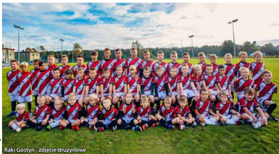
Raki Gostyń - zdjęcie drużynowe