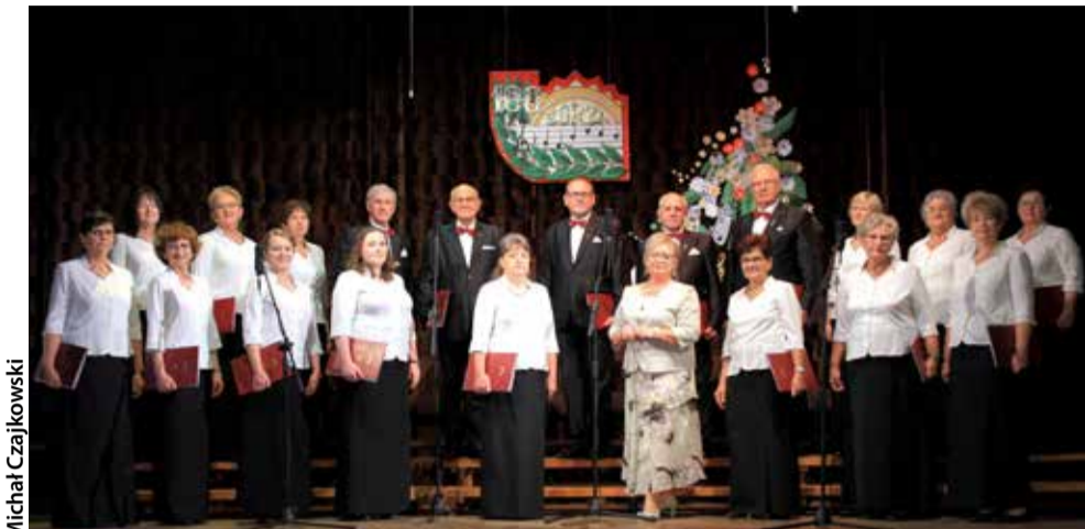
Chórzyści podczas Koncertu Jubileuszowego, który odbył się 2 października w Domu Kultury w Gostyni

Przygotowania do rozpoczęcia obchodów jubileuszu 100-lecia Zorzy trwały wiele miesięcy. Rozpoczęliśmy go jeszcze w 2019 r., kiedy to drugiego dnia świąt Bożego Narodzenia, w kościele NSPJ w Wyrach, rozbrzmiały dźwięki kolęd w wykonaniu Jubilata.