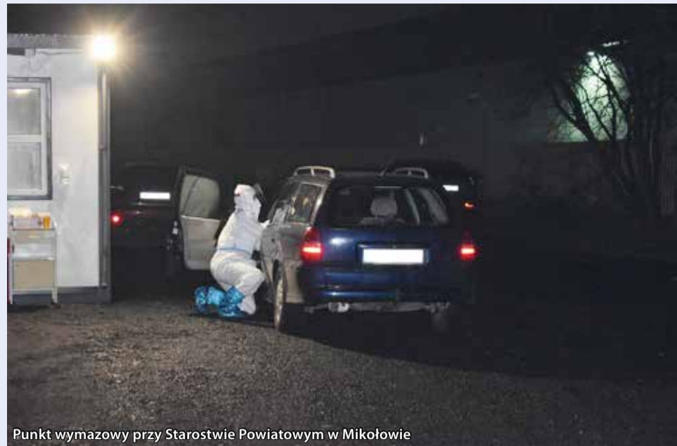
Punkt wymazowy przy Starostwie Powiatowym w Mikołowie

Na czas dojazdu do punktu pobrań wymazów i badania sanepid zwalnia pacjentów z kwarantanny. Powinni oni