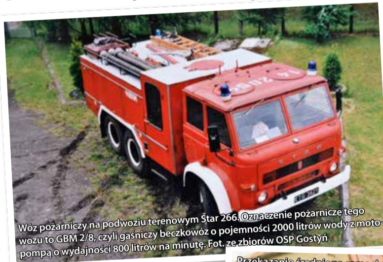
Wóz pożarniczy na podwoziu terenowym Star 266. Oznaczenie pożarnicze tego wozu to GBM 2/8, czyli gaśniczy beczkowóz o pojemności 2000 litrów wody z motopompą o wydajności 800 litrów na minutę.

Do akcji wozimy z roku na rok więcej specjalistycznego sprzętu, a to wszystko sporo waży. Stary samochód jeździł na granicy przeładowania, teraz nie ma tego problemu. Wszystkie skrytki są tak zaaranżowane, że cały ciężar jest odpowiednio rozłożony po obu stronach samochodu. Wóz zapewnia też wysoki komfort i bezpieczeństwo naszym strażakom – każdy posiada pasy bezpieczeństwa, jest też klimatyzowana kabina.