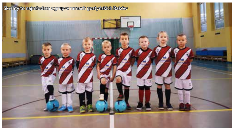
Skrzaty to najmłodsza z grup w ramach gostyńskich Raków