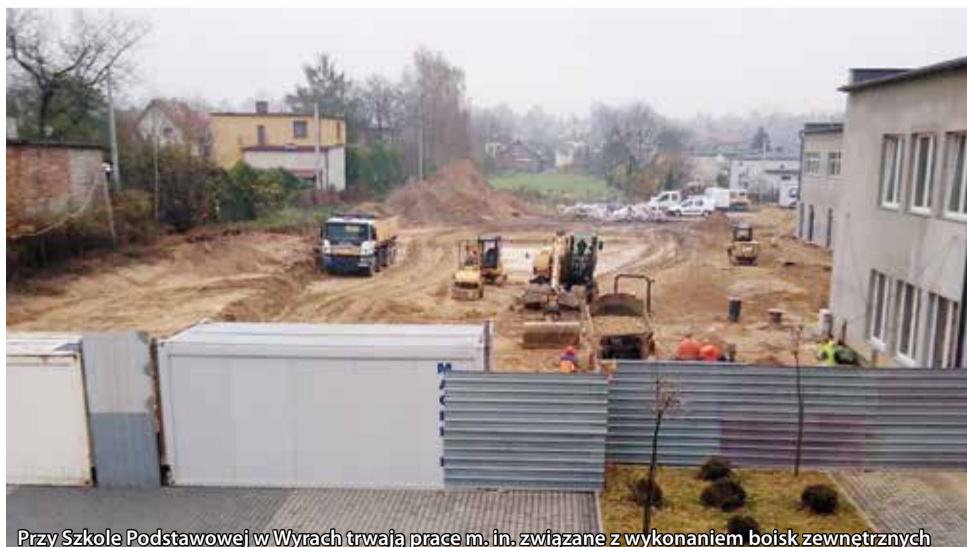
Przy Szkole Podstawowej w Wyrach trwają prace m. in. związane z wykonaniem boisk zewnętrznych