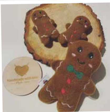
W ofercie ręcznie robionych świątecznych dekoracji firmy „Handmade with love” można znaleźć m. in. stroiki, pluszowe ciasteczka, czy skrzaty