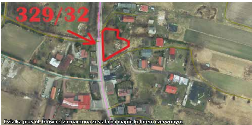
Działka przy ul. Głównej zaznaczona została na mapie kolorem czerwonym