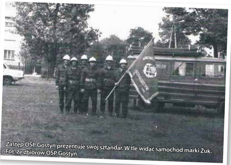
Zastęp OSP Gostyń prezentuje swój sztandar. W tle widać samochód marki Żuk.