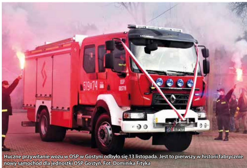
Huczne przywitanie wozu w OSP w Gostyni odbyło się 13 listopada. Jest to pierwszy w historii fabrycznie nowy samochód dla jednostki OSP Gostyń.