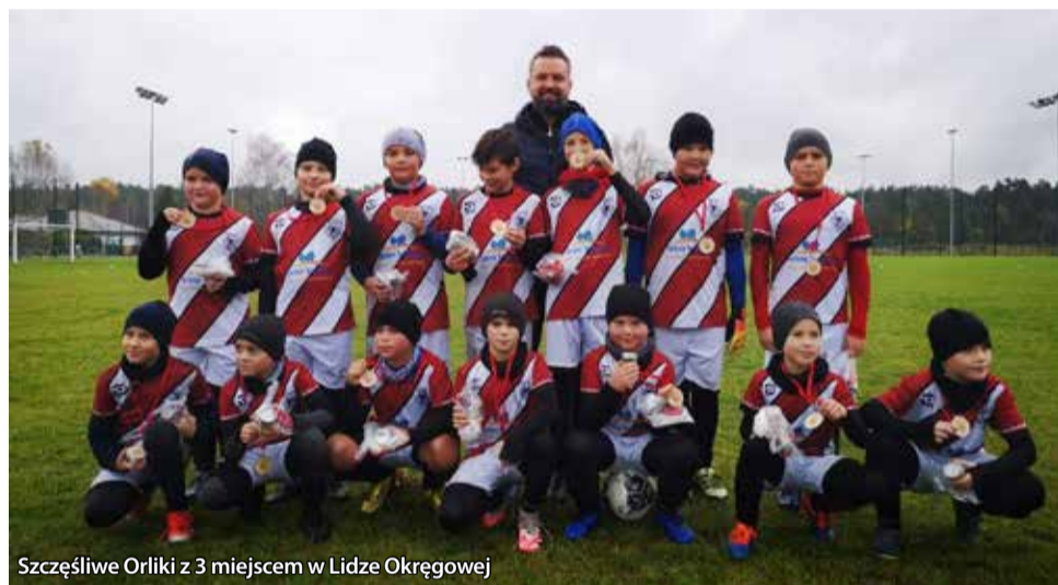
Szczęśliwe Orliki z 3 miejscem w Lidze Okręgowej