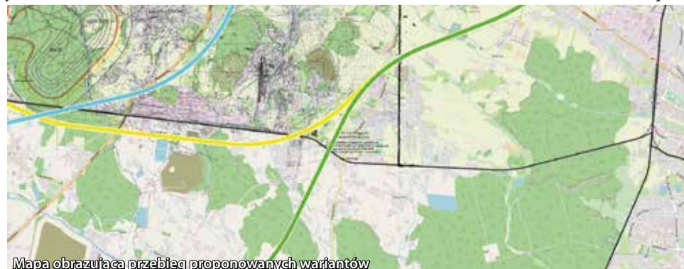
Mapa obrazująca przebieg proponowanych wariantów