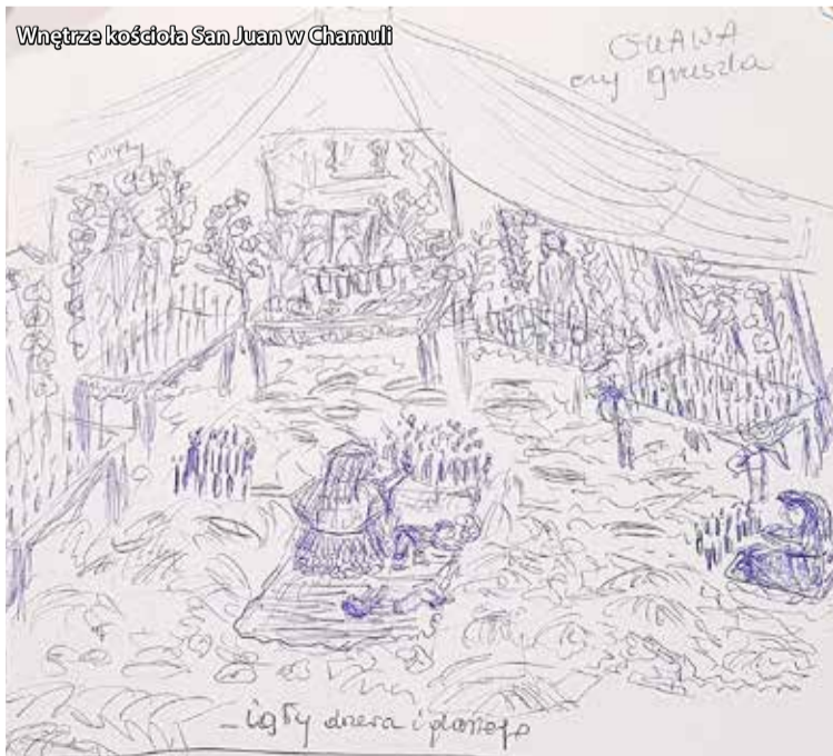
Wnętrze kościoła San Juan w Chamuli

Jest jeden temat, który wyjątkowo mnie ciekawi, jednak powstrzymuję się od pytania. Czekam. A może opowiemy o fabryce tequili? – w końcu pada z sali to pytanie. Reakcje są