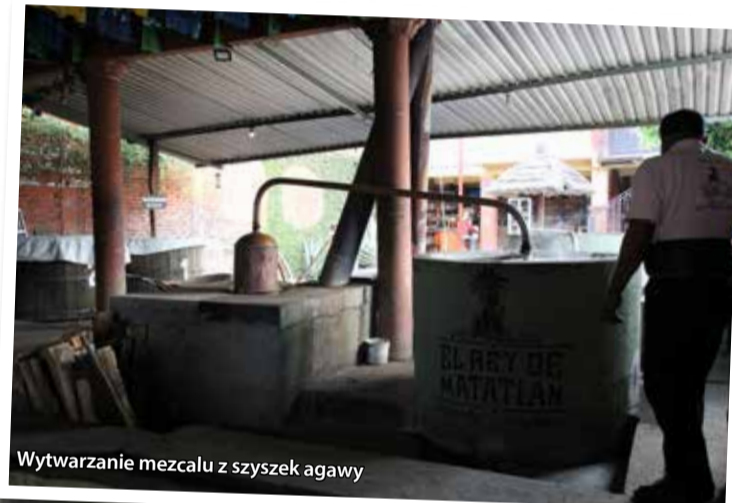
Wytwarzanie mezcalu z szyszek agawy

Miedziany Kanion, czyli wielki wąwóz, którego ściany miejscami osiągają wysokość 1400 metrów, co sprawia że jest głębszy niż