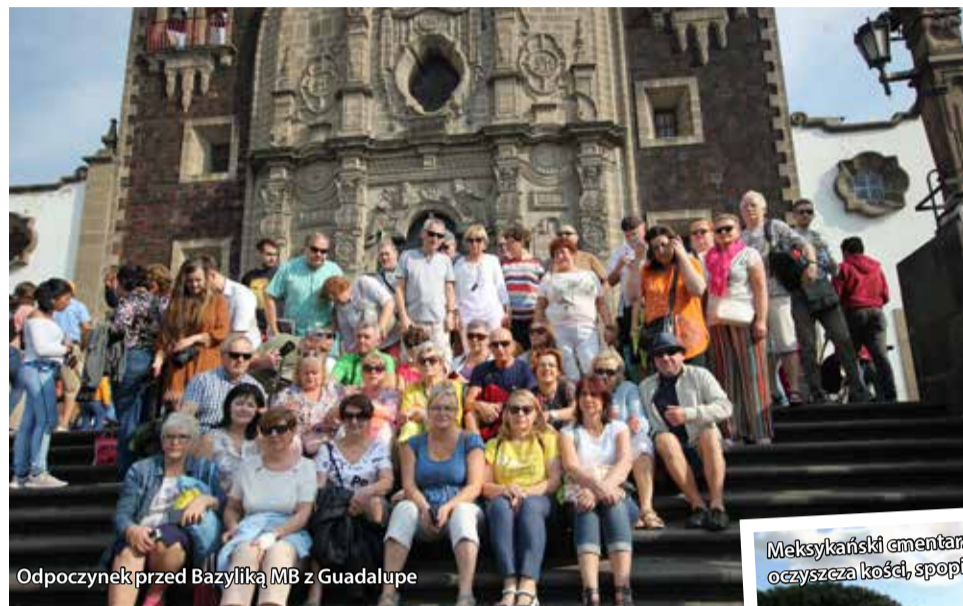
Odpoczynek przed Bazyliką MB z Guadalupe

W Meksyku panuje wszechobecny kult Jana Pawła II – ustanowione przez papieża Polaka Święto Matki Bożej z Guadalupe