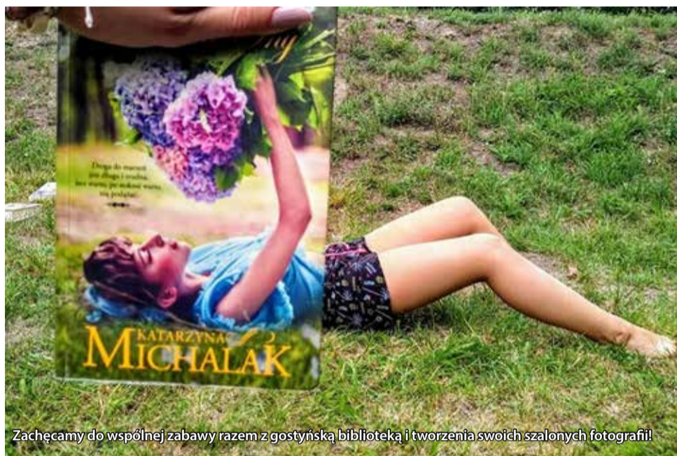
Zachęcamy do wspólnej zabawy razem z gostyńską biblioteką i tworzenia swoich szalonych fotografii!