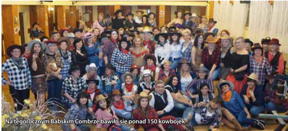
Na tegorocznym Babskim Combrze bawiło się ponad 150 kowbojek

Jak co rok na zakończenie karnawału Klub Kobiet Aktywnych działający pod gostyńskim Domem Kultury zorganizował tzw. Babski Comber. Impreza odbyła się 15 lutego, a jej tematem przewodnim był Dziki Zachód. Przepiękne ciekawe stroje uczestniczek oraz dekoracja sali i stołów, a także oprawa muzyczna i prowadzenie zabaw w wykonaniu zespołu Vento zagwarantowały niezapomniany nastrój zabawy.