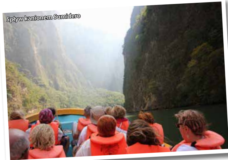
Splyw kantonem Sumidero

i koni arabskich na pokładzie samolotu. Faktycznie wylądowaliśmy z trudnościami. Najpierw grupa 45 osobowa, potem dwu, na samym końcu dotarło jeszcze 5 zagubionych osób. Ostatecznie wydano nam też wszystkie bagaże i od tego momentu mogliśmy już tylko