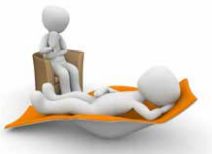
Szczegóły na stronie http://gopsy.eu/