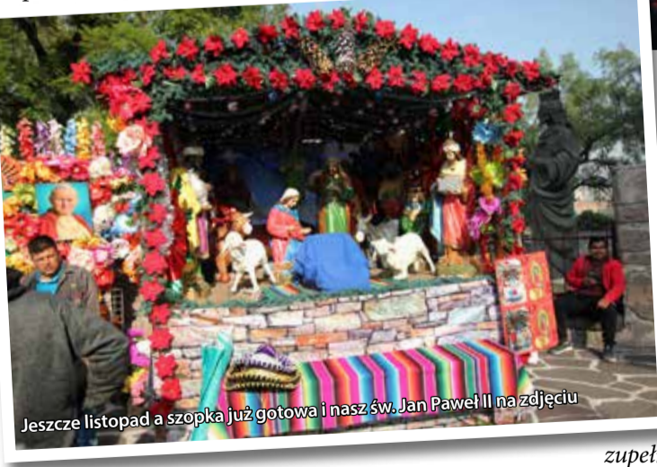
Jeszcze listopad a szopka już gotowa i nasz św. Jan Paweł II na zdjęciu

z perspektywy rdzennych meksykanów. Patrzył na świat ich oczami, a opowiadał, tak jakby był jednym z nich. Dzięki niemu zobaczyliśmy Meksyk „od środka”, a nie tylko powierzchownie z perspektywy turystów. Były odcinki, podczas których przemieszczaliśmy