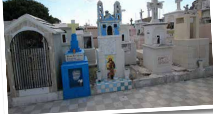
Meksykański cmentarz - po odpowiednim czasie wyłoga się zmarłych, oczyszcza kości, spopielia i wkłada do urny robiąc miejsce na nowy pochówek

na wiele niebezpieczeństw. Dlaczego wyruszają w tak niebezpieczną podróż? Bo nie mogą pozwolić sobie na inny środek transportu. Chcą też ominąć punkty kontroli granicznej w Meksyku. Narażeni są na deszcz, ekstremalne temperatury, odwodnienie, porażenia prądem. Wielu z nich straciło kończynę, bądź nawet życie, spadając z pociągu. Podróżując nielegalnie, migranci są bezbronni i narażeni na ataki, napady rabunkowe, gwałty i śmierć. Wielu z migrantów jest spychanych w trakcie snu przez swoich współpasażerów, którzy pozbywają się w ten okrutny sposób konkurencji. Wśród tego obrazu ludzkiego dramatu, istnieje grupa kobiet, które nie udają, że nie widzą pociągu wiozącego na dachu wycieńczonych ludzi. Przygotowują one posiłki, które, gdy pociąg zwalnia przejeżdżając przez ich wsie, rzucają głodnym i spragnionym migrantom. Świat widzi. Świat wie. Świat nie reaguje.