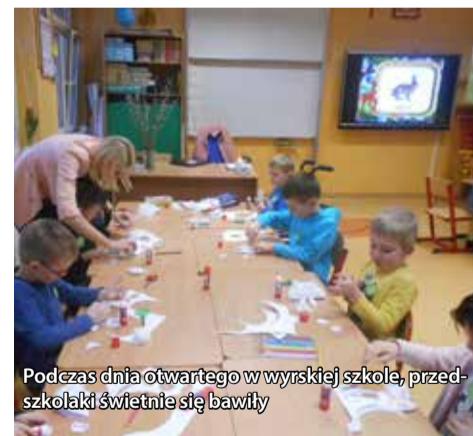
Podczas dnia otwartego w wyrskiej szkole, przedszkolaki świetnie się bawiły

4 marca do Szkoły Podstawowej w Wyrach zawitali przyszli pierwszoklasiści wraz z rodzicami i opiekunami. Mieli możliwość uczestniczenia w szkolnej lekcji, której tematem były zwierzęta leśne. Zachęcane przez nauczycielki, bez trudności wykonały zadane prace plastyczne – techniczne, którymi po lekcji mogły pochwalić się rodzicom. Ruda wiewiórka, papierowy lisek czy zajączek