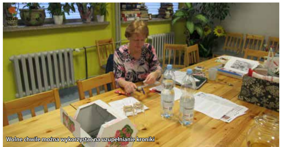
Wolne chwile można wykorzystać na uzupełnianie kroniki