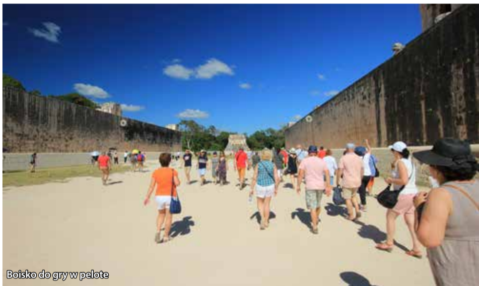
Boisko do gry w pelote

kultu. Piją ją nawet małe dzieci, którym podaje się ją jak najlepsze lekarstwo. Podobnym kultem objęty jest w Meksyku alkohol. W ko-