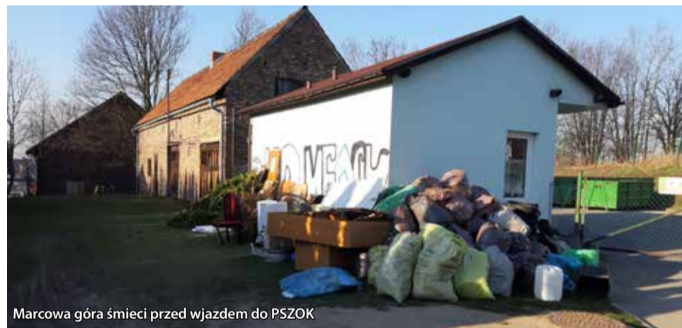
Marcowa góra śmieci przed wjazdem do PSZOK

Przypominamy, że Punkt Selektywnego Zbierania Odpadów Komunalnych (PSZOK) w Wyrach w związku z zagrożeniem epidemiologicznym został zamknięty. Bardzo prosimy o składowanie worków ze śmieciami do momentu wywozu na swoich posesjach i niewyrzucanie ich przed PSZOK.