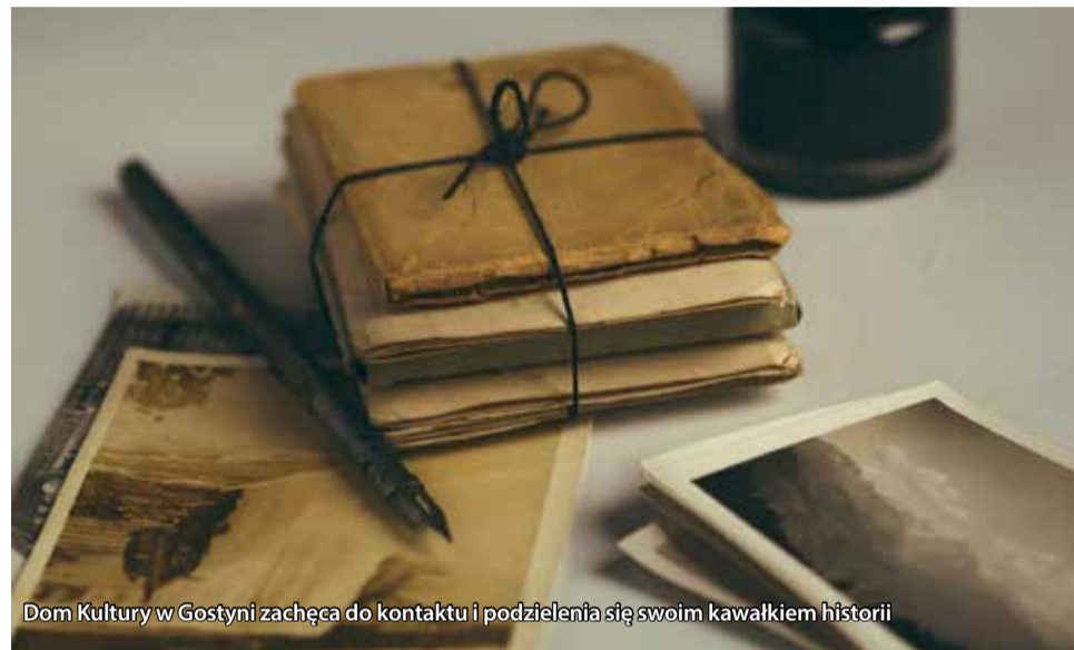
Dom Kultury w Gostyni zachęca do kontaktu i podzielenia się swoim kawałkiem historii