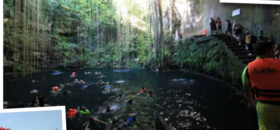
Cenota, czyli studnia krasowa (ta ma głębokość 12 metrów)

pięcie, które się w nas nagromadziło na początku podróży, za sprawą tych przygód z przelotem. Zaimponował mi wtedy. A wiedzę miał niesamowitą. Był też wyjątkowym smakoszem. Opowiadał wszystko jakby inaczej. Pokazywał