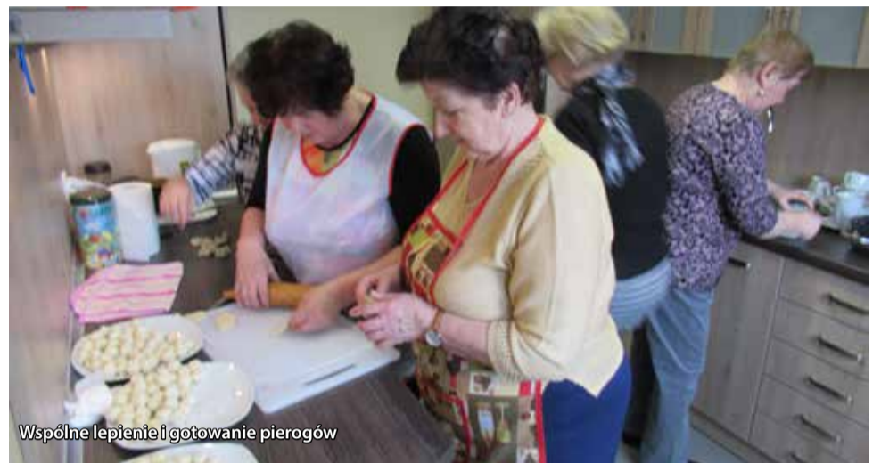
Wspólne lepienie i gotowanie pierogów