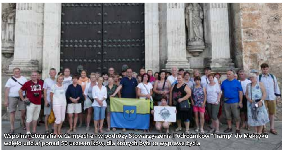
Wspólna fotografia w Campeche - w podróży Stowarzyszenia Podróżników "Tramp" do Meksyku wzięło udział ponad 50 uczestników, dla których była to wyprawa życia

Jean-Claude Carrière – „Alfabet zakochanego w Meksyku”