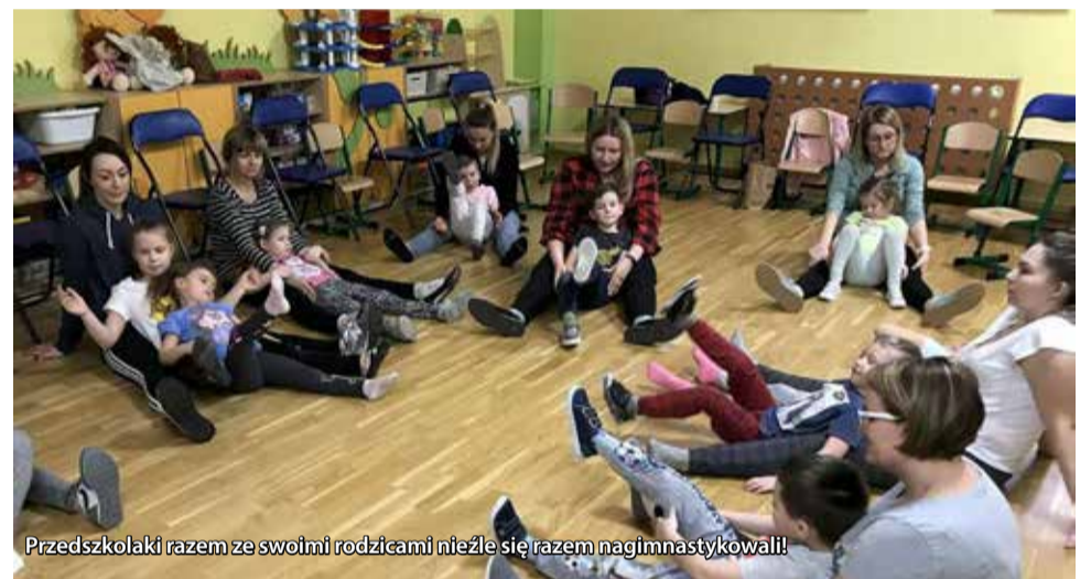
Przedszkolaki razem ze swoimi rodzicami nieźle się razem nagimnastykowali!

Misie z gostyńskiego przedszkola wraz z paniami zaprosiły rodziców na zajęcia popołudniowe. Najpierw takie zajęcia odbyły się z tatusiami. Były zabawy i gry dydaktyczne, zabawy ruchowe oraz wspólne konstruowanie ludzików z materiału przyrodniczego. Natomiast z mamami odbyły się zajęcia ruchowe, zabawy sportowe, ćwiczenia z elementami Ruchu Rozwijającego W.