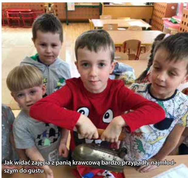
Jak widać zajęcia z panią krawcową bardzo przypadły najmłodszym do gustu