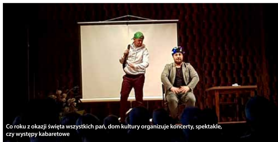
Co roku z okazji święta wszystkich pań, dom kultury organizuje koncerty, spektakle, czy występy kabaretowe

Czwarta Fala porwała wszystkie panie z okazji ich święta w świat pełen humoru.