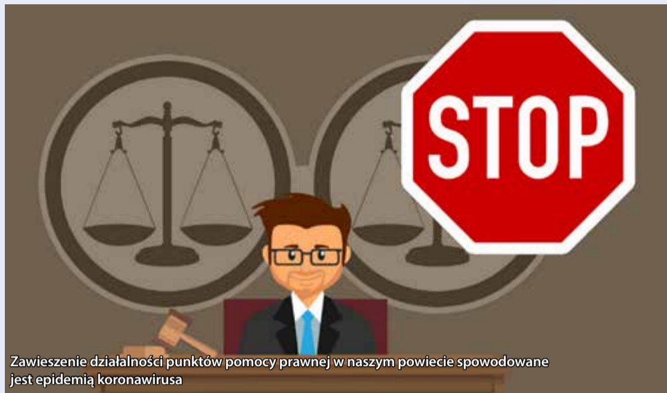
Zawieszenie działalności punktów pomocy prawnej w naszym powiecie spowodowane jest epidemią koronawirusa

W celu przeciwdziałania zagrożeniom związanym z wirusem COVID-19 Zarząd Powiatu Mikołowskiego tymczasowo zawiesił funkcjonowanie punktów nieodpłatnej pomocy prawnej w Miejskiej Bibliotece Publicznej w Orzeszu, Domu Kultury w Gostyni i Urzędzie Gminy w Ornontowicach.