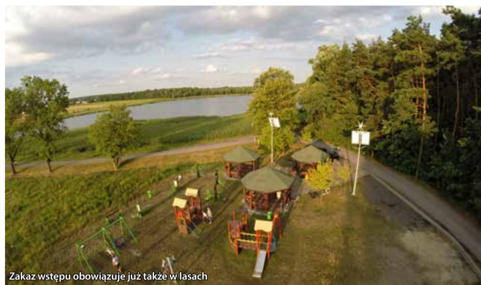
Zakaz wstępu obowiązuje już także w lasach

W związku z zagrożeniem epidemiologicznym do odwołania zamknięte zostały wszystkie obiekty sportowo-rekreacyjne, boiska, place zabaw oraz siłownie zewnętrzne na terenie naszej gminy.