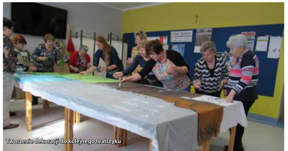
Tworzenie dekoracji do kolejnego teatrzyku