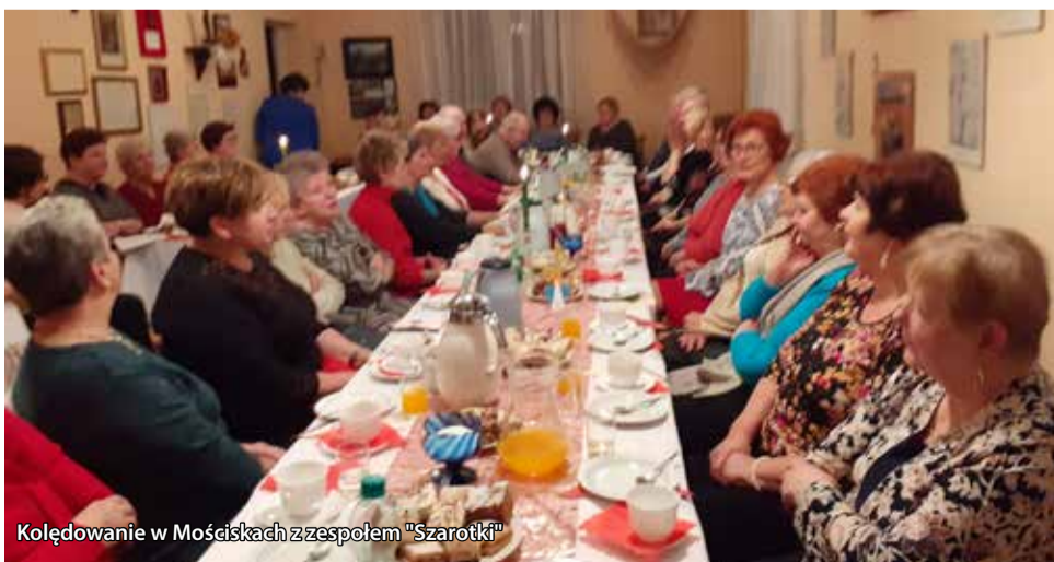
Kolędowanie w Mościskach z zespołem „Szarotki”