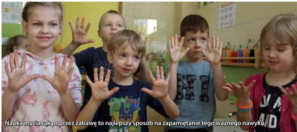
Nauka mycia rąk poprzez zabawę to najlepszy sposób na zapamiętanie tego ważnego nawyku

Wszystkie dzieci z Gminnego Przedszkola w Gostyni przypomniały sobie jak prawidłowo należy myć ręce, aby zapobiegać przenoszeniu różnych chorób.