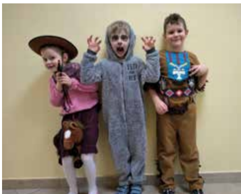
W lutym gostyńskie przedszkolaki bawiły się na balu, wzięły udział w aukcji charytatywnej, a także świętowały Dzień Nauki Polskiej