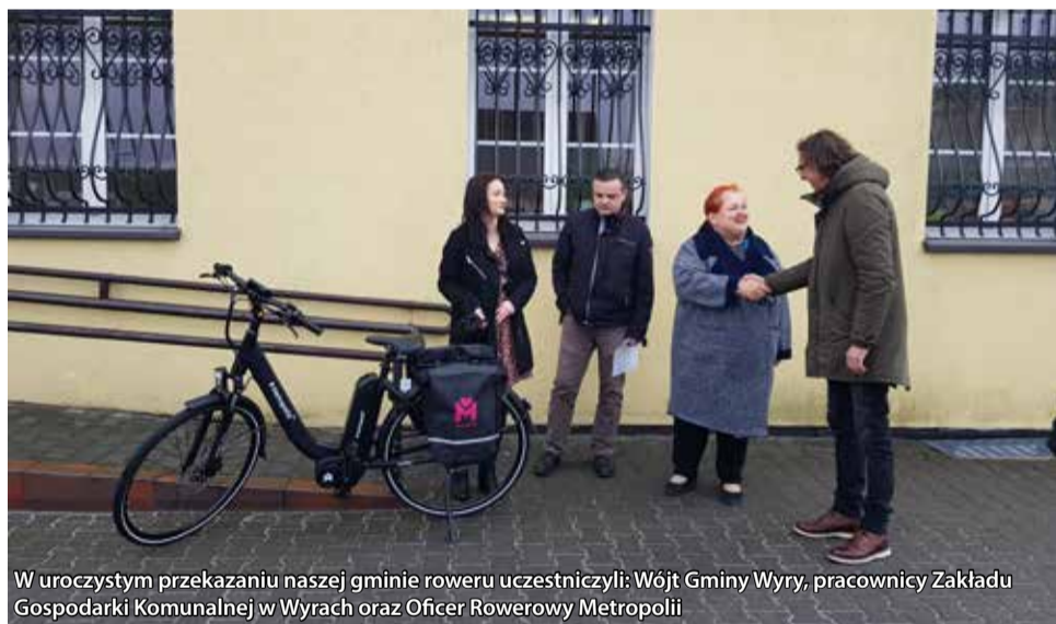
W uroczystym przekazaniu naszej gminie roweru uczestniczyli: Wójt Gminy Wiry, pracownicy Zakładu Gospodarki Komunalnej w Wyrach oraz Oficer Rowerowy Metropolii