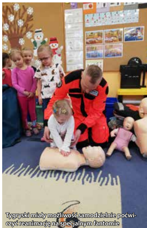
Tygryski miały możliwość samodzielnie poćwiczyć reanimację na specjalnym fantomie