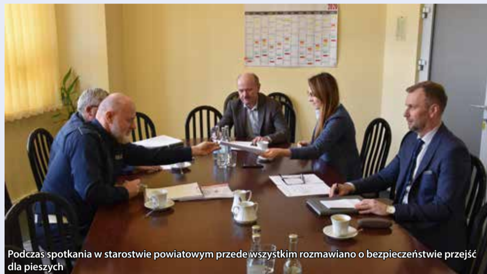
Podczas spotkania w starostwie powiatowym przede wszystkim rozmawiano o bezpieczeństwie przejść dla pieszych