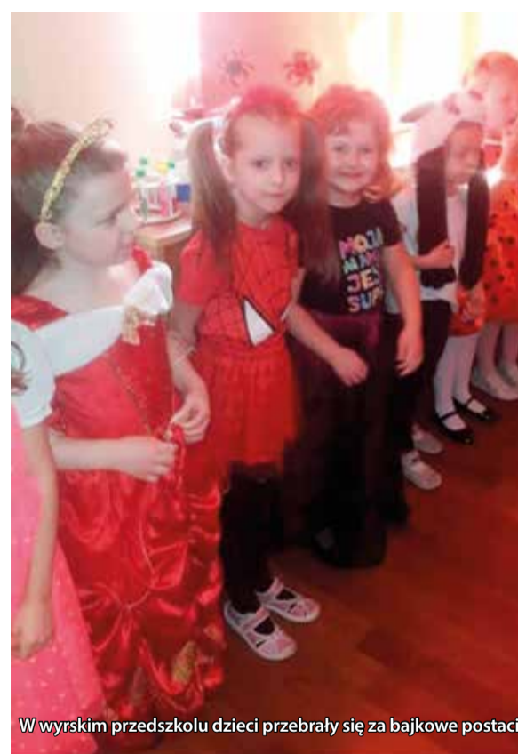
W wyrskim przedszkolu dzieci przebrały się za bajkowe postaci

Karnawał to okres zimowych zabaw, więc i u nas odbył się Walentynkowy Bal Przebierańców. Już od progu można było poczuć niecodzienny nastrój, ponieważ przedszkolaków witała wesoła muzyka, a walentynkowy wystrój przedszkola wprawiał w zachwyt i zachęcał do wspólnej zabawy. W tym wyjątkowym dniu przenieśliśmy się do wielkiej krainy bajek, w której każdy mógł być tym kim tylko zechciał. Na balu spotkaliśmy księżniczki i czarodziejki, żołnierzy i policjantów oraz wiele innych ciekawych postaci z ulubionych bajek. Niektórych trudno było rozpoznać. Na tę wyjątkową okazję zaprosiliśmy do prowadzenia balu wodzireja, który zachęcał dzieci do tańca i zabaw z przygotowaną muzyką, która była radosna i energetyczna. Muzyka porwała wszystkich do tańca w rytm makareny, walczyka, kaczuszek i innych przebojów znanych dzieciom. Przedszkolacy świetnie się bawili uczestnicząc wspólnie ze swoimi paniami w płasach. Spragnieni i zmęczeni zabawą przebierańcy mogli