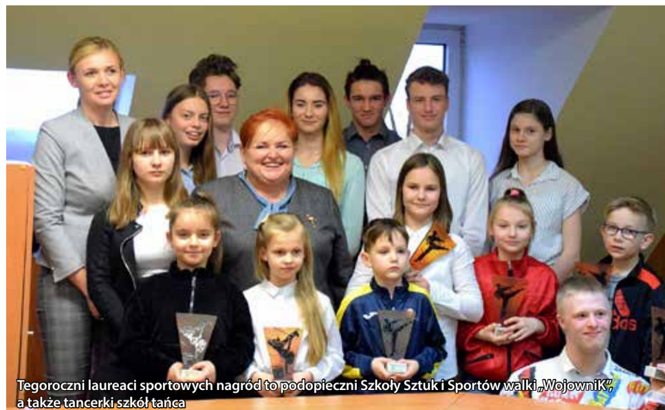
Tegorocznymi laureatami sportowych nagród to podopieczni Szkoły Sztuk i Sportów walki „Wojownik”, a także tancerki szkół tańca