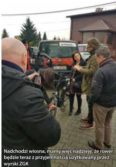
Nadchodzi wiosna, mamy więc nadzieję, że rower będzie teraz z przyjemnością użytkowany przez wyrski ZGK