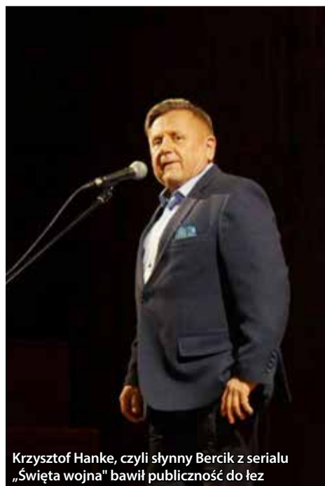
Krzysztof Hanke, czyli słynny Bercik z serialu „Święta wojna” bawił publiczność do łez

Tłusty czwartek to w tradycji chrześcijańskiej ostatni czwartek przed Wielkim Postem, w czasie którego można było się objadać bez posądzenia o obżarstwo. W polskiej tradycji przyjęło się zjadanie pączkami, które kiedyś były nierzadkie, słodkie nadzienia – tradycyjna marmolada różana, ale także bita śmietana, adwokat czy czekolada.