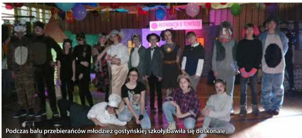
Podczas balu przebierańców młodzież gostyńskiej szkoły bawiła się doskonale