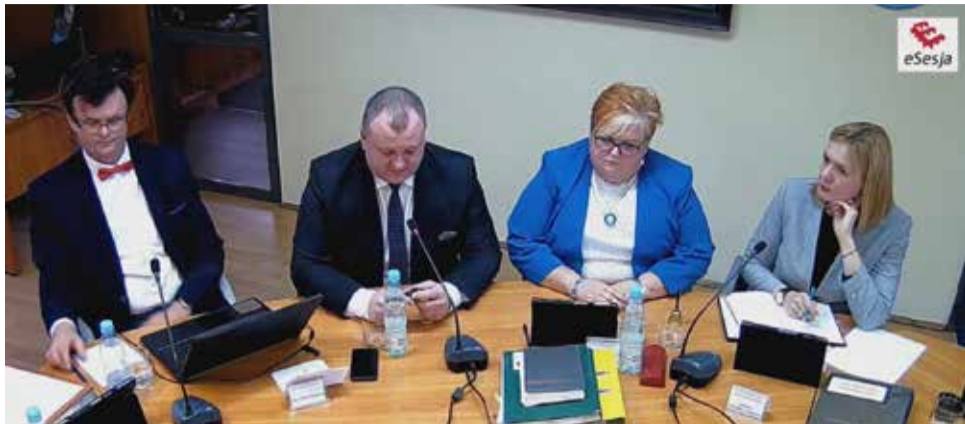
Wszystkie Sesje Rady Gminy są transmitowane w programie eSesja

XV sesja Rady Gminy Wyry VIII kadencji odbyła się 27 lutego. Podczas posiedzenia przyjęto następujące uchwały: