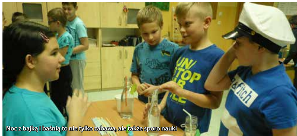
Noc z bajką i baśnią to nie tylko zabawa, ale także sporo nauki

– Tosią i Belą, przeprowadzili zajęcia dotyczące praw zwierząt oraz odpowiedzialnego ich traktowania, a także poinformowali jak pomagać bezdomnym zwierzętom. Właśnie