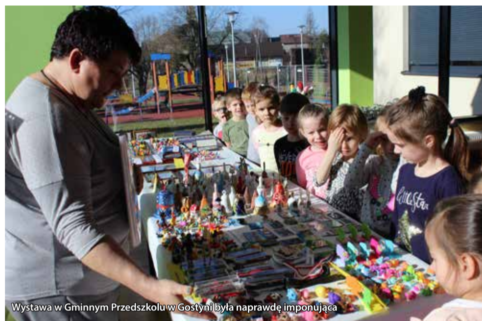
Wystawa w Gminnym Przedszkolu w Gostyni była naprawdę imponująca

Grupa Biedronek z Gminnego Przedszkola w Gostyni w lutym realizowała cykl zajęć na temat Moje hobby, moje pasje . Dzieci zaprosiły na zajęcia przedszkolne panie kucharki, których pasją jest szydełkowanie. Panie pokazały swoje dzieła i przybliżyły dzieciom tajniki ręcznych robótek. Przedszkolaki opowiadały o swoich pasjach i przyniosły do przedszkola swoje kolekcje figurek Zings, Maji Pops, Pet Shop, książeczek, lalek Disneya czy albumy z kartami piłkarzy. Wówczas zrodził się pomysł urządzenia wystawy, w którą włączyli się nauczyciele, pracownicy przedszkola, rodzice