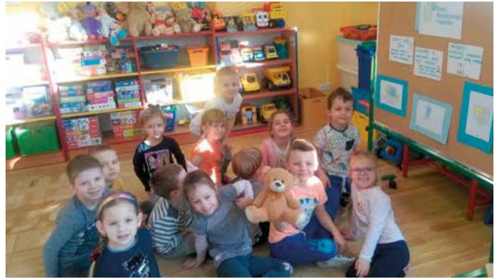
W internecie czyha na dzieci mnóstwo niebezpieczeństw, ważne jest żeby już od najmłodszych lat dzieci o tym wiedziały