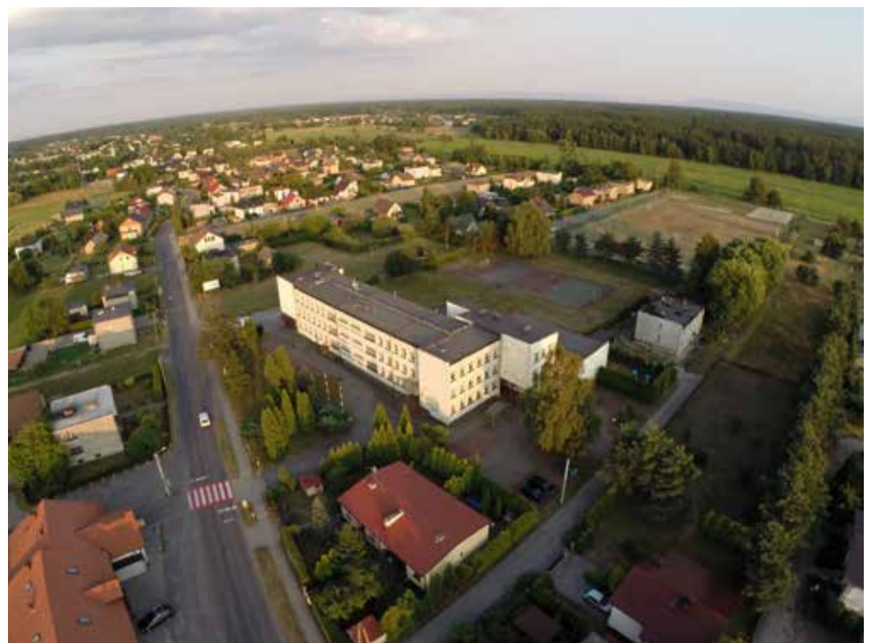
Gmina planuje przebudować odwodnienie dachu sali gimnastycznej gostyńskiej szkoły, poprawić jej wentylację, a także naprawić elewację budynku