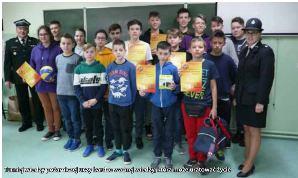
Turniej wiedzy pożarniczej uczy bardzo ważnej wiedzy, która może uratować życie