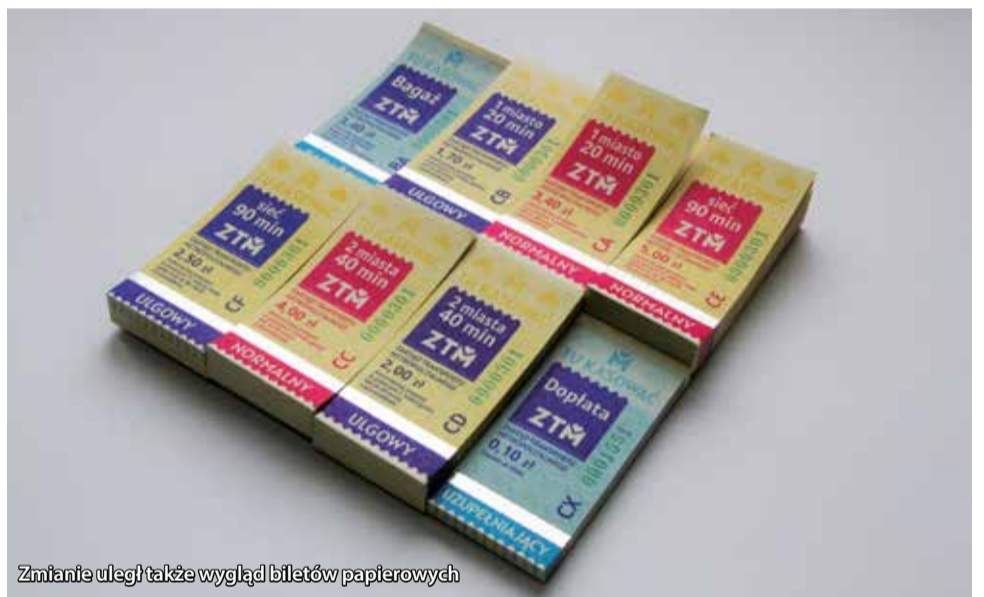
Zmianie uległ także wygląd biletów papierowych

długookresowe: jest to bilet „7-dniowy”, „Miasto 30”, „Miasto 90”, „Sieć 30”, „Sieć 90”, „Sieć 120”, „Sieć 30 Okaziciel”. W przypadku tych biletów uproszczone zostały ich nazwy, obniżono także cenę najpopularniejszego 30-dniowego biletu obejmującego całą sieć ZTM. Do oferty