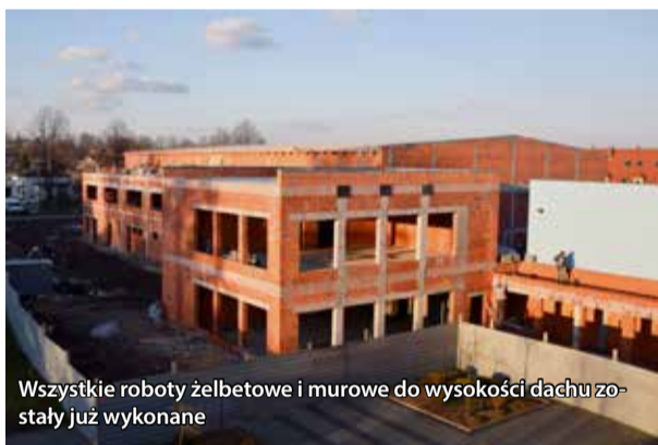
Wszystkie roboty żelbetowe i murowe do wysokości dachu zostały już wykonane

Poza tym do tej pory dokończono już wszystkie roboty żelbetowe i murowe do wysokości dachu, zamontowano więźbę dachową nad salą gimnastyczną oraz rozdeskowano stropy i widownię. Obecnie trwa jeszcze murowanie ścian attyk i szczytowych wraz z wykonywaniem rdzeni żelbetowych, murowane są ścianki działowe, sukcesywnie dokonuje się też rozdeskowania elementów żelbetowych na sali gimnastycznej.