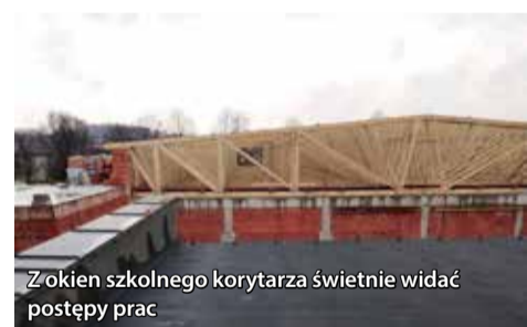
Z okien szkolnego korytarza świetnie widać postępy prac