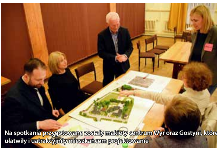
Na spotkania przygotowane zostały makietę centrum Wyr oraz Gostyni, które ułatwiły i uatrakcyjniły mieszkańcom projektowanie

zowanie centrum, wprowadzenie nowych funkcji miejsc już istniejących, a także na dodanie do przestrzeni centrum nowych elementów. Zaproponowali oni następujące zmiany: