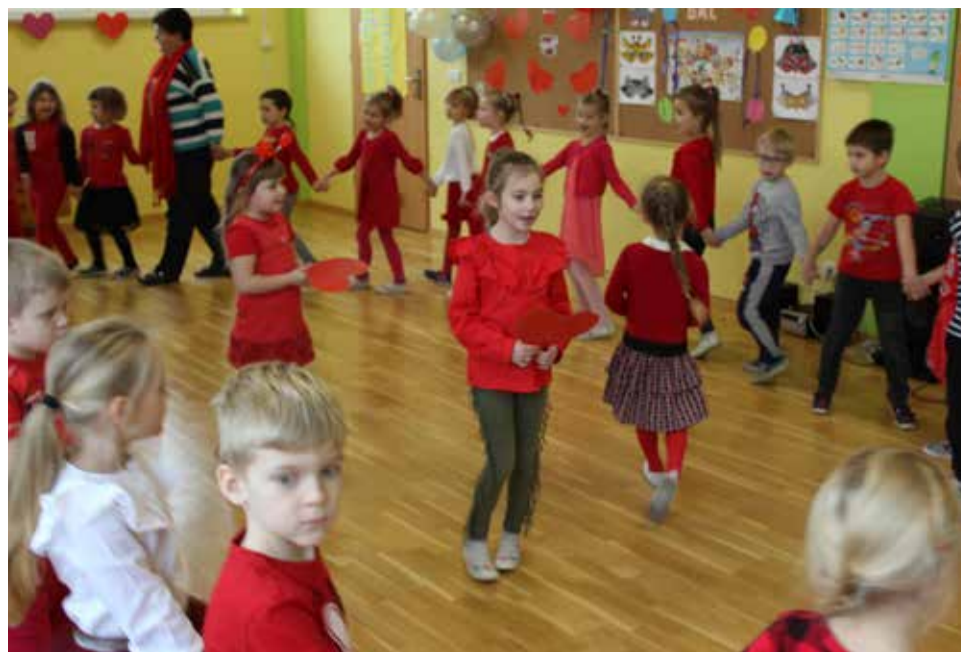
W gostyńskim przedszkolu nie zabrakło walentynkowych zabaw i tańca z serduszkami