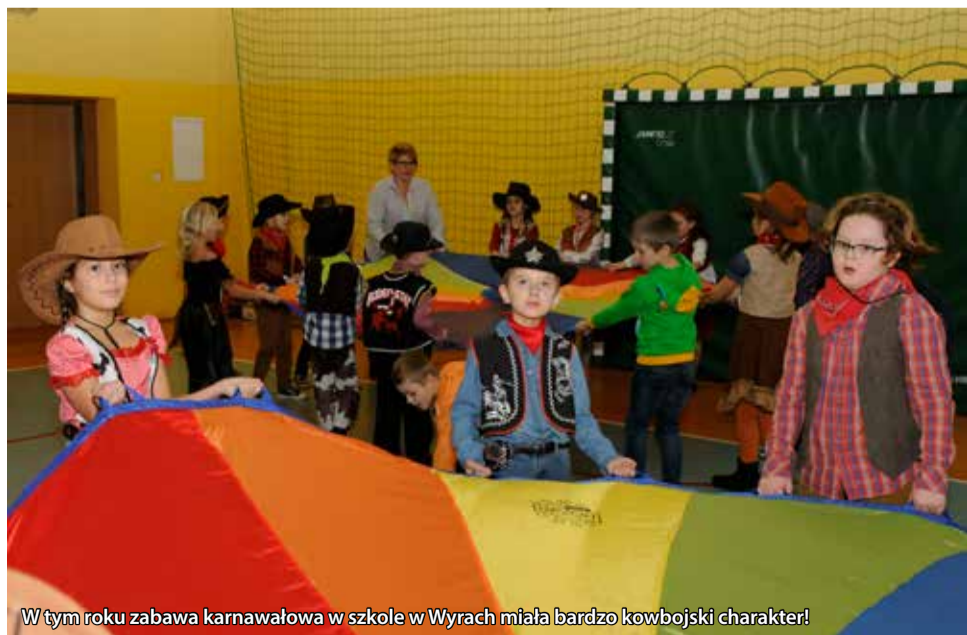
W tym roku zabawa karnawałowa w szkole w Wyrach miała bardzo kowbojski charakter!