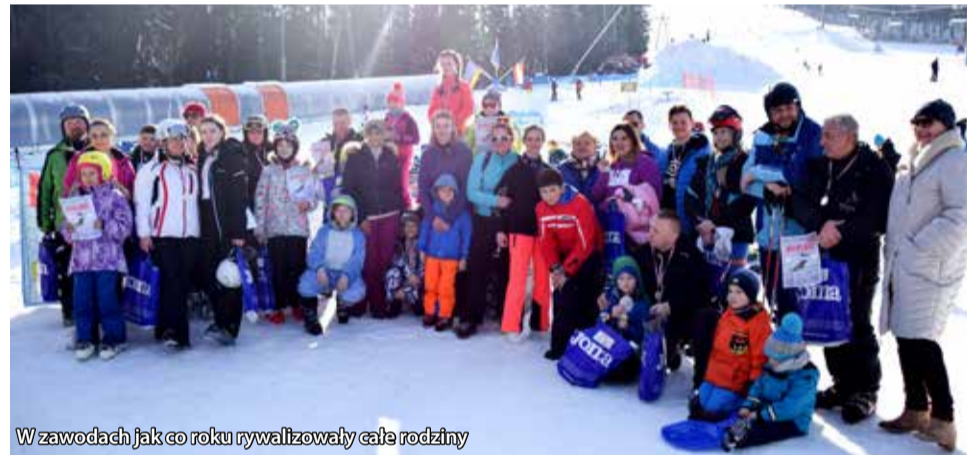
W zawodach jak co roku rywalizowały całe rodziny