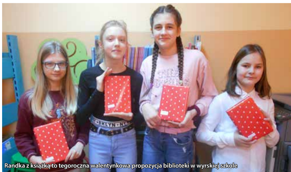
Randka z książką to tegoroczna walentynkowa propozycja biblioteki w wyrskiej szkole