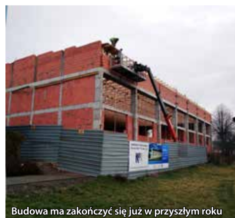
Budowa ma zakończyć się już w przyszłym roku