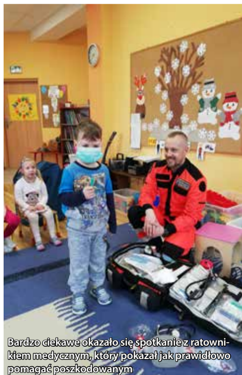
Bardzo ciekawe okazało się spotkanie z ratownikiem medycznym, który pokazał jak prawidłowo pomagać poszkodowanym