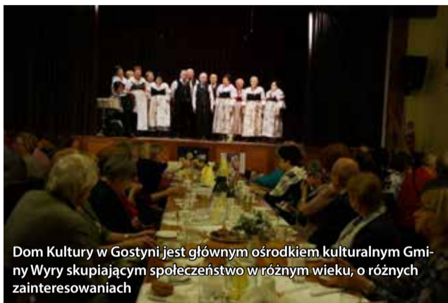
Dom Kultury w Gostyni jest głównym ośrodkiem kulturalnym Gminy Wyry skupiającym społeczeństwo w różnym wieku, o różnych zainteresowaniach