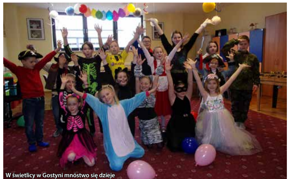
W świetlicy w Gostyni mnóstwo się dzieje