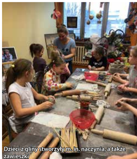
Dzieci z gliny stworzyły m.in. naczynia, a także zawieszki