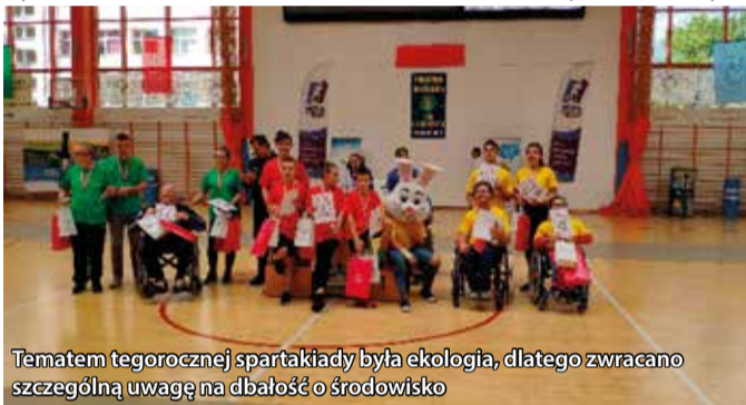
Tematem tegorocznej spartakiady była ekologia, dlatego zwracano szczególną uwagę na dbałość o środowisko

Głównym celem imprezy jest integracja osób niepełnosprawnych z pełnosprawnymi oraz popularyzowanie idei, że wszyscy mogą uprawiać sport. Uczniowie czterech szkół patronackich, w tym naszej, tworzyli drużyny wraz z osobami niepełnosprawnymi. Formując drużynę „czerwonych” nasi uczniowie dzielnie walczyli ramię w ramię z wychowankami Zespołu Szkół Specjalnych nr 2 w Mikołowie.