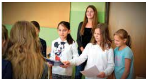
Warsztaty były traktowane jak jednostki lekcyjne, a nie zajęcia dodatkowe. Nauczyciele nie byli tylko biernymi obserwatorami poczynań uczniów, ale realnie i z własnej woli angażowali się w działania