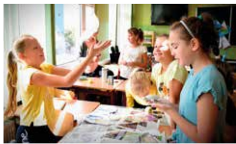
Podczas kolejnych zajęć, instruktorzy bazowali już tylko na własnych pomysłach uczniów, ponieważ projekt zakładał ich maksymalną aktywizację i zachęcenie do aktywności społeczno-kulturalnej