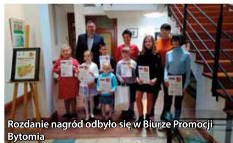
Rozdanie nagród odbyło się w Biurze Promocji Bytomia