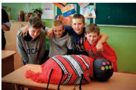
Koncepcja warsztatów opierała się na kulturze śląskiej. Działania oparte były o 3 bloki tematyczne: „Pokaż Śląsk” (blok teatralny), „Usłysz Śląsk” (blok muzyczny) i „Dotknij Śląska” (blok artystyczny)