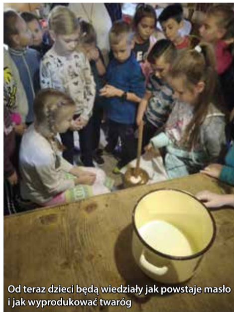
Od teraz dzieci będą wiedziały jak powstaje masło i jak wyprodukować twaróg