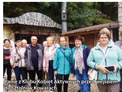
Panie z Klubu Kobiet Aktywnych przed wejściem do sztolni w Kowarach