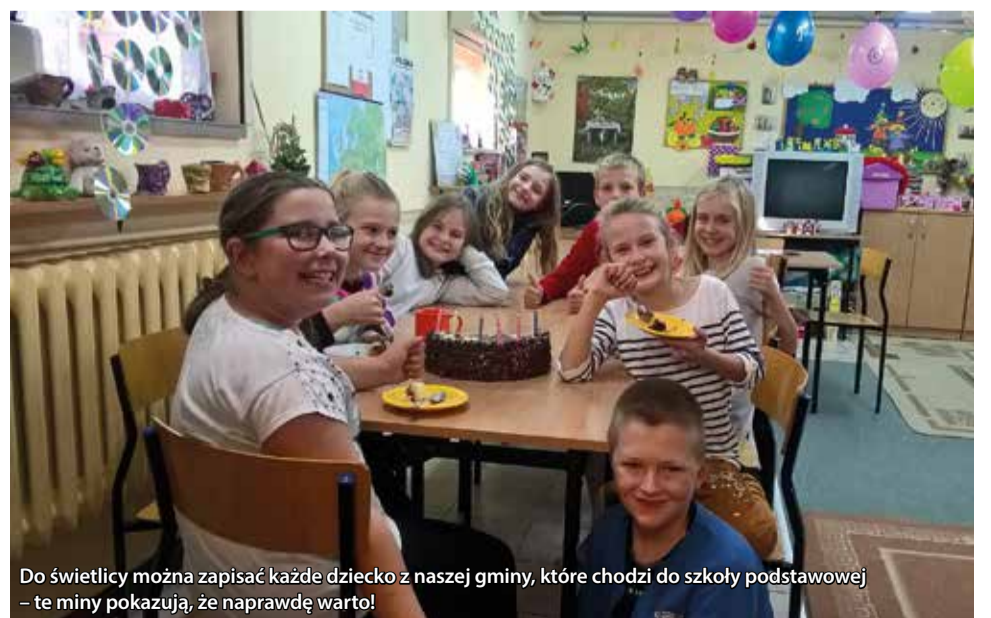
Do świetlicy można zapisać każde dziecko z naszej gminy, które chodzi do szkoły podstawowej – te miny pokazują, że naprawdę warto!