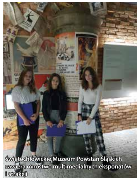
Świętochłowickie Muzeum Powstań Śląskich zawiera mnóstwo multimedialnych eksponatów i atrakcji