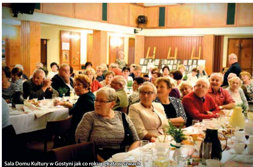
Sala Domu Kultury w Gostyni jak co roku pękała w szwach