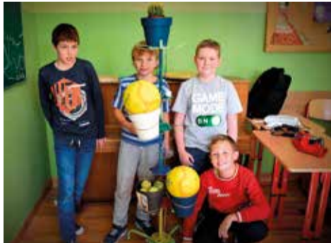
Każda klasa otrzymała inny gatunek kultury