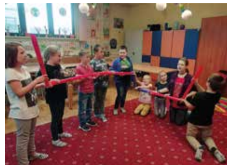
Wszystkie zajęcia mają na celu wszechstronnie pobudzać rozwój dzieci