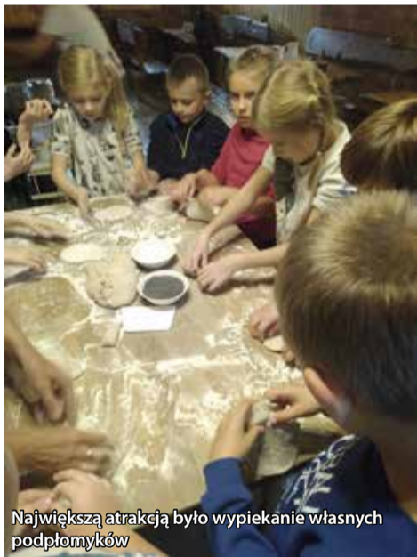
Największą atrakcją było wypiekanie własnych podpłomyków