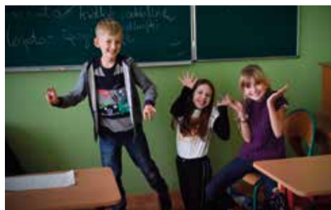
Uczniowie bloku teatralnego podczas warsztatów przygotowali scenkę prezentującą śląską kulturę, wykorzystując ekspresję swojego ciała