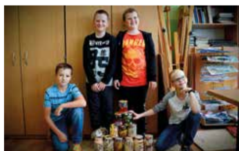
Instalacje przygotowane przez blok artystyczny były wizualizacją ciekawych śląskich słów, takich jak: wichajster, krauza, blumsztynder, ajntopf oraz cwiter.