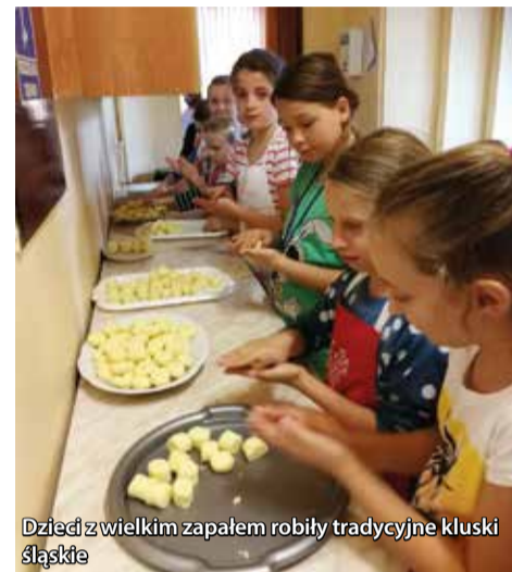
Dzieci z wielkim zapalem robiły tradycyjne kluski śląskie

serdecznie dziękujemy paniom z Klubu Kobiet Aktywnych za zaproszenie.