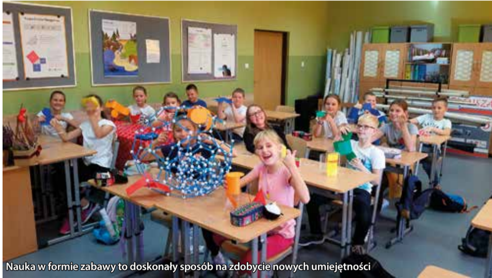
Nauka w formie zabawy to doskonały sposób na zdobycie nowych umiejętności