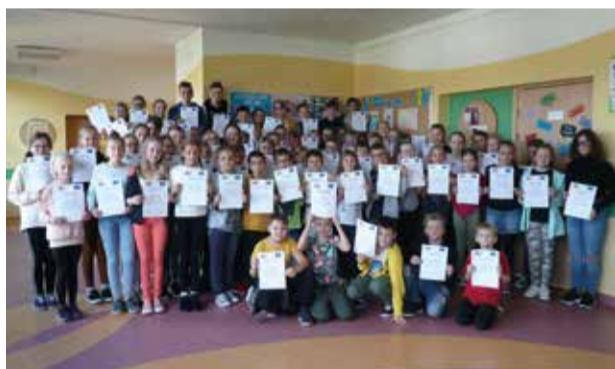
W gostyńskiej szkole podstawowej uczniowie wzięli udział w konkursie wiedzy o językach świata

Uczniowie Szkoły Podstawowej w Gostyni, 26 września, wzięli udział w obchodach Europejskiego Dnia Języków ustanowionego w 2001 roku przez Radę Europy. Dzień ten ma na celu promowanie nauki języków obcych, pokazanie korzyści płynących ze znajomości języków, a także ukazanie bogactwa kulturowego Europy. W tym roku uczniowie uczcili to „językowe święto” wykonując plakaty zachęcające do nauki języków obcych oraz przystępując do konkursu wiedzy o językach świata. Trzeba zaznaczyć, że wszyscy jego uczestnicy wykazali się imponującą wiedzą.