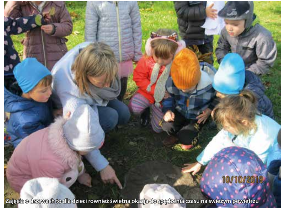
Zajęcia o drzewach to dla dzieci również świetna okazja do spędzenia czasu na świeżym powietrzu