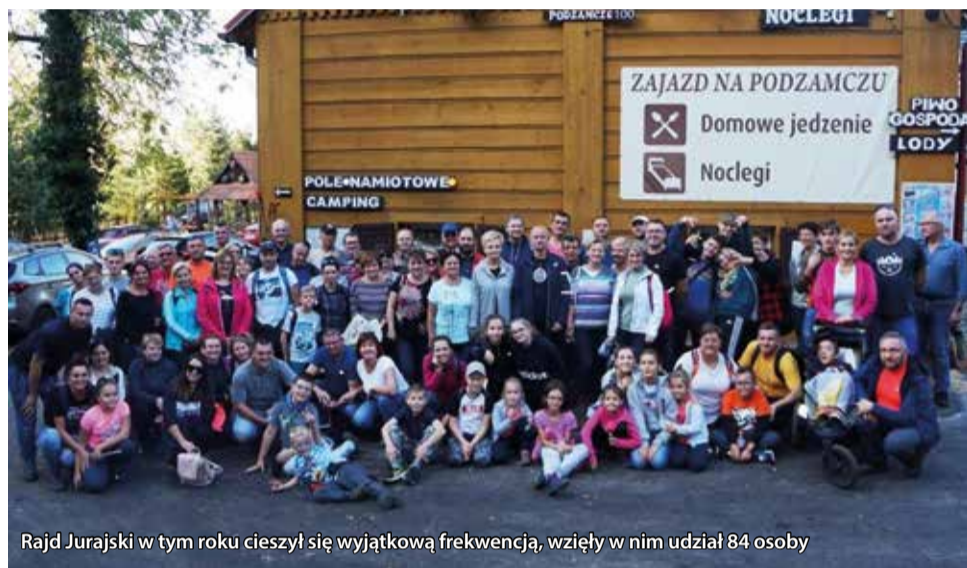
Rajd Jurajski w tym roku cieszył się wyjątkową frekwencją, wzięły w nim udział 84 osoby