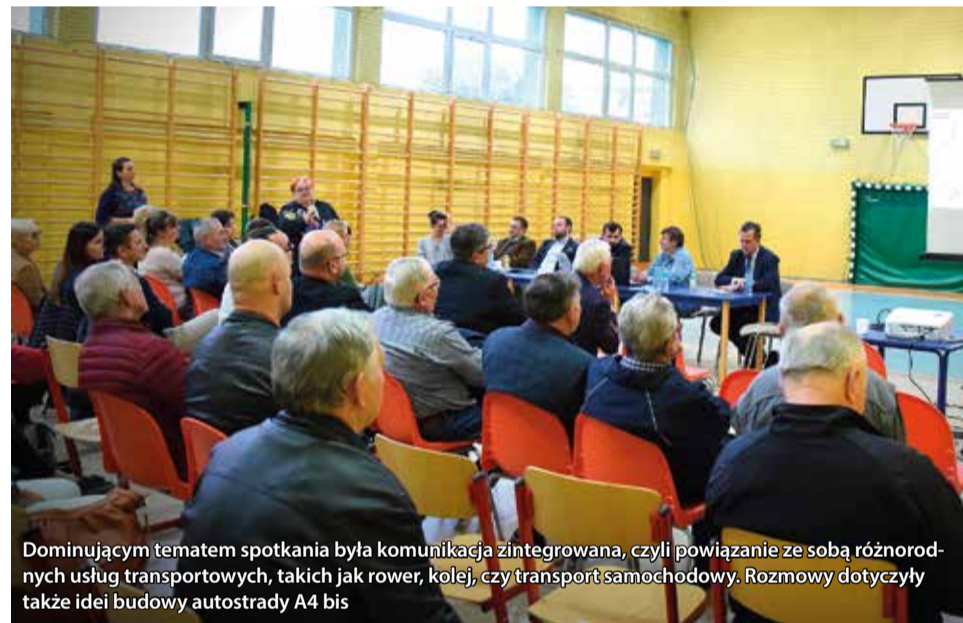
Dominującym tematem spotkania była komunikacja zintegrowana, czyli powiązanie ze sobą różnorodnych usług transportowych, takich jak rower, kolej, czy transport samochodowy. Rozmowy dotyczyły także idei budowy autostrady A4 bis

zleca się w drodze przetargu podmiotowi zewnętrznemu. Czas jego sporządzenia wynosi od 1,5 roku do 2 lat. Dodatkowo należy doliczyć około 4-6 miesięcy na procedurę przetargową. Kończącym elementem STEŚ jest analiza, która wskazuje preferowany wariant przyszłej drogi.