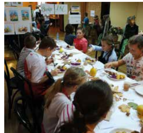
Warsztaty kulinarne dla uczniów zorganizował Klub Kobiet Aktywnych

16 października Dom Kultury przywitał dzieci niesamowitym zapachem śląskich rolad, przez co wyostrzyły się u nich apetyty. Podczas warsztatów dzieci pomagały w gotowaniu śląskiego obiadu. Najbardziej zaangażowały się w przygotowanie klusek. Pod okiem pań estetycznie nakryły stół, wykazując się niezwykłą kreatywnością. Stół został udekorowany darami jesieni – kolorowymi liśćmi, żółdziejami, miniaturowymi dyniami oraz serwetkami w jesiennych barwach. Przerwywnikiem w tych wszystkich czynnościach była nauka piosenki „Żona górnika”, którą dzieci śpiewały w grupie oraz solo. Kulminacyjnym punktem warsztatów było oczywiście zjedzenie pysznego obiadu. Dzieci zachwyciły się smakiem rosółu z makaronem, białych klusek z przepyszny brązowym sosem, czerwonej kapusty oraz rolad. Podczas gotowania, smakowania i przebywania wśród tych wszystkich zapachów panowała miła rodzinna atmosfera. Wszyscy aktywnie uczestniczyli w warsztatach, które na pewno na długo pozostaną w pamięci dzieci. Bardzo