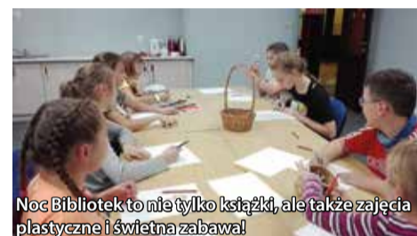
Noc Bibliotek to nie tylko książki, ale także zajęcia plastyczne i świetna zabawa!