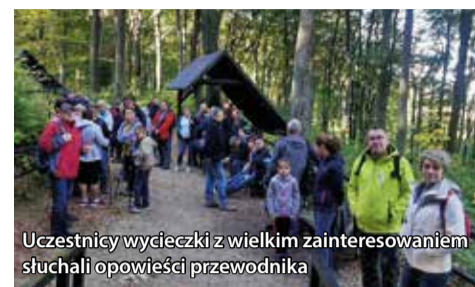
Uczestnicy wycieczki z wielkim zainteresowaniem słuchali opowieści przewodnika