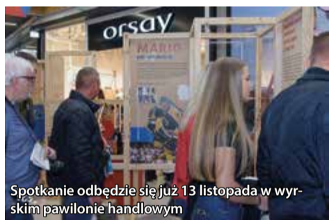
Spotkanie odbędzie się już 13 listopada w wyśmienitym pawilonie handlowym