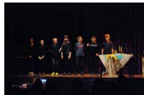
Podczas gali zaprezentowane zostały efekty spotkań z uczniami – wernisaż zdjęć wraz z wystawą artystycznych instalacji oraz występy uczniów – muzyczny i teatralny