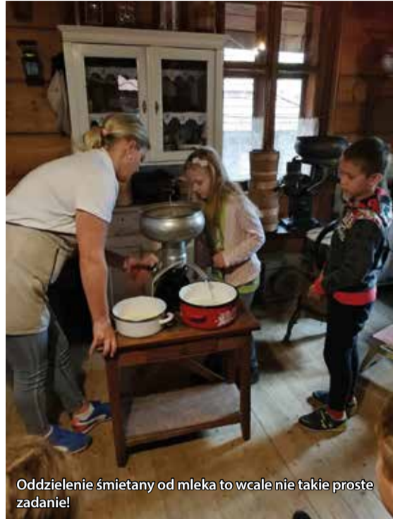
Oddzielenie śmietany od mleka to wcale nie takie proste zadanie!

Dzieci były zaangażowane w ćwiczenia praktyczne. Młóciły cepami, miały zboża na żarnach i osiewały mąkę, własnoręcznie formowały oraz wypiekały podpłomyki, oddzielały śmietanę od mleka, ubijały masło i formowały go w ciwarki, a także produkowały twaróg. Oprócz tego w tamtejszej stodole zobaczyły różne sprzęty i maszyny gospodarskie oraz mogły pobawić się na starych traktorach, wozach