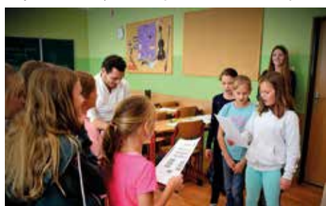
Uczniowie bloku muzycznego przygotowali występ wokalny odnoszący się do śląskiej tradycji muzycznej