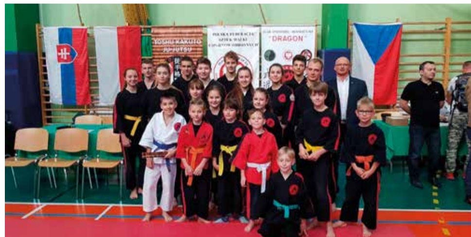
Wojownicy po raz kolejny zdeklasowali przeciwników zdobywając aż 46 medali