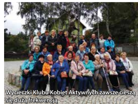
Wycieczki Klubu Kobiet Aktywnych zawsze cieszą się dużą frekwencją