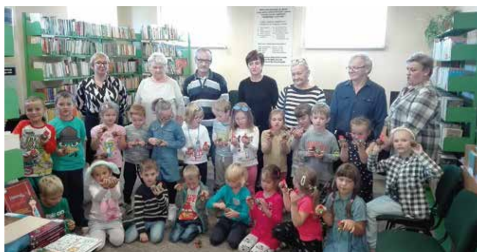
W warsztatach literacko-plastycznych wzięła udział grupa „Rybek” z Gminnego Przedszkola w Wyrach