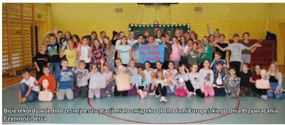
Bicie rekordu w jednoczesnej resuscytacji miało związek z obchodami Europejskiego Dnia Przywracania Czynności Serca