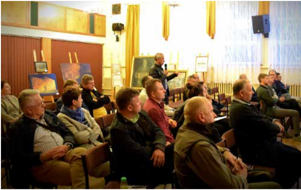
Fachowcy odpowiadali na pytania mieszkańców w tematach: zagrożeń powodziowych, rowów melioracyjnych, czy też zieleni i ogrodów deszczowych. Szeroko został także omówiony temat budowy Kanału Śląskiego, po czym nastąpiła intensywna i chwilami wzbudzająca wiele emocji dyskusja ekspertów z przybyłymi na konsultacje