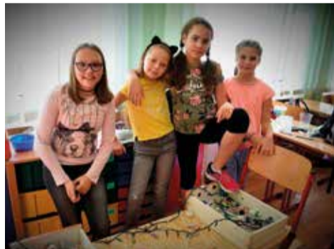
Celem ogólnym projektu było wdrożenie edukacji kulturowej do systemu szkolnego