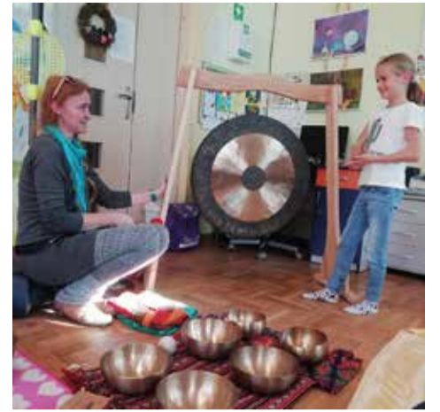
Oferta gośtyńskiej świetlicy poszerzyła się o m.in. o zajęcia z socjoterapii i arteterapii