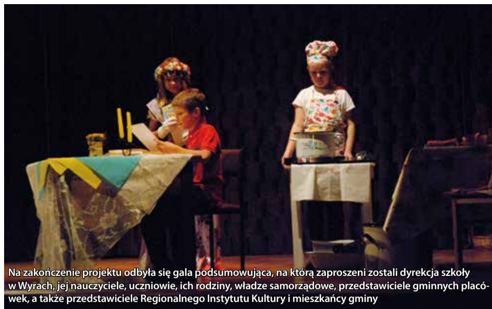
Na zakończenie projektu odbyła się gala podsumowująca, na którą zaproszeni zostali dyrekcja szkoły w Wyrach, jej nauczyciele, uczniowie, ich rodziny, władze samorządowe, przedstawiciele gminnych placówek, a także przedstawiciele Regionalnego Instytutu Kultury i mieszkańcy gminy