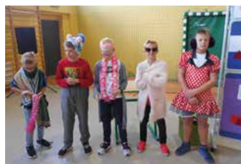
Każdy kandydat musiał wykazać się wiedzą z zakresu wykonywania makijażu, mody, wizażu oraz właściwym rozpoznawaniem kolorów