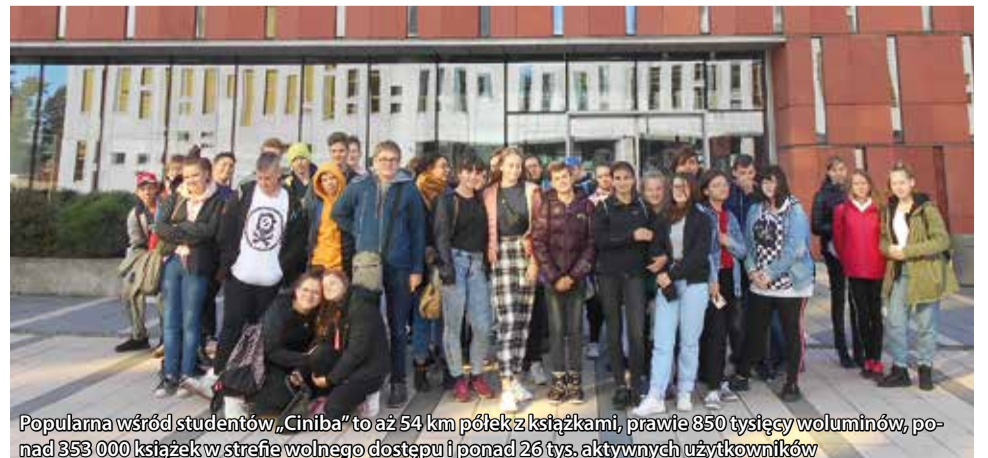
Popularna wśród studentów „Ciniba” to aż 54 km półek z książkami, prawie 850 tysięcy woluminów, ponad 353 000 książek w strefie wolnego dostępu i ponad 26 tys. aktywnych użytkowników