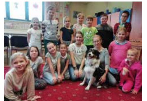
Uśmiechy na twarzach dzieci to najlepszy dowód, że zajęcia z dogoterapii im się podobają