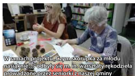
W ramach projektu „Czym skorupka za młodu nasiąknie...” odbyły się m. in. warsztaty rękodzieła prowadzone przez seniorki z naszej gminy