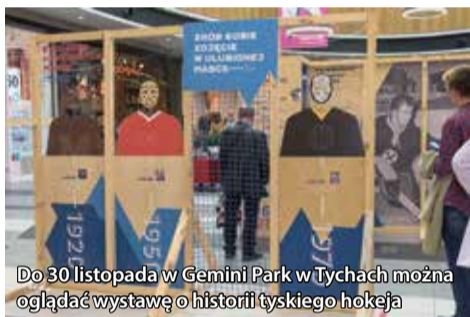
Do 30 listopada w Gemini Park w Tychach można oglądać wystawę o historii tyskiego hokeja