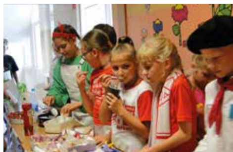
Europejski bufet na przerwach serwował pyszne dania z wszystkich zakątków naszego kontynentu