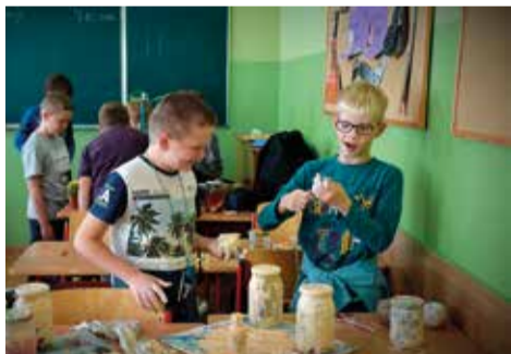
Każdy blok tematyczny zawierał wprowadzenie teoretyczne zapoznające uczniów z daną dziedziną