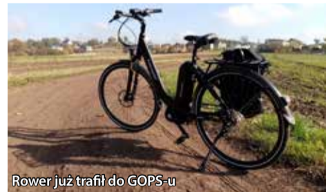
Rower już trafił do GOPS-u

Karolina Wadowska, członek zarządu GZM w rozmowie z netg.pl poinformowała, że Metropolia chce promować zrównoważoną mobilność miejską i pokazywać, że rower to świetny środek transportu do odbywania również podróży służbowych.