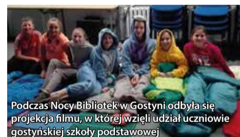
Podczas Nocy Bibliotek w Gostyni odbyła się projekcja filmu, w której wzięli udział uczniowie gostyńskiej szkoły podstawowej