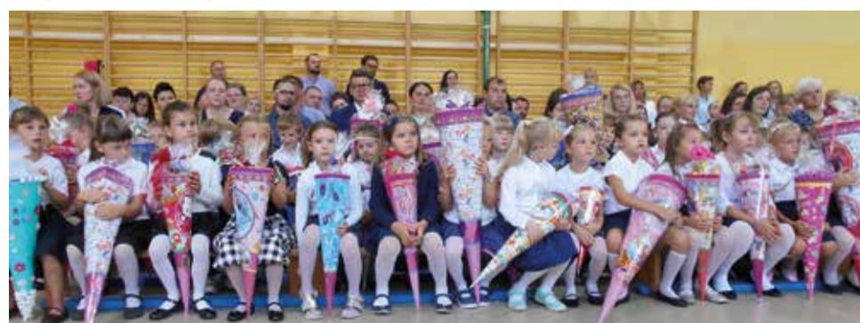
Niewielu z nas wie, że zwyczaj „tytu” wypełnionej słodyczami dla pierwszoklasistów kultywowany jest już od XIX wieku!