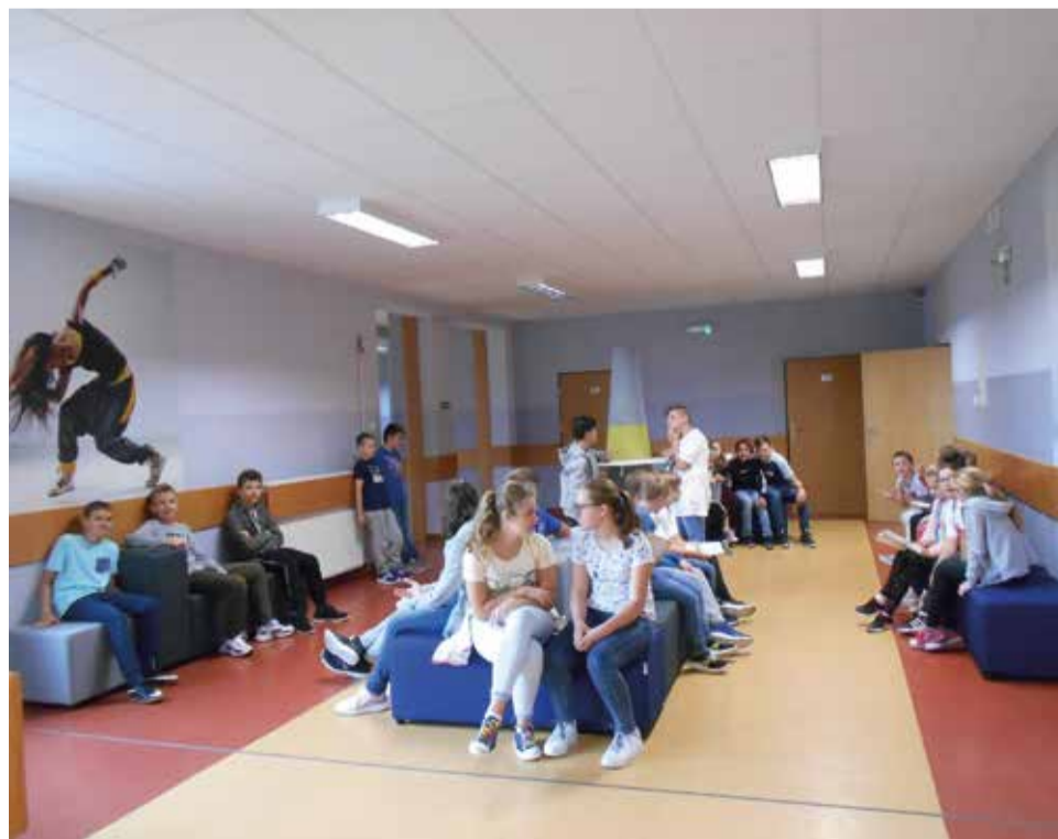
Nowe wyposażenie korytarza w wyrskiej szkole, to nie tylko poprawa estetyki, ale przede wszystkim wygody uczniów

WICIE – Miesięcznik Samorządowy Gminy Wyry. ISSN 1731-9501