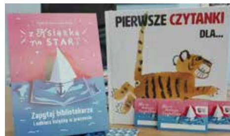
Zapisz dziecko do biblioteki!