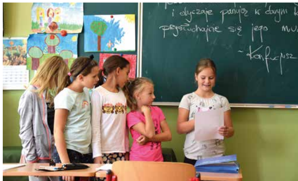
Kultura śląska pokazana w inny niż dotychczas sposób – to nasz cel