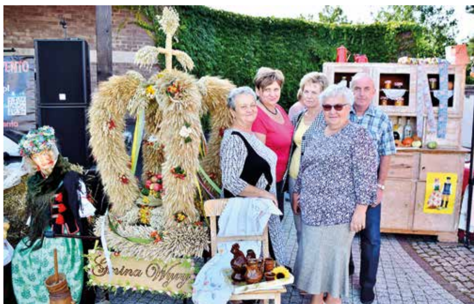
Uczestnicy Klubu Senior + z własnoręcznie wykonaną przez siebie koroną dożynkową