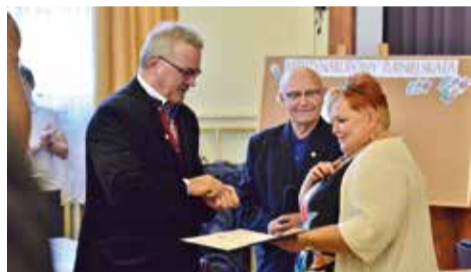
Podczas Biesiady Śląskiej w naszej gminie odbył się I Międzynarodowy Turniej Skata