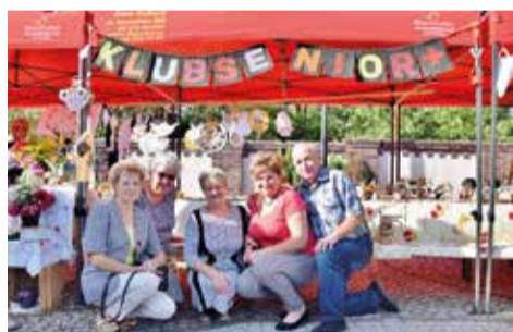
Klub Senior + przygotował też piękne stoisko z ręcznie robionymi dekoracjami