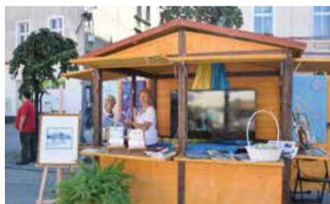
Stoisko Gminy Wyrę na mikołowskim rynku przygotował Dom Kultury w Gostyni