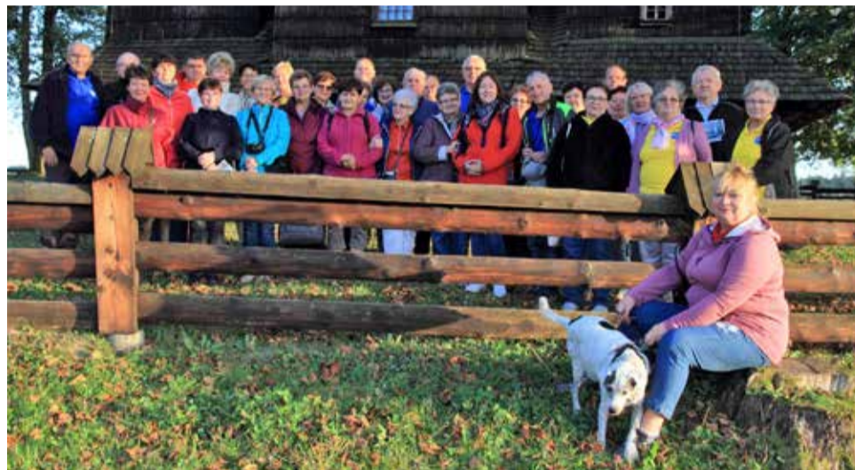
Odpoczynek przed cerkwią w Smolniku