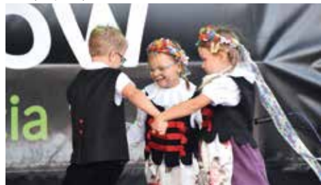
Dzieci wystąpiły w tradycyjnych śląskich strojach