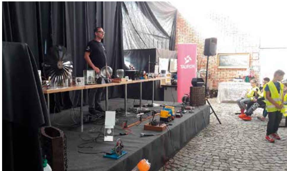
Uczniowie nie tylko wzięli udział w ciekawych zajęciach, ale mieli również możliwość zwiedzenia łaziskiego Muzeum Energetyki