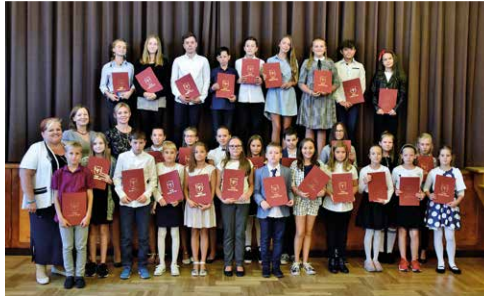
Wyróżnieni uczniowie klas IV-VI Szkoły Podstawowej w Wyrach