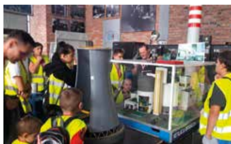
Uczniowie klas VII Szkoły Podstawowej w Gostyni mogli na własne oczy zobaczyć jak działa prąd