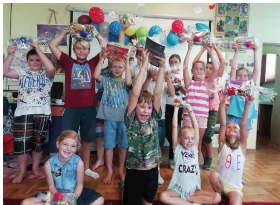
Te uśmiechy mogą znaczyć tylko jedno – prezenty!