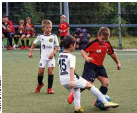
Gostyńska drużyna wygrała z drugim zespołem KS Polonia Łaziska Górne aż 4:1