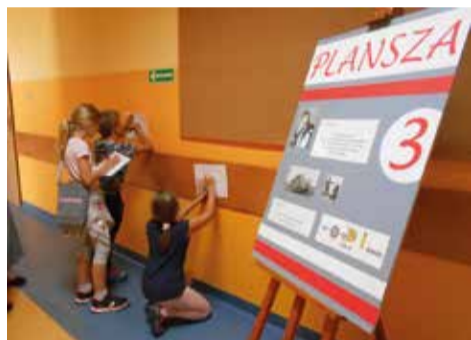
Uczestnicy musieli wykazać się nie tylko wiedzą historyczną, ale też matematyczną!