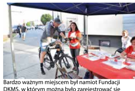
Bardzo ważnym miejscem był namiot Fundacji DKMS, w którym można było zarejestrować się w bazie potencjalnych dawców szpiku