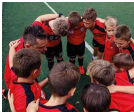
Najwięcej radości sprawia młodym zawodnikom wspólne dzielenie swojej pasji