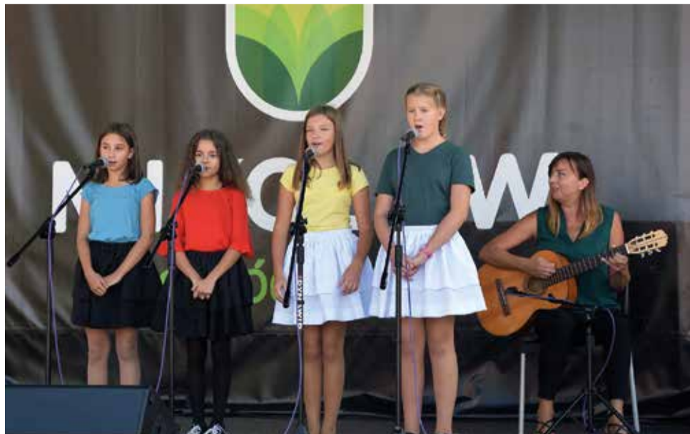
Na mikołowskim rynku zaprezentował się zespół wokально-muzyczny ze Szkoły Podstawowej w Gostyni