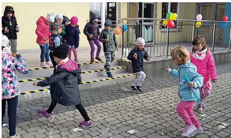
Z okazji Dnia Przedszkolaka już od samego rana na dzieci czekało mnóstwo niespodzianek