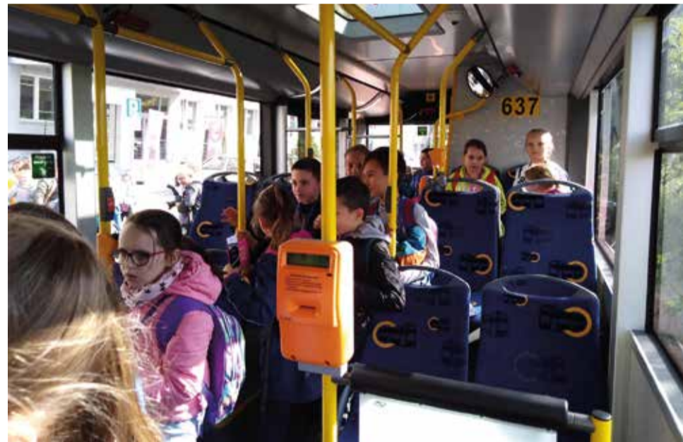
Na dzień otwarty siedziby Zarządu Transportu Metropolitalnego uczniowie pojechali oczywiście autobusem