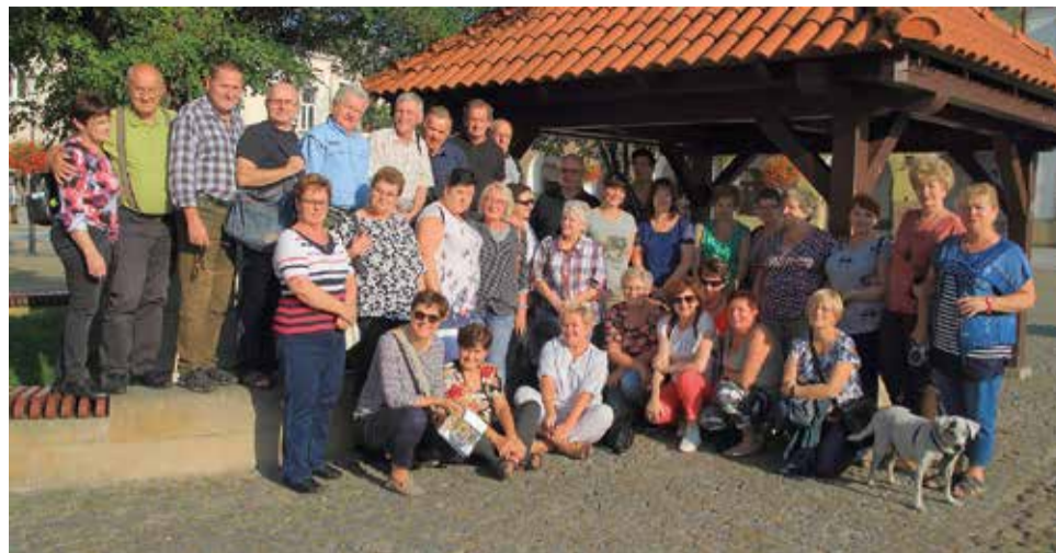
Uczestnicy wyjazdu na rynku w Krośnice

Po przejechaniu odcinka Wielkiej Pętli Bieszczadzkiej do Cisnej, a następnie zwiedzeniu ciekawego Muzeum Przyrodniczo-Łowieckiego „Knieja” w Nowosiólkach wróciliśmy do Polańczyka, gdzie czekał na nas ciepły posiłek. Jeszcze próba, krótka integracja i zmęczeniu, ale zadowoleni udaliśmy się na nocny odpoczynek przed ostatnim dniem wypełnionym ciekawymi miejscami zwiedzania.