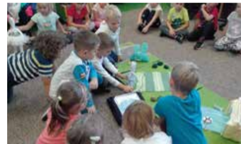
Grupa Rybek z Gminnego Przedszkola w Wyrach dowiedziawszy się, że sport to zdrowie!