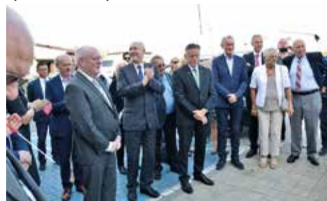
Oficjalne delegacje powiatów mikołowskiego oraz Neuss