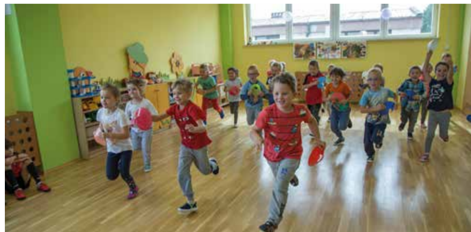
Pod okiem profesjonalnych trenerów Klubu Raki Gostyń, przedszkolaki mogły dowiedzieć się jak wygląda trening piłkarski, a towarzyszyło temu bardzo dużo radości i dobrej zabawy