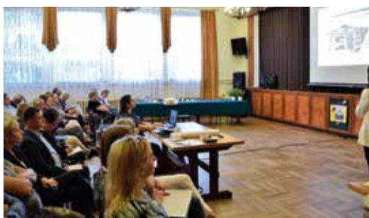
Mieszkańcy poznali najważniejsze aspekty tworzenia planu miejscowego, a także sporządzanego właśnie programu prac urządzeniowo-rolnych dla naszej gminy