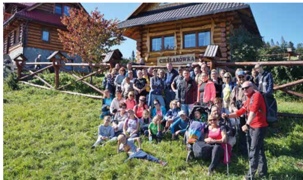
W tym roku początek jesieni przywitał uczestników rajdu wprost wymarzoną pogodą do górskich wędrówek