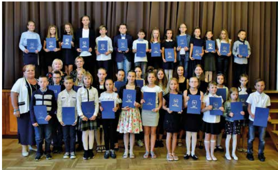
Wyróżnieni uczniowie klas IV-VI Szkoły Podstawowej w Gostyni