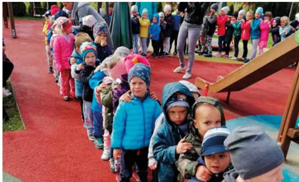
To chyba najdłuższy pociąg złożony z przedszkolaków na świecie!

Starsze grupy gościły dzielnicowego i policjantów, którzy wytłumaczyli dzieciom przepisy ruchu drogowego. Przypomnieli również numery alarmowe i to, jak należy zachować się w kontaktach z obcymi ludźmi, dbać o własne i innych bezpieczeń-