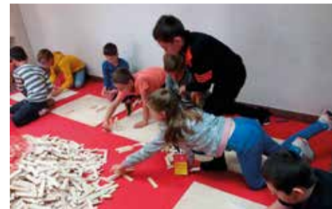
Uczestnicy wycieczki mieli możliwość samodzielnie zbudowania autobusowej infrastruktury z drewnianych klocków

Bardzo ważnym punktem dnia otwartego było spotkanie z osobą niewidomą, która opowiedziała jak można pomóc pasażerom niewidzącym i niewidomym zarówno na przystanku, jak i w autobusie. Z kolei oficer straży pożarnej, pełniący również funkcję ratownika medycznego, poinstruował jak udzielić pierwszej pomocy osobie, która