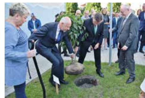
Uroczysty moment zasadzenia lilaka na pamiątkę spotkania w tę wyjątkową rocznicę