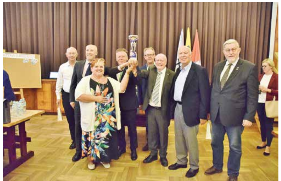
W Turnieju Skata zmierzyły się ze sobą delegacje polskie oraz niemieckie