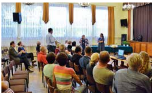
Najważniejszą częścią konsultacji jest dyskusja z mieszkańcami obu miejscowości - Gostyni oraz Wyr