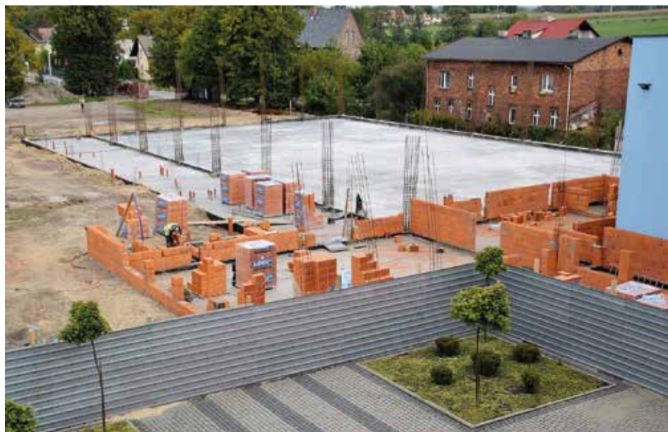
W Szkole Podstawowej w Wyrach w ramach budowy nowej sali gimnastycznej rozpoczęto już murowanie ścian parteru