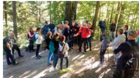
W chwilach odpoczynku można było posłuchać wielu ciekawych opowieści przewodnika