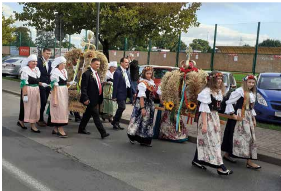
Wyręska korona pięknie prezentowała się w uroczystym dożynkowym przemarszu