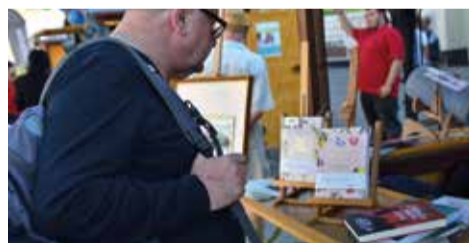
Na naszym gminnym stoisku można było zobaczyć także książki Patrycji Machałek „Siła ziół” oraz „Przetwory z pomysłem”