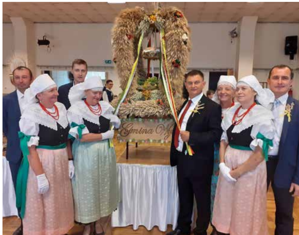
Korona wykonana została przez panie z gostyńskiego Klubu Senior +

Rok 2019, to również inna ważna rocznica dla naszej powiatowej społeczności. 9 listopada 1994 roku w łaziskim ratuszu