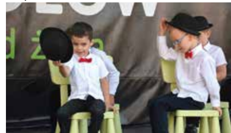
Dzieci z Gminnego Przedszkola w Gostyni i „Taniec dżentelmenów”