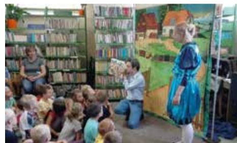
Warsztaty literackie dla Biedronek i Motylków poprowadzili aktorzy Teatru Bajkowe Skarbki Śląska

Trzy dni później biblioteka w Wyrach gościła aktorów Teatru Bajkowe Skarbki Śląska, którzy poprowadzili warsztaty literackie „Postaci w książce i na scenie”. Przedszkolaki z grup Motylki i Biedronki dowiedziały się, co to są postaci, rekwizyty czy scenografia. Nie zabrakło również