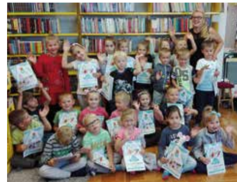
Biedronki z Gminnego Przedszkola w Gostyni wzięły udział w zajęciach „Żyjmy zdrowo i kolorowo”

gimnastyki ruchowej w rytm muzyki i zabawy.