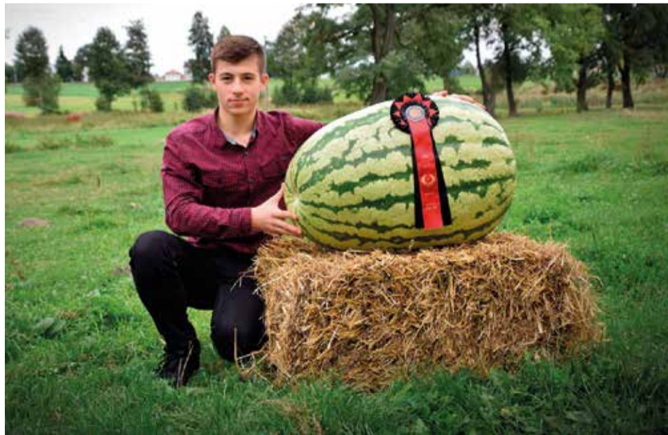
Arbuz osiągnął wagę aż 60,65 kg