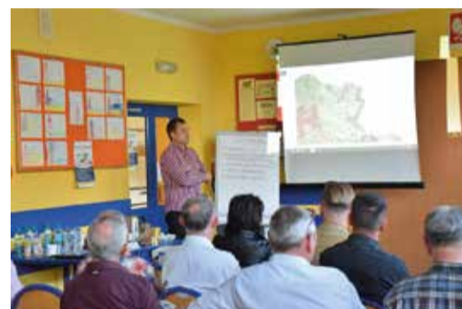
Spotkania w ramach konsultacji są finansowane w ramach drugiej edycji projektu „Nowa jakość konsultacji społecznych w planowaniu przestrzennym”