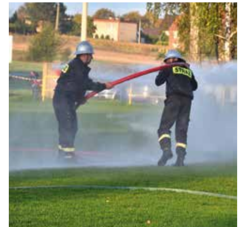
Atrakcją imprezy był m.in. pokaz strażacki