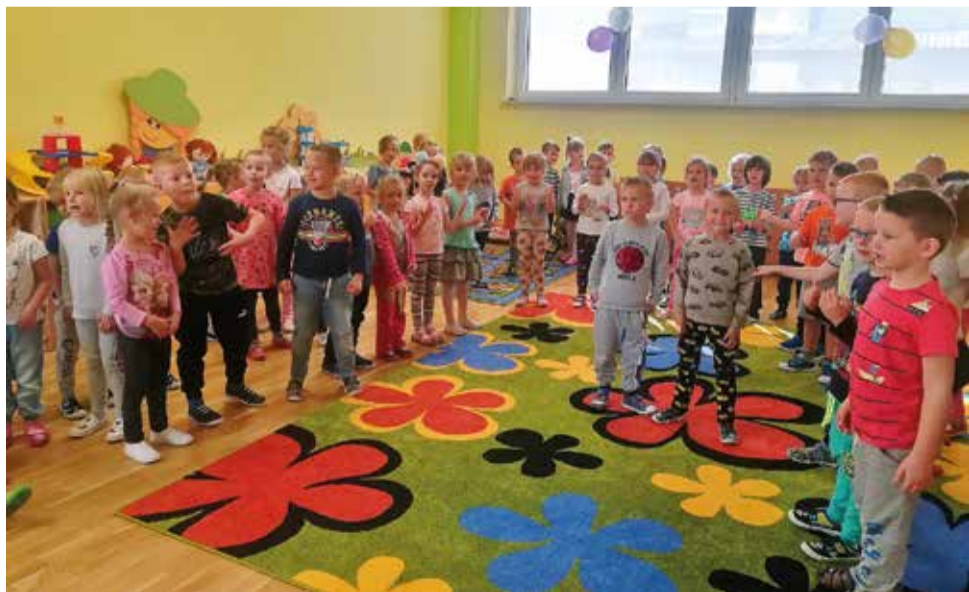
Nie mogło zabraknąć też konkursów