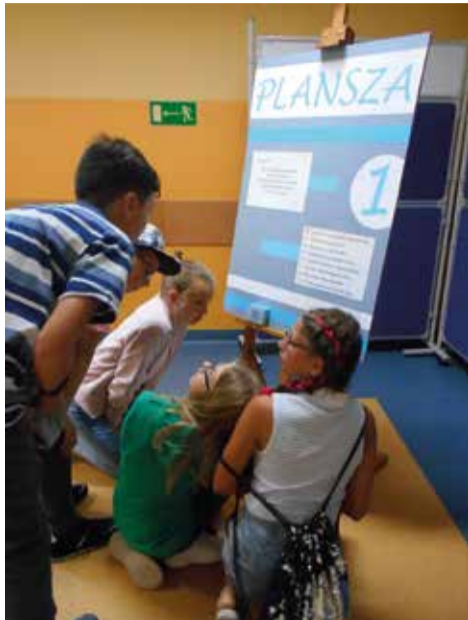
W grze edukacyjnej wzięli udział uczniowie klas IV-VIII

Po raz kolejny w Szkole Podstawowej w Wyrach z okazji rocznicy wybuchu II wojny światowej zorganizowana została gra edukacyjna, w której udział wzięli uczniowie klas IV-VIII. Nie od dziś wiadomo, że odkrywanie przeszłości może być prawdziwą przygodą. Zwłaszcza wtedy, kiedy historia połączy siły z „królową nauk” – matematyką! Uczestnicy gry musieli zamienić się w prawdziwych detektywów, wykazać sprytem i szybkością. Zmagali się z zagadkami i rebusami, wykazywali znajomością najważniejszych faktów z okresu II wojny światowej, ale także łamali kody i głowili się nad zadaniami matematycznymi.