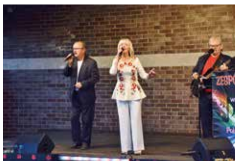
Śląskie szlagry w wykonaniu zespołu New For You