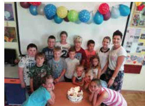
Jak na świętowanie urodzin przystało, nie mogło się obyć bez tortu

Po zdmuchnięciu świeczek i zjedzeniu smakołykami przyszedł czas na prezenty. Każdy wychowanek świetlicy otrzymał drobny upominek, bo to przecież dzieci tworzą naszą świetlicę. W ciągu tych kilku lat zebrało się grono osób i instytucji, które wspierały naszą placówkę i dzięki którym zwiększyła się atrakcyjność naszej świetlicy, a dzieci mogły z radością spędzać w niej czas. Serdecznie