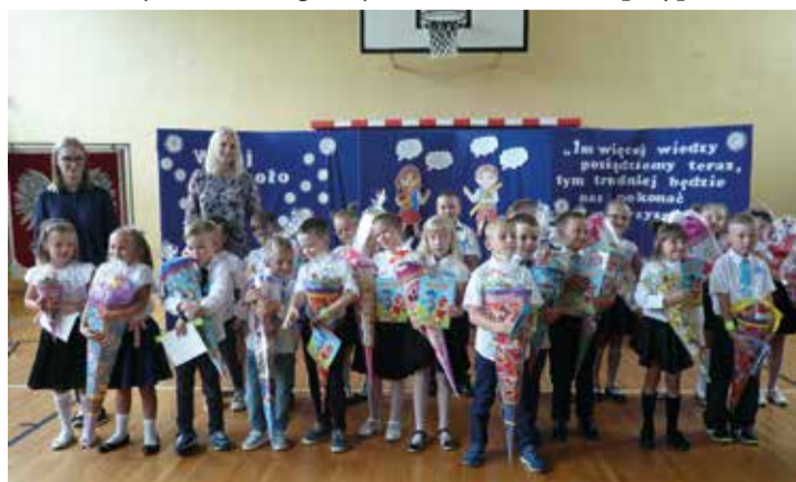
Dla wszystkich uczniów klas I nowy rok szkolny jest jednym z najważniejszych dotychczas momentów w życiu i początkiem wielkiej przygody - edukacji