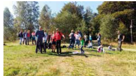
Widoki tego dnia były naprawdę wyjątkowe

Trasa rajdu wiodła z Wisły Jawornika przez Soszów, aż na Stożek Wielki. W połowie trasy uczestnicy zatrzymali się na krótki odpoczynek na Cieślarze, gdzie dzieci mogły zabawić się na placu zabaw, a dorośli posłuchać fascynujących opowieści przewodnika,