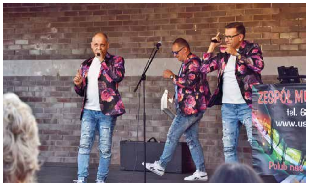
Publiczność bawiła się do znanych i lubianych piosenek po śląsku zespołu Blue Party