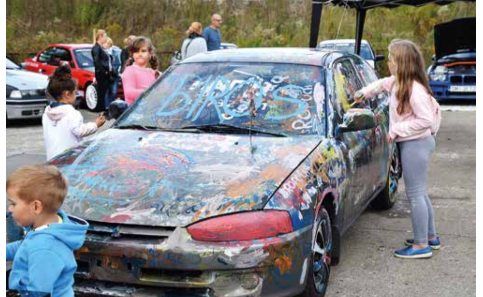
Można było wylicytować też samochód, własnoręcznie malowany przez najmłodszych uczestników festynu

potencjalny dawca (nie tylko w bazie DKMS)