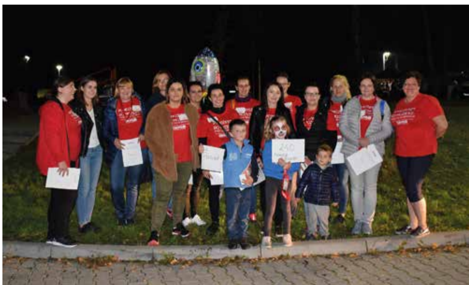
Podczas festynu do bazy potencjalnych dawców dołączyło aż 240 osób!