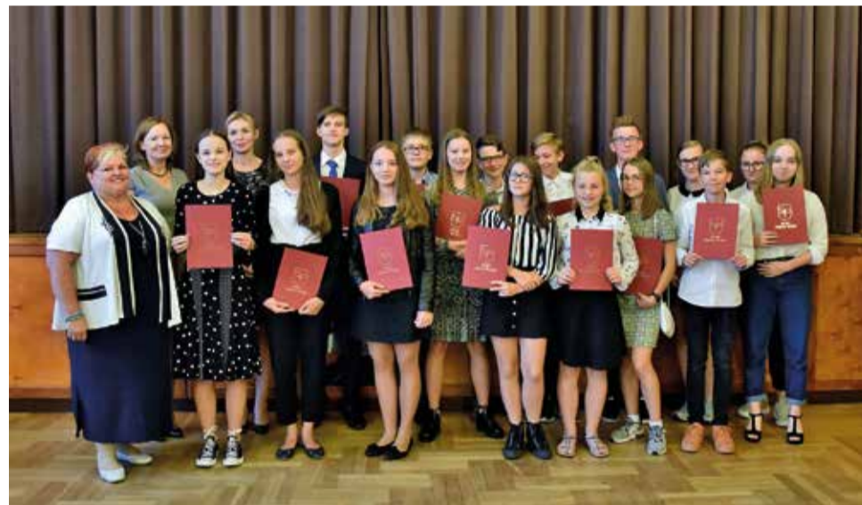
Wyróżnieni uczniowie klas VII-VIII i III dotychczasowego gimnazjum Szkoły Podstawowej w Wyrach