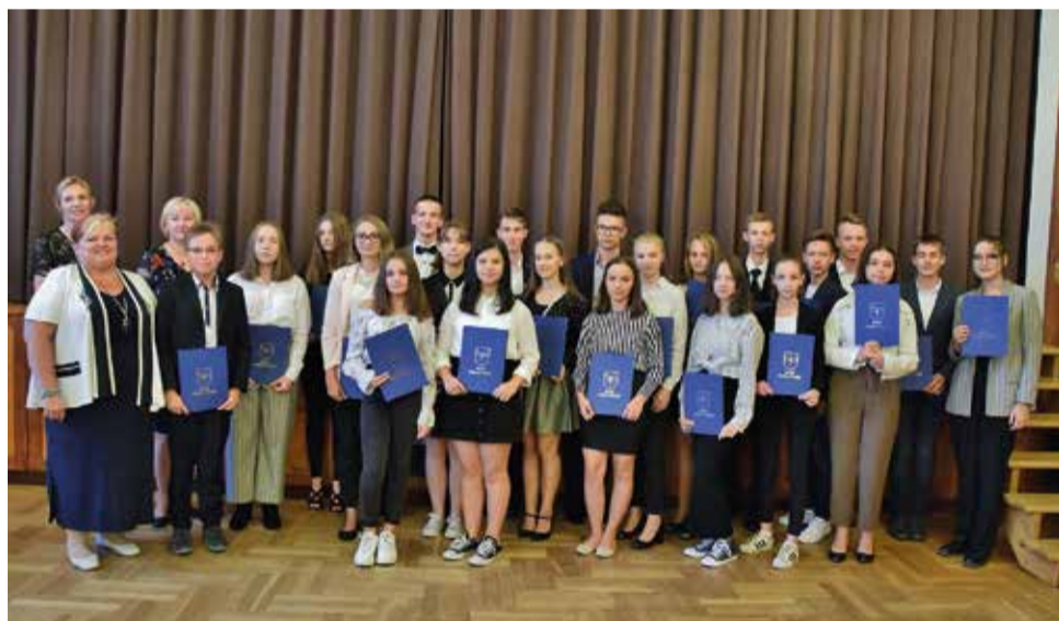
Wyróżnieni uczniowie klas VII-VIII i III klasy dotychczasowego gimnazjum Szkoły Podstawowej w Gostyni