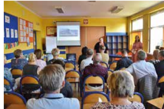
Relacja z kolejnych spotkań już w listopadowym wydaniu miesięcznika

planie zagospodarowania przestrzennego jest zapis o ochronie alei lub pomników przyrody oraz czy można ochronę przyrody wpisywać w miejscowe plany zagospodarowania. Wyczerpującej odpowiedzi