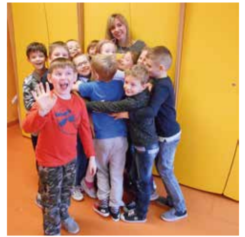
Dzień przytulania to dobra okazja aby wnieść trochę radości w te bure, marcowe dni