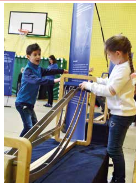
Wystawa złożona z 20 interaktywnych eksponatów, zachęca uczniów do samodzielnego odkrywania praw nauki, m. in. z matematyki, fizyki, optyki, percepcji ludzkiego umysłu i elektromagnetyzmu