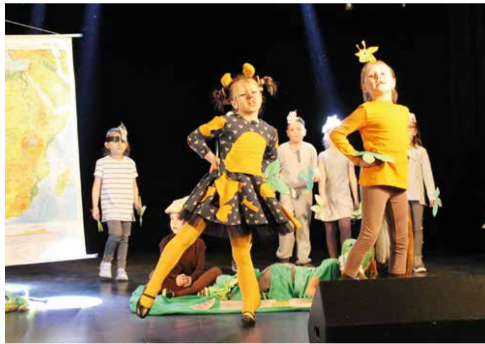
Dzieci z Gminnego Przedszkola w Gostyni w piosence „African Animals” okazały się bezkonkurencyjne

19 marca w Domu Kultury w Mikołowie odbył się V Przegląd Piosenki Angielskiej i Anglojęzycznej dla przedszkoli, orga-