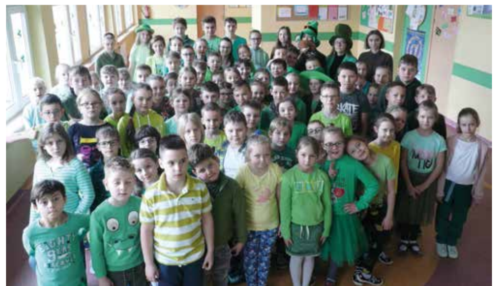
Z okazji Dnia Świętego Patryka w całej szkole dominującą barwą był oczywiście kolor zielony!