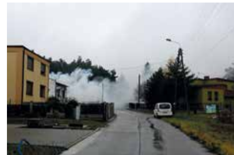
Efekt nieprawidłowego spalania

lub wrzuca na żar. Tak powstaje pożar. Te kilka kilogramów węgla czy drewna szybko się podgrzewa i uwalnia ogromne ilości palnych gazów. Jest ich za dużo, żeby nadały się do spalania – nadmiar paliwa w stosunku do