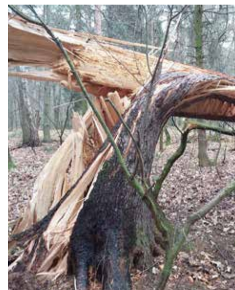
Straty w naszych lasach wstępnie oszacowano na prawie 40 tys. m 3 drewna

wa zawieszane, z naderwanym systemem korzeniowym oraz połamane. Niestety, charakter i rozmiar zniszczeń nie zawsze pozwala na użycie maszyn leśnych, dlatego prace potrwać jeszcze kilka miesięcy.