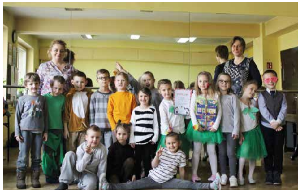
Dumne przedszkolaki, zwycięzcy Przeglądu Piosenki Angielskiej i Anglojęzycznej w Mikołowie

Przedszkolacy z grupy „Kangurki” z Gminnego Przedszkola w Gostyni zdobyli I miejsce w Przeglądzie Piosenki Angielskiej i Anglojęzycznej w Mikołowie.