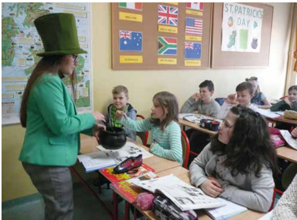
Irlandzkie skrzaty częstowały dzieci cukierkami