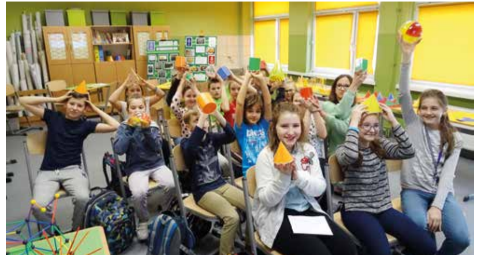
W tym roku odbył się też dzień otwarty matematycznej klasopracowni