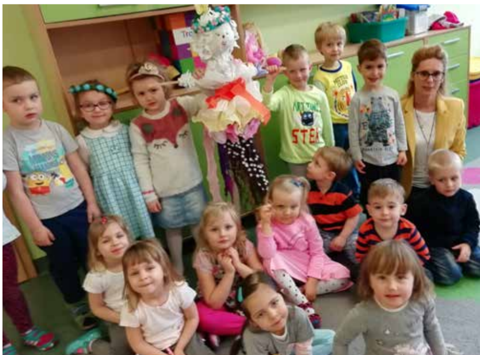
Dzieci z wyrskiego przedszkola z własnoręcznie zrobioną marzanną