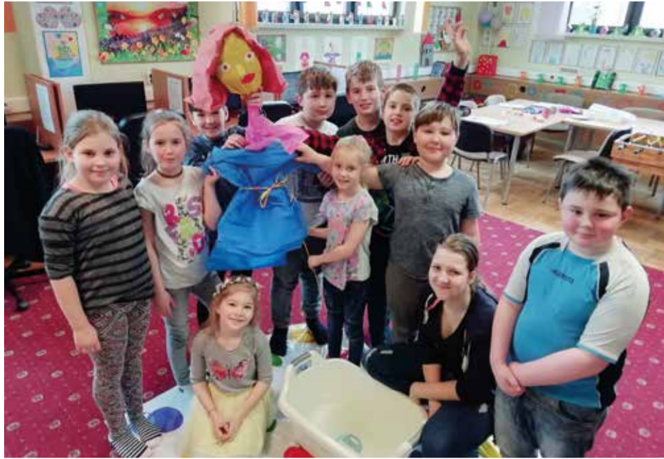
Przy okazji tworzenia Marzanny zawsze jest dużo radości i świetnej zabawy