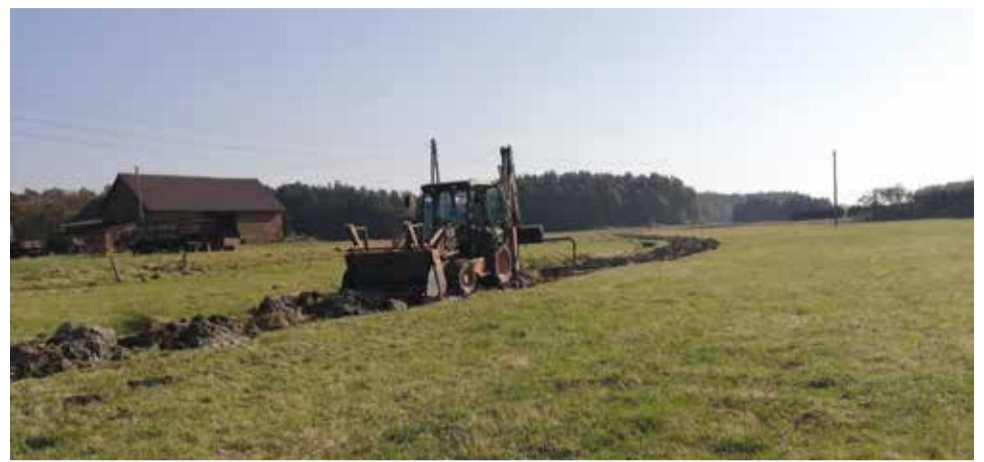
Zarząd Spółki Wodnej dziękuje wszystkim właścicielom nieruchomości, którzy dokonali wpłat na rzecz spółki (479 wpłat)

Działająca na terenie Gminy Wiry Spółka Wodna Wiry-Gostyń zajmuje się utrzymaniem, czyszczeniem i udrażnianiem rowów wodnych zlokalizowanych w gminie. Co rok, podczas zebrania sprawozdawczego przedstawia to, co zostało wykonane, wraz z rozliczeniem finansowym. Poniżej sprawozdanie z realizacji zadań w 2018 roku.