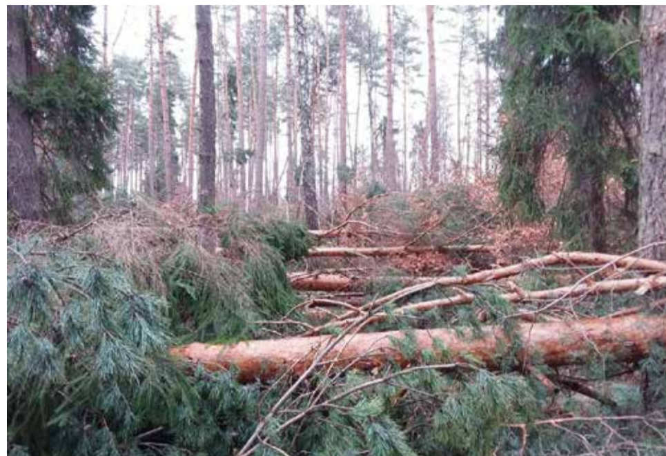
Nadleśniczy Nadleśnictwa Kobiór apeluje o rozważę o zachowanie ostrożności w lesie

Krajobraz leśny po ostatnich wichurach – wywroty, połamane, nadwyryżone i zawieszane drzewa mogą stanowić duże zagrożenie dla zdrowia i życia!