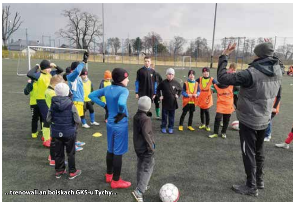
...trenowali an boiskach GKS-u Tychy...

Gostyni. Drużyna seniorów tradycyjnie została pod szyldem klubu Fortuna Wyry.