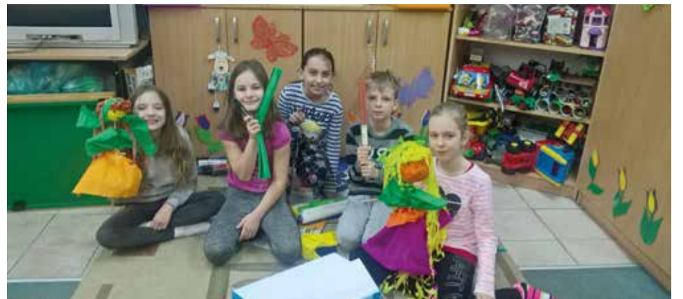
"Chcąc, by prędzej wiosna zawitała, zrobili Marzannę - ze słomy jest cała..."