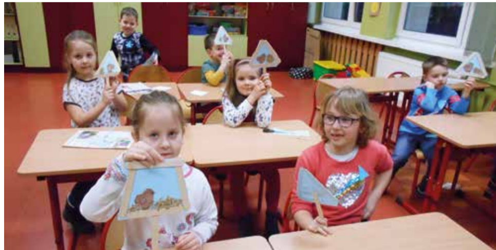
Dzieci mogły już teraz usiąść w szkolnych ławkach i poczuć się, jak uczniowie