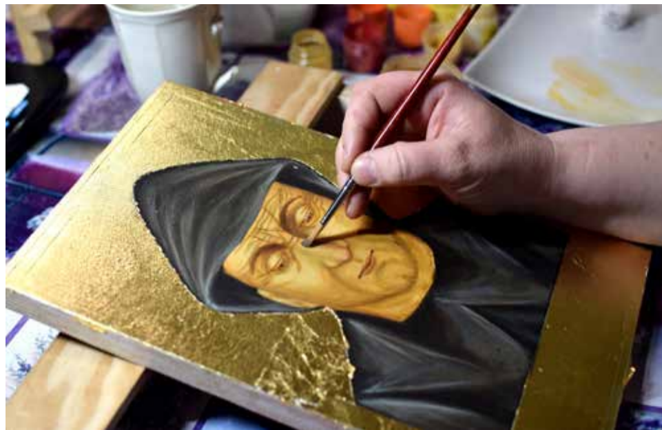
Często ostateczny efekt osiąga się dopiero po nałożeniu wielu warstw pigmentu

tak przygotowaną deskę nakładamy na cześć apostołów 12 warstw gruntu, czyli mikstury kleju i specjalnej kredy. Przy nanoszeniu każdej, kierujemy modlitwę do konkretnego apostoła. Taki proces przygotowania deski trwa około tygodnia. Teraz można już na niej malować. Pigmenty też są naturalne, z gli-