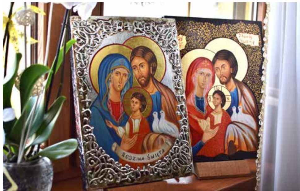
Ikona Świętej Rodziny stworzona w prezencie dla córki z okazji sakramentu bierzmowania