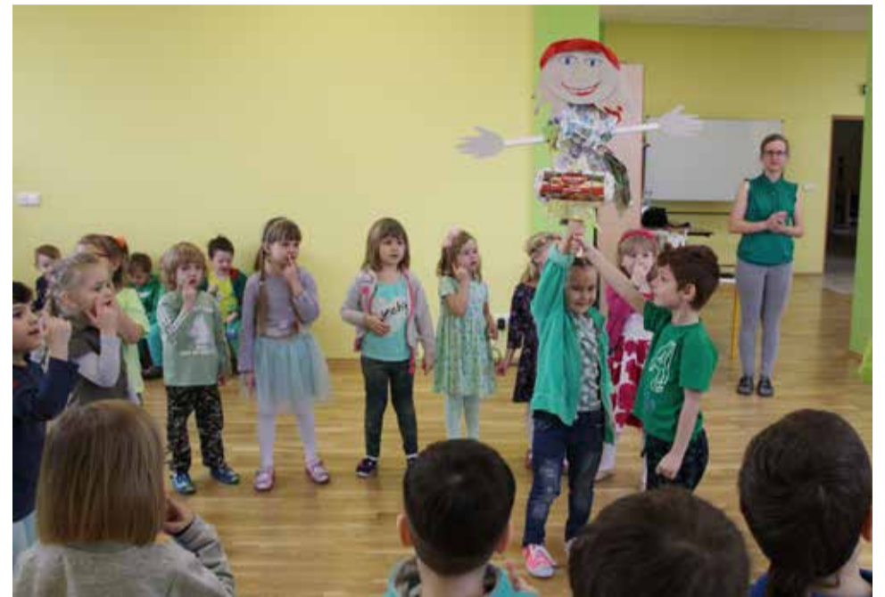
Gostyńskie przedszkolaki "śpiewająco" pożegnały zimę