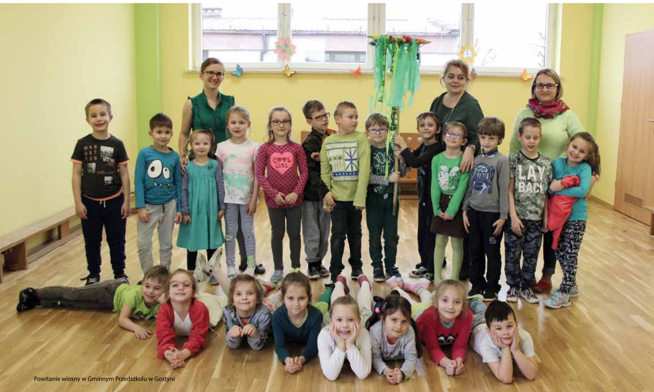
Powitanie wiosny w Gminnym Przedszkolu w Gostyni