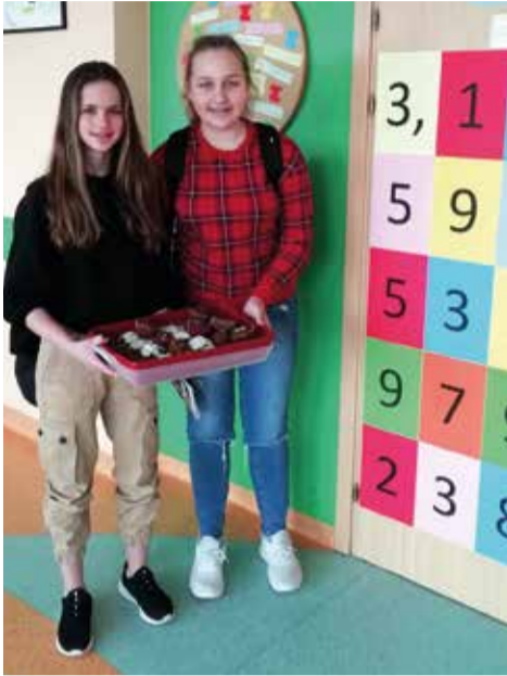
Na każdego ucznia czekał słodki poczęstunek – „matematyczne” babeczki

W Szkole Podstawowej w Gostyni, 14 marca, zorganizowano Dzień Matematyki. Termin wybrano nieprzypadkowo, ponieważ tego dnia swoje święto obchodzi liczba \pi (czyt. „pi”), której przybliżona