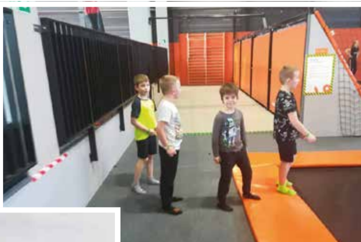
Podczas ferii z Fortuną młodzi piłkarze bawili się w Jumpcity...

(90.+2.). Kolejny mecz odbył się 24 marca. Fortuna zmierzyła się na własnym boisku z zawodnikami LKS-u Ogrodnik Tychy. Spotkanie zakończyło się przegraną Fortuny 2:0.