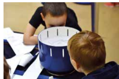
Interaktywne eksponaty są skonstruowane w taki sposób, żeby zachęcały do samodzielnego poznawania świata różne grupy odbiorców – dzieci, młodzież oraz dorosłych