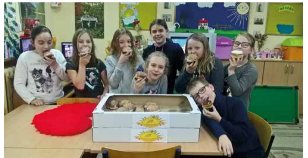
Pączki z Radia Express były dla wszystkich wielką niespodzianką