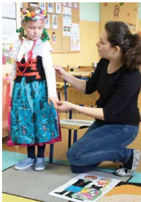
Gość zaprezentował dzieciom m. in. odświętny strój małej śląskiej dziolki