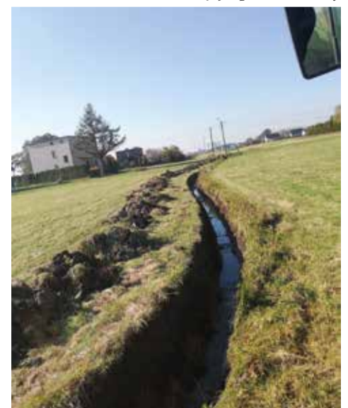
Zadaniem spółki jest utrzymywanie, czyszczenie i udrażnianie rowów wodnych w gminie