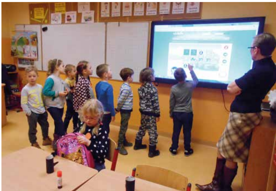
Największe zainteresowanie wzbudziły zajęcia z tablicą interaktywną

27 lutego w Szkole Podstawowej w Wyrach odbył się Dzień Otwarty dla uczniów, którzy we wrześniu rozpoczną naukę w klasie I. Dzieciom towarzyszyli rodzice, a przygotowane atrakcje zaprezentowano w godzinach popołudniowych.