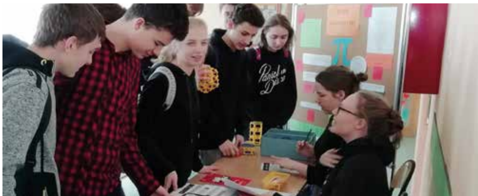
Podczas przerw, uczniowie mogli m. in. rozwiązywać łamigłówki japońskie, czy zagrać w grę logiczną „Mahjong”