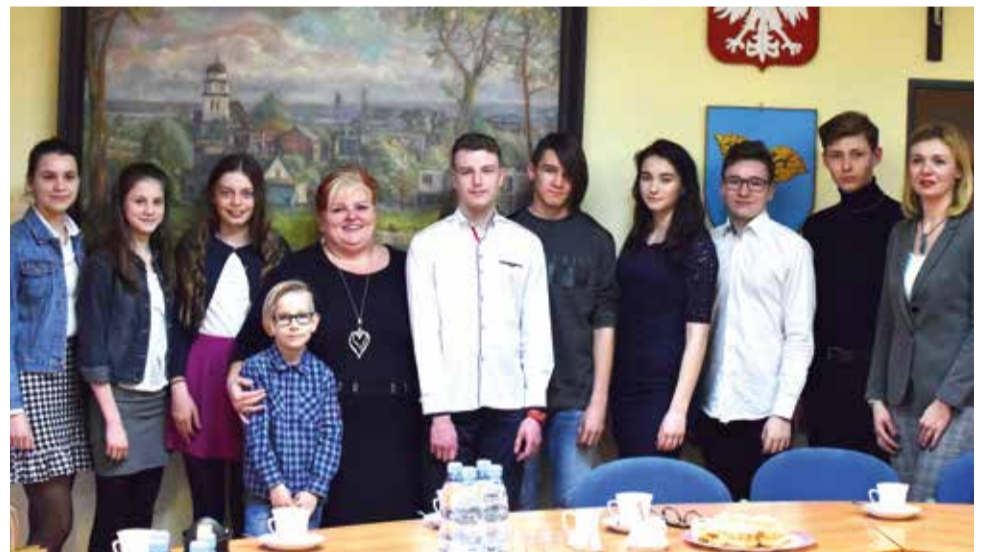
Wśród tegorocznych nagrodzonych znaleźli się zawodnicy Szkoły Sztuk i Sportów Walki „Wojownik”