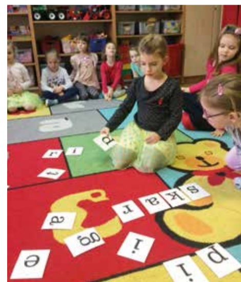
Zabawy i gry dydaktyczne związane z piegami-kropkami dały przedszkolakom mnóstwo radości