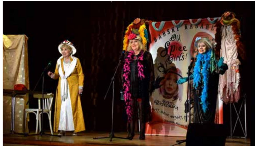
... Emilia Krakowska, Lidia Stanisławska i Barbara Wrzesińska

Na scenie domu kultury wystąpiły – Lidia Stanisławska, Emilia Krakowska oraz Barbara Wrzesińska. Kabaret pełen był zabawnych monologów, dowcipów, piosenek i improwizacji autorstwa Marii Czubaszek,