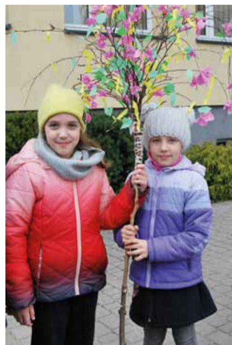
Uczniowie przywoływali wiosnę spacerując z kolorowym gaikiem