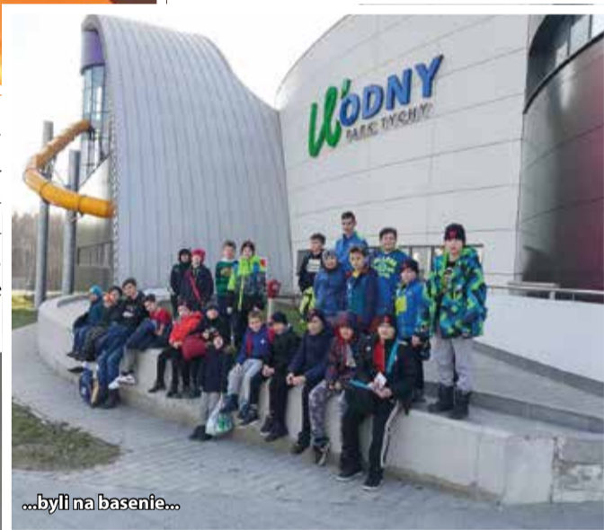
...byli na basenie...

(90.+2.). Kolejny mecz odbył się 24 marca. Fortuna zmierzyła się na własnym boisku z zawodnikami LKS-u Ogrodnik Tychy. Spotkanie zakończyło się przegraną Fortuny 2:0.