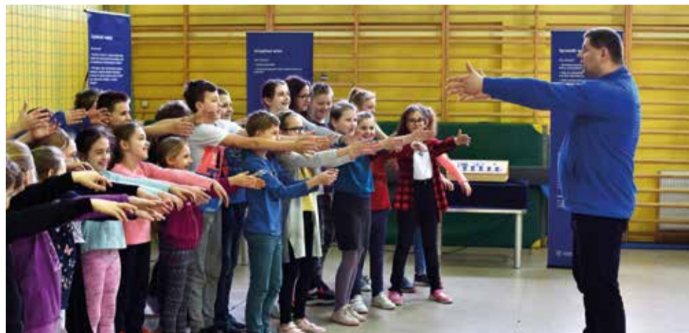
Przy każdym eksponacie znajdowało się krótkie wyjaśnienie obserwowanych procesów, a dodatkowymi informacjami służyli doświadczeni edukatorzy, dbający również o to, aby nikt nie narzekał na nudę!