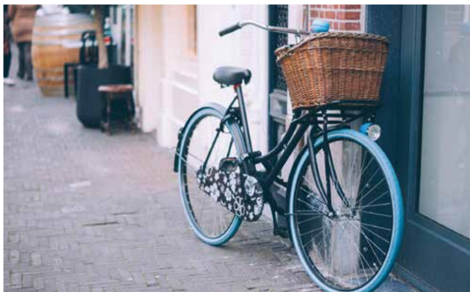
Wsiadając na rower, pamiętajmy o podstawowych zasadach poruszania się po drogach

Poruszając się rowerem nie możemy jechać bez trzymania co najmniej jednej ręki na kierownicy i nóg na pedałach, ani