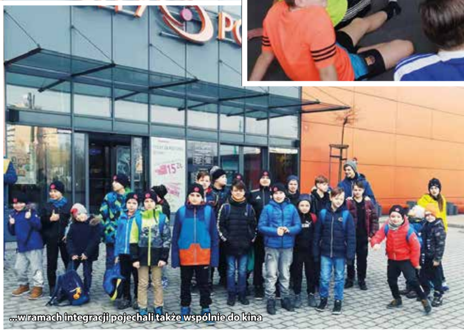
...w ramach integracji pojechali także wspólnie do kina