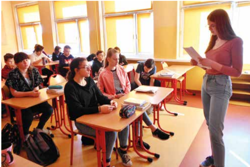
Tego dnia poezję starsi uczniowie czytali młodszym