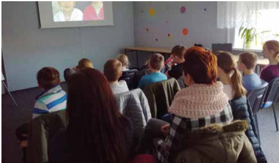
Sieć internetowa to nie tylko plusy, ale także cała masa zagrożeń

Dzień Bezpiecznego Internetu. Działajmy razem. Pod takim hasłem odbyły się w bibliotekach warsztaty dla dzieci mówiące o zagrożeniach płynących z wirtualnego świata