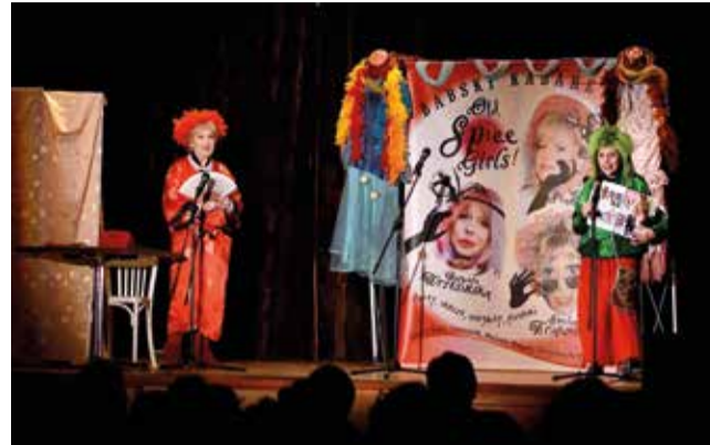
Pod tajemniczą nazwą Babski Kabaret ukryły się trzy znakomite aktorki...