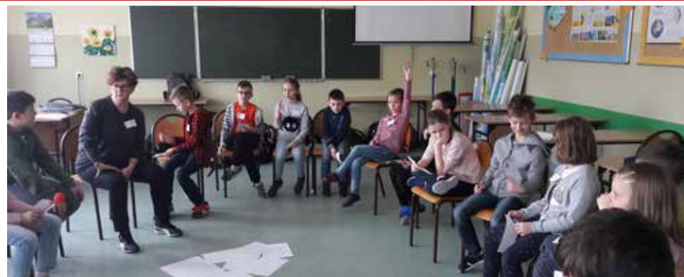
Dzieci bardzo często mają problem z wyrażaniem własnych uczuć i radzeniem sobie z negatywnymi emocjami