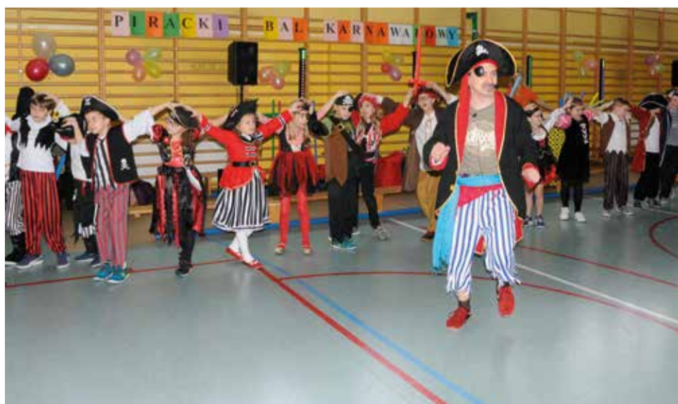
Dla uczniów z klas I-III odbył się Piracki Bal Karnawałowy