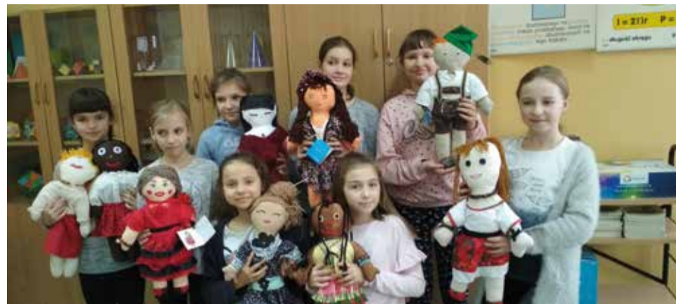
Dzieci własnoręcznie uszyły szmaciane lalki

Uczniowie Szkoły Podstawowej im. Bohaterów Września 1939 w Gostyni kontynuują swoją współpracę z Międzynarodową Organizacją UNICEF w ramach akcji „Wszystkie kolory świata”. Polega ona na rozpowszechnianiu wiedzy o trudnych warunkach życiowych dzieci w krajach najuboższych i organizowaniu pomocy dla nich.