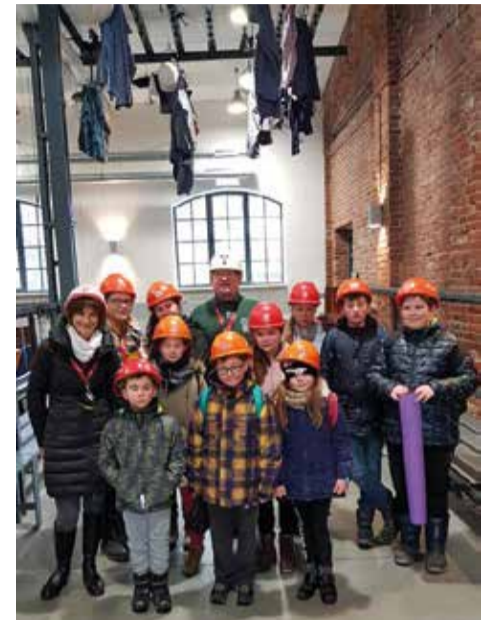
Łańcuchy zawieszono pod sufitem, czyli tzw. łańcuszka. Tak wygląda wejście do Sztolni Królowa Luiza w Zabrze