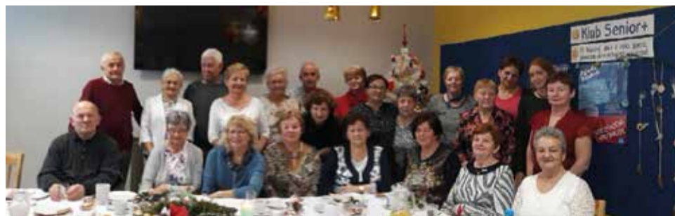
Seniorzy wspólnie zasiedli do spotkania wigilijnego