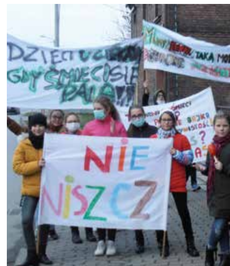
Szkoła wspierała też działalność ekologiczną

Młodzież, pod opieką wychowawców i nauczycieli angażuje się w organizację wielu akcji ekologicznych i charytatywnych. Zbiera baterie, segreguje śmieci. Jesienią została zorganizowana zbiórka kasztanów i żołądki dla zwierząt leśnych. Ponad 650 kg przekazano Związkowi Łowieckiemu przy Nadleśnictwie w Kobiórze. Z kolei 250 kg karmy dla psów podarowano schronisku dla zwierząt w Tydach. Podobnie jak w latach poprzednich przeprowadzono akcję Sprzątania Świata.