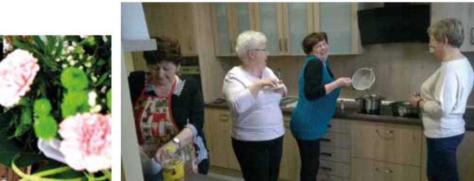
W Klubie Senior + zawsze panuje rodzinna, domowa atmosfera