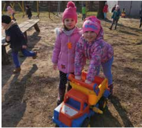
Dzieci chętnie korzystały z ładnej pogody