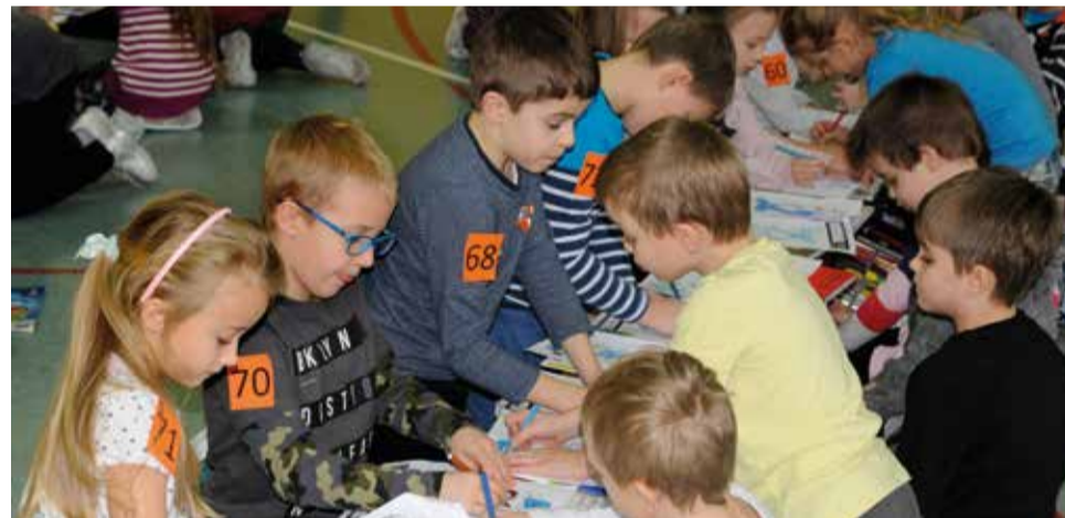
Zajęcia edukacyjne o bezpieczeństwie „Ze Sznupkiem bezpieczni w drodze”

Od marca 2018 r. organizowane są dla uczniów zajęcia dodatkowe w ramach projektu „Matematyka, chemia i fizyka – program zajęć pozalekcyjnych rozwijających