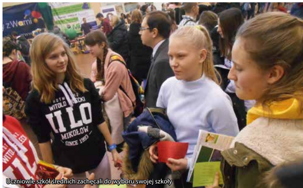
Uczniowie szkół średnich zachęcali do wyboru swojej szkoły