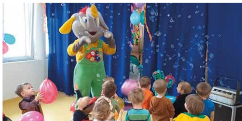
Radosna atmosfera podczas żłobkowego balu