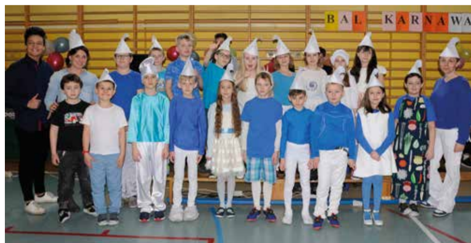
Podczas balu wybierano najlepiej przebraną klasę oraz strój indywidualny

Karnawał już się skończył, czas więc na krótkie wspomnienie z balu przebierańców, który odbył się w naszej szkole. W poniedziałek, 4 lutego, jako pierwsi zabawę rozpoczęli uczniowie klas I – III, którzy niecierpliwie wyczekiwali na Piracki Bal Karnawałowy. W trakcie zabawy dzieciom towarzyszyło wiele emocji i wrażeń. Sala gimnastyczna wyglądała inaczej niż na co dzień, zamieniła się bowiem w prawdziwą salę balową. Udekorowana została kolorowymi balonami, a dzieci włożyły stroje, które tematycznie odpowiadały imprezie, wprowadzając morski i tajemniczy nastrój. Wszyscy przy dźwiękach muzyki bawili się wyśmienicie! Impreza urozmaicana była ciekawymi zabawami i konkursami, a zwycięzcy byli nagradzani balonami. W czasie przerwy dzieci miały czas na słodki poczęstunek ufundowany przez Radę Rodziców. Kiedy czas zabawy dobiegł końca, dzieci z żalem opuszczały salę balową.