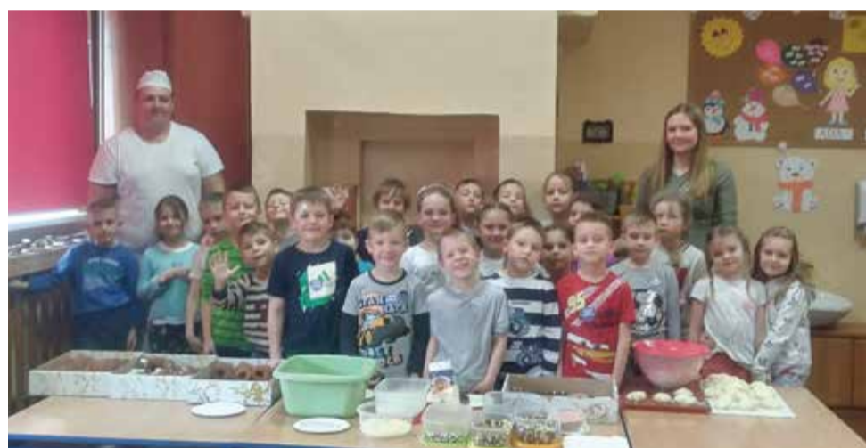
Przy okazji tworzenia i dekorowania własnych pączków, można było trochę się ubrudzić!