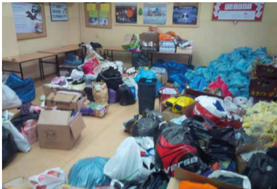
Ilość zebranych przedmiotów przerosła oczekiwania! Część zebranych darów zostanie przekazana placówce misyjnej w Zambii