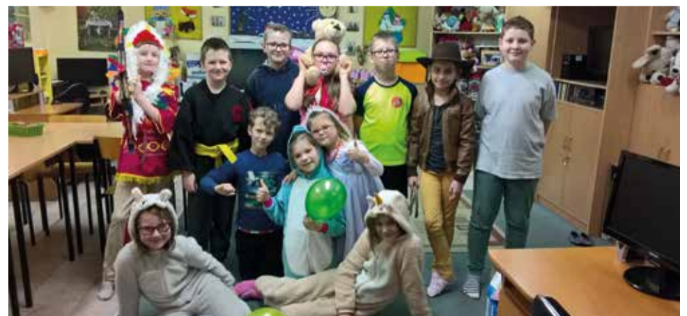
Podczas walentynkowego balu obowiązywały oczywiście kolorowe stroje