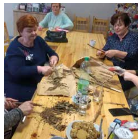
Przygotowania do Świąt Wielkanocnych