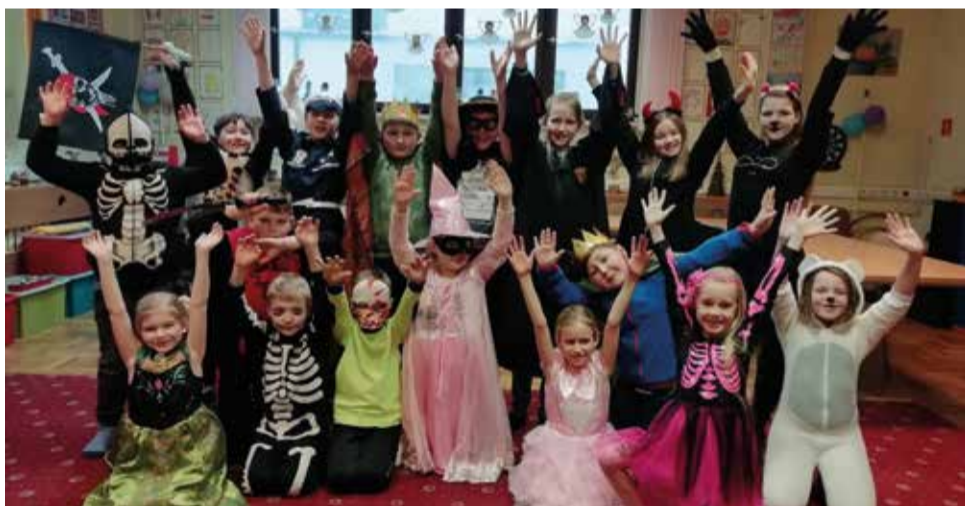
Dzieci z gostyńskiej świetlicy w czasie ferii bawiły się świetnie

Czas karnawału i ferii minął w świetlicy „Wesoły Zakątek” w Gostyni na wspólnej, radosnej zabawie! 25 stycznia odbył się bal karnawałowy. Przygotowania do tego wydarzenia trwały kilka dni. Dzieci wykonały dekoracyjne maski, przyozdobiły świetlicę kolorowymi łańcuchami i balonami. Wychowankowie przebrali się w piękne stroje, pojawiły się księżniczki, wojownicy czy diabełki. Zabawa rozpoczęła się od prezentacji każdego uczestnika zabawy. Wspólnym zabawom, tańcom i smakołykom nie było końca.