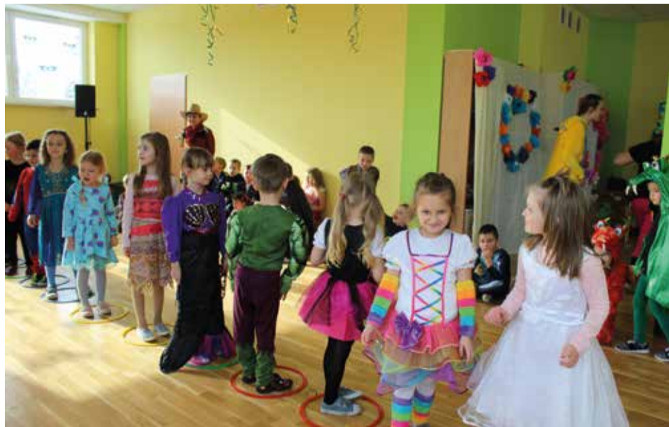
...to przepis na udaną zabawę!

konała pamiątkowe zdjęcia. Po kilku chwilach wypoczynku muzyka znowu porwała wszystkich do tańca. Kiedy czas zabawy dobiegł końca, dzieci z żalem opuszczały salę balową.