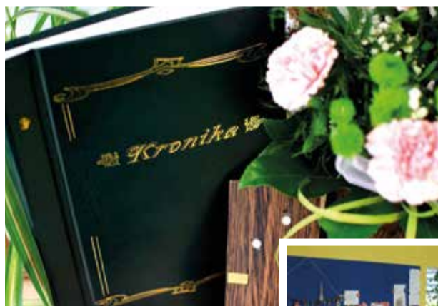
Z okazji pierwszych urodzin powstała rocznicowa kronika