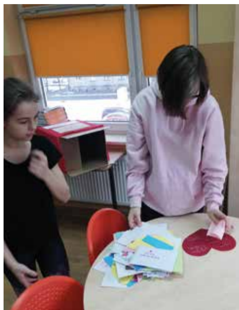
Za sprawą wyjątkowej poczty w całej szkole czuć było tego dnia walentynkową atmosferę

Z racji tego, że w tym roku święto zakonanych wypadło w trakcie ferii zimowych, postanowiliśmy w naszej szkole uczcić ten dzień troszkę wcześniej. 8 lutego Samorząd Uczniowski przekazał kartki walentynkowe z tygodniowej akcji Poczty Walentynkowej uczniom, którzy otrzymali je od osób darzących ich sympatią.