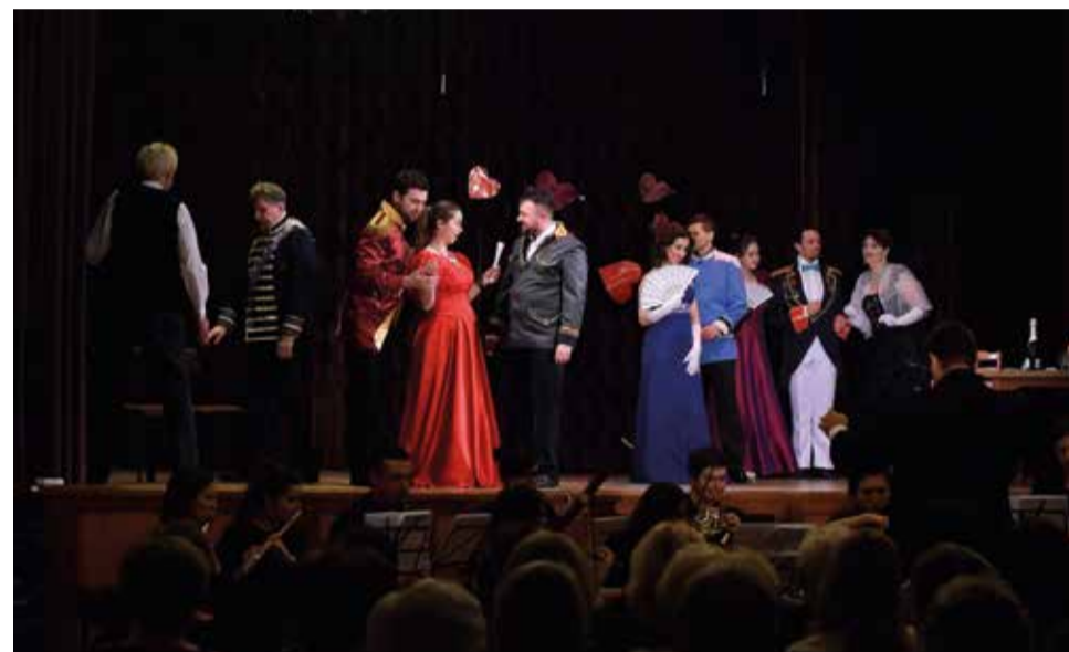
Wielbiciele klasyki również mogą znaleźć w domu kultury coś dla siebie – operetka Wesoła wdówka