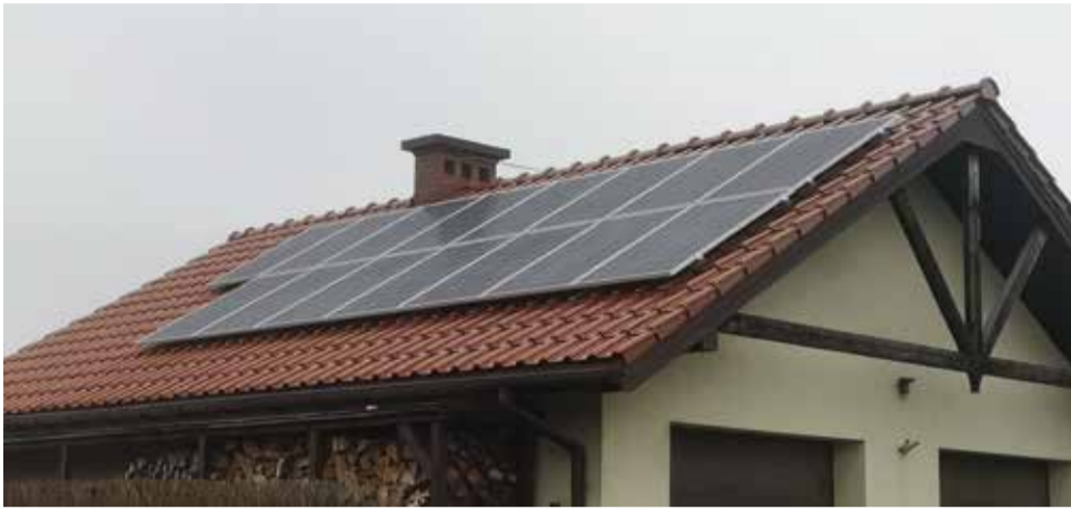
Trwa montaż instalacji fotowoltaicznych w naszej gminie

W styczniu rozpoczął się montaż instalacji fotowoltaicznych oraz solarnych na budynkach jednorodzinnych w Gostyni i w Wyrach, w ramach projektu „Słoneczna Gmina Wiry”.