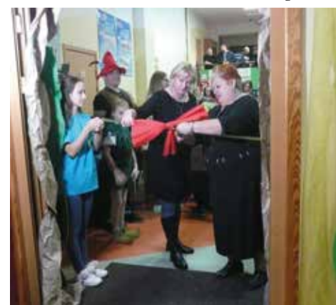
Wydarzenie rozpoczęło przecięcie wstęgi przez Dyrektora SP w Gostyni oraz Wójta Gminy Wiry