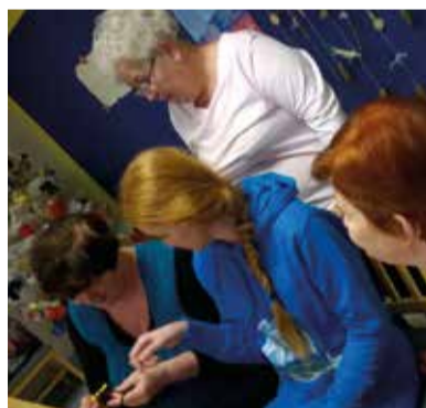
Zajęcia z szydełkowania