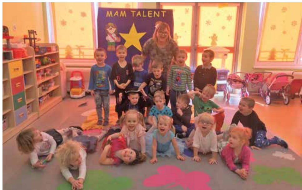
Wyrskie przedszkolaki udowodniły, że mają talent

30 stycznia w grupie Pszczółek w Gminnym Przedszkolu w Wyrach odbył się konkurs „Mam Talent”. Pszczółki tego dnia miały okazję zaprezentować swoje talenty we wszystkich kategoriach – od śpiewu przez taniec, recytację do podbijania piłki czy skakania na jednej nodze. Wszystkie prezentowane umiejętności były na bardzo wysokim