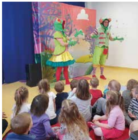
Teatr TAK i ich wesoły spektakl

Kadra Żłobka i Przedszkola „Troskliwi Misi”