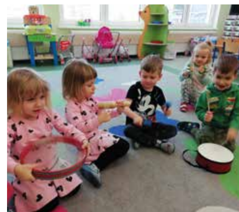
Potrafimy grać na wszystkim

dy kilkuosobowy zespół otrzymał różne instrumenty, a jego zadaniem było odegranie prawdziwego koncertu przed pozostałymi rówieśnikami z grupy. Trzeba dodać, że byli to najmłodszy muzycy, bo dzieci 3- i 4-letnie, które spisały się na medal. W muzycznym tygodniu nie mogło też zabraknąć próby wykonania własnego instrumentu muzycznego, a dokładnie grających talerzy z papierowych talerzyków i odrobiny ryżu. Wtedy każdy czuł się wyjątkowo, bo mógł zademonstrować swój instrument i zrobić nieco hałasu.