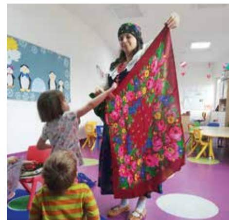
Spotkanie z góralką resujące warsztaty – „Spotkanie z muzyką” oraz „Dziecko widzmem i aktorem”

Warsztaty balonowe pozwoliły odkryć właściwości i ciekawostki związane z tą popularną zabawką. Dzieci dowiedziały się więc, że balony nie tylko latają i głośno pękają, ale także potrafią „śpiewać” i przyklejać się do ściany. Podczas warsztatów kulinarnych w naszym przedszkolu unosił się zapach pizzy wykonanej przez dzieci pod nadzorem nauczycielki. Uczestnictwo w warsztatach eksperymentalnych pozwoliło odkryć (oczywiście tylko pod nadzorem osoby dorosłej), że mieszanie niektórych używanych na co dzień substancji daje bardzo ciekawe efekty. Dużo potrzebnej wiedzy dzieci zdobyły również podczas specjalnie dla nich zorganizowanego szkolenia pierwszej pomocy. Poprzez zabawę i towarzystwo sympatycznego Misia Ratownika przedszkolaki uczyły się niesienia pomocy przedmedycznej osobom poszkodowanym. W ramach Klubu Aktywnego Rodzica odbyły się kolejne inte-