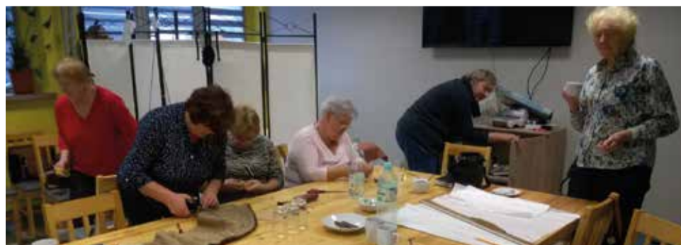
Seniorzy sami uszyli m. in. stroje na jasełka