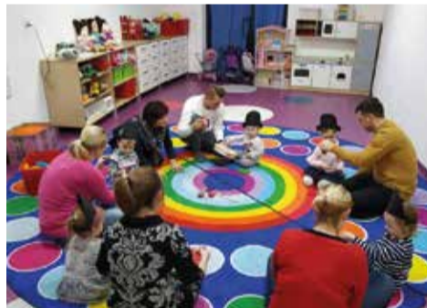
Warsztaty w ramach Klubu Aktywnego Rodzica

Po okresie świątecznym dzieci przedszkolne wraz z nauczycielkami przygotowały się do uroczystości z okazji Dnia Babci i Dziadka. Występ udał się wspaniale, goście byli wzruszeni i nagradzali gromkimi brawami swoje kochane wnuki, które pięknie prezentowały przygotowany program artystyczny. Przed feriami zimowymi zawitał do nas teatr TAK z przeżabnym spektaklem, który do łez roześmiał dzieci przedszkolne i żłobkowe.