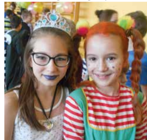
Młodzież chętnie pozowała do zdjęć, pokazując swoje wyjątkowe przebrania

również można było spotkać znane postaci ze świata filmu, jak np. Minionki, Smurfy, Lorda Vadera, piratów, policjantów, zna-