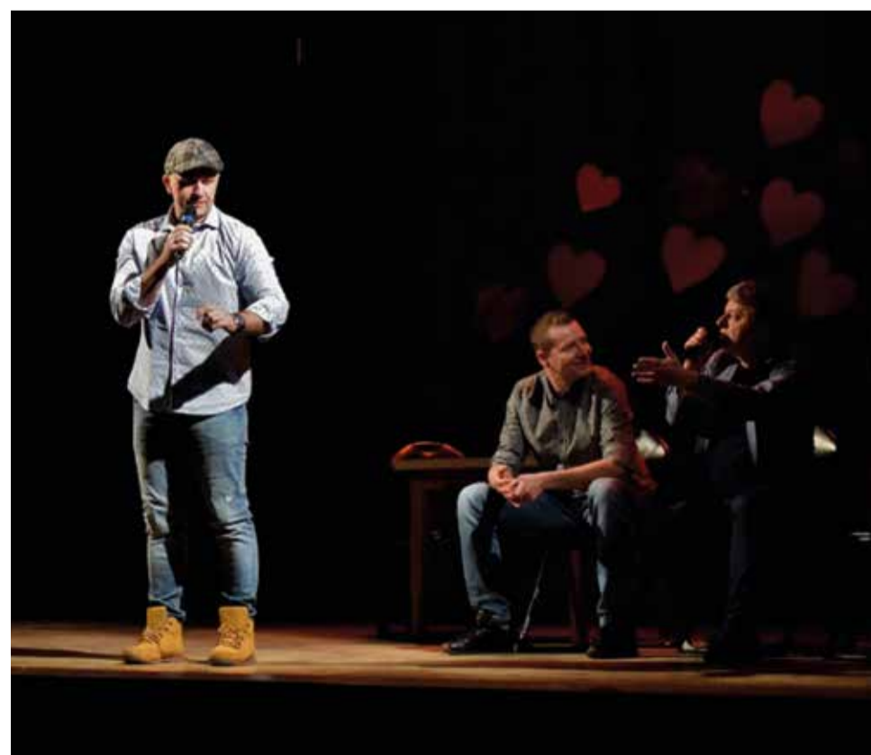
Znani radiowcy chwilami rozśmieszali widownię do łez!