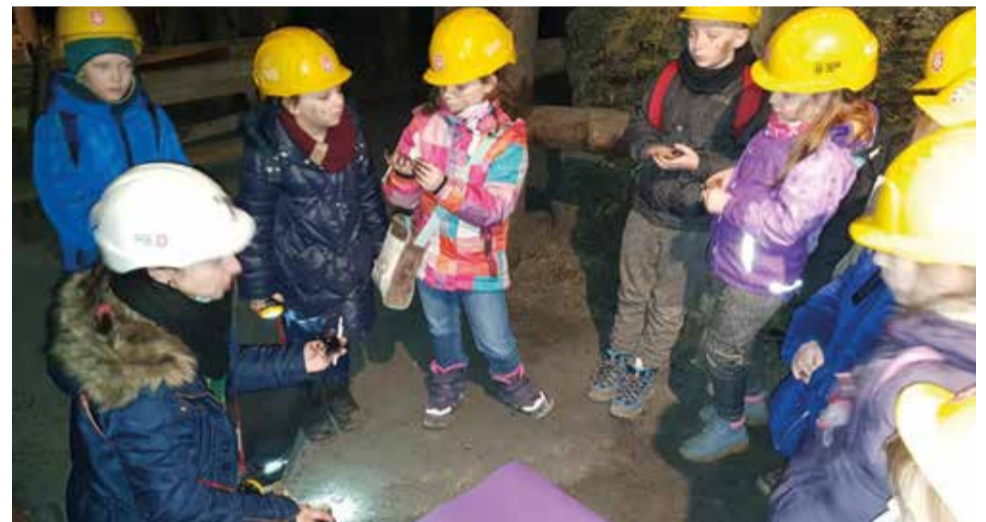
Uczestnicy wycieczki mieli okazję spróbować prawdziwej kleksografii!