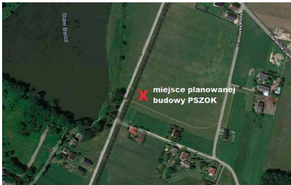
Lokalizacja planowanego PSZOK-u