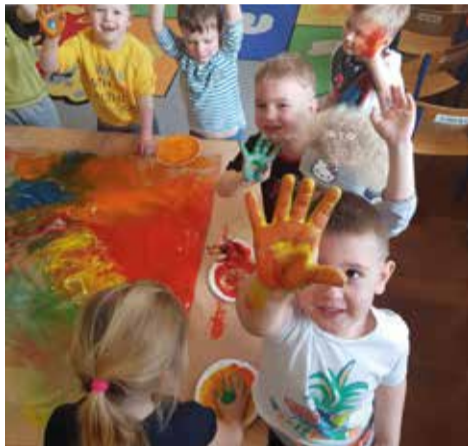
Zabawa w brudzenie, czyli to co dzieci lubią najbardziej!