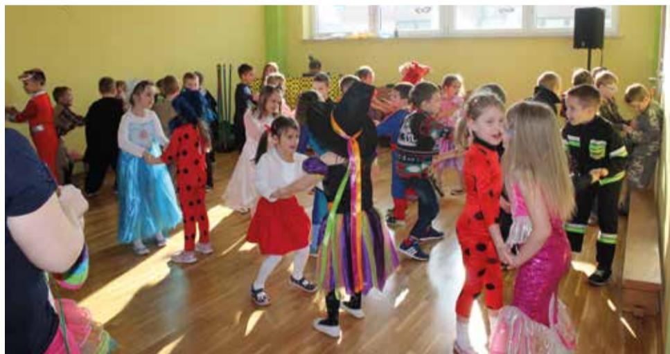
Wesołe przebrania, skoczna muzyka...

muzyki. Z wielką radością uczestniczyli również w zabawach i konkursach, w których zwycięzcy byli nagradzani balonami. W czasie przerwy przedszkolacy udali się na słodki poczęstunek, a pani fotograf wy-