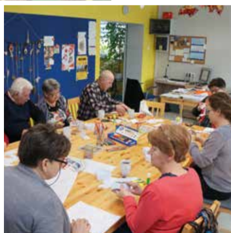
Zajęcia z instruktorem domu kultury