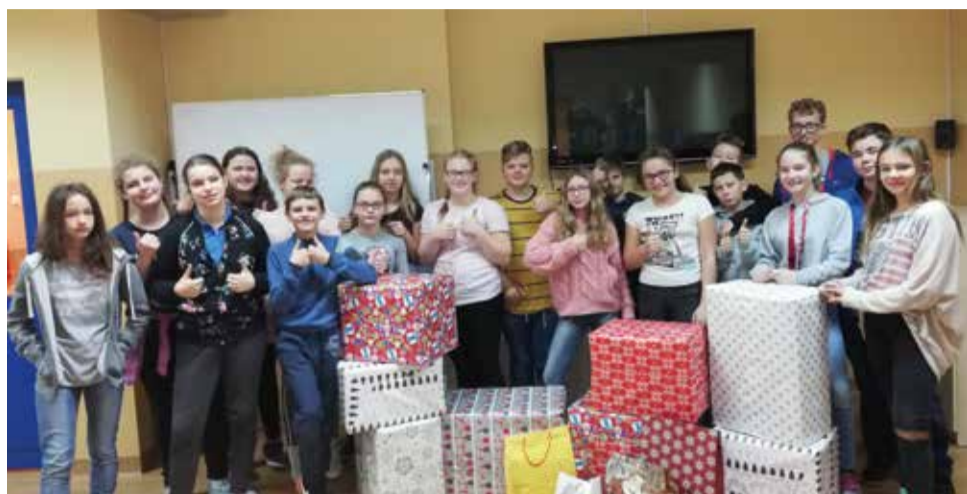
Uczniowie wyrskiej szkoły podstawowej z zaangażowaniem przygotowali Szlachetną Paczkę

Uczniowie Szkoły Podstawowej w Wyrach w pierwszym półroczu roku szkolnego 2018/2019 osiągnęli wysokie wyniki w nauce. Aż 48 uczniów spełnia kryteria do otrzymania stypendium za wysokie wyniki w nauce (31 uczniów z klas IV – VI SP i 17 z klas VII – VIII i gimnazjum). 125 uczniów ukończyło I półrocze z średnią ocen powyżej 4,75