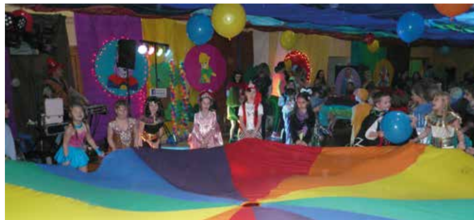
Nie mogło zabraknąć wspólnej zabawy z popularną Klanz!ą!