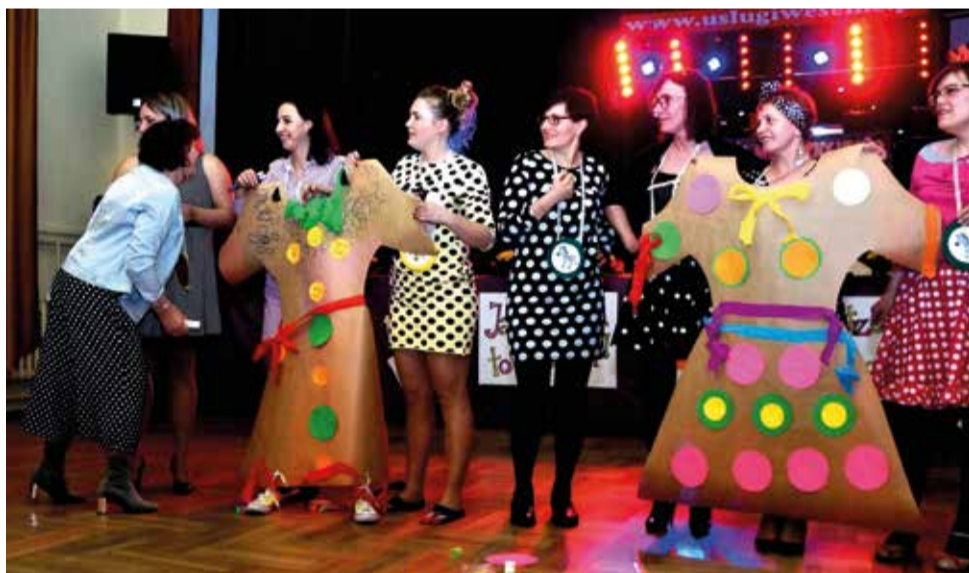
...ale również wiele zabaw, konkurencji i zadań do wykonania