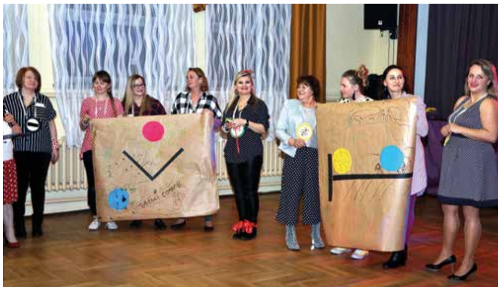
Każdy Comber to nie tylko tańce i swawole...