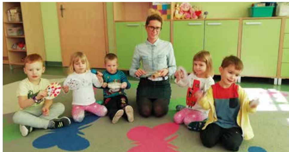
Podczas zajęć muzycznych największą radością sprawiła możliwość wykonania własnych instrumentów

dy kilkuosobowy zespół otrzymał różne instrumenty, a jego zadaniem było odegranie prawdziwego koncertu przed pozostałymi rówieśnikami z grupy. Trzeba dodać, że byli to najmłodszy muzycy, bo dzieci 3- i 4-letnie, które spisały się na medal. W muzycznym tygodniu nie mogło też zabraknąć próby wykonania własnego instrumentu muzycznego, a dokładnie grających talerzy z papierowych talerzyków i odrobiny ryżu. Wtedy każdy czuł się wyjątkowo, bo mógł zademonstrować swój instrument i zrobić nieco hałasu.