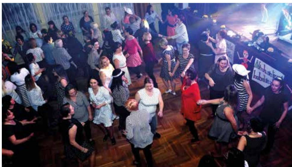
Na tegorocznym Babskim Combrze zorganizowanym przez Klub Kobiet Aktywnych bawiło się aż 150 pań!