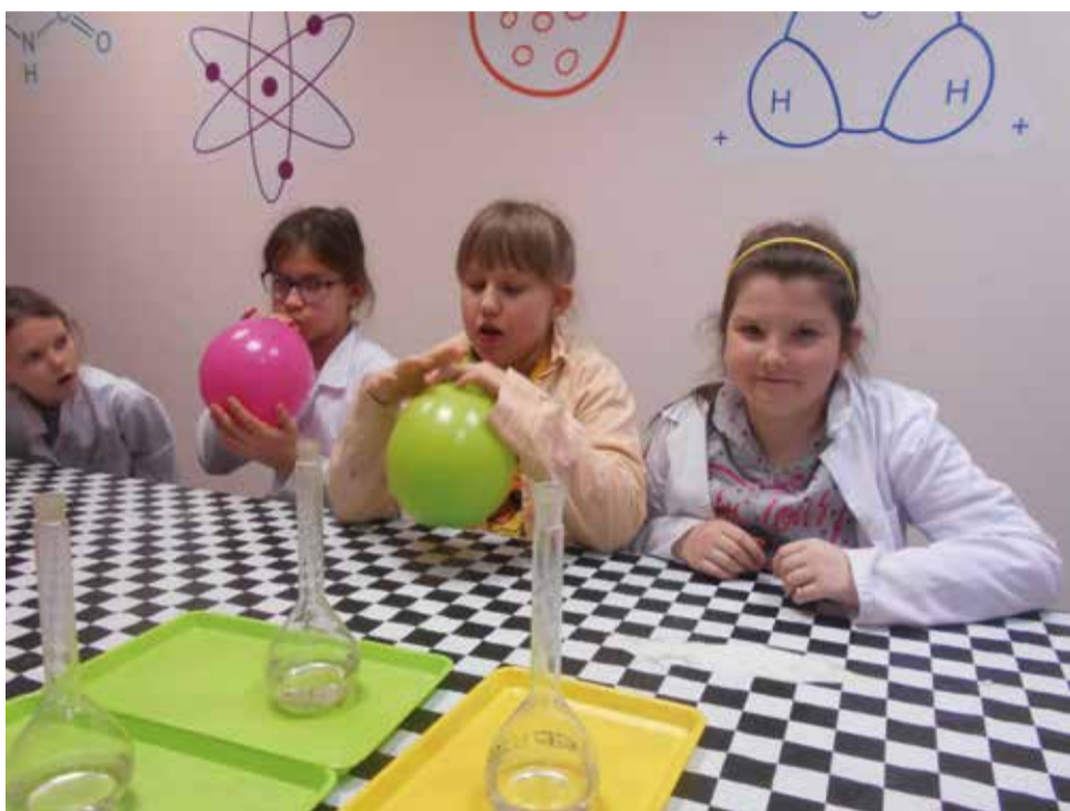
W trakcie zajęć w chorzowskim Uniwersytecie Rozwoju dzieci wzięły udział w warsztatach kulinarnych, plastycznych oraz eksperymentów