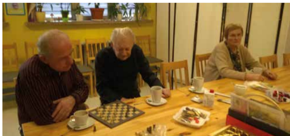
Kiedy akurat nie ma zajęć, można rozegrać partyjkę w szachy