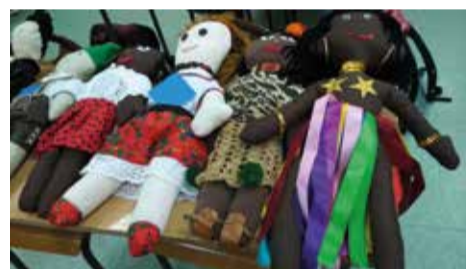
Ze sprzedaży lalek udało się zebrać aż 350 zł, co pozwoliło na zakup 35 szczepionek