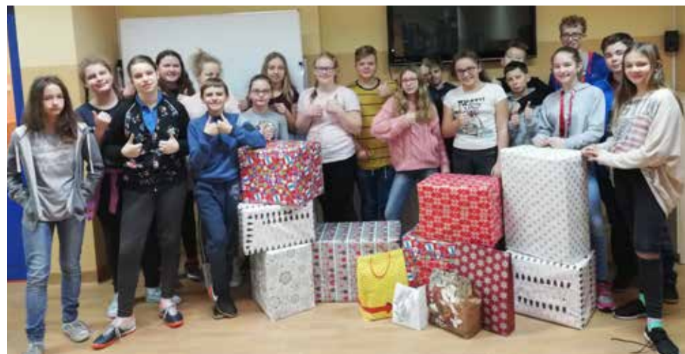
Zbiórka darów w ramach Szlachetnej paczki zorganizowana została w wielu miejscach naszej gminy, m.in. w wyrskiej Szkole Podstawowej