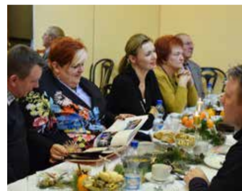
W ramach projektu stworzona została kronika dokumentująca go

panie m.in. wyremontowały minisiłownię w Domu Kultury. Oby więcej takich inicjatyw w przyszłości!