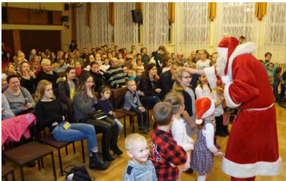
Mikołaj z workiem pełnym prezentów odwiedził także Dom Kultury!