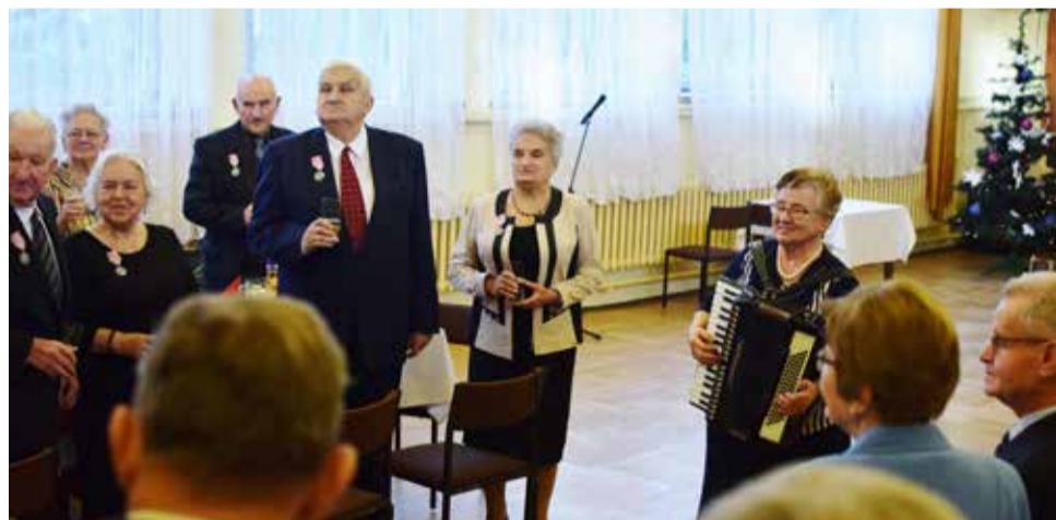
...pocałunków, schodów, książek. Twe oczy, jak piękne świece, a w sercu źródło promienia...