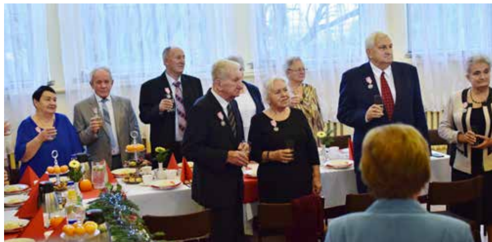
...więc ja chciałbym twoje serce, ocalić od zapomnienia.