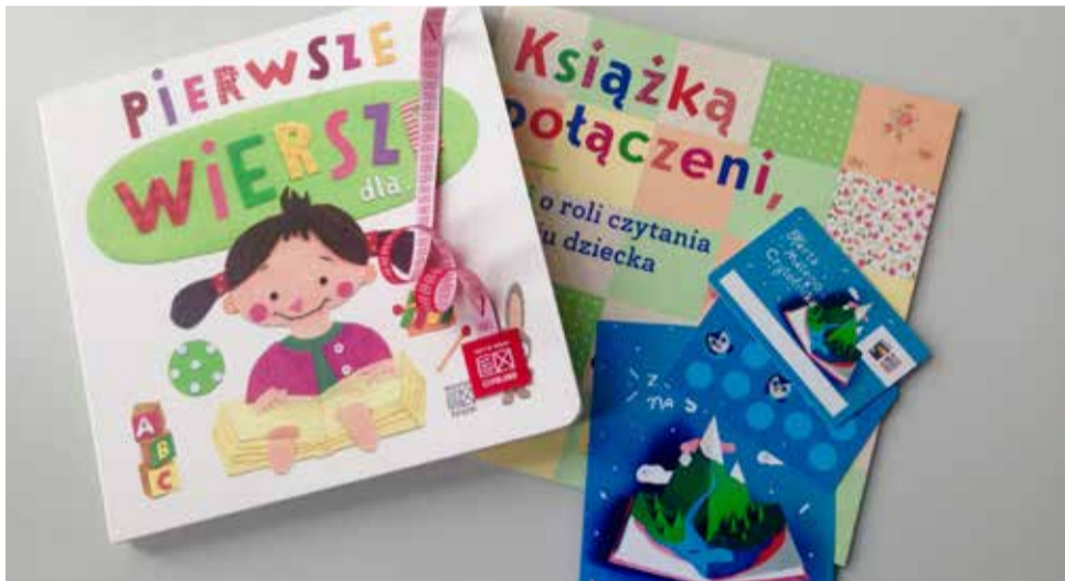
W nowym roku projekt będzie kontynuowany i skierowany dla trzylatków z rocznika 2016