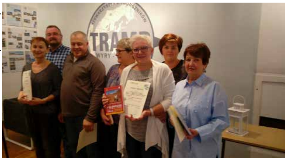
Zwycięzcy konkursu fotograficznego „Pamiętka z podróży”