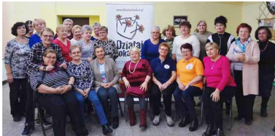
Członkinie Klubu Kobiet Aktywnych z Wyr

W czwartek, 13 grudnia, w Domu Kultury w Gostyni odbyło się spotkanie podsumowujące projekt Klubu Kobiet Aktywnych z Wyr – „Ja sobie radę dam, czyli Zosia Samosia”, dofinansowanego ze środków programu „Działaj Lokalnie”