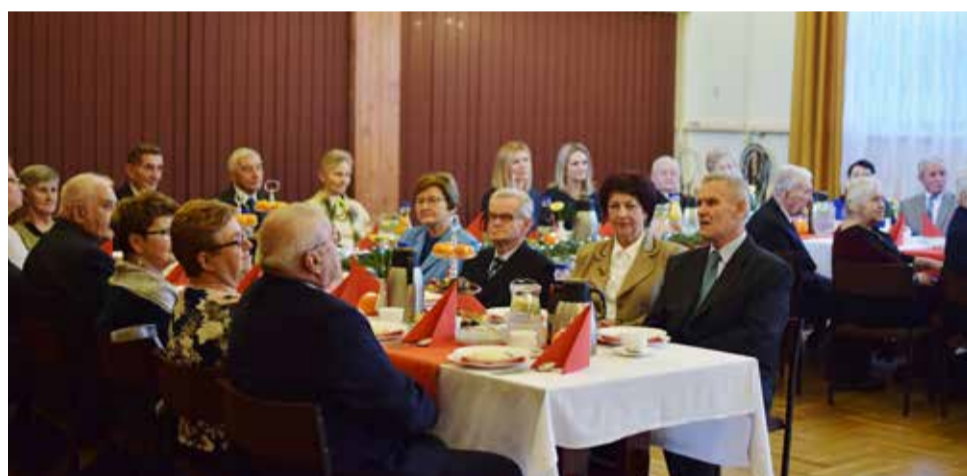
...ile w trudzie nieustannym, wspólnych zmartwień, wspólnych dążeń, ile chlebów rozkrajanych...