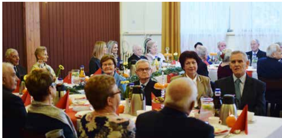
...ile razem dróg przebytych? Ile ścieżek przedeptanych? Ile deszczów, ile śniegów wiszących nad latarniami...