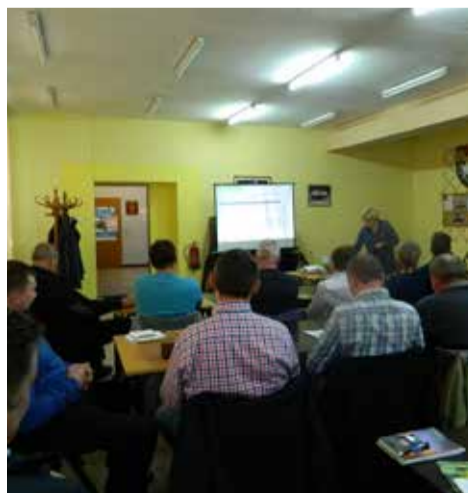
W szkoleniu wzięło udział około 30 mieszkańców naszej gminy