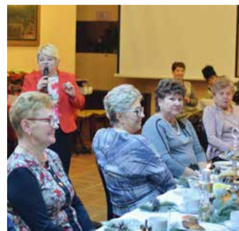
Drobny remont czy usterka w domu dla członkiń klubu to już nie problem!

Klub Kobiet Aktywnych działający przy gostyńskim Domu Kultury realizował wspomniany projekt od 16 sierpnia do 13 grudnia. Spotkania odbywały się w pięciu blokach tematycznych: „Kobieta w plenerze”, „Aktywna samodzielna”, „Jak kręcić, żeby nie przekręcić”, „Zrób to sama” oraz „Po pierwsze karp”.