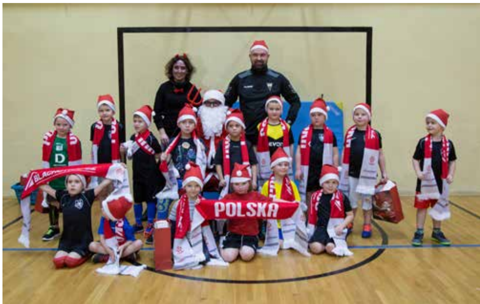
Mikołaj w gostyńskich Rakach