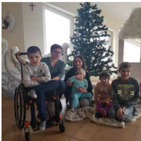
Świąteczne zbiórki w naszej gminie wsparty m. in. Dom Kulejących Aniołów w Piasku oraz podopiecznych OREW-u w Wyrach

Dla przedszkola przy ul. Puszkina, coroczną już tradycją stało się wspieranie w okresie Świąt Bożego Narodzenia podopiecznych Domu Kulejących Aniołów w Piasku. W tym roku zbiórka odbywała się od 27 listopada do 19 grudnia. Wzięło w niej udział mnóstwo przedszkolaków i ich rodziców o wielkich sercach, otwartych na potrzeby innych ludzi. Dzięki temu, udało nam się zebrać wiele niezbędnych produktów – środki czystości, odzież dla najmłodszych, a także to, co najbardziej cieszy dzieciaki, czyli zabawki, książeczki oraz słodycze.