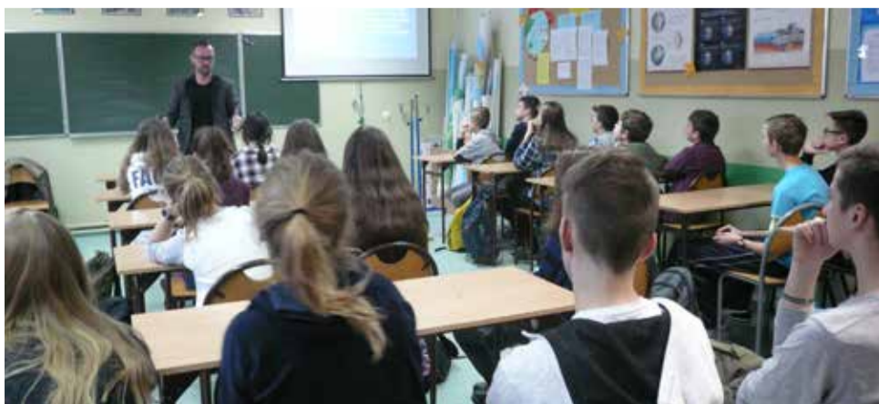
Hasłem przewodnim warsztatów w Gostyni były internetowe oraz narkotykowe dylematy