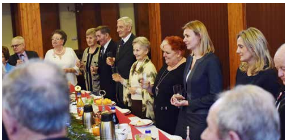
...ile listów, ile rozstań, ciężkich godzin w miastach wielu i znów upór, żeby powstać i znów iść i dojść do celu...