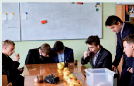
Gimnazjaliści z Zespołu Szkół w Gostyni

Wszelkiego rodzaju testy i sprawdziany kojarzą się z napiętym oczekiwaniem i wszechobecnym stresem. Odwiedzając placówki naszej Gminy, nie odczułam jednak żadnych z wymienionych symptomów. W szkołach panowała luźna, wesoła atmosfera, a na twarzach uczniów gościł uśmiech.