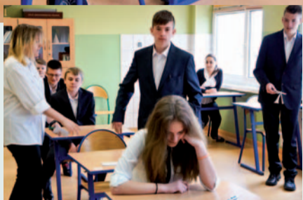
Gimnazjaliści z Zespołu Szkół w Wyrach

W terminie od 18 do 20 kwietnia gimnazjaliści podeszli do egzaminu, który miał sprawdzić dotychczas zdobytą przez nich wiedzę. Tradycyjnie został on podzielony na trzy części: humanistyczną, matematyczno-przyrodniczą i z języka obcego nowożytnego.