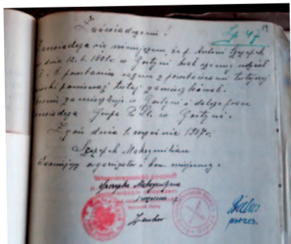
Pieczęć – Zw. Powst. Śl. GOSTYŃ

Podlegała ona Powiatowej Komisji Weryfikacyjnej w Pszczynie.