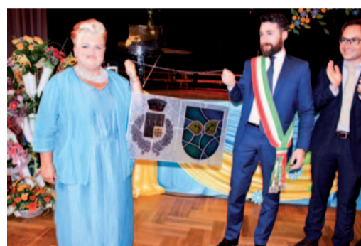
Goście z Medesano

17.06.2016 r. Dzień sportu w Zespołach Szkół w Gostyni i Wyrach