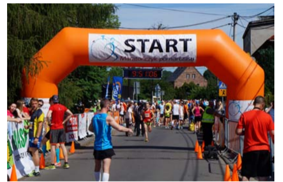
25.06.2016 r. Plener Piracki