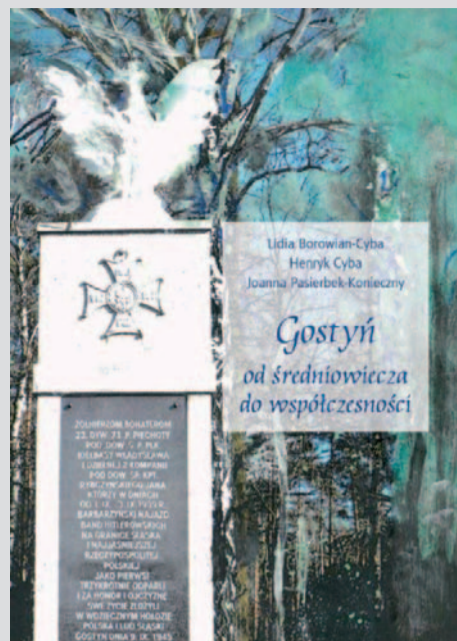
Monografia Gostyń od średniowiecza do współczesności