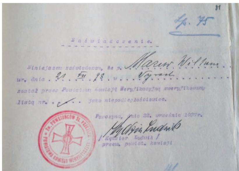
Pieczęć – Powiat. Komisja w Pszczynie

Podlegała ona Powiatowej Komisji Weryfikacyjnej w Pszczynie.