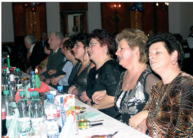
fol. H. Jegła