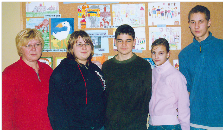
Samorząd szkolny w niepełnym składzie.

12 stycznia młodzież z Zespołu Szkół w Wyrach zorganizowała dyskotekę z której cały dochód przekazała na pomoc ofiarom tsunami w Azji.