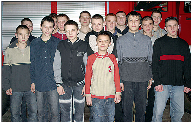
Młodzieżowa Drużyna Pożarnicza...