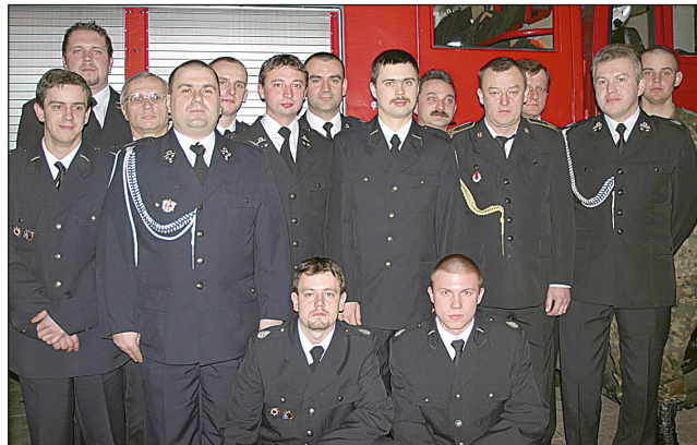
...i ich starsi koledzy strażacy.