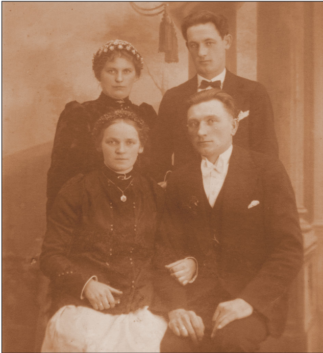
13 luty 1933 rok ślub J. i M.