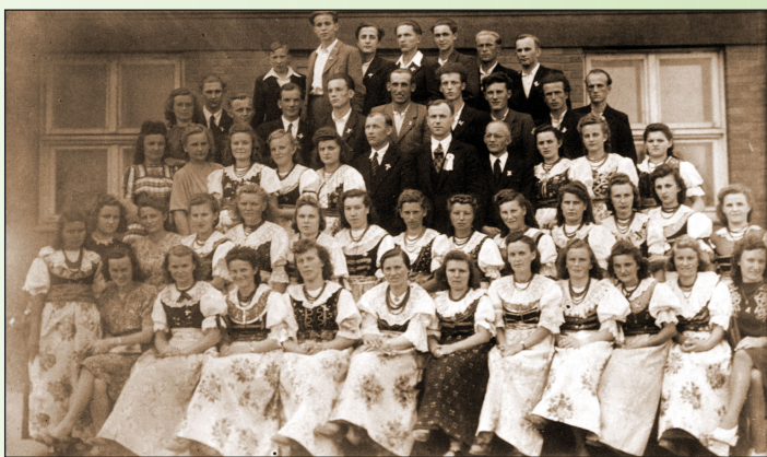
Chór Zorza z 1946 r.