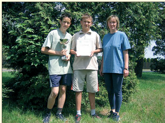
Gimnazjaliści z Gostyni byli najliczniejsi.

Na zakończenie imprezy naszą grupę spotkała miła niespodzianka w postaci nagrody dla najliczniejszej drużyny. Był to dyplom i piękny puchar. Pogoda w tym dniu dopisała, było słonecznie, trasa przyjemna, „kolekcjonerzy pieczętek” zadowoleni, a najważniejsze, że wszyscy szczęśliwie wrócili do