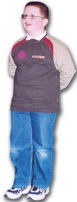
Zdjęcia na stronie przedstawiają uczestników gminnego konkursu recytatorskiego.