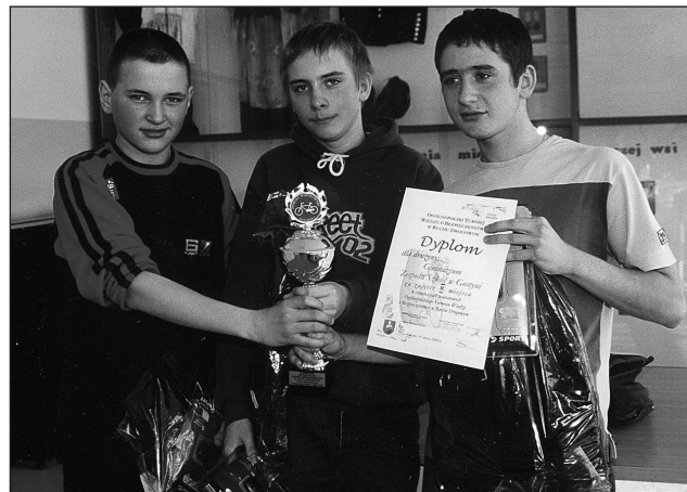
Gimnazjaliści z Gostyni