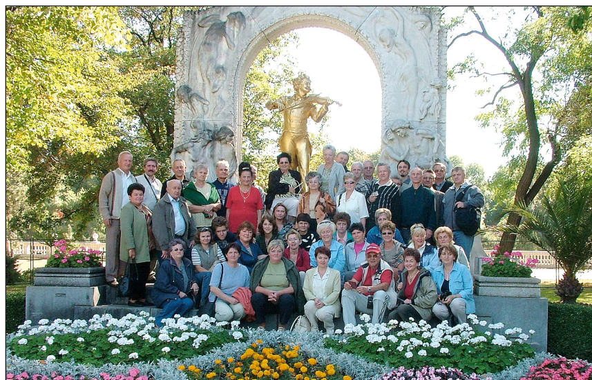
U stóp wielkiego Straussa.

Wszystkich miłośników śpiewu chóralnego serdecznie zapraszamy na próby chóru „Zorza” w każdy czwartek od godz. 18 do 20 do pawilonu w Wyrach.