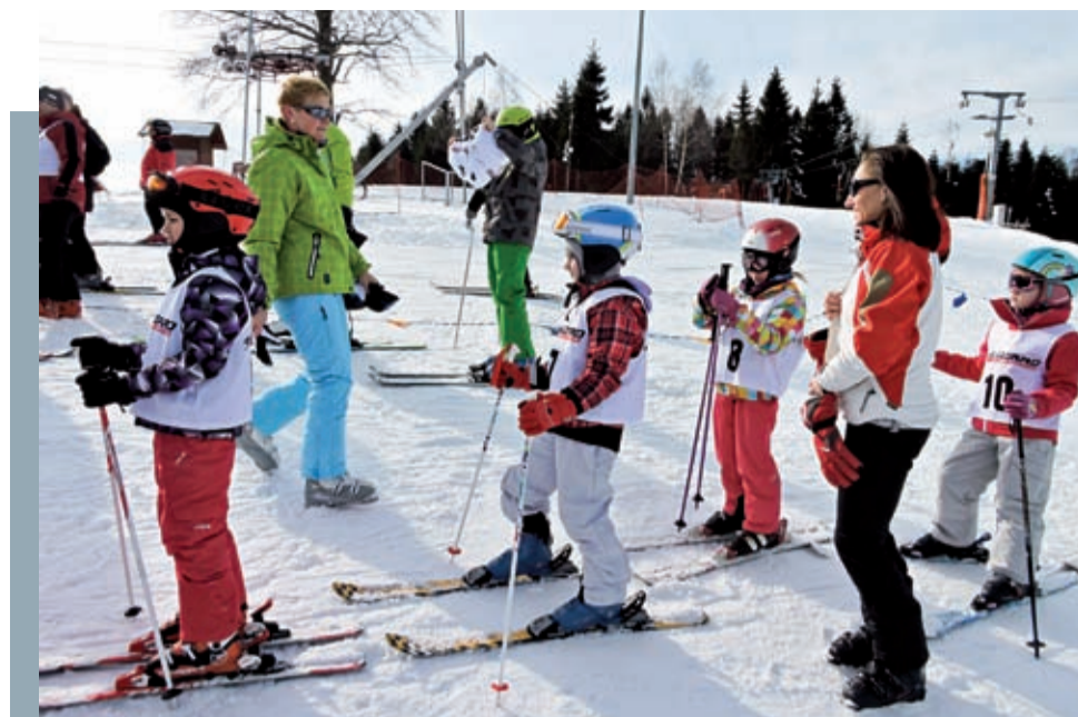
gminne mistrzostwa narciarskie w lutym 2015 w Brennej

Kiedy poczujesz już, że jesteś silniejszy, że twoje serce nie galopuje w zawrotnym tempie, kiedy idziesz szybkim marszem, spróbuj skoncentrować się na trenowaniu poszczególnych partii mięśni, które najbardziej pracują podczas narciarskich zjazdów. Oto które partie Twojego ciała dostaną podczas narciarskich szaleństw