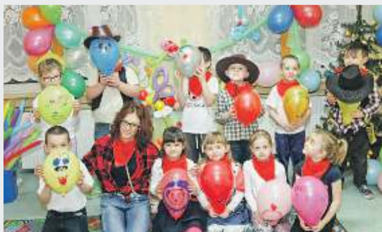
Pomysłów na przyozdobienie baloników nikomu nie brakowało