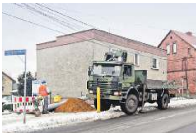
Firma Tauron sukcesywnie prowadzi wymianę sieci energetycznej

Następnie przewodniczący komisji stałych Rady Gminy Wyry odczytali sprawozdania z prac w okresie międzysesyjnych.