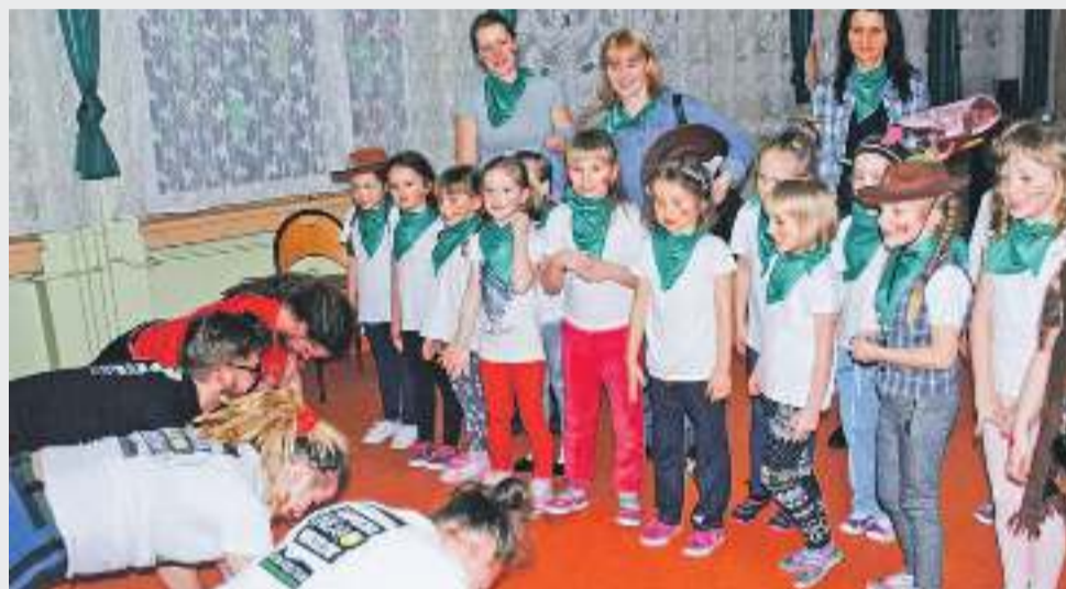
Zespół Capoeira Unicar tym razem przegrał zakład z dziećmi – karą był pompki