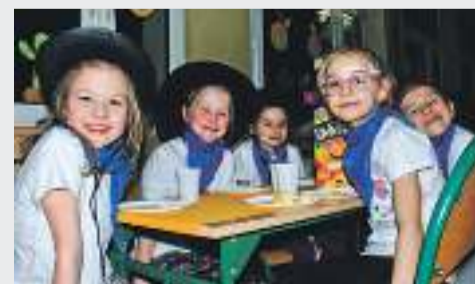
Humory wszystkim dopisywały