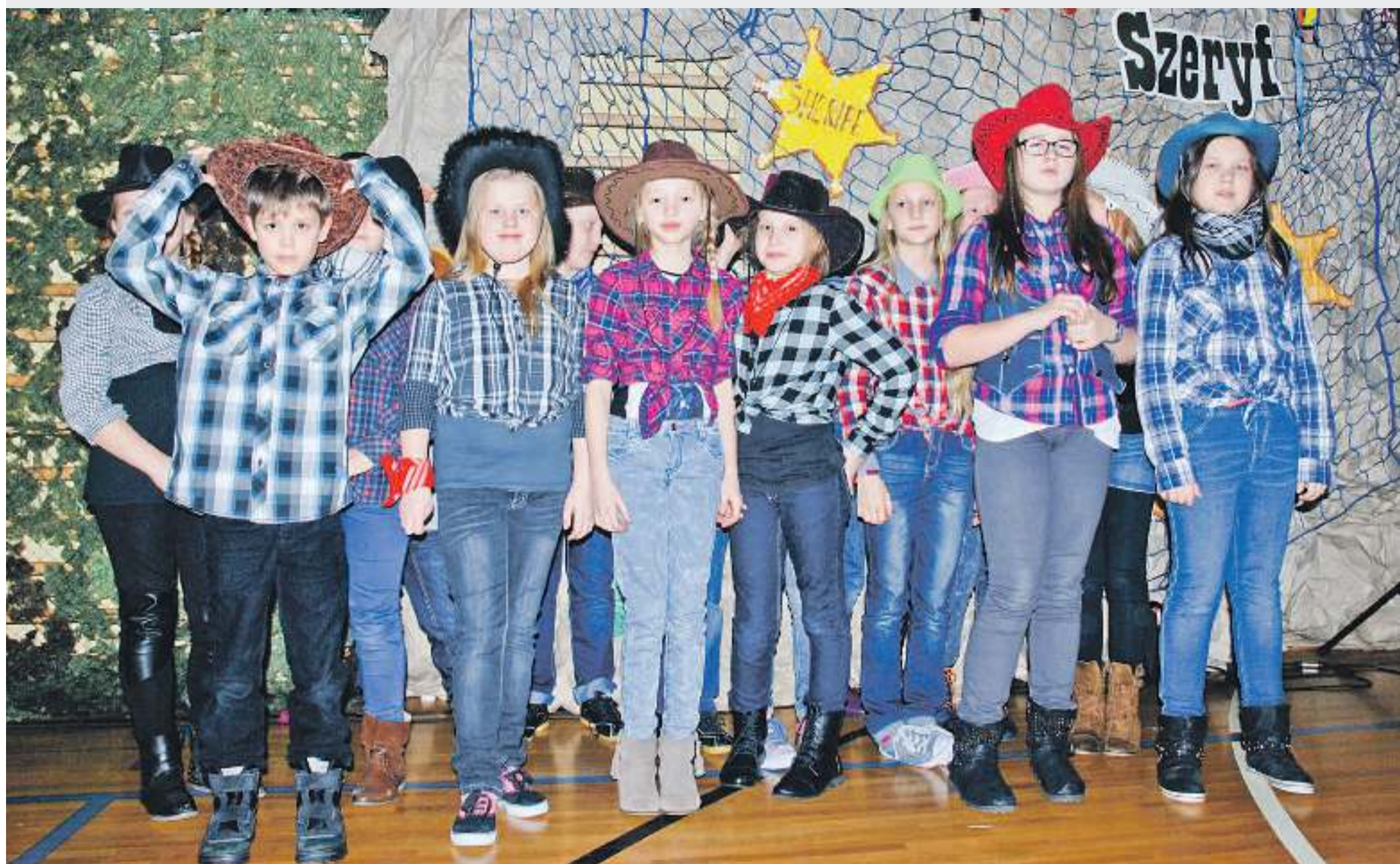
Szkolny zespół wokalny