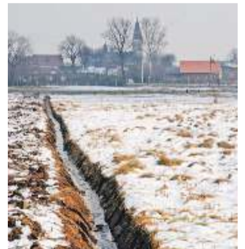
Rowy melioracyjne służą do odwadniania meliorowanego terenu

Zarząd Spółki Wodnej dziękuje wszystkim właścicielom nieruchomości, którzy dokonali wpłat na rzecz Spółki. Prosimy również o wpłaty w 2015 roku. Dzięki pozyskanym środkom Spółka będzie przeprowadzać dalsze prace konserwacyjne. Przypominamy, że Zarząd Spółki swoje prace wykonuje społecznie.