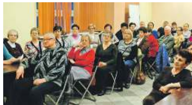
Otwarte prelekcje odbyły się w ramach zajęć Powiatowego Uniwersytetu Trzeciego Wieku

– Każdy z nas może być uczestnikiem wypadku, może być ofiarą przestępstwa. To o czym codziennie czytamy i słuchamy za pośrednictwem środków masowego przekazu, to nie są