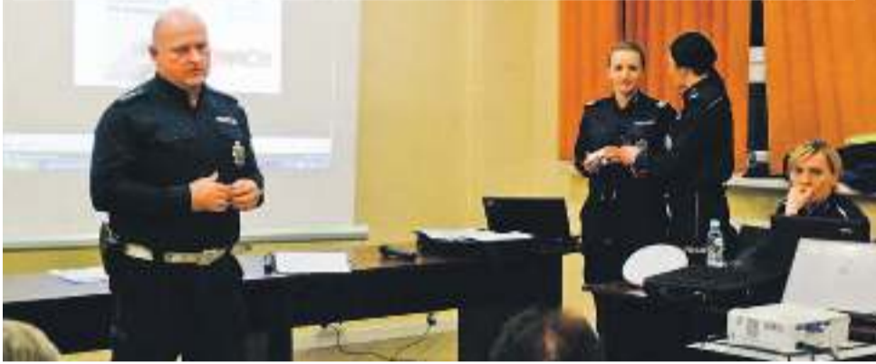
Spotkanie poprowadzili funkcjonariusze Komendy Powiatowej Policji w Mikołowie