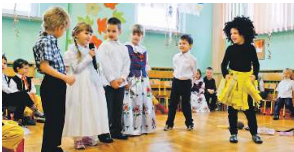
Dzieci z Przedszkola w Gostyni zaprezentowały śląską wersję „Murzynka Bambo”

Na zakończenie, w obu gminnych przedszkolach, dzieci wręczyły babciom i dziadkom drobne upominki, które z pewnością będą im przypominać ten wspólnie spędzony czas.