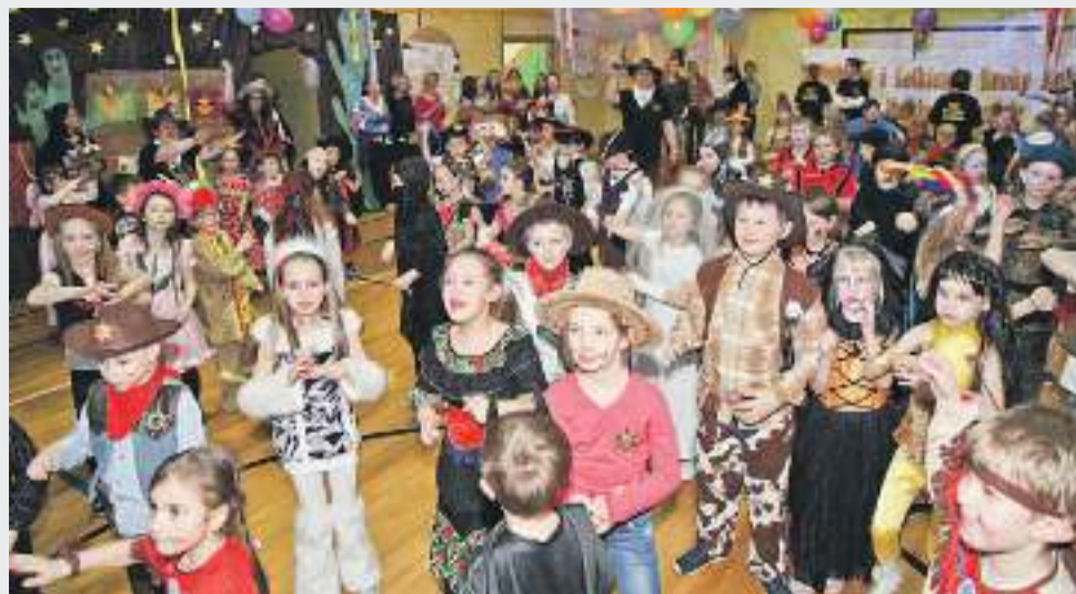
Bal karnawałowy – tu nikt nie podpierał ścian

W imprezie wzięło udział 146 dzieci z klas I – III szkoły podstawowej oraz oddziału przedszkolnego w Gostyni. Dla wszystkich był to wspaniały początek ferii, o którym z pewnością będą jeszcze długo pamiętać.