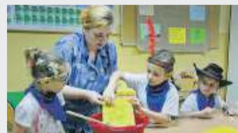
W ramach zajęć dzieci przygotowały owocową sałatkę