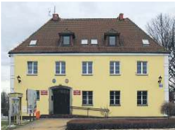
Urząd Gminy Wyry ul. Dąbrowszczaków 133 43-175 Wyry tel. (32) 325 68 00 fax. (32) 325 68 09 e-mail: urzad@wyry.pl