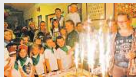
Wielki tort z fontanną fajerwerków to już tradycja