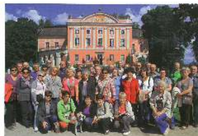
Chłonowiec ul. „Zorza” wraz z sympatykami

• w Lublinie w Kaplicy Zamkowej - Jedyną z najcenniejszych zabytków w Polsce (kaplica pokryta jest murem bizantyjskim i freskami z 1418. powstały tu na zamówienie Władysława Jagiełły - posiada fantastyczną akustykę - co dla śpiewających i słuchaczy jest niezwykle ważnym elementem) oraz w Kościele pw. św. Jakuba