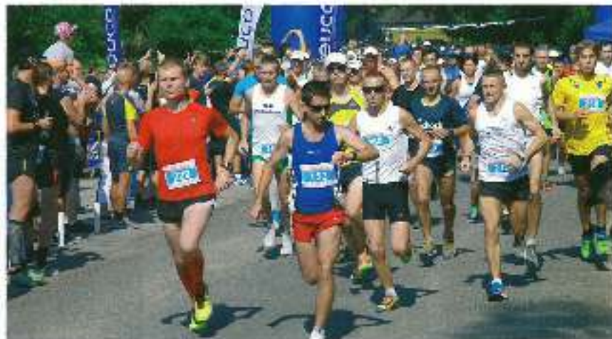
Bieg 5-10-15 kilometrów – Kas Run.