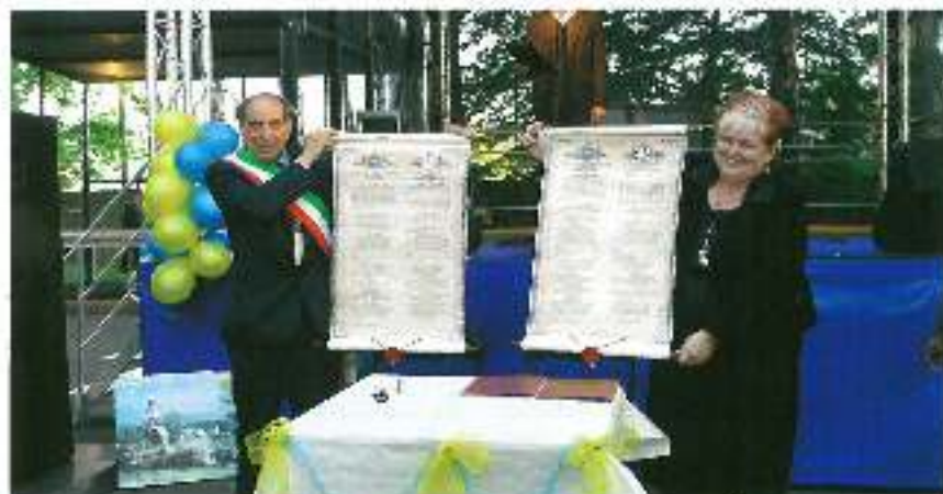
Podpisanie umowy z włoską Gminą Medesano.