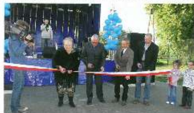
Grupa przecina wstęgę.