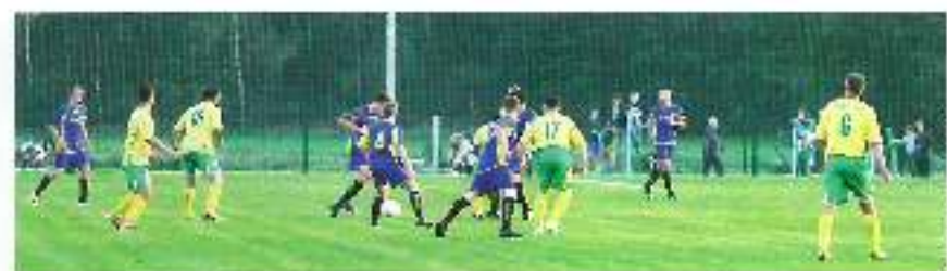
Mecz Fortuna Wyry – ZET Tychy 2:2

Trzy remisy i dwie porażki, to dorobek seniorów we wrześniowych meczach ligowych. Tak słabych wyników Fortuna nie notowała już dawno. Po świetnym zeszłym sezonie wydawało się, że seniorzy pójdą za ciosem i również w tym będą walczyć o awans. Niestety po 9 kolejkach Fortuna utknęła w środku tabeli i już niezwykle ciężko będzie dogonić czołówkę.