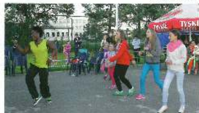
Mecz piłki nożnej.