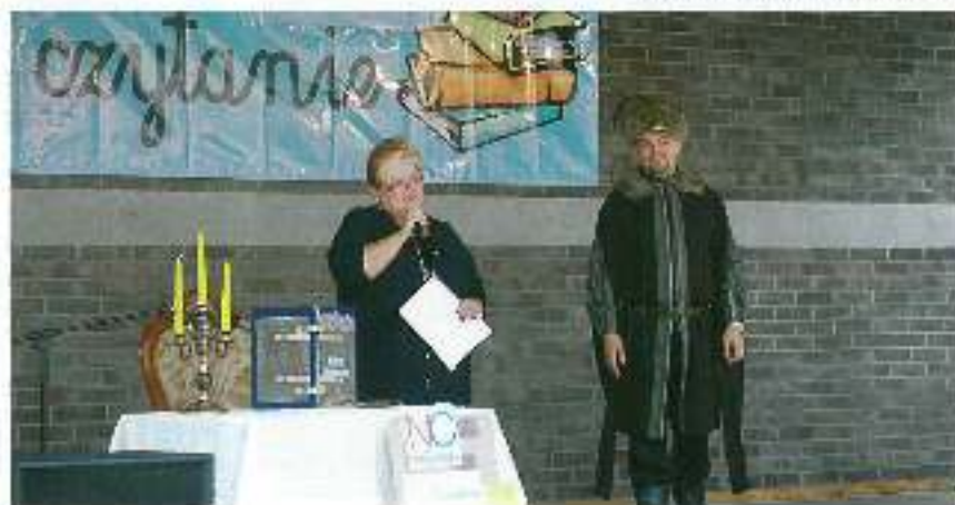
Na podium czytania.