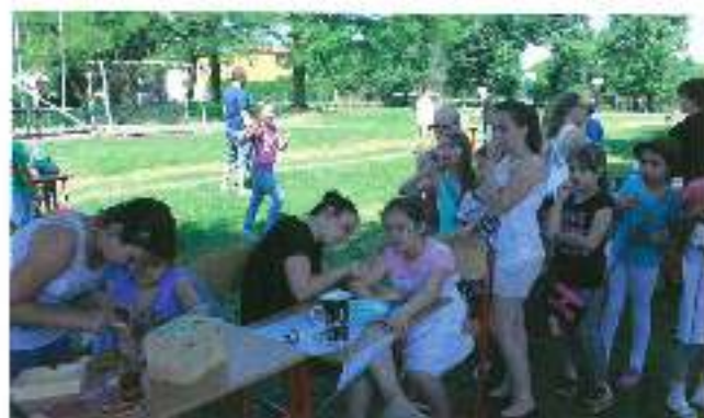
Planek wycieczki odbył się 7 czerwca w Zespole Szkół w Wyrach. Uczestnicy zdołali złożyć dla domki, który z pomocą rodziców i lokalnych przedsiębiorców