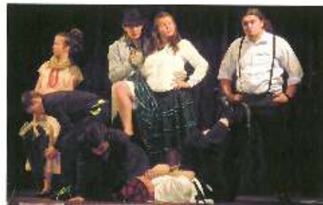
Zespół Bengaku z Czarna (Grand Prix)

12 marca pod honorowym patronatem Starosty Mińskiego odbyły się VI Konkursy „GOSTYŃSKIE TEATRALKI”. Tegoroczna edycja przeglądu teatralnego zgromadziła externalnie zespoły województwa śląskiego w różnych kategoriach wiekowych. Jury, podkreślając wysoki poziom artystyczny uczestników, nagrodziło następujące zespoły: Bengaku z Czarna (Grand Prix), Teatr Baj z Rybnika, Bajkowy Teatr i Koło Teatralne z Gliwic, Bez Nazwy z Mikołowa, teatr WW i Arabesca z Tychów oraz Krotoczwila z Sosnowca.